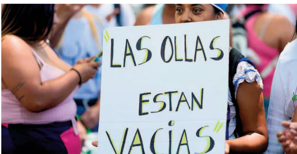
El reclamo de alimentos vuelve a la calle.

Desde el Ministerio de Seguridad de la Nación a cargo de Patricia Bullrich alertaron que, como