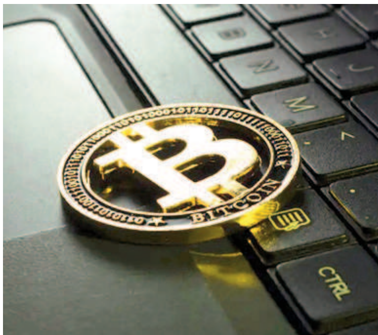
El circuito prometía una rentabilidad en dólares y la posibilidad de que en 45 días se recuperaba la inversión inicial.

El circuito prometía una rentabilidad en dólares y la posibilidad de que en 45 días se recuperaba la inversión inicial y después las personas que habían puesto el dinero comenzaban a acceder a las ganancias. Con cualquier billetera virtual se pasaba los pesos en USDT (la tercera criptomoneda más valiosa del