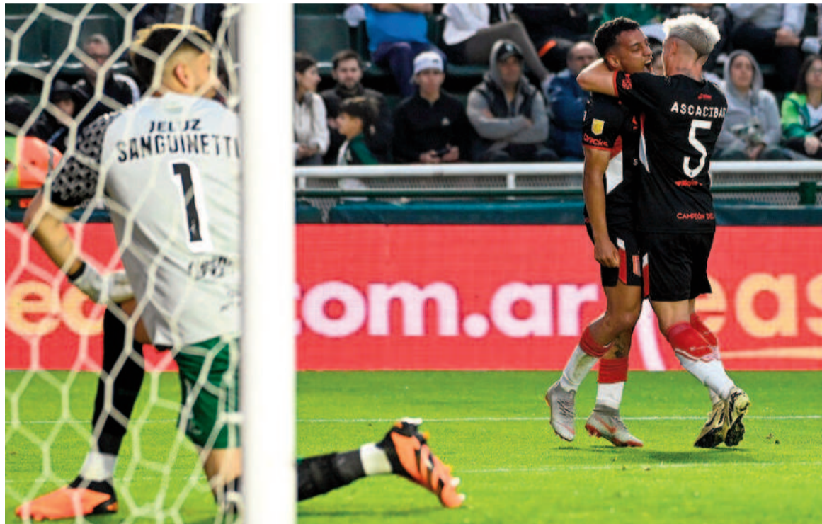
El Pincha ganó en el Florencio Sola.