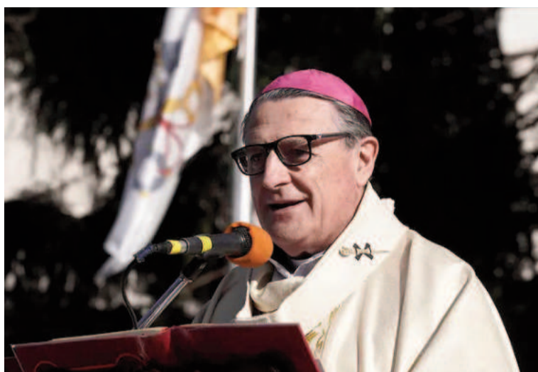
El arzobispo de Rosario advirtió que la ayuda social "no alcanza".

"Esperamos, pero han aumentado intensamente los pedidos que tenemos de ayuda. Contamos con 124 puntos en Cáritas parroquiales en los cuales siempre, si bien se distribuye el bolsón que brinda la provincia y algo que da Nación, de-