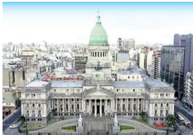
El Congreso sesionará mañana para tratar el veto de Milei.