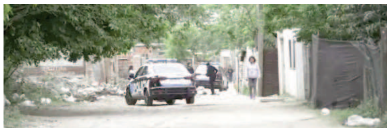
En Pasaje 1847 al 6300, barrio Toba, sucedió el hecho.

El pasaje 1847 al 6300 es una calle que, además de angosta, está pegada