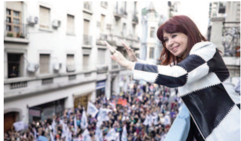
Cristina Kirchner se postuló para presidir el PJ nacional.

«Quiero agradecer a todos los compañeros y compañeras las muestras de cariño y los mensajes de apoyo para ser la presidenta de nuestro partido. Nunca he ocupado un lugar sin tener la certeza de estar capacitada para la tarea encomendada; sin miedo ni presiones», dijo en el epílogo de su carta.