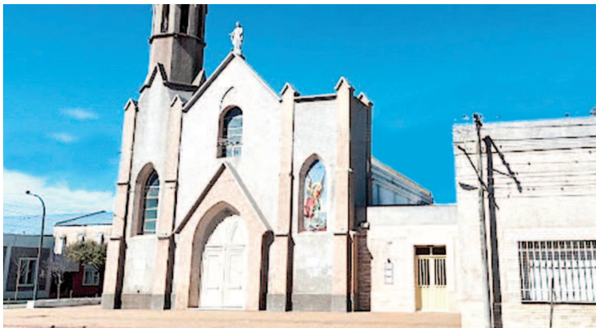
El sacerdote asaltado está a cargo de la iglesia de Máximo Paz.