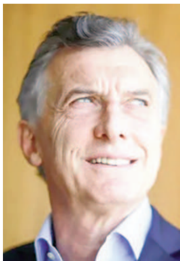
Con críticas, el expresidente sigue apoyando al actual mandatario.

"Hoy nos toca desde el Congreso definir nuestra posición en relación al veto del presidente Milei sobre la ley de Financiamiento Universitario. Nuestro bloque ya votó mayoritariamente en la Cámara de Diputados hace pocas semanas, rechazando esa ley. Seguimos pensando lo mis-