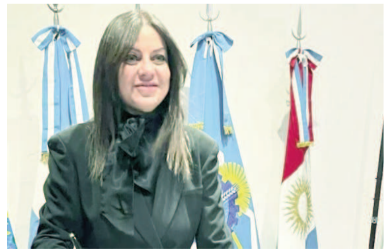
Sandra Pettovello le pidió la renuncia a una funcionaria de su cartera.