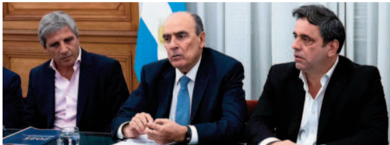
El ministro de Economía, Luis Caputo; el jefe de Gabinete, Guillermo Francos, y el secretario del Interior, Catalán.