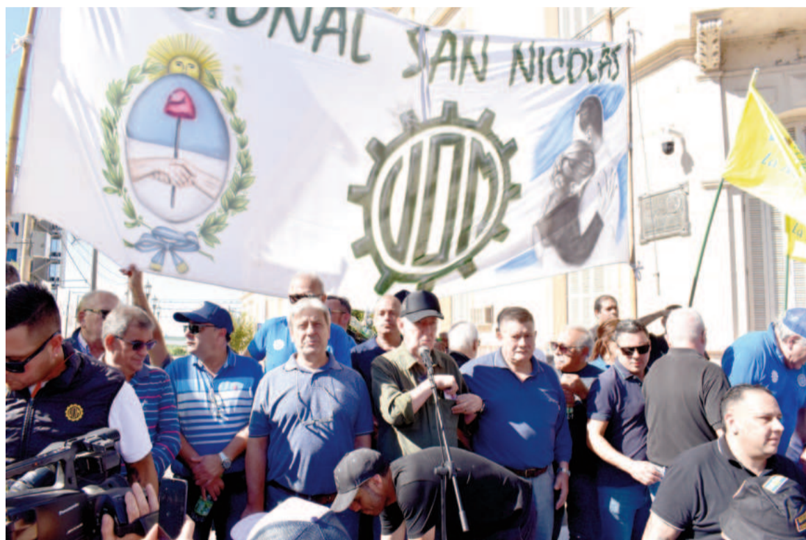
La conciliación obligatoria, que había sido extendida, culminó este lunes, dejando al gremio en libertad de acción.

La conciliación obligatoria, que había sido extendida, culminó este lunes, dejando al gremio en libertad de acción para definir una posible medida de fuerza. “El Secretariado Nacional tiene la posibilidad de empezar a definir medidas”, expresó