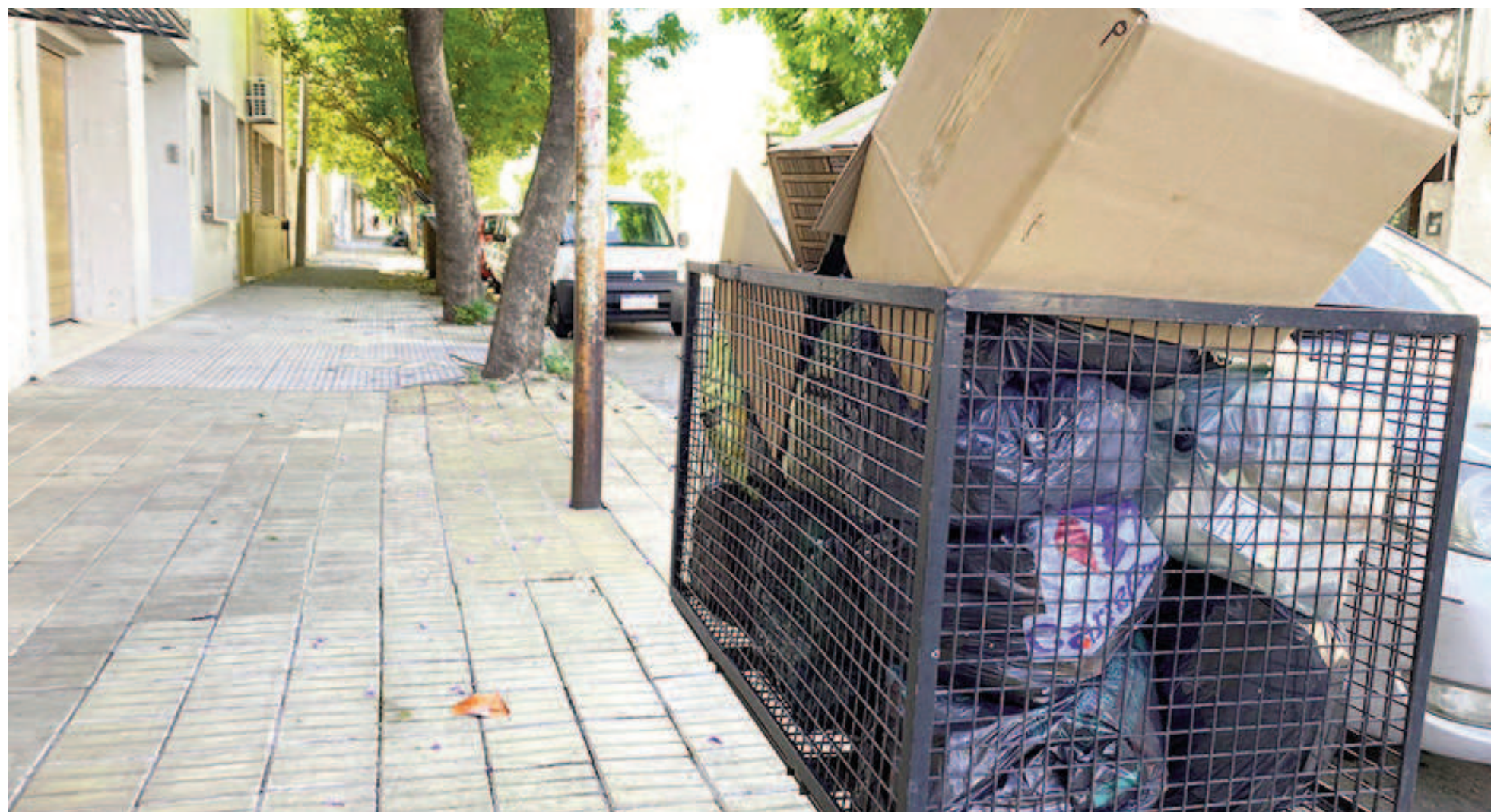
El Sindicato de Camioneros adhirió a la medida de fuerza, por lo que en San Nicolás no hubo recolección de residuos. EL NORTE

EL TRANSPORTE FUNCIONÓ AYER CON NORMALIDAD, Y TAMBIÉN LO HARÁ HOY