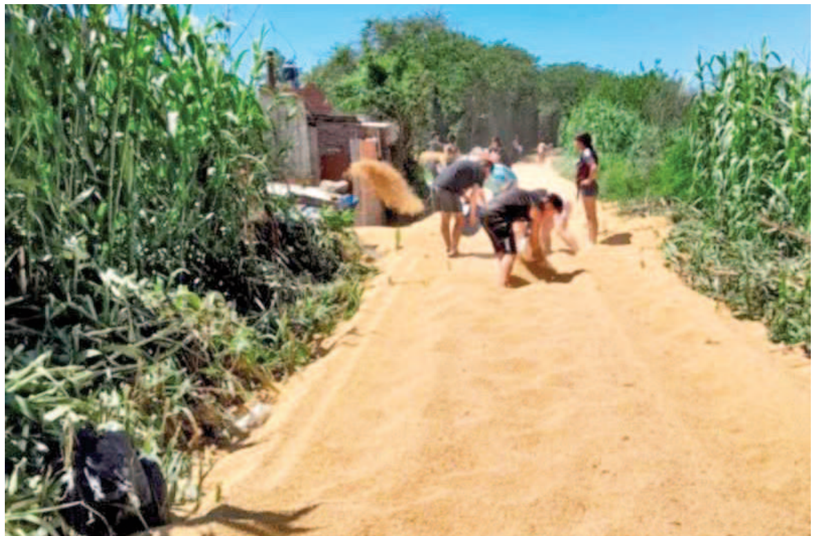
Emboscan y roban toneladas de soja de un tren de carga.

Este tipo de hechos delictivos afecta directamente la competitividad de las exportaciones argentinas, que dependen de la fluidez en el transporte de cereales desde las zonas productoras hacia los puertos de salida. Los operadores ferroviarios de carga han insistido en la necesidad de implementar estrategias de seguridad más eficaces para combatir estos ataques que no solo perjudican la economía local, sino que también