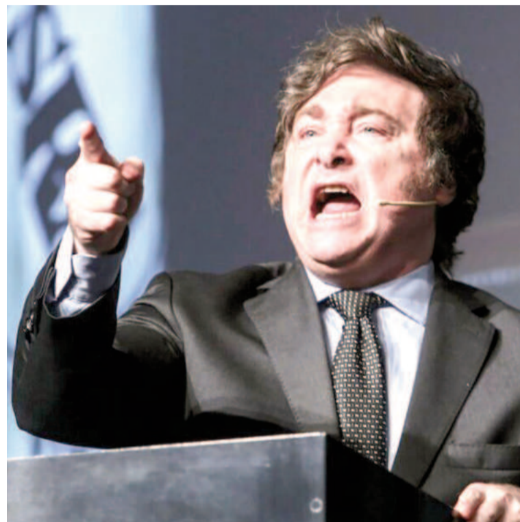
Milei habló en la celebración del 47º aniversario de la Fundación Mediterránea.

«Teníamos un money overhang , que era el doble del que había en la previa del Rodrigazo, allá en 1975, durante el gobierno de María Estela Martínez de Perón, espantoso gobierno que implicó no solo