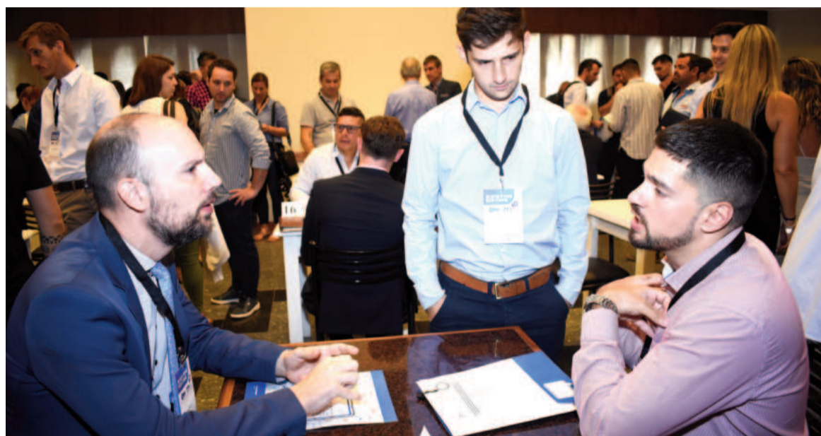
La III Ronda de Negocios contó con un récord absoluto de empresas participantes: 133 firmas estuvieron presentes.

Esto es lo que nos va a permitir generar trabajo de calidad”, manifestó Passaglia.