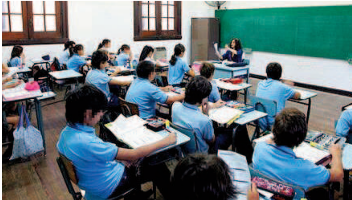
Los colegios privados terminan el 2024 con dos nuevos aumentos en las cuotas.

Con la nueva actualización de las cuotas para el último bimestre del año, se termina un periodo exigente