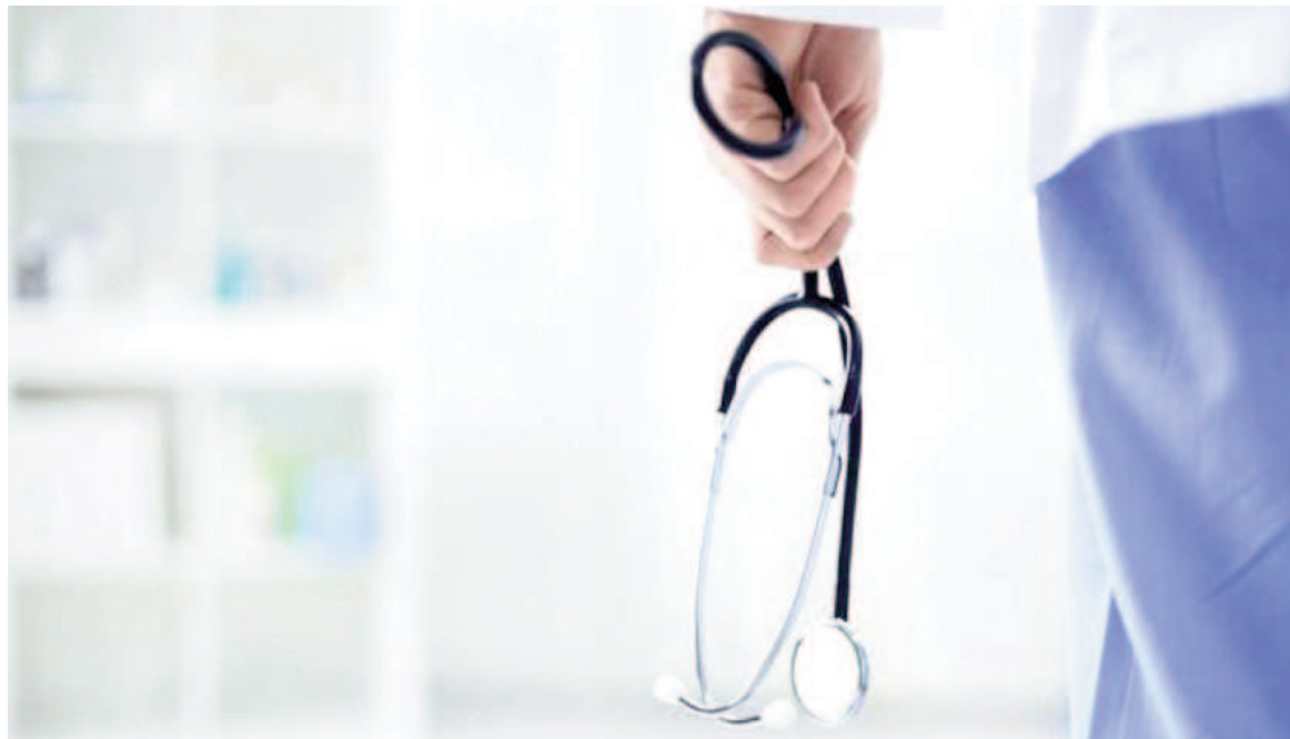
La medida de la Federación Médica de Buenos Aires alcanza a San Nicolás. ILUSTRACIÓN

pasada en diálogo con este medio cómo se originó la tensión entre ambas organizaciones: “Femeba propone la creación del IOMA. En todos estos años han tenido, de acuerdo a los cambios políticos, períodos de muy buena relación y de relaciones más tensas. En este momento, se había llegado a un punto en el que cada vez se estaban pagando mucho menos las consultas, la cápita que le paga fijo el IOMA a Femeba, por lo que esta última empezó a pedir mejores valores y distintas cuestiones. Ahí sucedió que IOMA responde con empezar a sacarle zonas de la provincia de Buenos Aires, donde atendía a través de Femeba. Cortó su convenio