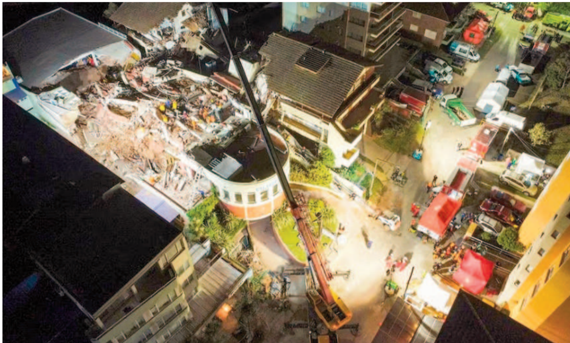
Una de las grúas trabajando en la zona cero.