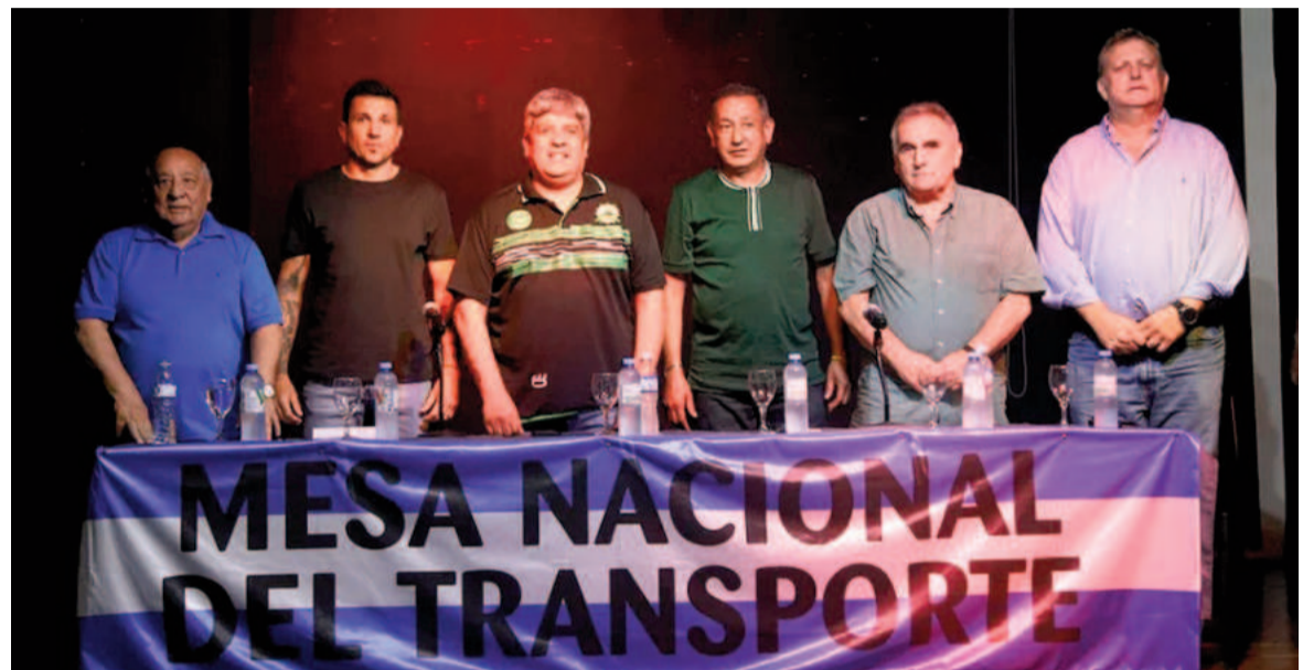
La Mesa Nacional del Transporte evaluó el paro concretado.

"Es el primer paso del plan de lucha", agregaron con nuevos paros en mente para el futuro.