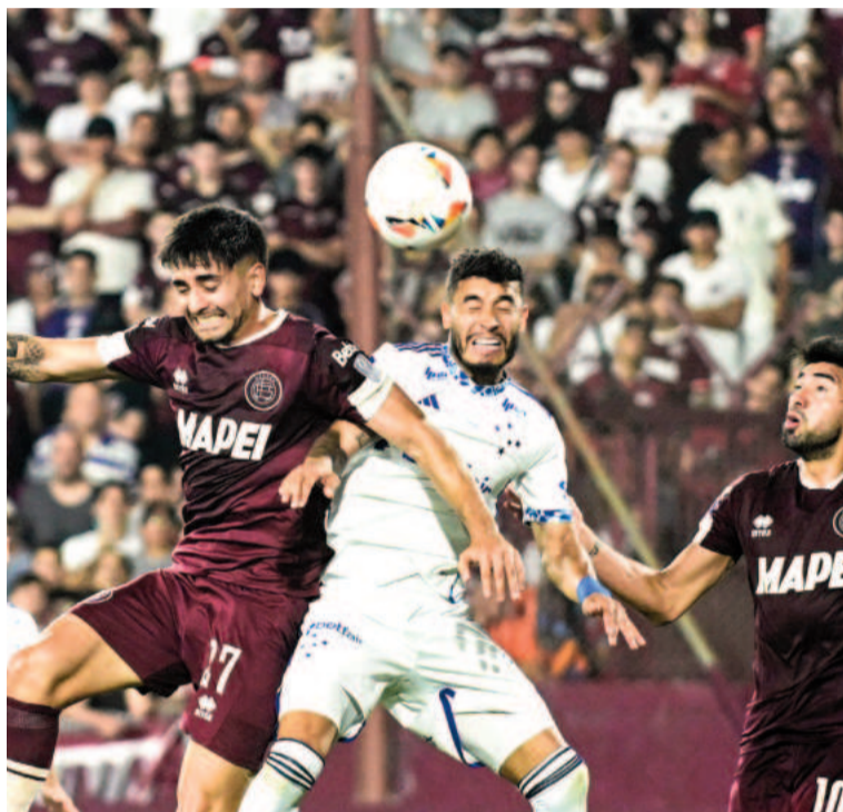
El Grante se quedó en las puertas de una nueva final continental. NA

En el primer cuarto de juego, el equipo del sur del Gran Buenos Aires salió a atorar y a lastimar a los de Minas Gerais con el envío de su gente que colmó la capacidad del recinto grante. Sin embargo, el Cruzeiro se fue aco-