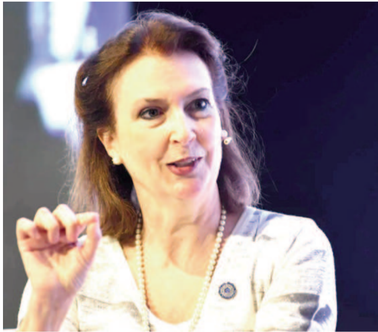
Otra funcionaria mas afuera del gobierno. Ahora le tocó a Mondino.