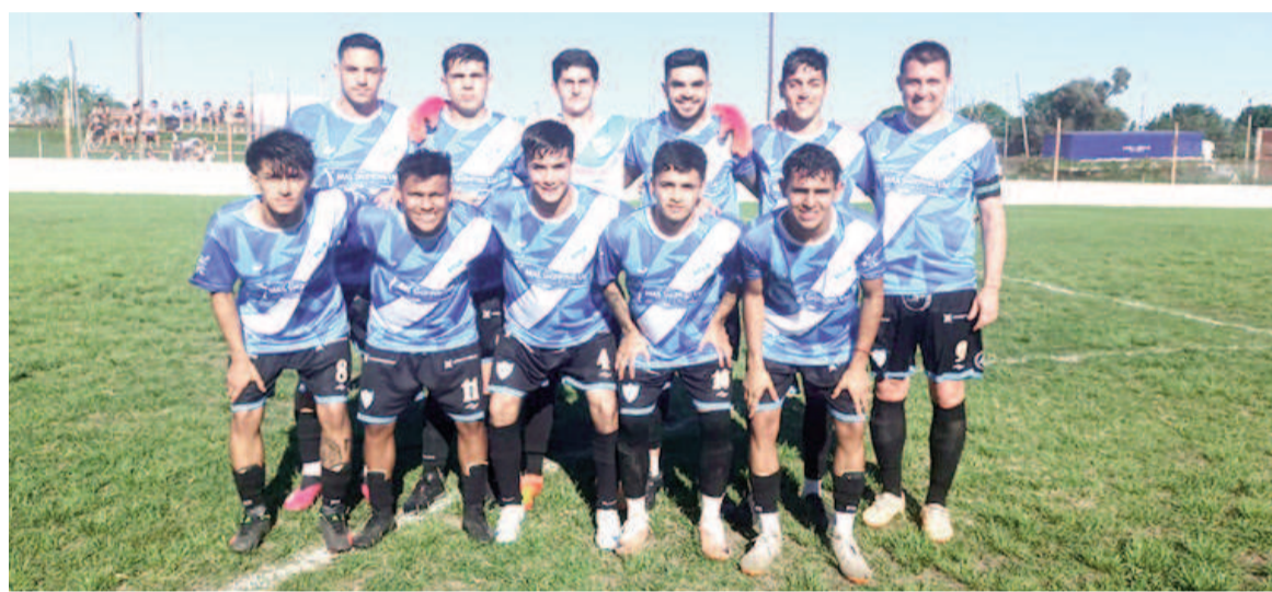
Paraná le ganó ayer a Fútbol San Nicolás y se puso a uno de Conesa. EL NORTE

En esta Zona C, Conesa (17) y Paraná (16) están clasificados a la Liguilla hace rato, y deberán definir este fin de semana quién será el primero y quién el segundo. La Academia depende de sí mismo, ya que ganándole a Fútbol San Nicolás