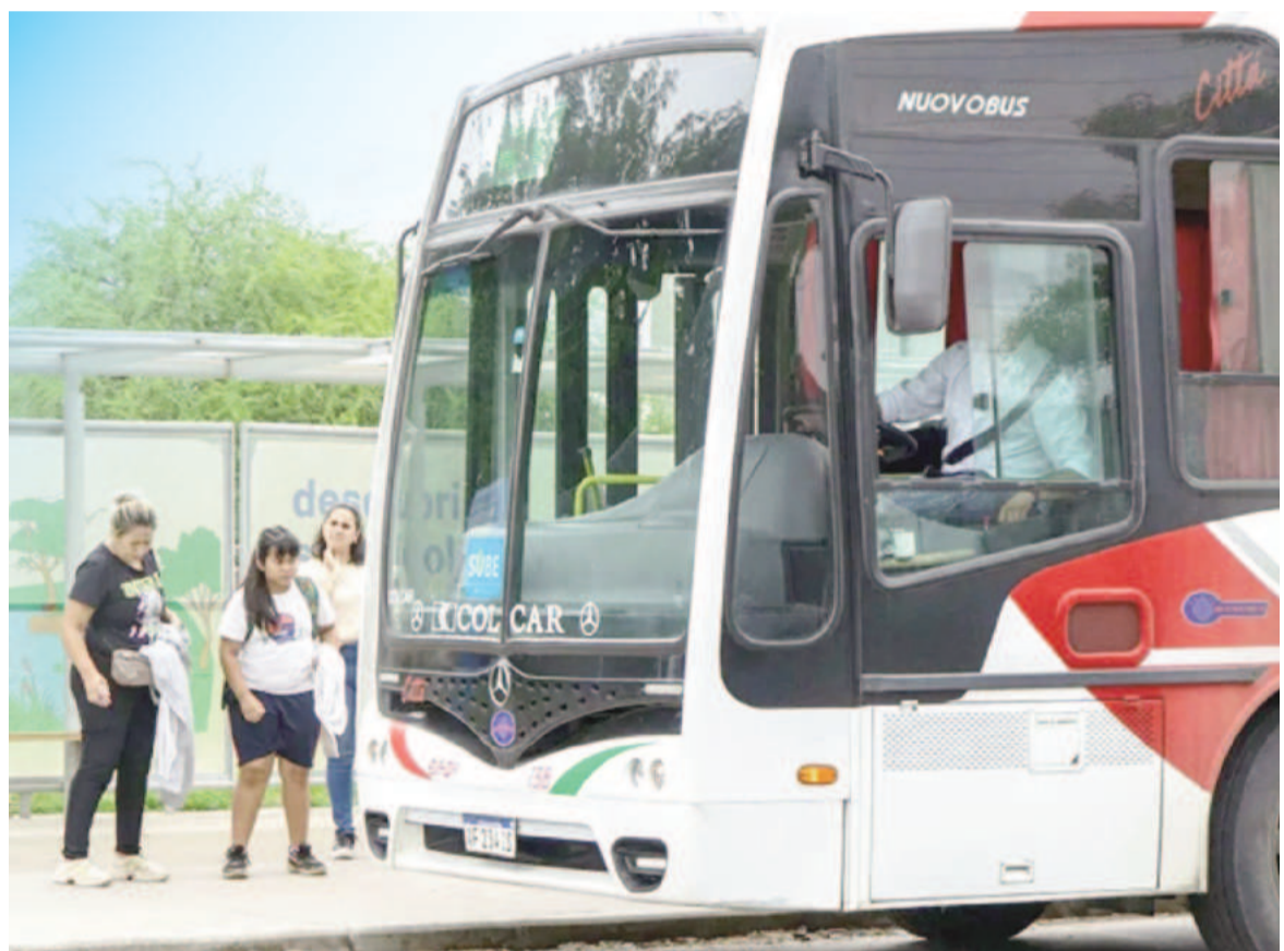
En San Nicolás las tarifas del transporte público se actualizan a partir del IPC de la Región Pampeana que mensualmente informa el Indec.

Aun con esos cuatro incrementos pendientes aplicados de una vez, la eventual tarifa plana nicoleña de $1121,45 estaría por debajo del boleto que hoy se abona en aquellas ciudades de referencia. En Rosario y en Santa Fe cuesta actualmente $1200 y en Pergamino, $1400.