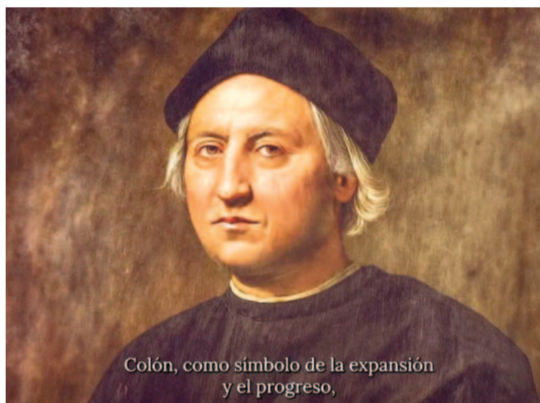
"Día de la Raza": el Gobierno encendió la polémica por el 12 de octubre.