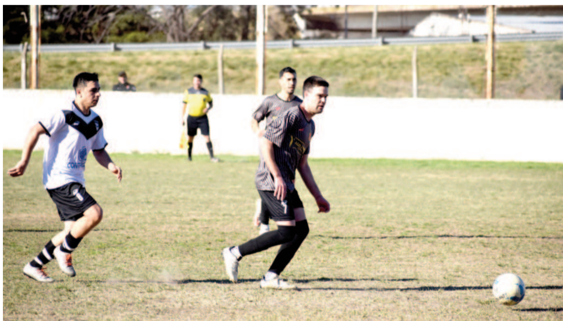
Belgrano buscará asegurar la clasificación ante El Fortín.

Si las condiciones climáticas mejoran, hoy se podrán jugar cuatro partidos correspondientes a la séptima fecha iniciada el viernes con el triunfo de Regatas sobre 12 de Octubre. Por la lluvia ayer se suspendió Fútbol San Nicolás vs. Paraná.