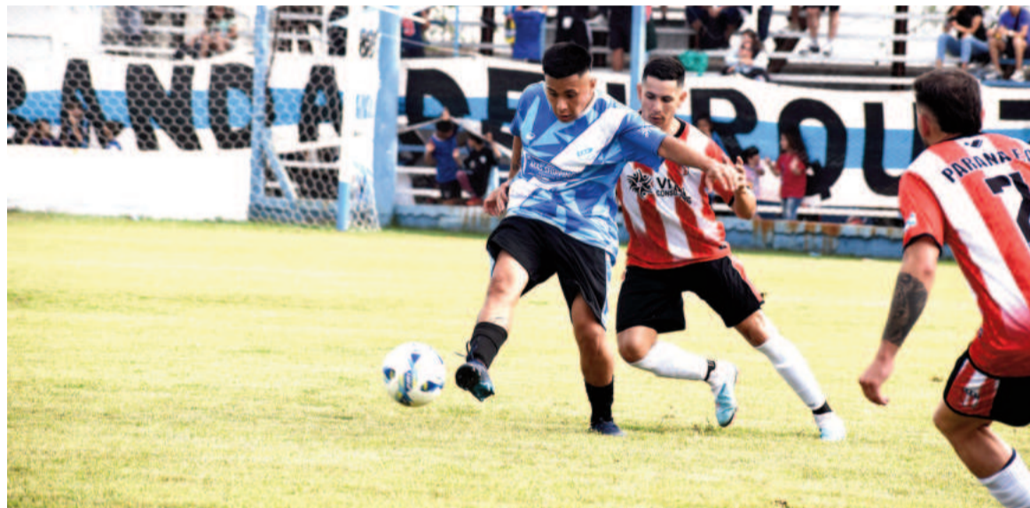
Paraná hará su debut como visitante.