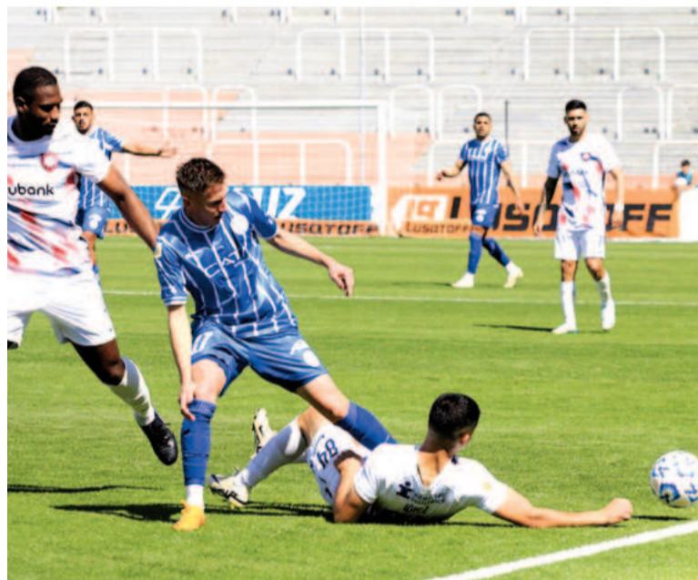
El Ciclón lo tuvo para ganar en la última, pero falló un penal. NA.

Sobre el final de esta reanudación San Lorenzo tuvo la gran posibilidad de llevarse los tres puntos, pero Fran-