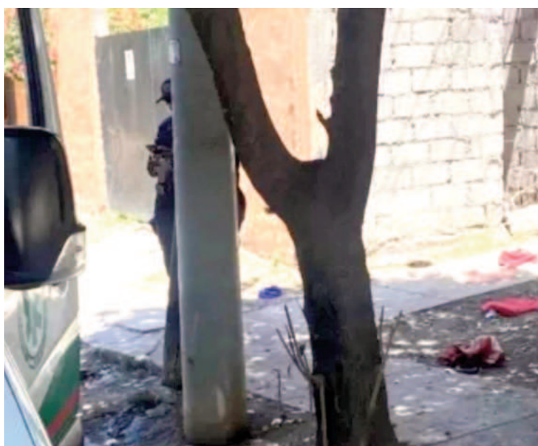
Es el segundo femicidio en menos de un mes en San Salvador de Jujuy.

El agresor se encuentra detenido a disposición de la Justicia, y se investigan las circunstancias que rodearon el fatal ataque. Se trata del segundo