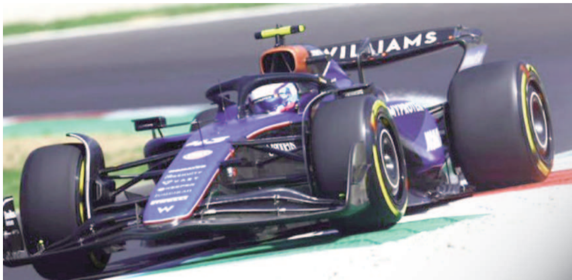
Franco Colapinto causó revuelo en la categoría y Argentina vio la oportunidad. WEB

Breard, se refirió a la posibilidad de que la F1 llegue al país y detalló los puntos que hay que tener en cuenta para que el sueño se haga realidad.