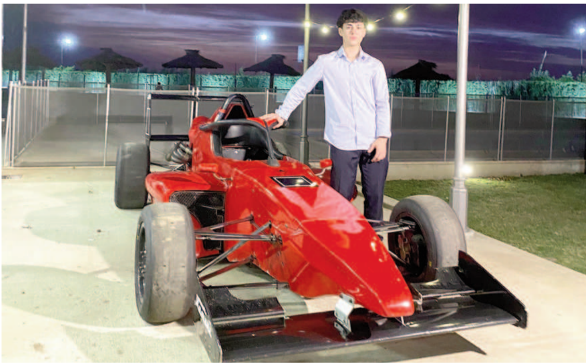
El nicoleño presentó el auto de F2 Nacional con el que correrá en San Nicolás. WEB

El piloto nicoleño volverá a las pistas el próximo fin de semana, donde tendrá su estreno en la Fórmula 2 acompañando nada menos que al Turismo Carretera en el Autódromo San Nicolás.