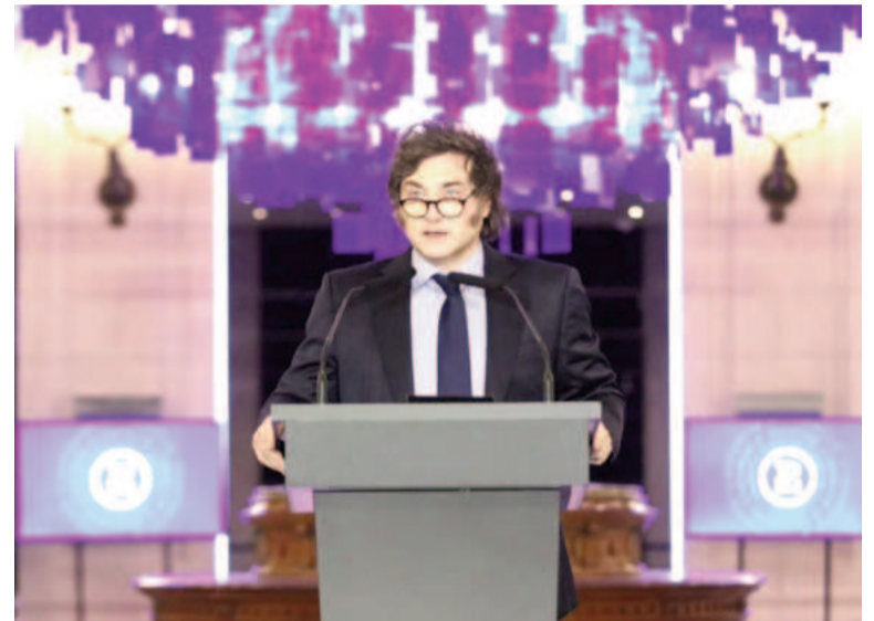
El presidente Javier Milei inauguró el flamante Palacio Libertad.

“En un país donde la gran mayoría de los niños son pobres y no saben leer ni escribir, ni realizar una operación matemática básica, el mito de la universidad gratuita se con-