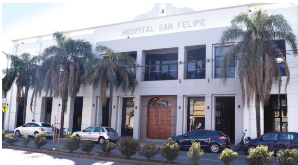
EL NORTE solicitó información estadística el martes sobre la cantidad de abortos practicados o facilitados desde 2021 en el Hospital San Felipe, pero hasta el momento no fue proporcionada.

La Ley de IVE está en vigencia desde 2021 y apunta a garantizar los derechos de las personas gestantes, desde el respeto de la autonomía de la persona embarazada y el trato digno por parte del personal sanitario como el acceso a la práctica segura y legal hasta la semana 14 de gestación, inclusive. A través de la norma-