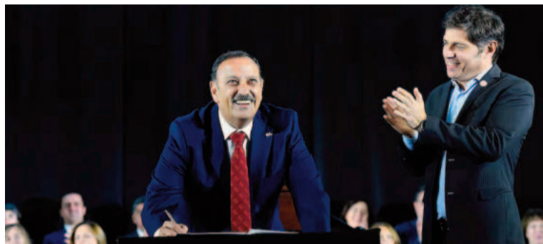
Quintela y Kicillof habilitaron una discusi n sobre el m todo de definiciones en el peronismo.

Realizar la elecci n del PJ Nacional es realmente complejo. En los hechos, el partido no tiene fondos suficientes para costear los gastos y la log stica del armado resulta ser compleja: impresi n de boletas, fiscalizaci n, conteo de votos, organizaci n territorial. En el peronismo son muchos los que creen que es casi inviable realizar una elecci n con todas las garant as. Por eso se agiganta la idea de que habr  un solo candidato, pero que eso se definir  sobre el cierre de listas.