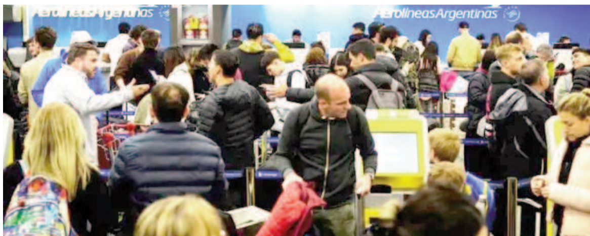
Nuevo paro de pilotos complica a los pasajeros.

Fuentes de Aerolíneas Argentinas explicaron que dentro de las acciones que se están analizando para enfrentar los efectos de la medida de fuerza, se encuentra la disposición de adicionales a posteriori del paro, de manera de poder ir evacuando la enorme cantidad de pasajeros que quedarán sin poder viajar en los horarios previstos. La