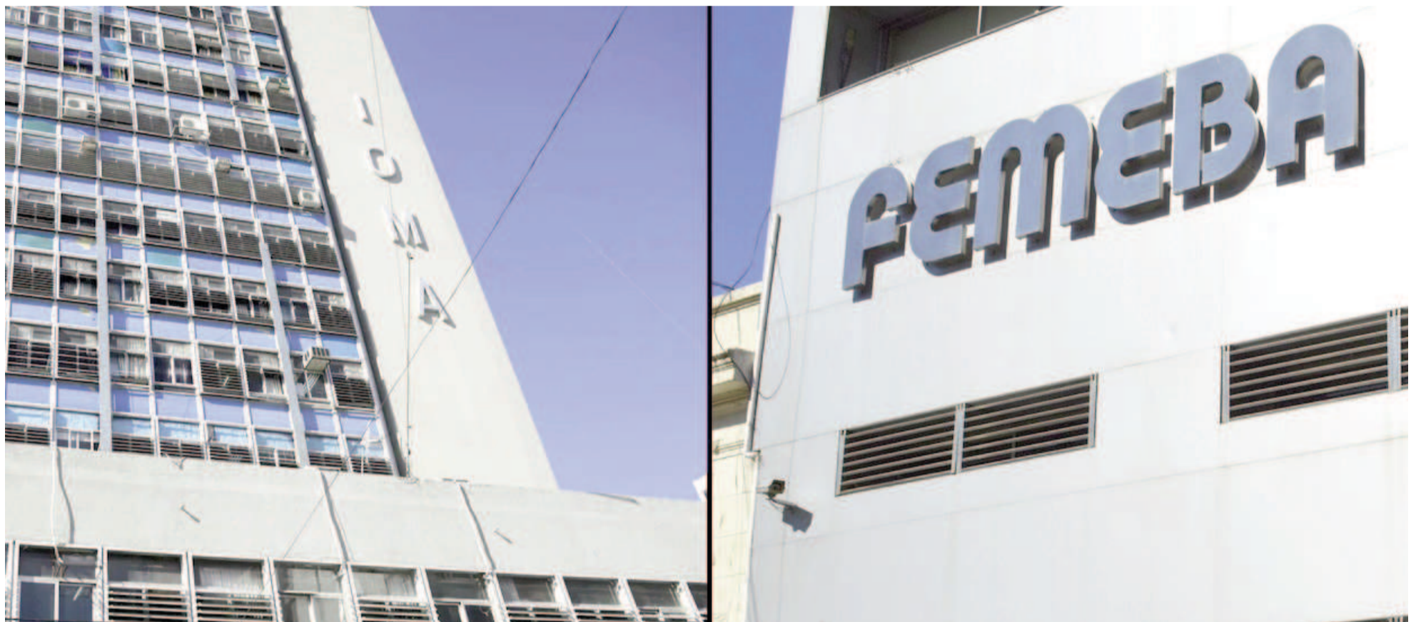
Tras reunirse ambas partes el lunes pasado, IOMA ratificó el corte del convenio con Femeba en 11 municipios bonaerenses.