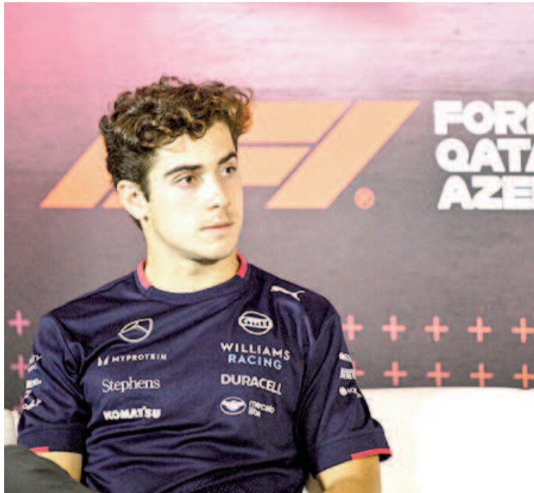
"Estoy trabajando mucho y haciendo mucha preparación para estar listo".

En ese sentido, será una experiencia que se repita en las próximas competencias, también en circuitos donde nunca corrió. "La realidad es