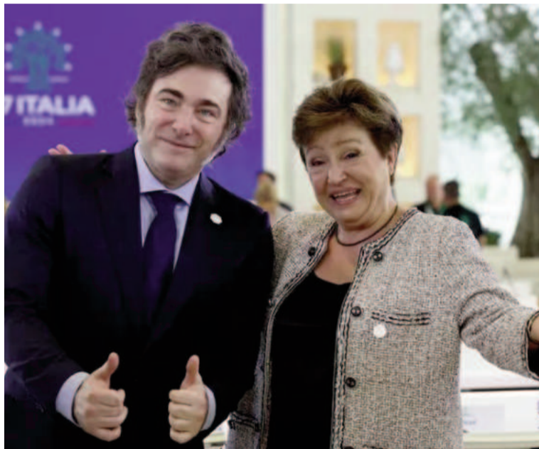
Javier Milei junto a Kristalina Georgieva.

La visión oficial es continuar con su programa económico "con o sin respaldo del Fondo", aunque hay un reconocimiento que con