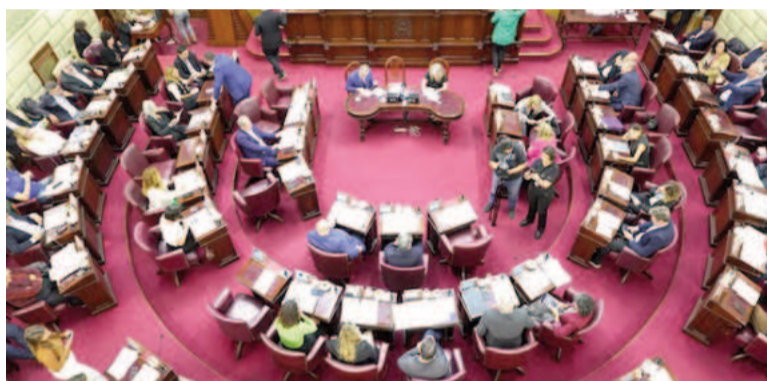
La Cámara de Diputados de Santa Fe sancionó la reforma previsional.

A su vez, se modifica el tope de jubilaciones mínimas, mientras que se elevarán los aportes, pasando del 14% de hoy a una escala que va del