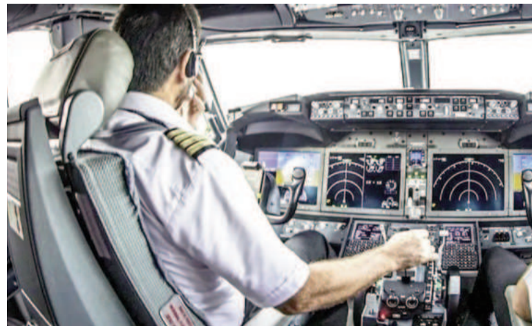
Tres pilotos de Aerolíneas fueron despedidos por negarse a trasladar dos aviones en devolución.

La negativa del traslado le acarrea a Aerolíneas una multa alta, del orden de los 26 mil dólares por cada aeronave, más los gastos derivados del incumplimiento de