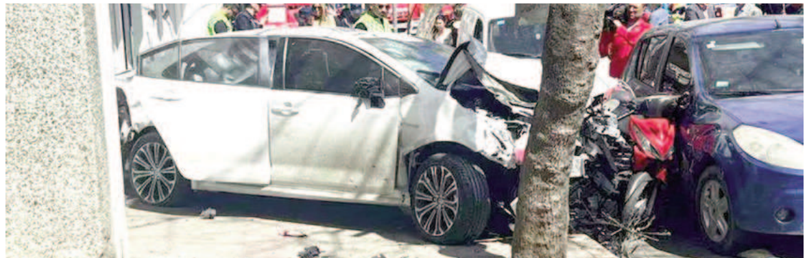
Así quedó el auto protagonista del incidente.

Un automovilista que fue impactado por el auto fuera de control dijo a la prensa: "Vivo a una cuadra. Saqué el auto para hacer dos cuadras, porque tenía que buscar una cosa. Mi