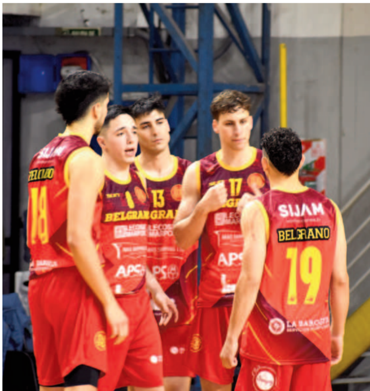
Belgrano ganó los tres partidos hasta aquí y lidera en el Grupo B junto a Somisa.