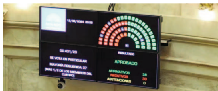
El tablero de la votación muestra el resultado de uno de los temas relevantes tratados.

"La boleta única hace un aporte importante para consolidar y fortalecer el sistema democrático de la Argentina.