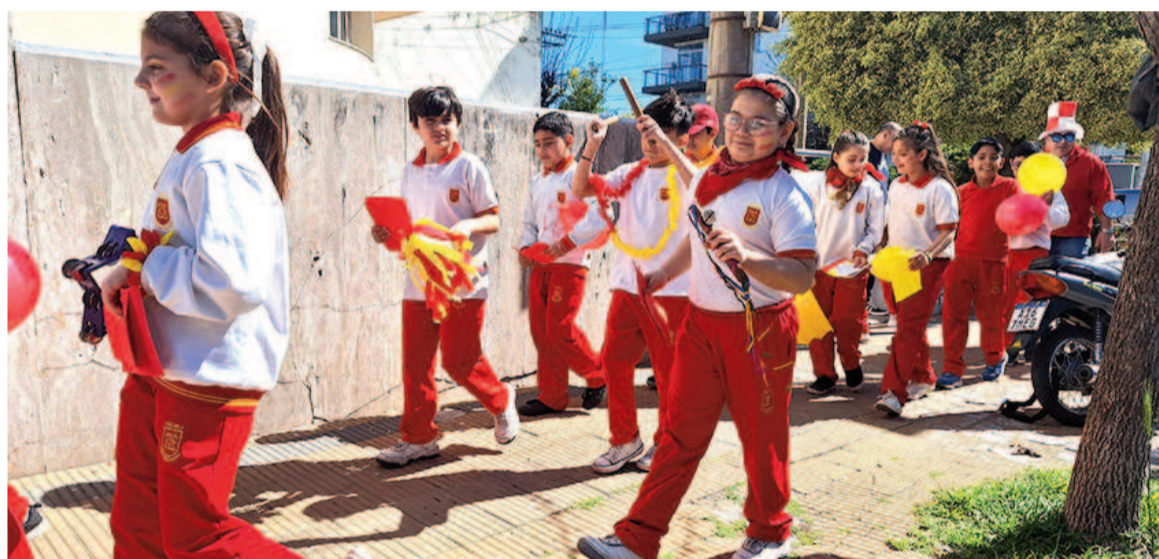
Docentes, estudiantes y familiares realizaron ayer un abrazo simbólico a la Escuela Primaria Club Belgrano, en su 40º Aniversario. EL NORTE

Con tal motivo, este jueves la Escuela Primaria Club Belgrano convocó a la comunidad educativa, alumnos