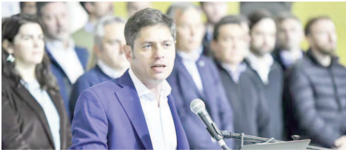
Axel Kicillof aprueba que las tasas se incluyan en las facturas de servicios.

“La provincia ha dictado diversas normas que la reglamentan y complementan a los fines de su implementación y es por ello que la citada norma nacional no resulta de aplicación directa”, agrega el comunicado del Organismo que conduce Diego