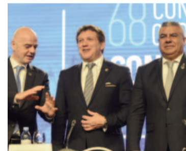
Infantino, Domínguez y Tapia, en la misma sintonía.

Así se desprende del texto en que FIFA alude al «caso Kuwait», cuando en 2015 una nueva Ley del Deporte entró en conflicto con el artículo 19 de los Estatutos de la Federación con sede en Suiza e incumplió con lo dispuesto en el artículo 14 del mismo texto -ambos citados para el caso argentino-, y esa federación fue sancionada y ni sus clubes pudieron jugar copas internacionales ni la selección en sus competencias.