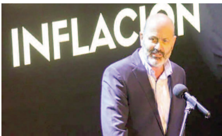
El ministro de Desregulación y Transformación del Estado, Federico Sturzenegger.

El presidente de la Nación, Javier Milei, firmó hoy la reglamentación del artículo 182 del DNU 70/23 con los lineamientos aplicables a la prestación del servicio esencial de aeronáutica civil comercial.