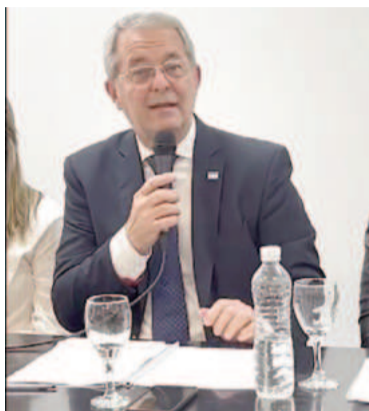
“Arroyo Seco es un lugar para vivir y sentirse bien”.

El intendente repitió que recibió una ciudad “chata y postergada durante años” que se ha quedado en el tiempo y a la cual está convencido de que podrá transformar. “Obviamente no será fácil”, prosiguió y explicó que el objetivo de la actual gestión es reinsertar a Arroyo Seco en la “esfera de decisión y determinación que lleva al progreso de los pue-