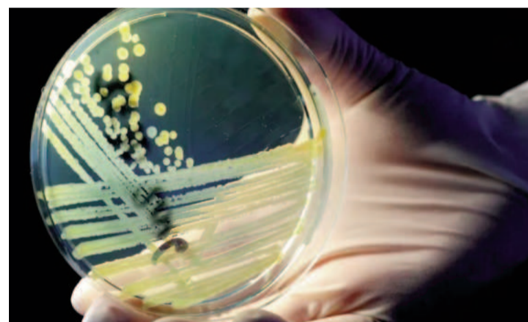
El análisis global en 204 países destacó el incremento alarmante de la resistencia a los antibióticos.

El estudio de The Lancet también muestra una tendencia dispar entre grupos etarios. Mientras que las muertes por resistencia antimicrobiana entre los niños menores de cinco años se redujeron en más del 50% entre 1990 y 2021, los mayores de 70 años se enfrentan a un panorama preocupante. En este grupo, las muertes por infecciones resistentes aumentaron en un 80% y se espera que esta cifra se duplique en las próximas décadas.