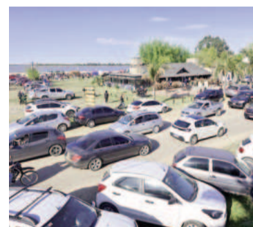
Esto fue producto de la participación de cinco mil personas el día sábado y de ocho mil el domingo.

Desde la Secretaría de Desarrollo Económico destacaron el impacto en el sector turístico, con eventos que rompen la estacionalidad del verano. En esta oportunidad, fueron las jornadas de las “Carreras Legendarias”, donde participaron más de 120 autos, 40 motos antiguas y lo presenciaron más de 13.000 personas. La Secretaría informa que de este evento participaron 39 emprendedores de las distintas localidades del partido de Ramallo, generando un volumen de venta de $45.000.000.