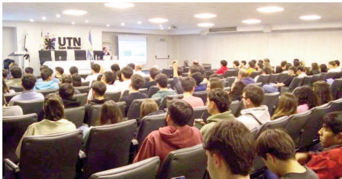
Este lunes se habían iniciado las actividades preliminares, con conferencias ofrecidas en la Facultad Regional San Nicolás.

Aunque la ceremonia de apertura está prevista para esta tarde, en el Hotel Colonial las conferencias plenarias estarán en funcionamiento ya desde la mañana. A las 10:00 será