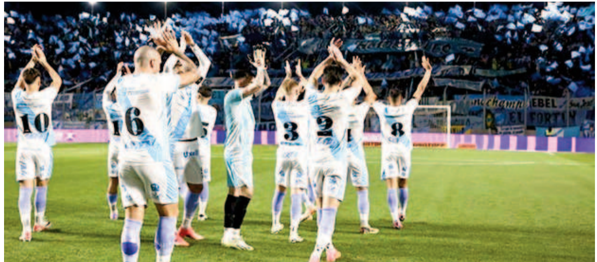
El Gasolero viene de ganarle a otro santiagueño, Mitre, también en nuestra ciudad.