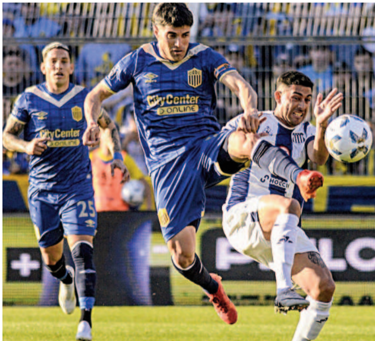
Central y Talleres protagonizaron un atractivo partido en Rosario.