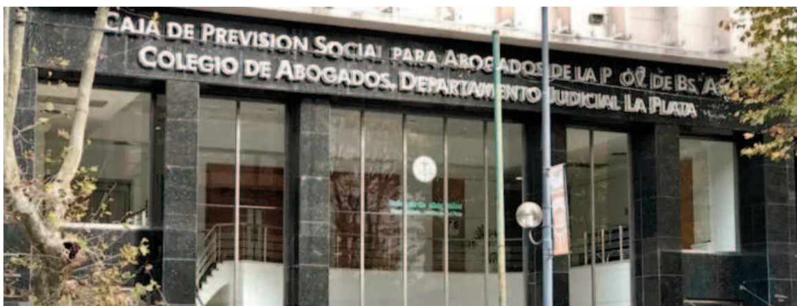
La Caja de Previsión Social de los abogados bonaerenses.