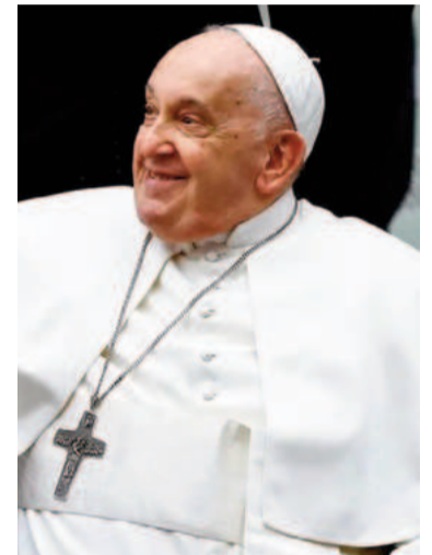
En la misma semana, el Papa recibe a la CGT y a Sandra Pettovello.

Junto a Daer y Moyano, que harán entrega al Papa de un documento que expresa su preocupa-