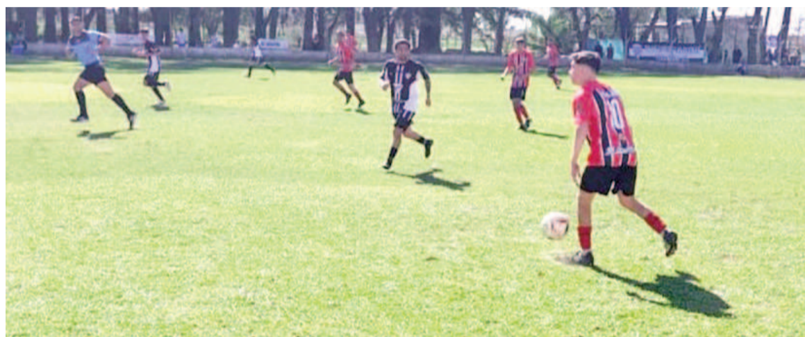
El Pañero necesitaba ganar antes de quedar libre. EL NORTE

El Pañero fue intenso y aprovechó algunas ventajas que dio el local para imponerse por 3 a 2. Chávez, Cabral y Gatti anotaron para el Pañero, mientras que Sacconi y Gascón marcaron para el Chacarero.