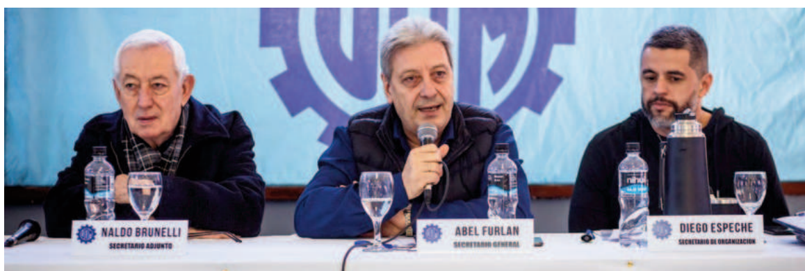
En el actual capítulo paritario, la UOM busca mejorar los salarios de julio, agosto, septiembre y octubre.

El gremio está solicitando subas del 4% por los dos primeros meses y del 3% por los otros dos. En audiencias anteriores, las industrias siderúrgicas ofrecieron subas del 2% para cada uno de los meses. La UOM rechazó esa propuesta y el martes de la semana pasada inició una ronda de asambleas sectoriales de trabajadores en las plantas productivas, incluidas las de Ternium y Acindar en Ramallo y Villa Constitución. La reapertura formal de la paritaria se había producido dos semanas atrás en la Secretaría de Tra-