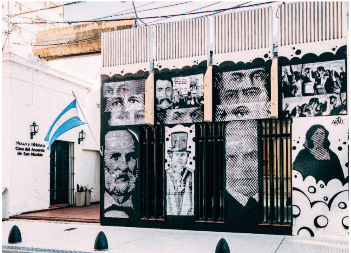
Para el ciclo fueron convocadas las realizaciones audiovisuales locales más destacadas de los últimos años.

El ciclo de cine nicoleño, que es organizado conjuntamente