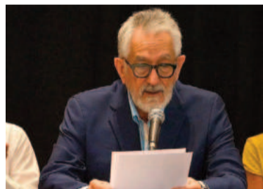
Alberto Rodríguez Saá, exgobernador de la provincia de San Luis.

En cuanto a cómo ve el peronismo, recordó lo que semanas atrás había declarado: los dirigentes necesitan