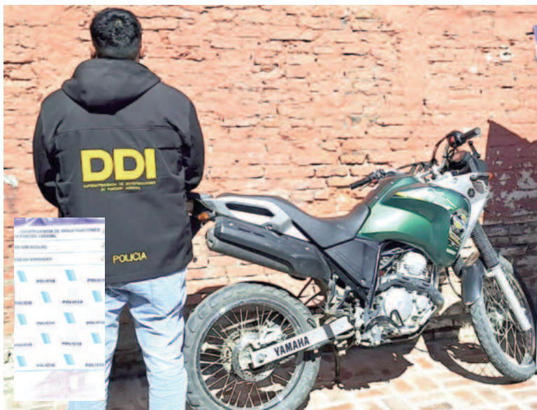
Recuperan una moto robada en San Nicolás.

Fue durante un operativo de rutina efectuado en la vía pública. A la motociclista se le inició una causa por encubrimiento.