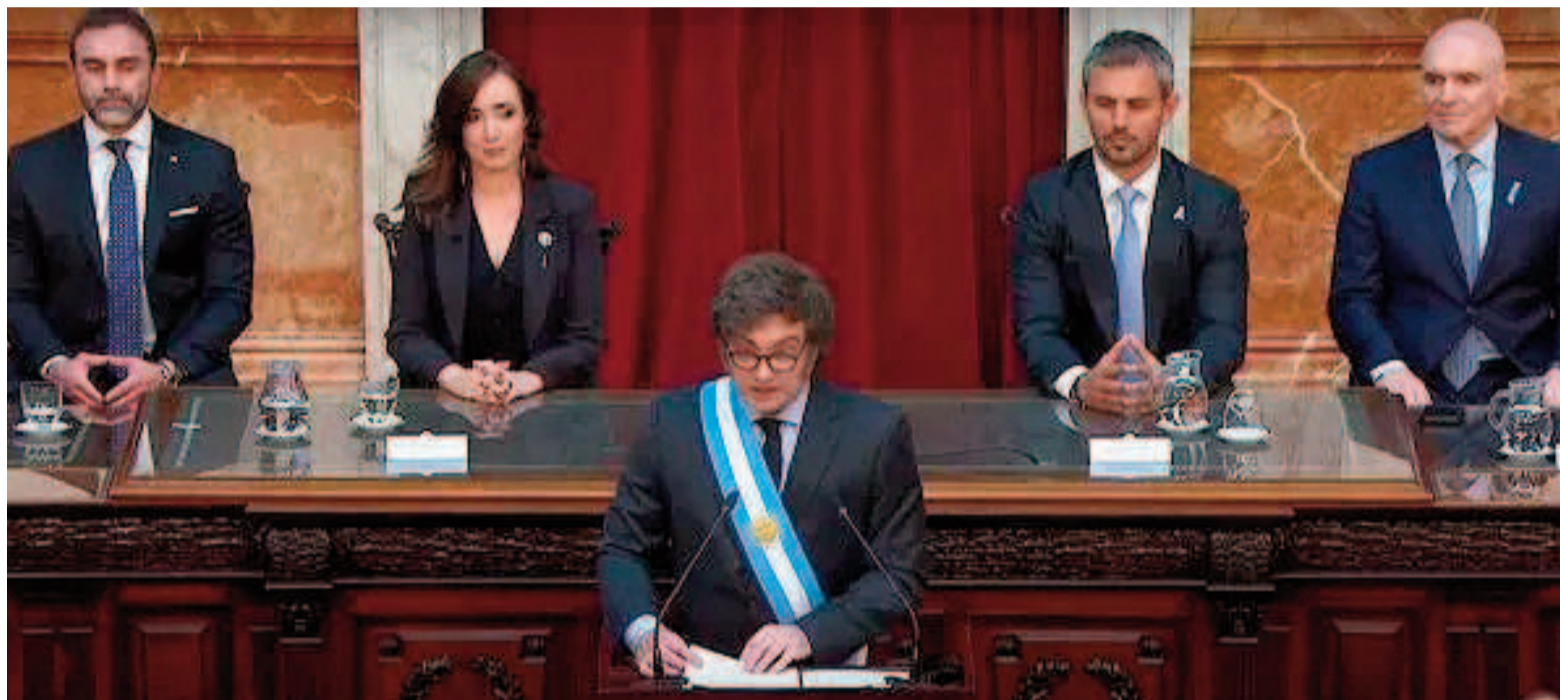
El presidente de la Nación, Javier Milei, presentó anoche en el Congreso el Presupuesto 2025.

defaulteador serial del mundo", manifestó, y remarcó que "la política económica no ha sido otra cosa en la Argentina que la violación sistemática de los derechos de propiedad de los ciudadanos".