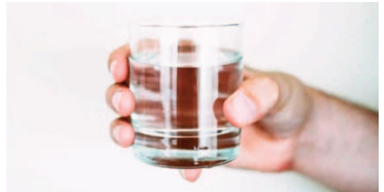
En China se acostumbra beber agua caliente durante el día, incluso en verano.

La MTCh está regida por los principios de la naturaleza y el espíritu. En el qi -también visto como «chi», la energía vital mantiene nuestro equilibrio físico y emocional. Por eso es considerada por algunos como una práctica medicinal alternativa, definición constantemente