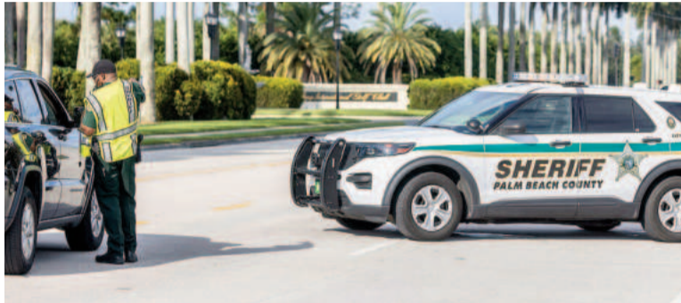
El campo de golf donde estaba jugando el expresidente estadounidense.

municado en el que apuntó que está investigando lo sucedido en colaboración con la Oficina del Sheriff del Condado de Palm Beach. En un comunicado el FBI dijo que está "investigando lo que parece ser un intento de asesinato". La mirilla del arma del atacante, según el FBI, hubiera permitido al atacante disparar con facilidad contra Trump, quien se encontraba a un centenar de metros de distancia.