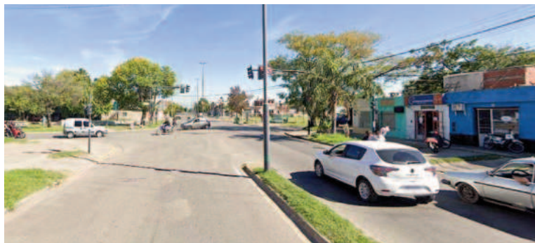
La avenida Batlle y Ordóñez, escenario de dos hechos delictivos.

Uno de los casos fue a las 15.00 y tuvo como víctima a un hombre de 37 años, que terminó con un tiro en el abdomen al escapar en su vehículo de dos ladrones en Batlle y Ordóñez al 1300. A las 17.00, un adolescente recibió un disparo en la pierna izquierda en la esquina con España. No hay detenidos.