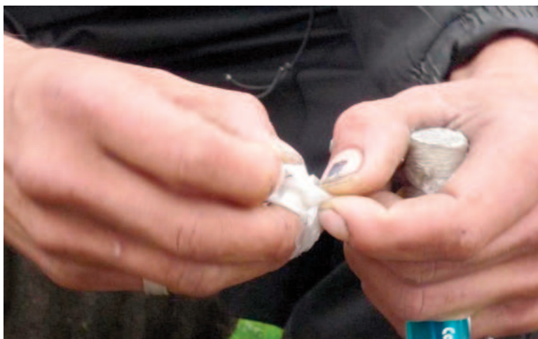
Una beba nació con cocaína en sangre en la Maternidad de Córdoba.

Sin embargo, lamentó la facilidad para acceder a comprar drogas en los barrios de Córdoba, lo que agrava la situación: "Conseguir droga está a la mano de todos". En esa línea, concluyó: "Si ustedes investigan y ven la cantidad de denuncias que tiene, debería estar presa".