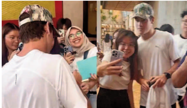
Colapinto está disfrutando de su llegada a la Fórmula 1.

Y agregó: "Singapur es conocido por ser uno de los circuitos más exi-