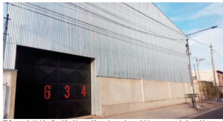
El frente de Unidos San Nicolás en el horario en el que debía comenzar la Asamblea ayer.