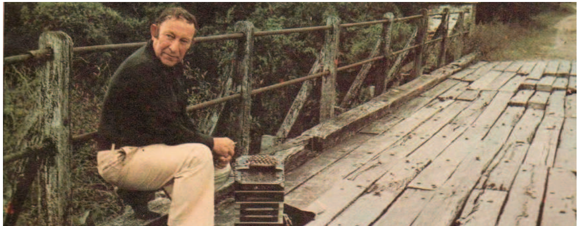
A la memoria de Tránsito Cocomarola se instituyó el Día del Chamamé.

Cultura Argentina, el "Taita" registró unas 200 canciones en Sadaic, entre las que se encuentran clásicos como "Retorno", "Amor supremo" y "Kilómetro 11", obra que es considerada como "el himno del chamamé".