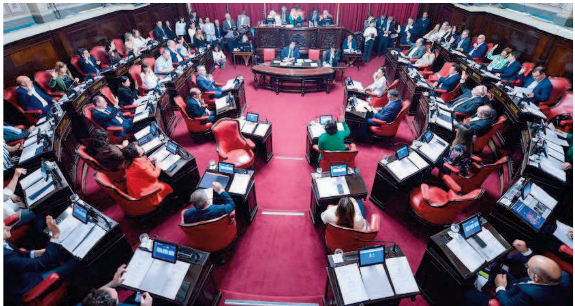
La Legislatura bonaerense en plena sesión.