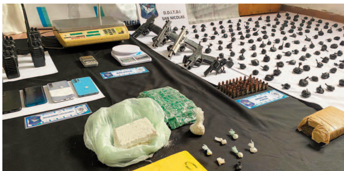
Vista de la droga y demás elementos secuestrados en los allanamientos.

La instrucción se inició dos años atrás y aportó un extenso informe de la fiscalía, que dio cuenta de un grupo de individuos organizados para la dis-