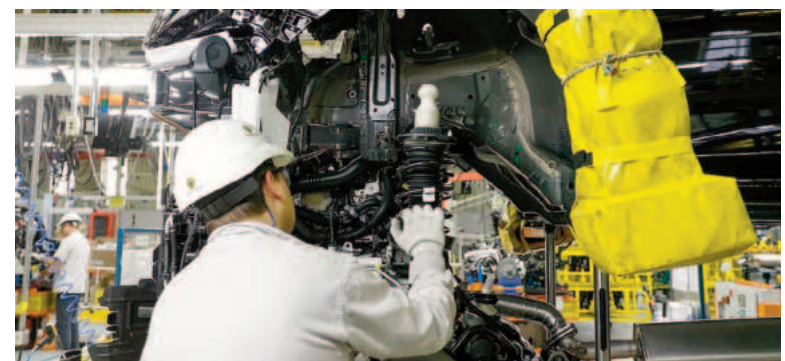
Hoy se conocerá la tasa de desocupación del segundo trimestre.

El Instituto Nacional de Estadística y Censos (Indec) dará a conocer hoy jueves el Índice de Desocupación del segundo trimestre, período en el que la economía arrastró una caída del 1,7% respecto a igual período del año anterior. En el segundo trimestre del 2023, el período a comparar, la desocupación se ubicaba en el 6,2%.