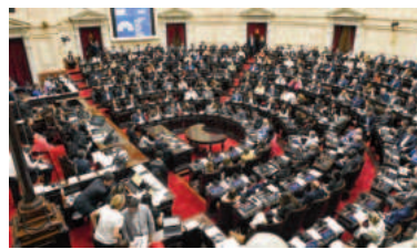
Diputados tratará la Boleta Única de Papel.

El elector deberá seleccionar solamente una opción por cada cate-