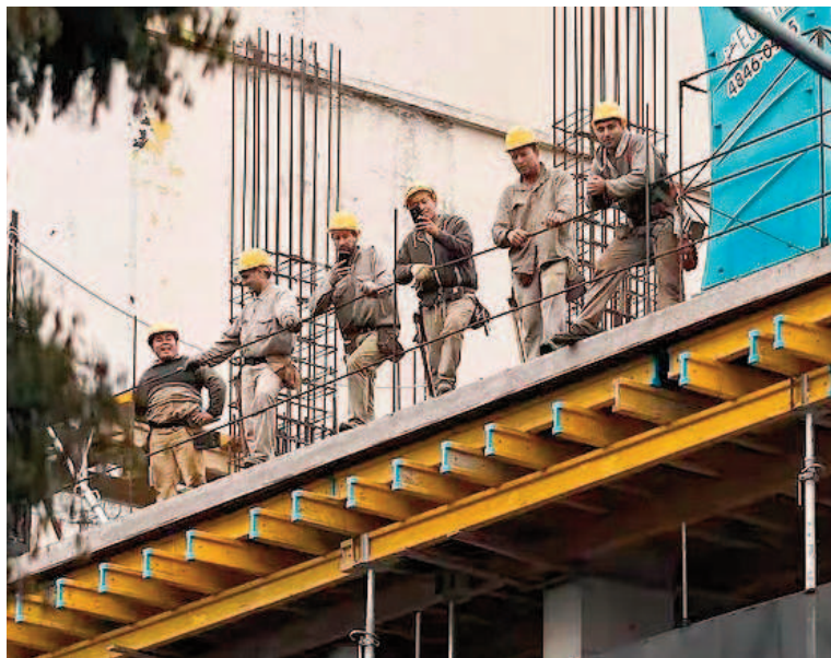
El sector de la construcción fue el que más cayó en el segundo trimestre.

Además del agro, crecieron la pesca (41,3%), la minería (6,6%), el servicio doméstico (3,7%), el sector de electricidad, gas y agua (2,8%), el rubro de transporte y comunicaciones (2,2%), la enseñanza (1%) y los ser-