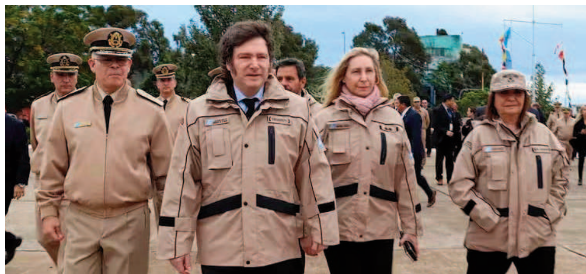
Javier Milei acompañado por su hermana y secretaria general de Presidencia, Karina Milei, y la ministra de Seguridad, Patricia Bullrich.

El fiscal chavista Tarek William Saab dijo que es por el caso del embargo del avión venezolano-iraní de Emtrasur.