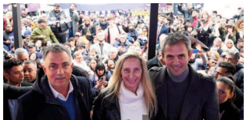
Aprobaron la personería jurídico-política de La Libertad Avanza bonaerense.

al partido ‘La Libertad Avanza’ la personería jurídico-política definitiva como partido de distrito, con derecho exclusivo al nombre partidario” y “con todos los derechos y obligaciones que emanan de su reconocimiento”.