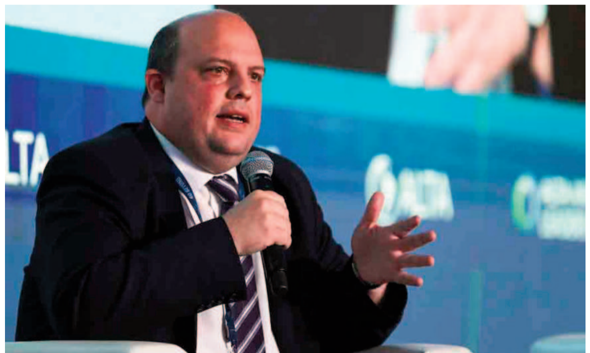
Pablo Ceriani, expresidente de Aerolíneas Argentinas.

En medio del conflicto entre los gremios aeronáuticos y el Gobierno nacional, el expresidente de Aerolíneas Argentinas (AA) Pablo Ceriani afirmó que privatizar la empresa no se volverá más competitiva: “Eso no es verdad”.