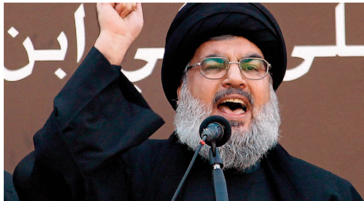
Nasrallah llevaba más de 30 años al frente de Hezbollah.

Fue en medio de un ataque aéreo nocturno de precisión contra el cuartel general del grupo libanés. Allí estaban reunidos los máximos dirigentes, incluido su líder desde hace más de 30 años. «Seguiremos la guerra santa contra el enemigo y en apoyo de Palestina», respondió el movimiento terrorista.