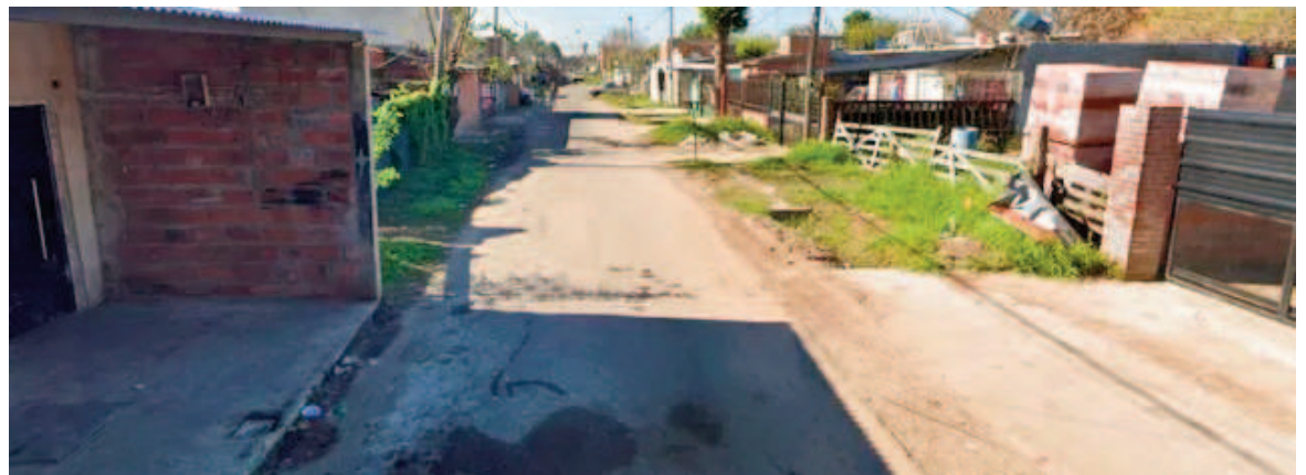
La discusión se produjo en una vivienda de Schweitzer al 8400.

Por su parte, una ambulancia del SIES atendió a la víctima por una herida a la altura intercostal y lo trasladó al Hospital de Emergencias Clemente Álvarez (HECA).