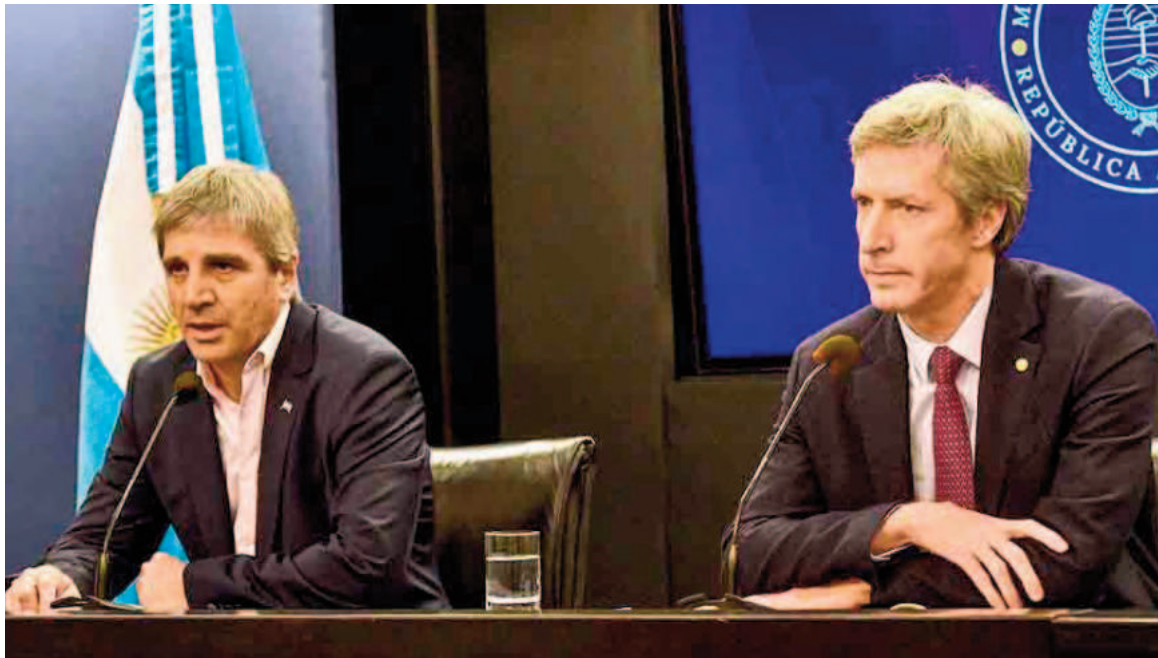
El ministro de economía, Luis Toto Caputo, junto al presidente del Banco Central, Santiago Bausili, a cargo de las tratativas.

Los títulos emitidos hasta aquí por US$10.000 millones por el BCRA, que ya los cancela a razón de US$167 millones por mes, son los más apetecibles para los prestamistas porque esa entidad nunca cayó en default y son pa-