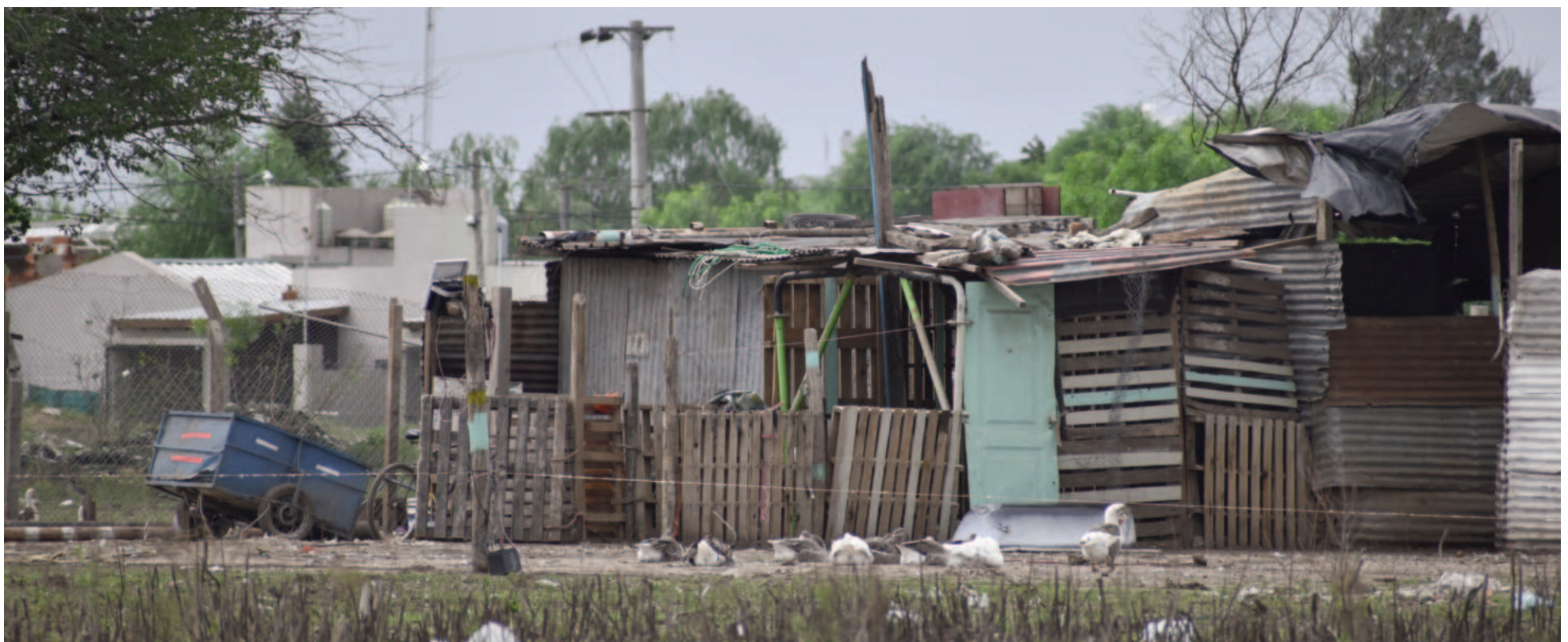
En San Nicolás-Villa Constitución la cantidad de hogares pobres aumentó de 25.470 a 31.073 en seis meses.

De acuerdo al informe correspondiente al primer semestre de 2024 publicado por el Indec, en el aglomerado San Nicolás-Villa Constitución, la pobreza alcanza al 55,2% de las personas. En relación con el período anterior, hay ahora 17.206 nuevos pobres. En tanto, la comparativa interanual arroja que 29.861 personas cayeron bajo la línea de pobreza.