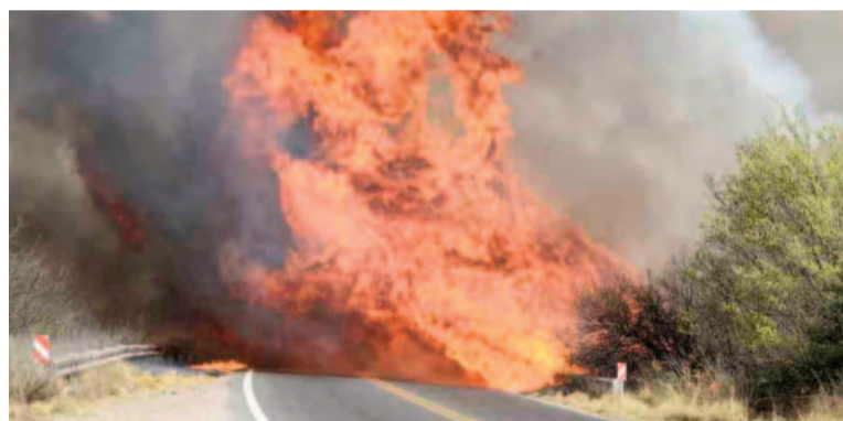
El 95 % de los incendios son provocados por intervención humana.

Los incendios forestales se expanden a ritmo desenfrenado, destruyendo todo a su paso. Miles de hectáreas arrasadas, decenas de casas destruidas, animales muertos y cientos de evacuados, ese es el panorama desolador en la provincia de Córdoba. A medida que los bomberos y voluntarios luchan contra el fuego, se especula sobre posibles intereses inmobiliarios y agrícolas detrás de esta tragedia.