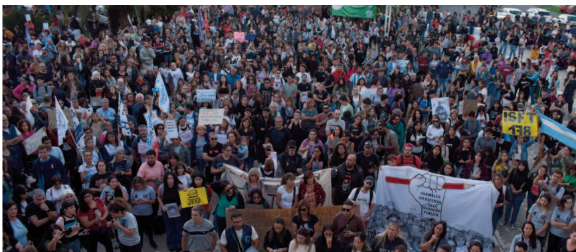
El 23 de abril pasado tuvo lugar una marcha de similares características y la Regional de la UTN también promovió una convocatoria local en el playón.

La Marcha Federal Universitaria del próximo miércoles es convocada por el Consejo Interuniversitario Nacional, el Frente Sindical de Universidades Nacionales y las y los estudiantes de la Federación Universitaria Argentina. El reclamo se encuentra enfocado en la promulgación de la Ley de Financiamiento Universitario, sancionada recientemente en el Congreso Nacional. Por resolución del Consejo Directivo de la UTN San Nicolás, 'y en vista de la difícil situación presupuestaria que se encuentran atravesando las universidades nacionales', la Regional comunicó que adhiere a la actividad nacional que se espera movilice a miles de personas como sucedió en abril pasado. En nuestra ciudad, la Facultad Regional San Nicolás (FRSN) promueve una convocatoria ese mismo día a partir de las 17.30, con una concentración en el playón de la Regional que se encuentra en nuestra ciudad. Asimismo, la resolución del Consejo Directivo declara la alerta y movilización permanente. "Esta decisión se funda en que tanto el Ministerio de Capital Humano como la Secretaría de Educación y la Subsecretaría de Políticas Universitarias no han mostrado un avance significativo en materia de políticas de Estado pre-