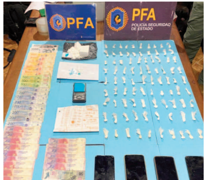
Se incautó droga, plata y teléfonos celulares.

Los aprehendidos, todos ellos mayores de edad y de nacionalidad argentina, quedaron junto con los elementos secuestrados a disposición del magistrado interventor por infracción a la Ley de Drogas.