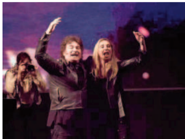
Los Milei más juntos que nunca.

Bajo un clima y rituales similares a los de un acto peronista, Karina destacó la llegada a la Presidencia por lo “inédito” y el “gran milagro” de acceder a la Casa Rosada “sin tener partido”. “Algo que nunca había pasado en la historia”, definió. “Es verdad que no teníamos partido -continuo-, pero teníamos lo más importante, que eran las palabras de Javier Milei y la gente con todas las ganas de que esto pudiera cambiar para siempre”. Tras esa introducción, el mensaje del “Jefe” adquirió un cariz confrontativo y de antagonismo. Desde el mismo sitio desde donde Milei cerró su campaña en 2021, cuando se postuló como diputado nacional, destacó el crecimiento de los libertarios desde entonces e hizo