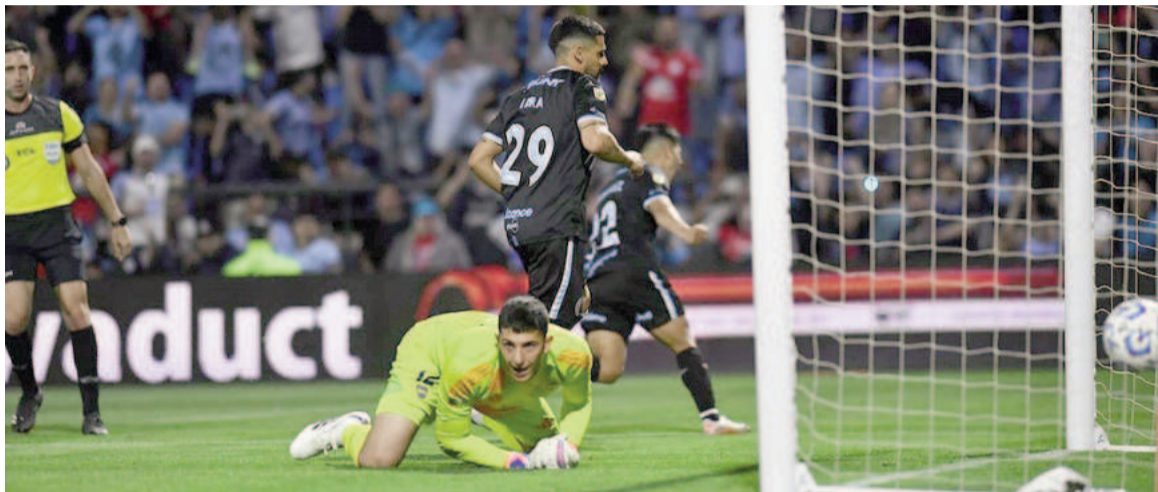
El pirata derrotó al equipo de la ribera en Córdoba.