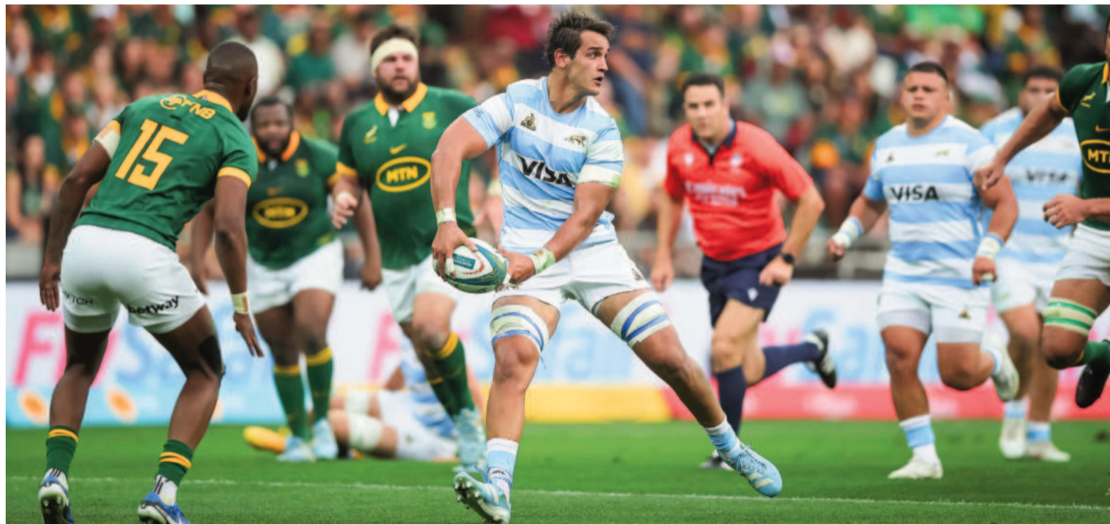
Pese a la derrota de ayer, Los Pumas cerraron un gran torneo, con algunas victorias notables.

Los Springboks ganaron como locales 48 a 7 en Nelspruit y se consagraron campeones, cerrando el torneo tomándose revancha de lo sucedido una semana atrás cuando cayeron frente al seleccionado argentino en Santiago del Estero.