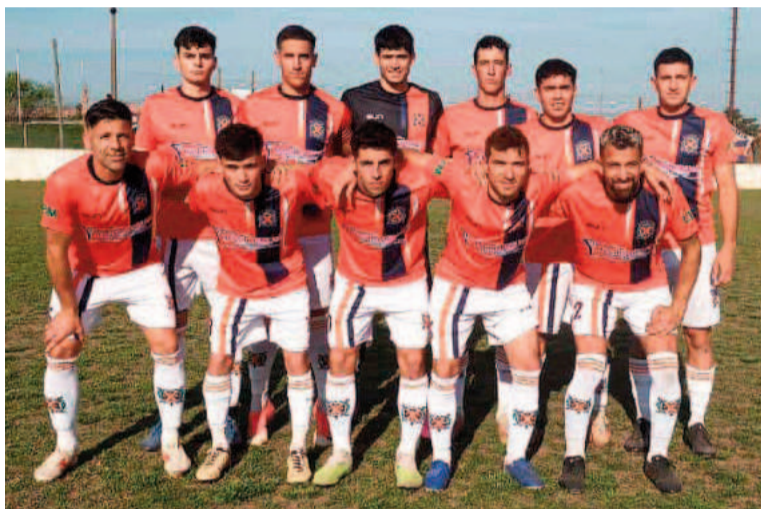
El equipo de la ribera consiguió una victoria para llegar al segundo puesto de su grupo.