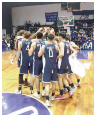
Somisa continúa a paso firme en el Grupo B, en el que es líder con puntaje ideal.