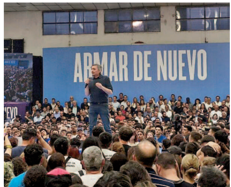
M ximo Kirchner encabez  el acto en el Atenas platense.

El l der de La C mpora dijo que “siempre estuvimos para ayudar a todos los compa eros y compa eras