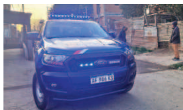
Incendio fatal en zona oeste.

La víctima del incendio quedó atrapada en su vivienda en el momento en el que ardió el fuego y el impacto del techo colapsado en su cuerpo le provocó la muerte en el acto. En principio, el fallecido padecía una discapacidad motriz, de acuerdo a la información brindada.