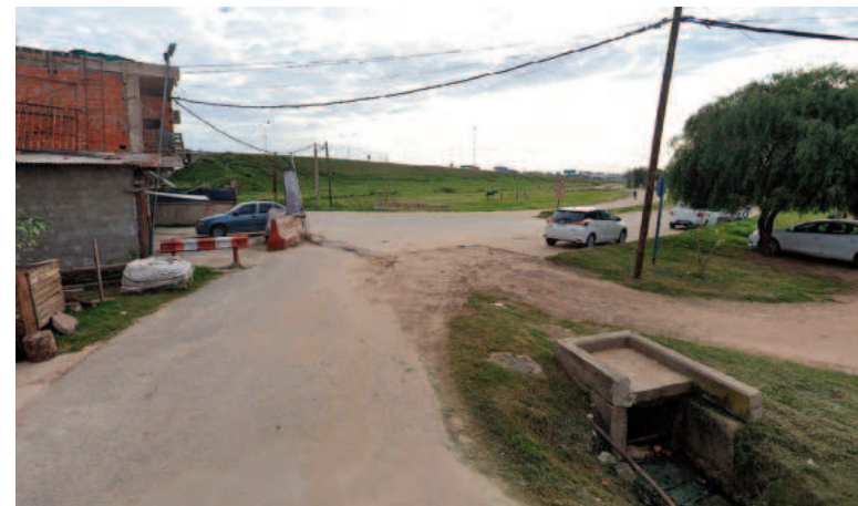
En zona oeste de Rosario balearon a un joven.

El hecho fue en Calle 1821 y Juan Pablo II, colectora de avenida Circunvalación. La víctima fue trasladada al hospital de emergencias Heca.