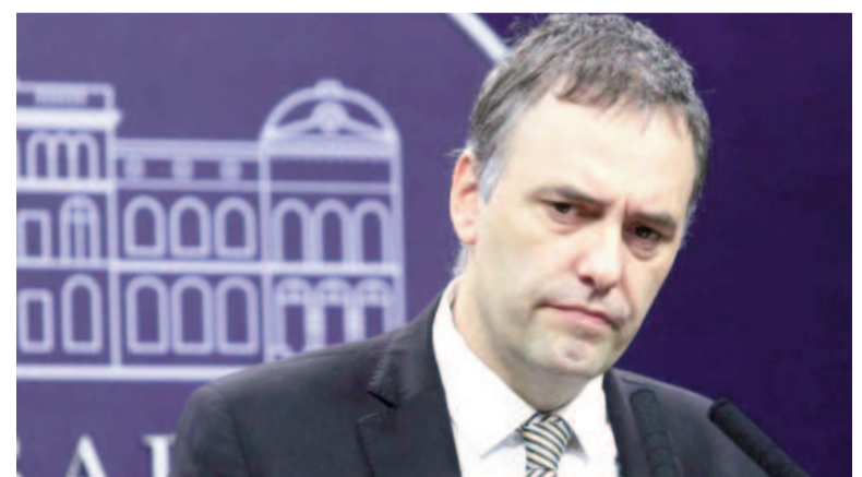
El vocero presidencial fue el menos confrontativo.

En un mensaje que generó fuerte rechazo, Romo reivindicó episodios históricos controvertidos, como la Conquista del Desierto, al tiempo que cuestionó el rol del Sumo Pontífice, sugiriendo que sus opiniones responden a intereses ajenos al país. También lo tildó de «anti-Roca», «cipayo» y «traidor a la patria», además de asociarlo con ideologías comu-