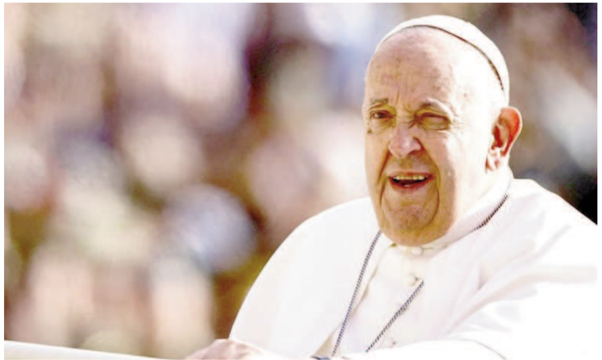
El papa Francisco criticó la gestión de Milei.

Incluso, expuso un episodio de «corrupción» por parte de un funcionario del Gobierno que habría tenido lugar recientemente, aunque evitó precisar nombres. «Me contaba un emprendedor internacional que estaba haciendo en Argentina unas