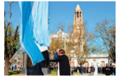
Villa Constitución celebrará un nuevo aniversario como ciudad.

La solicitud del legislador fue aceptada y tras la realización del censo, el