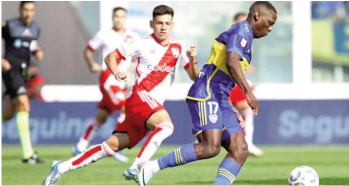
El histórico duelo entre Boca y River se robará toda la atención en la jornada de hoy.

También, el peruano Luis Advíncula se sumaría al equipo tras