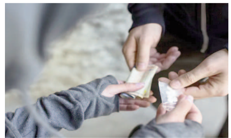
Advierten que el narcomenudeo es cada vez más frecuente en los barrios populares.

Durante la conferencia de prensa del gabinete de Axel Kicillof, el ministro de Gobierno, Carlos Bianco, señaló que la provincia de Buenos Aires es un paraguas para la gestión de Javier Milei pero advirtió que la situación en los barrios es cada vez más complicada. En ese sentido, indicó que aumentó la violencia y el narcomenudeo. «La demanda social es cada vez más grande, y nosotros lejos de ser destituyentes creo que estamos prestando un grandísimo servicio al Estado Nacional. Se lo dije al jefe de gabinete (Guillermo Francos) cuando tuve la oportunidad de juntarme con él en la Casa Rosada, fue lo primero que le dije, si ellos tenían en cuenta las situaciones de las familias en los barrios», manifestó Bianco. Y explicitó: «La situación que