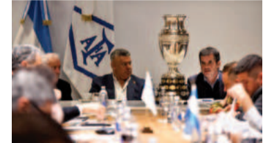
El presidente de la AFA, Claudio Tapia, en una reunión de la entidad.

de la sentencia que debe recaer en una causa" y que la pretensión de la AFA "no depende de un conocimiento exhaustivo y profundo de la materia controvertida", sino de "un análisis de mera probabilidad acerca de la existencia del derecho discutido". Por ende, el tribunal resolvió hacer lugar a la medida cautelar solicitada, ordenando "la suspensión de los efectos en los términos y alcances del Artículo 13 de la ley 26.854 de los artículos 335 y 345 del DNU 70/2023 y del Decreto Reglamentario 730/2024, hasta tanto sea dictada la sentencia definitiva".