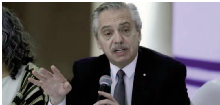
La decisión de Casación complicó al expresidente Alberto Fernández.

La denuncia, que presentó la Anses y el Ministerio de Capital Humano, que en-