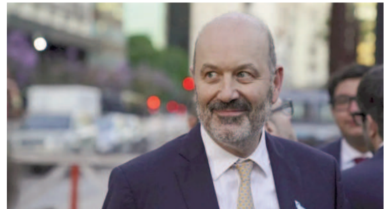
El ministro de Desregulación y Transformación del Estado, Federico Sturzenegger.

El ministro de Desregulación y Transformación del Estado, Federico Sturzenegger, justificó el veto presidencial a la ley aprobada por el Congreso para el ajuste de las jubilaciones y culpó de los problemas de la economía argentina al "Triángulo de las Bermudas" formado por lo que definió como "casta sindical, empresaria y el partido peronista", en un almuerzo de trabajo ante empresarios organizado por la Fundación Mediterránea.