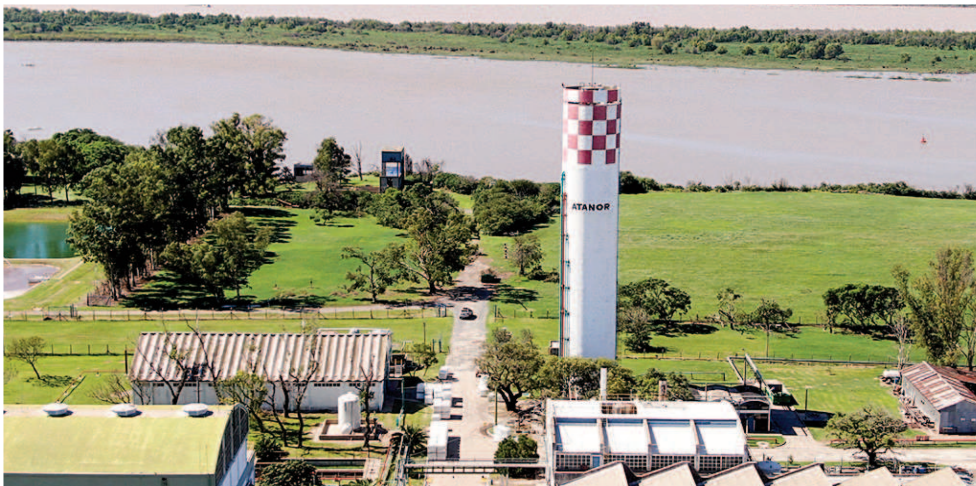
Atanor presentó un nuevo Estudio de Impacto Ambiental y Plan de Gestión Ambiental actualizado.