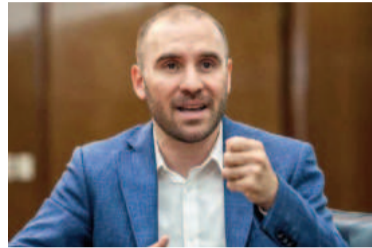
El exministro de Economía Guzmán.

El exministro de Economía Martín Guzmán reconoció que la cuarentena por la pandemia de Covid-19 durante la gestión de Alberto Fernández se prolongó porque "fue una bandera política que hacía más fuerte al Gobierno", al tiempo que consideró que para él fue "más larga de lo que debió haber sido".