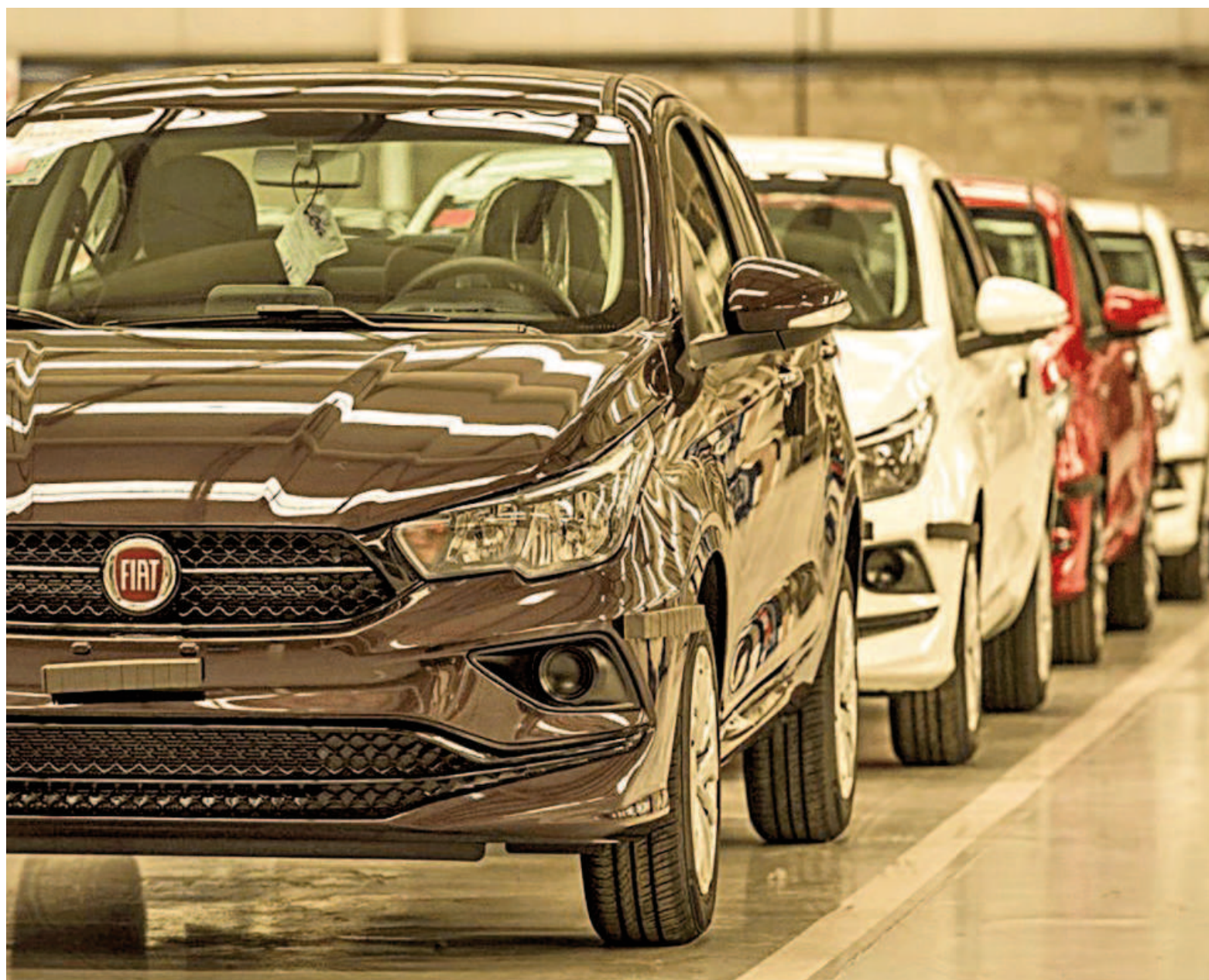
En agosto de 2024 se vendieron 101 unidades en San Nicolás, mientras que en el mismo mes de 2023 habían sido 113 las operaciones concretadas.

Estos datos confirman la recuperación que el mercado automotor había experimentado en julio, cuando las 43.150 unidades vendidas al público ese mes recortaron a la mitad (9%) la caída promedio que el sector había tenido en los meses previos, en un contexto de estabilización del tipo de cambio, descenso de la inflación y baja de tasas de interés. Ese mes, el financiamiento explicó el 41,7% de las operaciones, un total de 17.989 unidades, que significaron un crecimiento del 32,4% contra julio de 2023, había informado Acara la semana pasada.