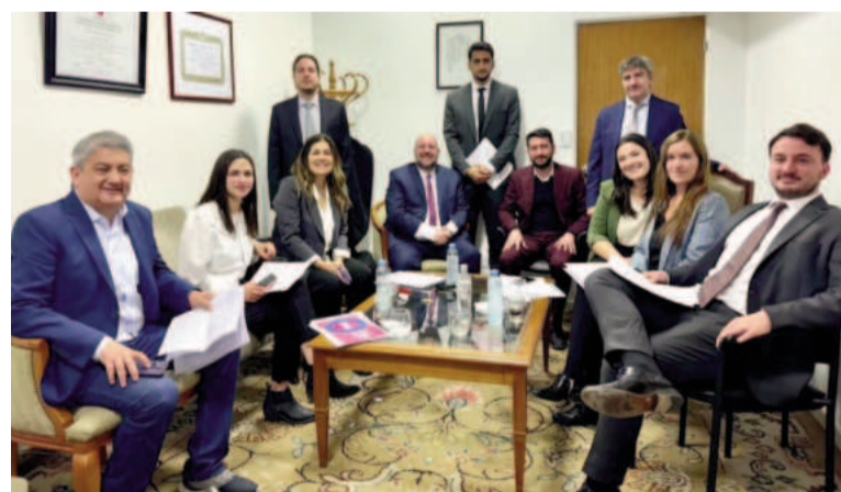
Legisladores de distintos espacios buscan unificarse en un bloque.