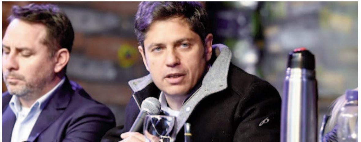
El gobernador bonaerense, Axel Kicillof, presentó el proyecto del Régimen Provincial de Inversiones Estratégicas.

Bajo la consigna “En defensa de la Industria Nacional”, el encuentro tuvo lugar en la sede de