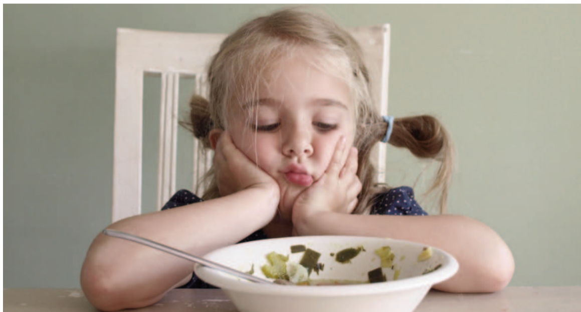
La falta de nutrientes en la infancia impacta negativamente en el crecimiento, la inmunidad y el desarrollo cognitivo. ILUSTRACIÓN

neofobia alimentaria poseen una dieta con alto contenido de grasas. A su vez, presentan poca variación en el consumo de verduras y frutas, tan solo el 20% de las cantidades recomendadas, según señalaron en un informe reciente de la Fundación Interamericana del Corazón y Unicef. Estos alimentos contienen fibra, esencial para una buena digestión y absorción de nutrientes ya que contribuye al buen funcionamiento de la microbiota intestinal.