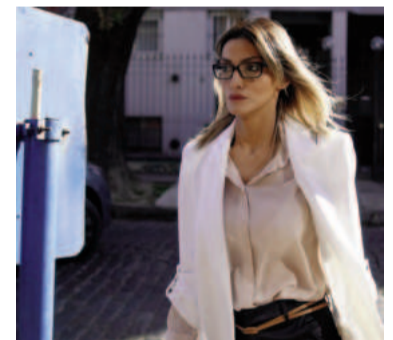
Pacchi declarará la próxima semana.

Estas declaraciones testimoniales se escucharán por la mañana con la presencia de los abogados de Fernández y Yañez, y luego la Fiscalía abrirá los sobres delante de los letrados para conocer los testimonios que aportó el ex presidente. En base a ello se resolverá si se los cita o no a declarar en persona.