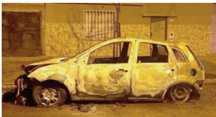
Así quedó el vehículo incendiado.

Además aseguró desconocer a los autores del ataque incendiario ya que, según sostuvo, no tiene problemas con nadie.