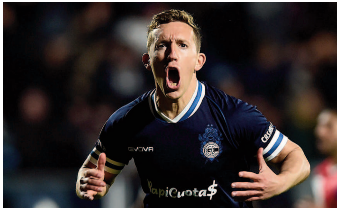
El Lobo ganó sobre la hora en el Bosque. WEB

Con gol de penal de De Blasis, a los 44 del segundo tiempo, el Tripero sumó su tercer triunfo en los últimos cuatro partidos. Galván vio la roja en el Bicho, que terminó muy caliente con el árbitro Martínez.