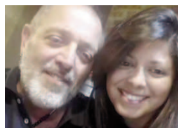
Musse junto a su hija.

siera saber si alguien lo va a llamar a declarar", agregó Musse.