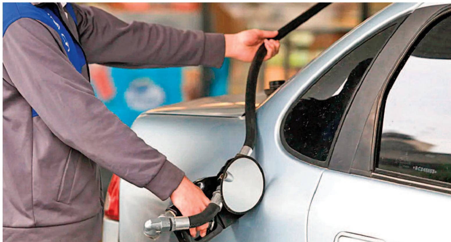
El tipo de combustible que más subió en términos porcentuales fue la nafta súper: la suba acumulada es del 307%.

En la estación Dapsa los nuevos valores son: nafta súper $1149;