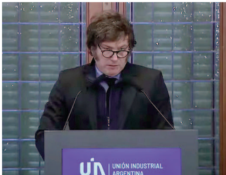
Milei, en la sede de la UIA, ratificó la decisión tomada respecto al Impuesto PAIS.

“Con nosotros eso se acabó. Así como esta mañana lo bajamos un 10%, en diciembre, lo vamos a eli-