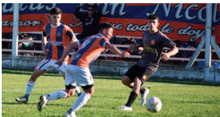
El clásico de la ciudad quedó en manos del Rojo, vestido de gris.