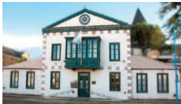
La Legislatura de Tierra del Fuego en el ojo de la tormenta.

Tierra del Fuego, con mayor cantidad de asesores por legislador