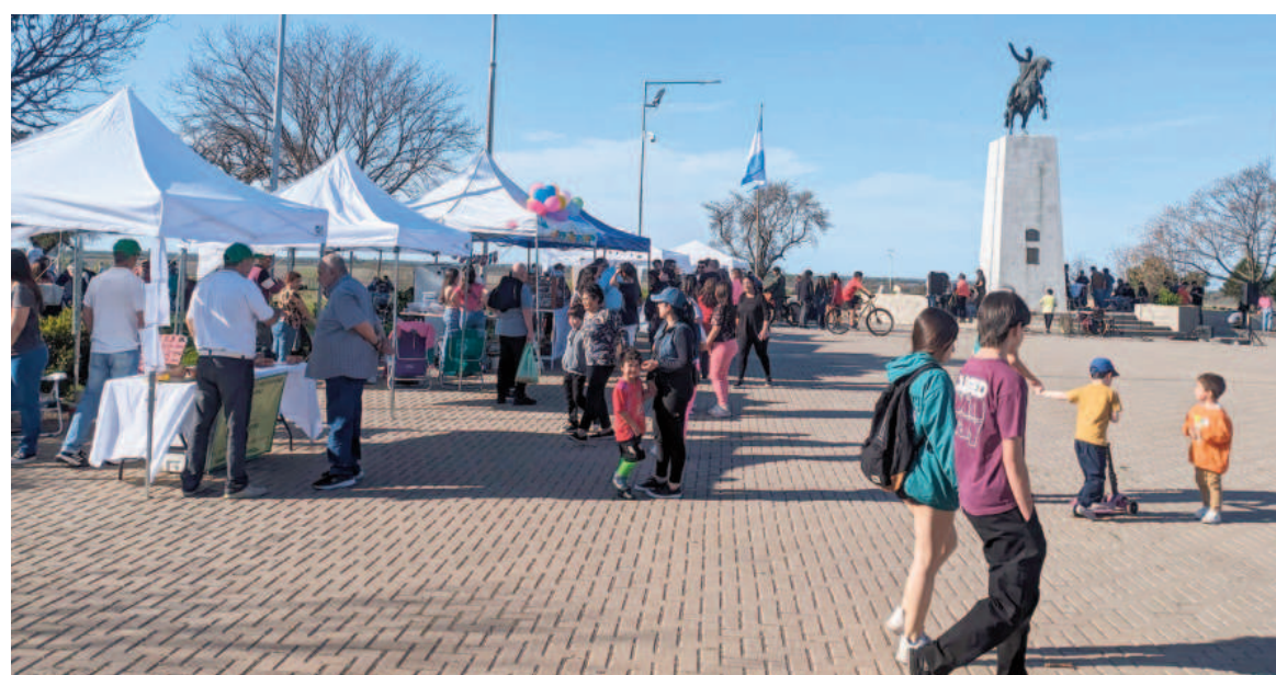
FERIA DE ALIMENTOS SALUDABLES EN EL PARQUE SAN MARTÍN ENTREGARÁN A DOMICILIO

El SMN afirmó que el pronóstico climático trimestral se realiza sobre la base del análisis de las previsiones numéricas experimentales de los principales modelos globales de simulación del clima y modelos estadísticos nacionales, sumado al análisis de la evolución de las condiciones oceánicas y atmosféricas. En este sentido, está basado en un consenso consolidado a partir de esas diversas fuentes. Las acciones tomadas o dejadas de tomar en función de la información contenida en este boletín son de completa responsabilidad del usuario.