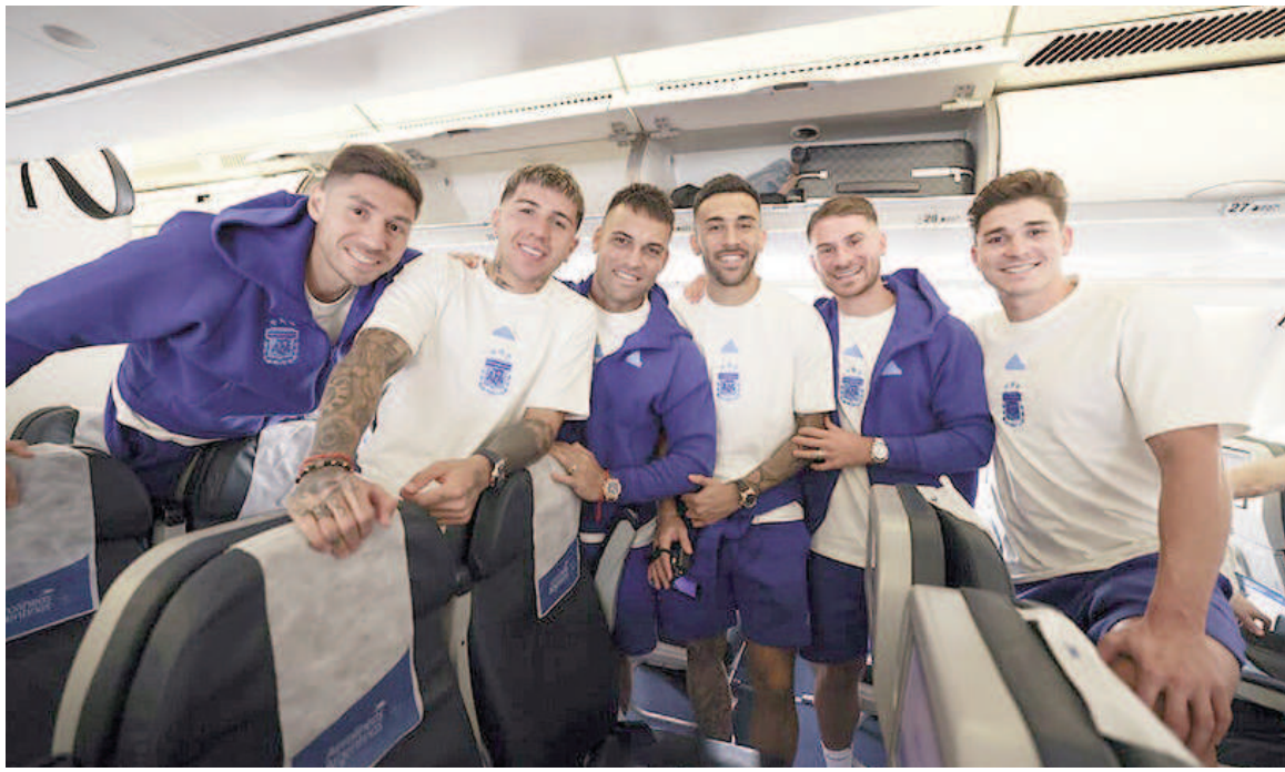
Pura confianza en el plantel argentino que viajó rumbo a Barranquilla.

Si bien el dolor lumbar no le impidió ser citado a la Mayor y participar de los entrenamientos en el predio de Ezeiza, el cuerpo técnico no lo vio en óptimas condiciones desde lo físico y es por eso que Musso quedó afuera del banco de suplentes el jue-