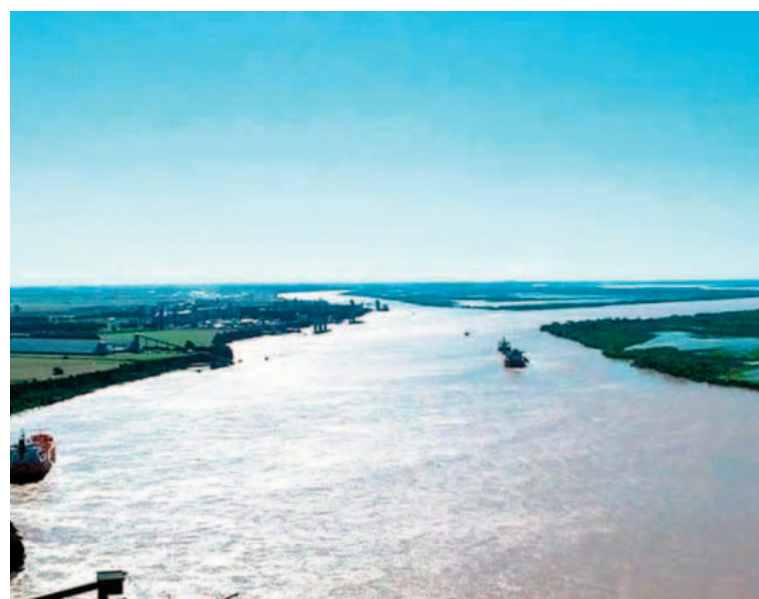
Las recientes lluvias no alcanzan para compensar el déficit regional.

La escasez del recurso hídrico puede provocar problemas de diversa índole, desde los usos humanos del río (navegación, generación de energía, comercio exterior, toma de agua dulce para potabilizar) hasta en la salud del ecosistema de humedales característicos del Paraná,