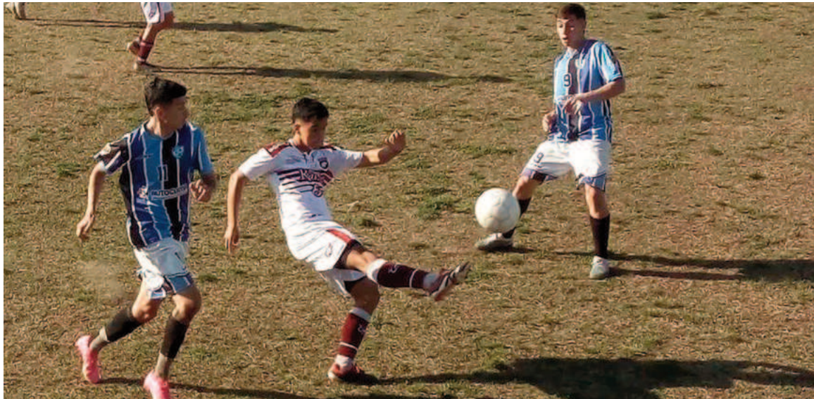
La Academia consiguió su primera victoria en el Clausura y es escolta en la Zona C.

En lo que fue una sólida actuación de su parte, tuvo un buen arranque Conesa. Pese a tener viento en contra (se hacía notar) arrinconó a Defensores y generó preocupación con tiros libres y córners. La pegada de Viñale especialmente generó un par