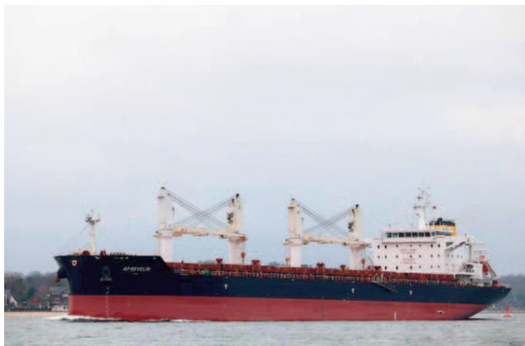
Tras estar varado, el buque AP Revelin logró navegar nuevamente.

La bajante del río Paraná preocupa a las autoridades que afirmaron que "hay varios barcos que no salen de los puertos porque el río sigue bajando y, sencillamente, no se puede navegar