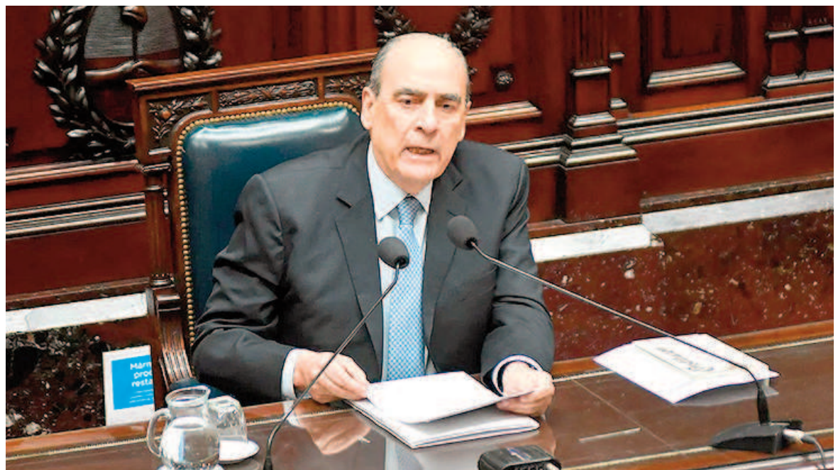
Internaron al jefe de Gabinete, Guillermo Francos.

didada súbita de la conciencia, por la que debió ser internado donde permanece en observación. Tras la asistencia médica, Francos encuentra estable y a la espera de los resultados de los estudios. Al momento, el presidente Javier Milei no mantuvo comunicación con su jefe de Gabinete, pero desde el Poder Ejecutivo son optimistas con su situación, que siguen de cerca. Antes de ser coordinador de ministros, Francos se desempeñó como diputado nacional, presidente del Banco Provincia durante la gestión de Daniel Scioli y también representó a la Argentina en el Banco Interamericano de Desarrollo bajo el mandato de Alberto Fernández. Pese al llamado de atención que significó este episodio, fuentes oficiales dejaron en claro que el jefe de Gabinete se recupera favorablemente.