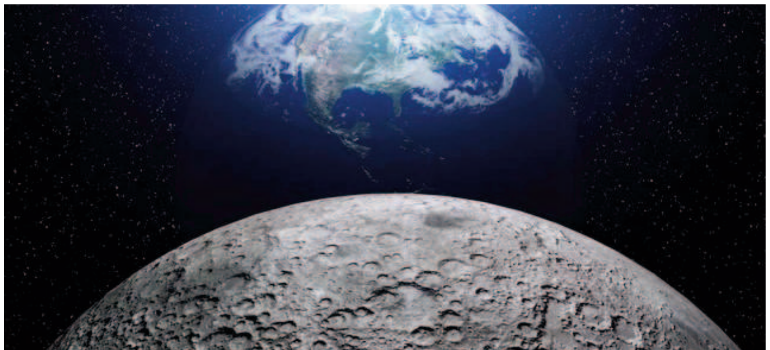
Eventualmente, la Luna alcanzará una órbita estable en la que dejará de alejarse de la Tierra.

Desde tiempos antiguos, la Luna ha sido un componente fundamental en la vida y los ciclos de nuestro planeta. Sin embargo, un fenómeno natural pone en riesgo su visibilidad futura. A medida que la rotación se ralentiza, la Luna se aleja en respuesta a estas modificaciones.