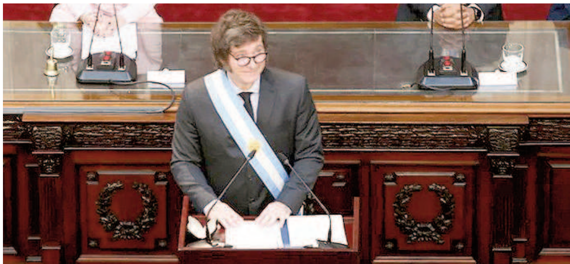
El propio presidente presentará el Presupuesto 2025 en el Congreso.

Según pudo saber la agencia de noticias NA de altas fuentes parlamentarias del oficialismo, la versión más fuerte por estas horas es que el recinto de la Cámara de Diputados podría constituirse en la Comisión