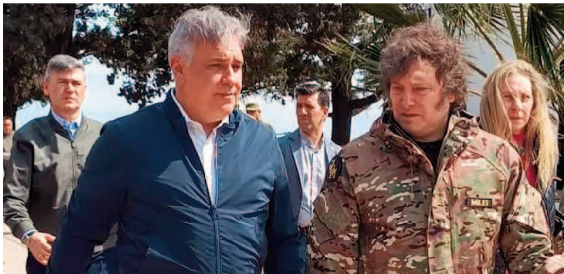
El gobernador cordobés Llaryora recibió a Milei para visitar las zonas azotadas por los incendios en Córdoba.

El presidente alteró su agenda debido a estas circunstancias. El anuncio sobre el viaje lo hizo el vocero presi-