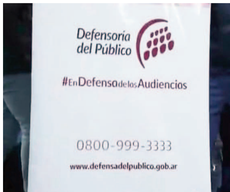
Defensoría del Público se encarga de recibir denuncias.

La entidad fue creada como parte de la Ley 26.522 de Servicios de Comunicación Audiovisual y una de sus funciones principales es la de