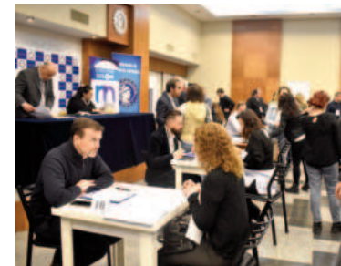
La II Ronda de Negocios se realizó el 11 de octubre del año pasado.

Desde CAME explicaron que estas rondas de negocios pueden ser multisectoriales (como la de la Federación de Comercio e Industria de San Nicolás), sectoriales o inversas internacionales, convirtiéndose en "una herramienta de suma utilidad, abriendo caminos no solo a la concreción de transacciones, sino también a rubros complementarios que hacen al desarrollo empresarial, como son calidad, marketing, imagen corporativa, logística, distribución, comercio exterior, gráfica, diseño industrial, entre otros".