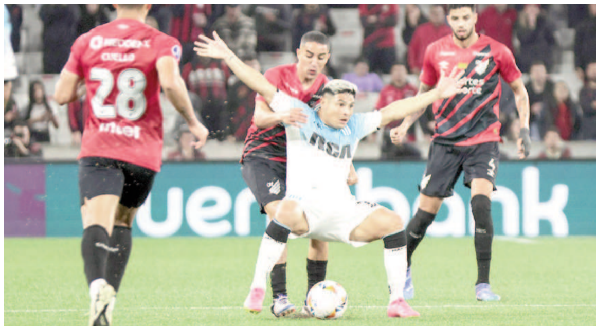
El equipo de Costas cayó 1 a 0 en el partido de ida en Brasil.

De esta manera, Paranaense, que tampoco está bien en el certamen de Brasil, tendrá el estreno como técnico de Luis «Lucho» González, el exfutbolista argentino que es fanático de Racing, pero que nunca jugó en el equipo de Avellaneda.