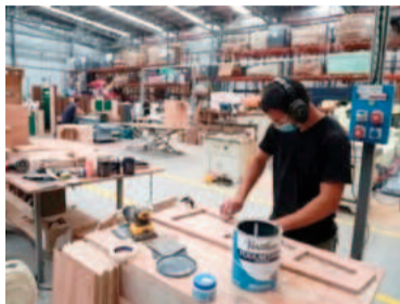
Micropymes en extinción.

Desde la llegada de Javier Milei a la presidencia, la economía argentina ha vivido una serie de cambios radicales que, si bien fueron celebrados por algunos sectores, han golpeado duramente a las pequeñas y medianas empresas (pymes). Un reciente informe de la Superintendencia de Riesgos de Trabajo (SRT), reveló que durante los primeros seis meses del año cerraron sus puertas unas 9.000 micropymes (empresas de menos de cinco trabajadores).