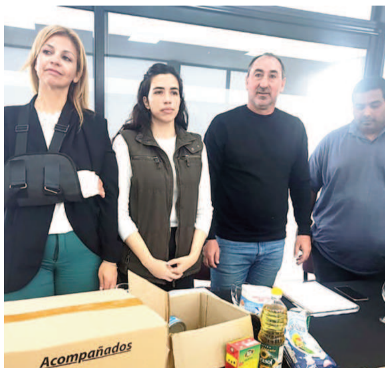
Funcionarios municipales se refirieron al controvertido tema de los alimentos.

Además, señaló que “esta municipalización es principalmente para los proveedores locales y para todo lo que tiene que ver con el movimiento interno. En los concursos de precios y en las distintas compras intervienen proveedores locales. Por eso, a la hora de llevar a cabo este programa, se dividió en distintos sectores, teniendo en cuenta las localidades. En Pérez Millán ya