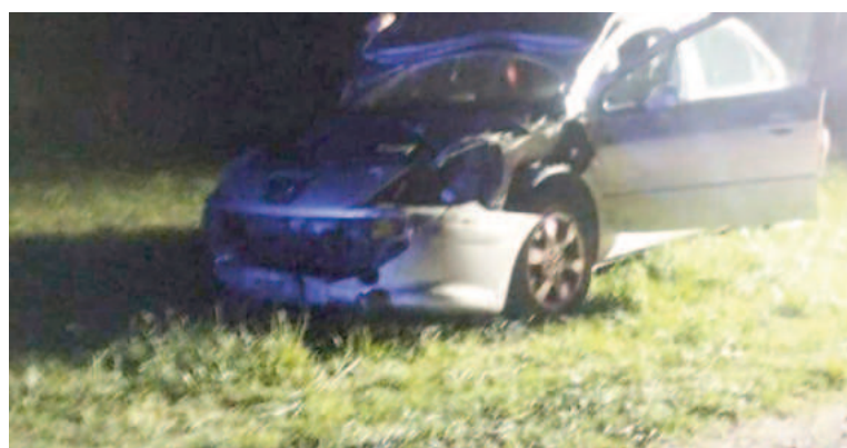
El impacto contra un animal sería la causa del siniestro.

Ocariz y su acompañante, una mujer mayor de edad, sufrieron golpes pero sin experimentar lesiones de gravedad. Ambos fueron trasladados al Hospital José María Gomendio, según se conoció. Tomaron intervención en el hecho personal policial del Destacamento de La Violeta y Bomberos Voluntarios de Pérez Millán.