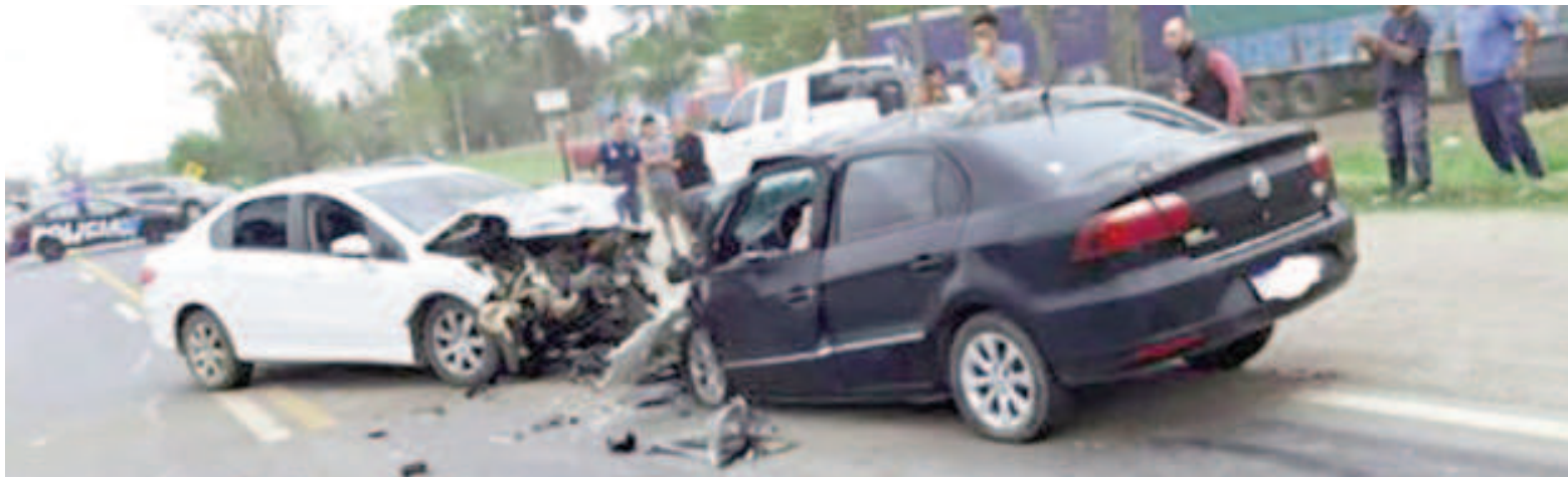
Un choque frontal en la Ruta Nacional 34 dejó como saldo una víctima fatal y dos heridos.

Por razones que aún se tratan de establecer, los vehículos chocaron de frente, dejando atrapados a los ocupantes. Se procedió de inmediato a realizar un perímetro para desviar el tránsito y evitar nuevos accidentes