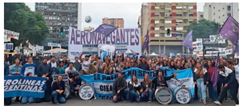
La protesta de los gremios fue la excusa para retomar el debate de la privatización.

Está claro que el Gobierno quiere aprovechar el clima de malestar generado por los paros de los aeronáuticos para avanzar con la privatización. «La coyuntura que se vive en el mer-