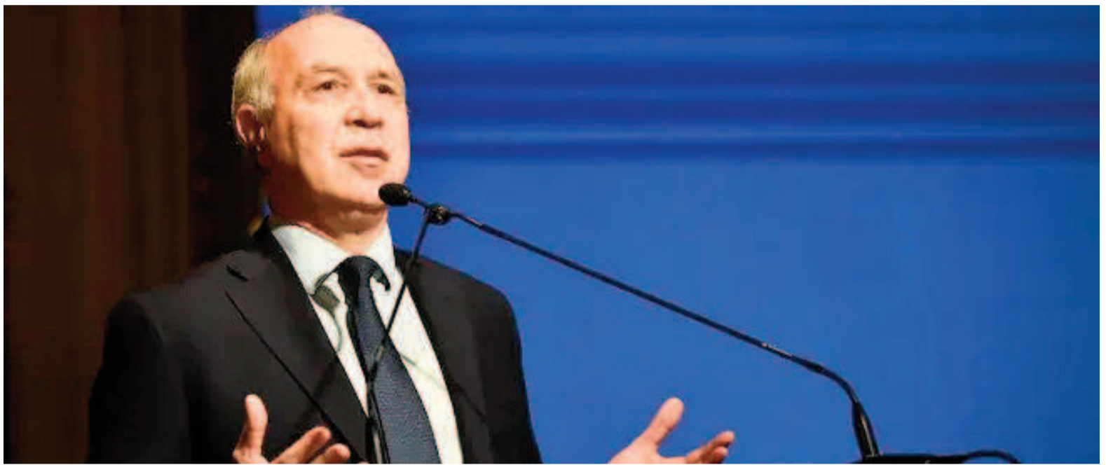
Ricardo Lorenzetti advirtió que una Corte con tres integrantes no es ideal.

La interna de la Corte había dejado a Lorenzetti fuera del acuerdo que llevó a la reelección de Rosatti, quien jugó en tándem con Carlos