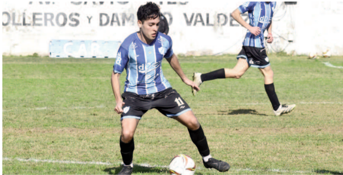
Paraná jugará ante Defensores a puertas cerradas. EL NORTE

Luego de un receso "obligado" por la falta de efectivos policiales, este fin de semana regresa el Clausura "Javier Yacuzzi" con la quinta fecha, última de la primera rueda. El sábado abren la acción El Fortín vs. Regatas, en cancha de Fútbol San Nicolás.