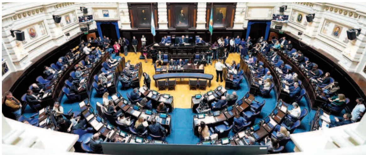
Los diputados bonaerenses le dieron media sanción al RIGI de Kicillof.

Además, se otorgarán beneficios adicionales para proyectos que promuevan políticas de género, sustitución de importaciones y sostenibilidad ambiental, entre otros criterios.