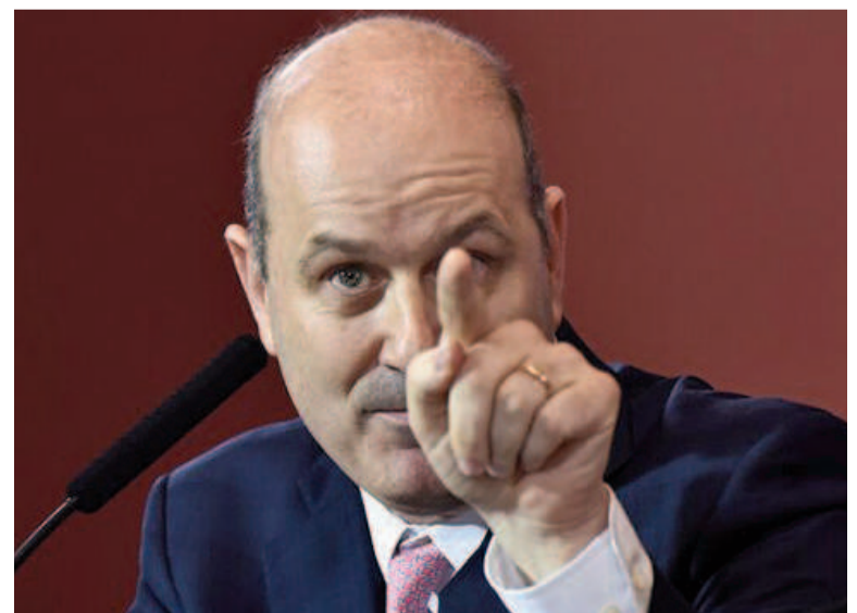
El ministro de Desregulación, Federico Sturzenegger, uno de los ideólogos de la reforma.

Otra novedad es la definición de una indemnización especial para casos de despido por discriminación. Este tipo de despido, que anteriormente no contaba con una regulación específica, ahora tendrá una compensación adicional, lo que busca proteger a los trabajadores de posibles abusos por parte de sus empleadores.