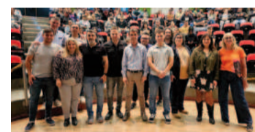
En el auditorio de la UOM se lanzó oficialmente este programa.

Además de mejorar las competencias laborales, este programa tiene como