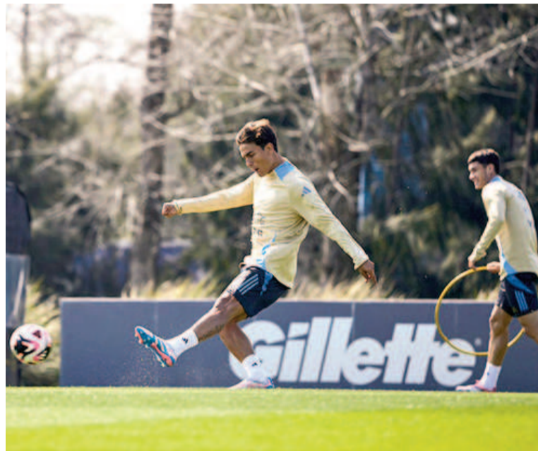
Paulo Dybala, con chances de ir desde el arranque en Barranquilla.

Con las incógnitas alrededor de Mac Allister y González, la posibilidad de cambios en el once inicial para el partido a Colombia está latente. Así, crecen las chances de jugadores como Leandro Paredes y Gio Lo Celso