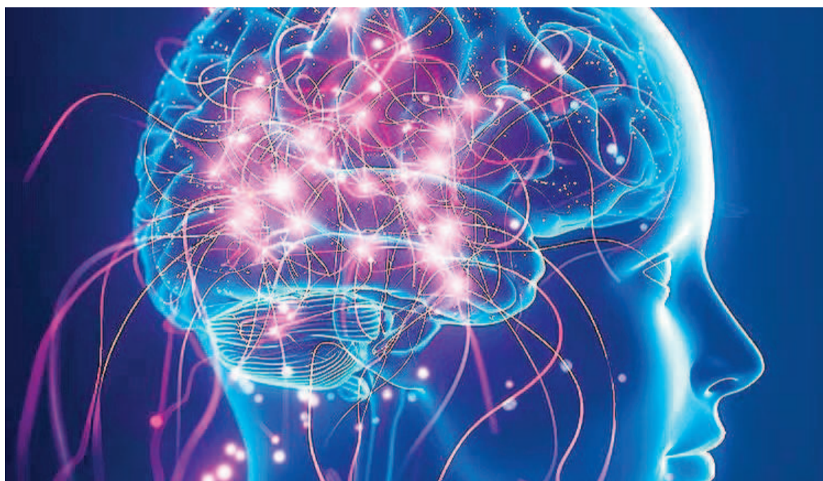
Asociar nuevos aprendizajes con experiencias personales mejora la retención.

Lisa Genova, licenciada en Biopsicología y doctora en Neurociencia de la Universidad de Harvard, autora de "Recordar: la ciencia de la memoria y el arte de olvidar", expresó que puede resultar más difícil acceder a los recuerdos con el tiempo y la edad. "Es perfectamente normal y no necesariamente indica enfermedad o dolencia, pero aun así puede resultar inquietante. Sin embargo, hay cosas que puedes hacer ahora mismo para volverte más resistente al olvido", explicó en un artículo en CNBC News.