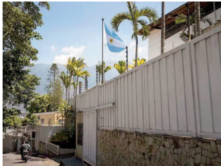
La embajada argentina en Caracas asediada por tropas oficiales.

La Embajada de Argentina en Caracas quedó bajo la custodia de Brasil a principios de agosto, luego de que el régimen chavista expulsara a los diplomáticos argentinos bajo el argumento de una injerencia en los asuntos internos. Sin embargo, a poco más de un mes de este episodio, Maduro revocó