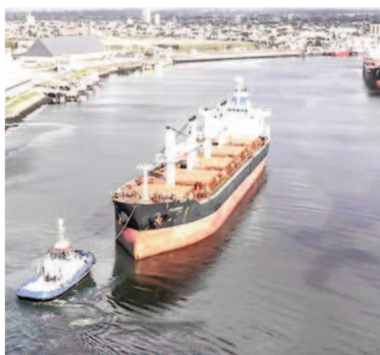
El campo se abroquela y mete presión a Axel Kicillof por una licitación en un puerto clave para las exportaciones.

En especial, remarcan que algunos exportadores «consideran que los intermediarios se llevan un porcentaje elevado de las ganancias» observan.