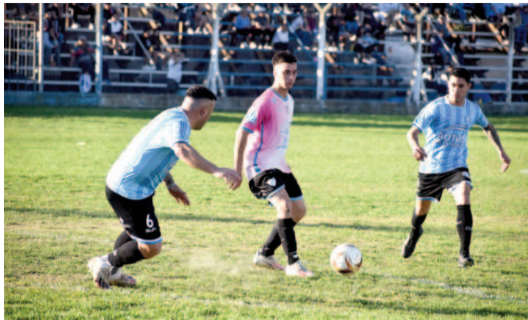
Paraná ganó en casa, llegó a los siete puntos y es líder de la Zona C.