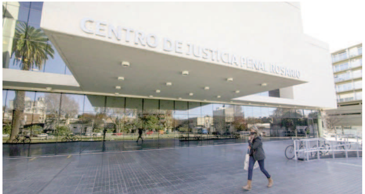
El juez Gonzalo Fernández Bussy le dio prisión preventiva efectiva por el plazo de ley al acusado.

«Tratamos de que esto genere debate sobre un control o un diálogo abierto con los menores sobre el uso de las redes sociales y las billeteras digitales», concluyó.