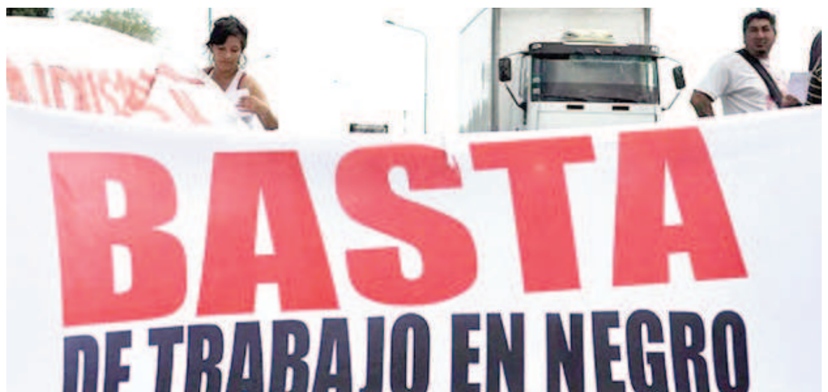
Mientras que se generaron nuevos empleos registrados en el sector privado, el número de trabajadores en negro aumentó más rápido.

El deterioro de la economía ha sido un factor clave en el aumento del trabajo en negro. Según un informe del Indec, el Producto Bruto