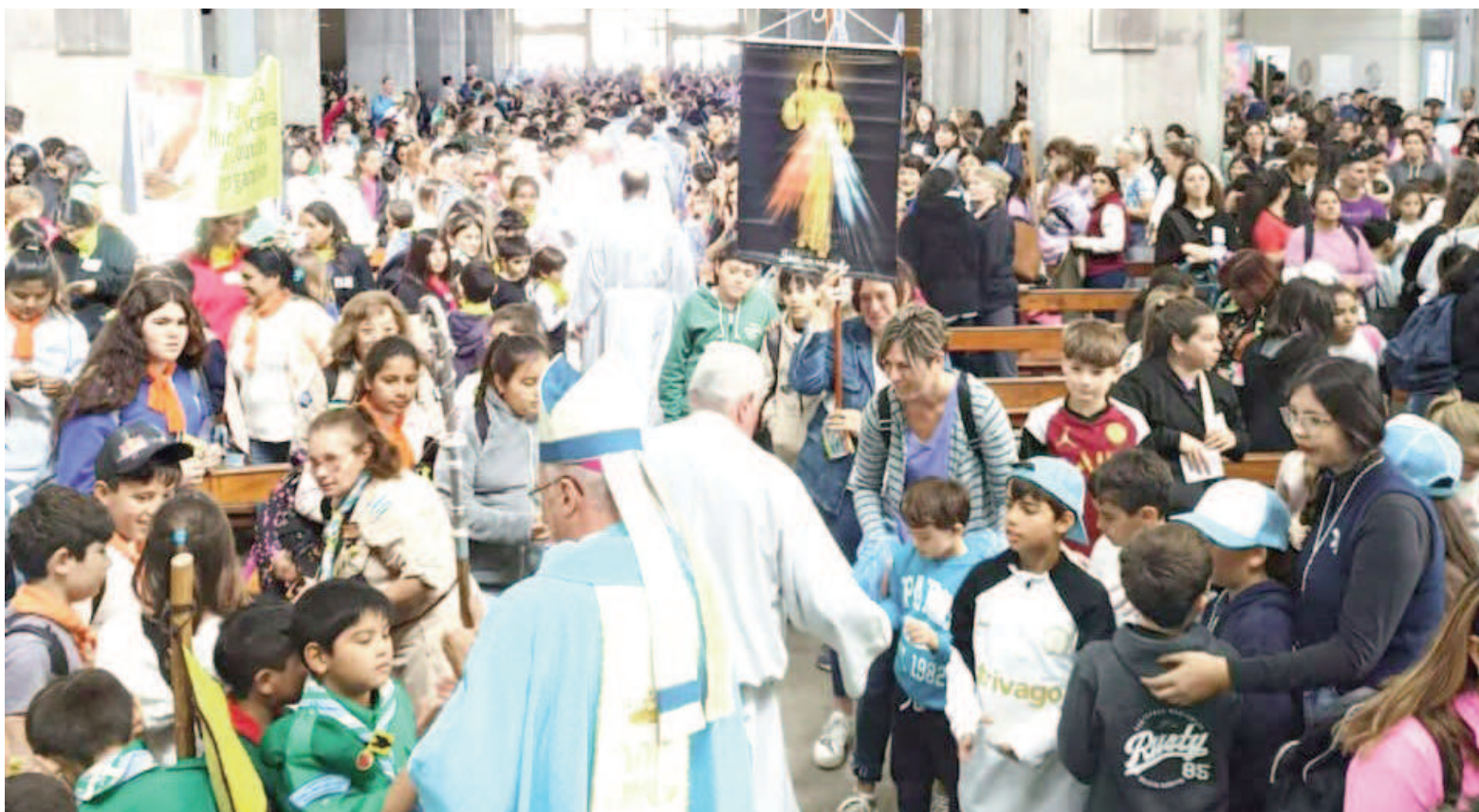
Acompañados por el buen tiempo, los niños y niñas de nuestra diócesis peregrinaron este sábado al Santuario de la Virgen del Rosario de San Nicolás.