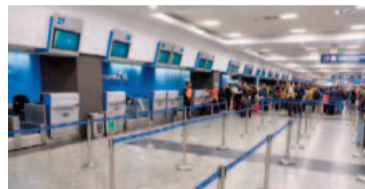
El servicio paralizado por la medida de fuerza del gremio aeronáutico.

Ayer, la Asociación de Pilotos de Líneas Aéreas (APLA) llevó adelante