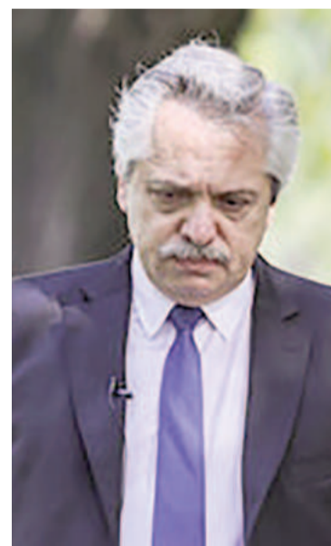
Expresidente Alberto Fernández.