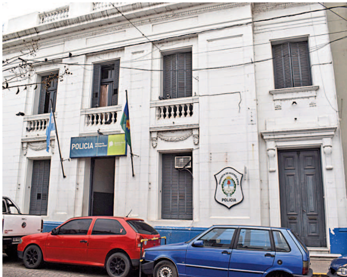
Los sucesos tuvieron lugar el pasado 28 de julio en horas de la madrugada en la Comisaría Primera.