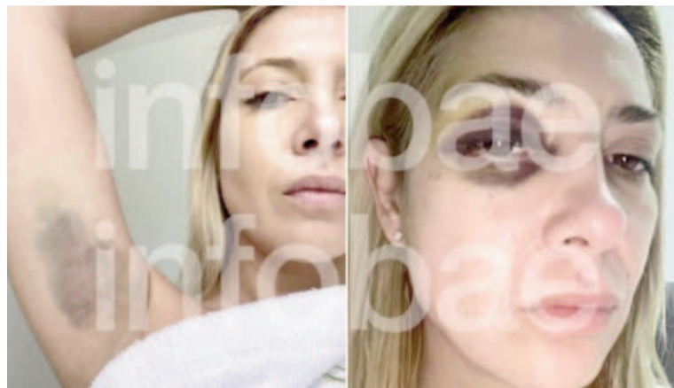
Las fotos de Infobae muestran la violencia del maltrato.