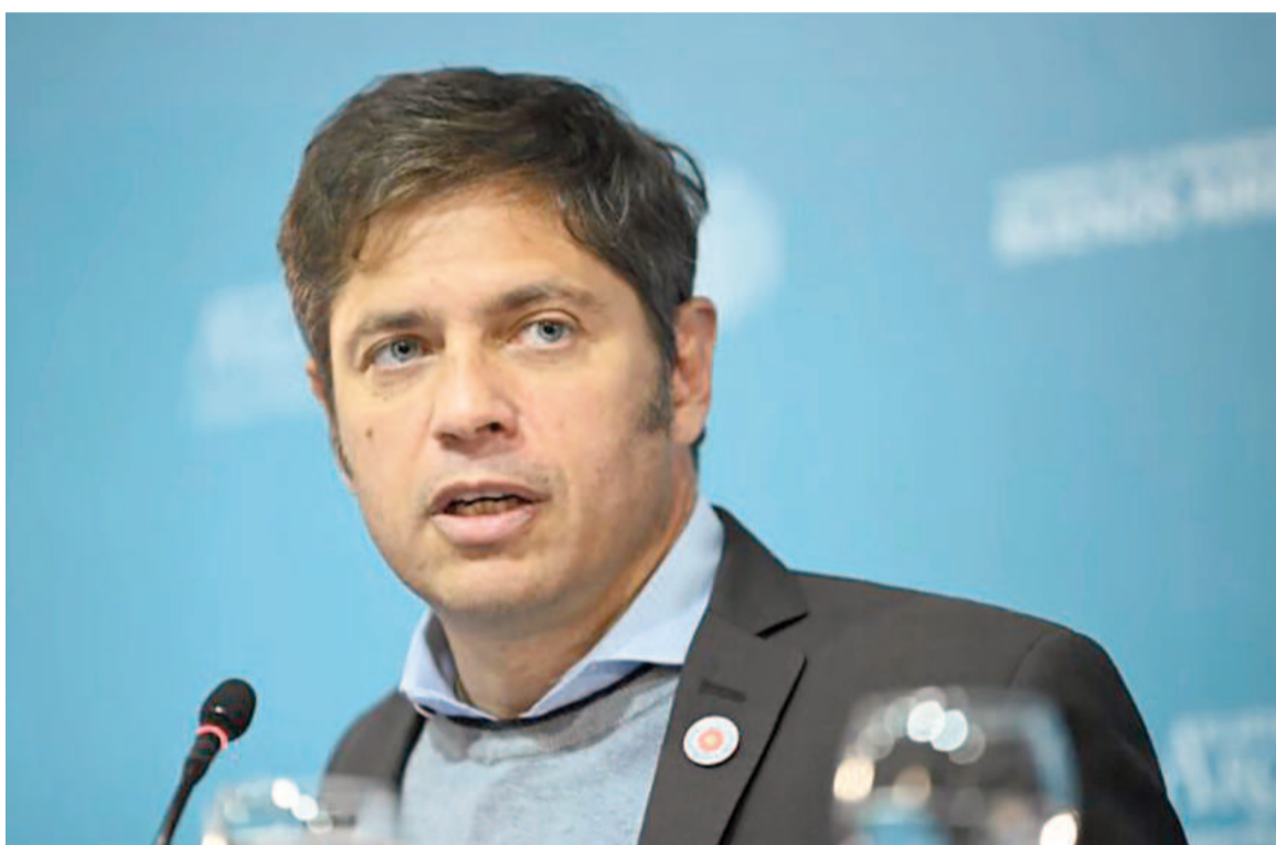
El gobernador de la provincia de Buenos Aires, Axel Kicillof.

ve para la producción y para trabajar en la disminución de las asimetrías productivas y logísticas entre las distintas provincias”, dijo. Y agregó: “Por primera vez, la provincia de Buenos Aires intervino en el debate