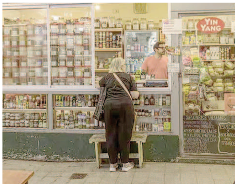
La inflación porteña fue del 5,1% en julio, por encima del 4,8% que había anotado en junio.

En tanto, “vivienda, agua, electricidad, gas y otros combustibles aumentó 5,7%, contribuyendo con 1,06 puntos porcentuales a la variación mensual del IPCBA, al impactar principalmente los incrementos en los valores de los gastos comunes por la vivienda. Le siguieron en importancia, las subas en los precios