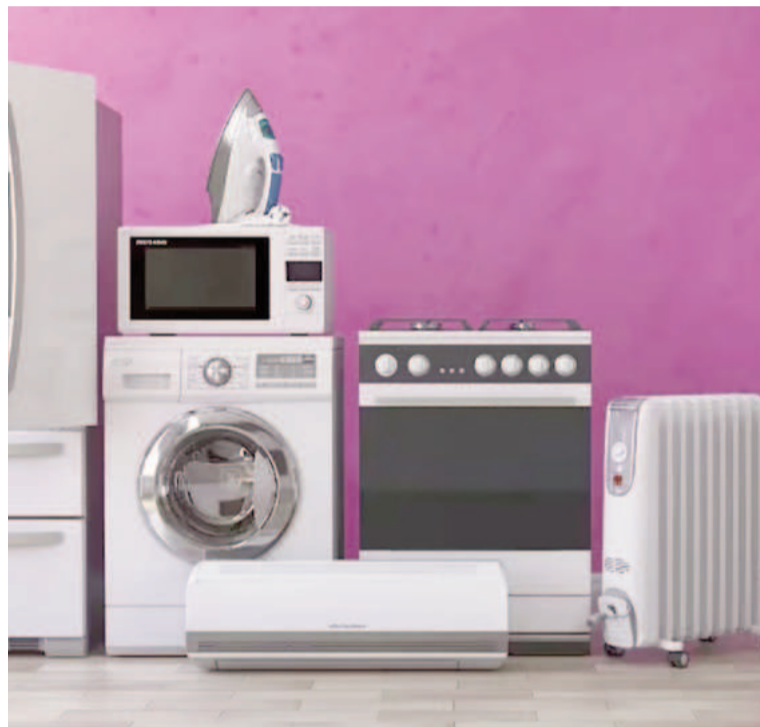
El Gobierno espera aminorar el impacto de los aumentos en las tarifas.

“El Programa de Reconversión y Eficiencia Energética tiene por objeto la reconversión de edificaciones a los efectos de reducir sus consumos energéticos y fomentar la adquisición de tecnología energéticamente eficiente así como el desarrollo de estudios y proyectos de mejora del desempeño energético, para lo cual los consumidores residenciales, comerciales, de servicios e industriales, podrán acceder al financiamiento del BANCO NACIÓN ARGENTINA (BNA), en el marco del Convenio a instrumentarse entre la