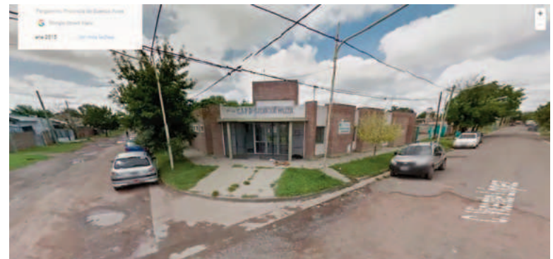
Lugar donde fue herido el menor.