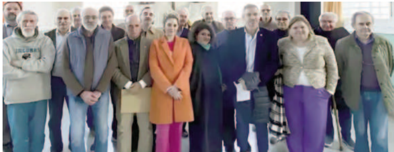
Diputados de LLA visitaron a condenados por delitos de lesa humanidad en Ezeiza.

La diputada libertaria Lourdes Arrieta presentó una denuncia penal para que se investigue a sus propios compañeros de bloque y a funcionarios de la Cámara baja y del Servicio Penitenciario por la visita que ella misma protagonizó junto a otros cinco legisladores al penal de Ezeiza para reunirse con represores condenados por delitos de lesa humanidad. La joven mendocina, al igual que su compañera Rocío Bonacci, no acató la orden del presidente de la Cámara de Diputados de bajar el perfil y continuó alimentando el escándalo. En las últimas horas volvió a asegurar que fue a la cárcel engañada por sus compañeros y que tanto Martín Menem como Gabriel Bornoroni -jefe del bloque- habían autorizado la actividad.