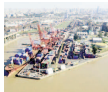
Las exportaciones en verde.

El informe destacó que los ingresos por exportaciones de los primeros seis meses del año totalizaron US$ 38.176 millones, un 14% su-