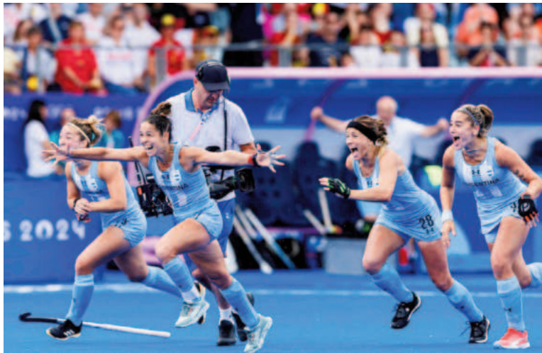
Las Leonas se subieron al podio por sexta vez en los Juegos Olímpicos.