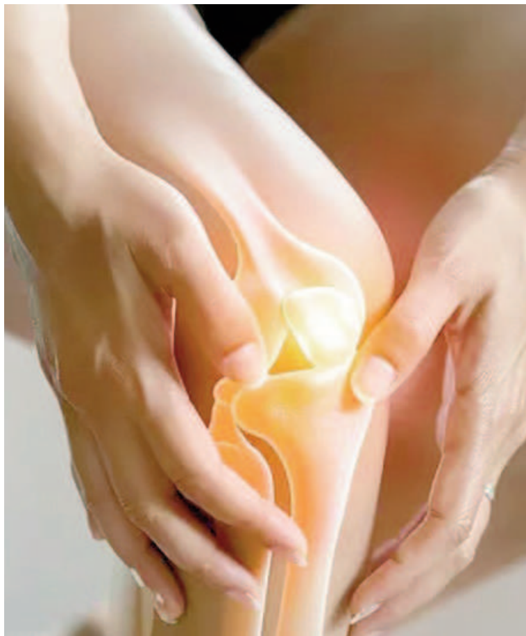
Una encuesta mundial detalla la prevalencia de problemas crónicos entre deportistas de élite.

"Por lo general, las personas con osteoartritis tienen dolor en las articulaciones y, después de descansar, rigidez (incapacidad para moverse con facilidad) durante un período corto de tiempo". Las articulaciones