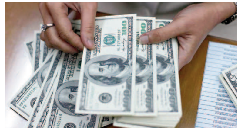
Bajó el dólar en una semana más tranquila.