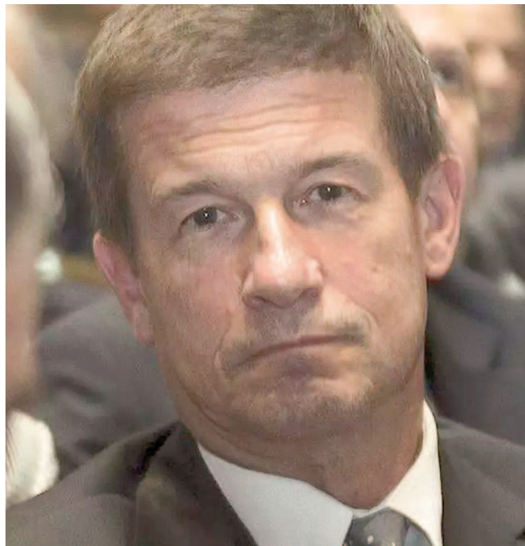
El juez federal Julián Ercolini sigue a cargo de las investigaciones.

El expresidente junto a Carreira está detallando su estrategia, poniendo foco en la salud de Fabiola Yañez. En paralelo, el expediente 2539/2024, en el cual se investiga lo denunciado por Yañez, que había tenido su origen en el Juzgado Criminal y Correccional Federal 11,