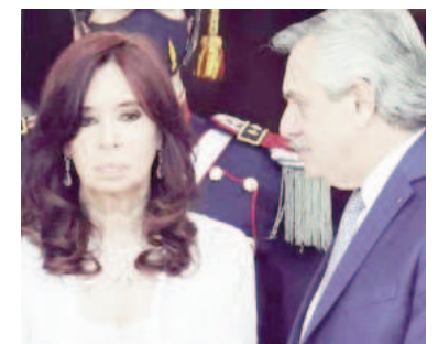
Cristina Kirchner cargó muy duro contra Fernández.

«En lo personal y como mujer que ha sido objeto (y lo sigue siendo) de las peores violencias verbales y políticas, hasta la máxima experiencia de violencia física, como fue el intento de asesinato del 1 de septiembre del 2022, expreso mi solidaridad con todas las mujeres víctimas de cualquier tipo de violencia, sin olvidar las palabras que Francisco me dijo al día siguiente de aquel hecho: 'Toda