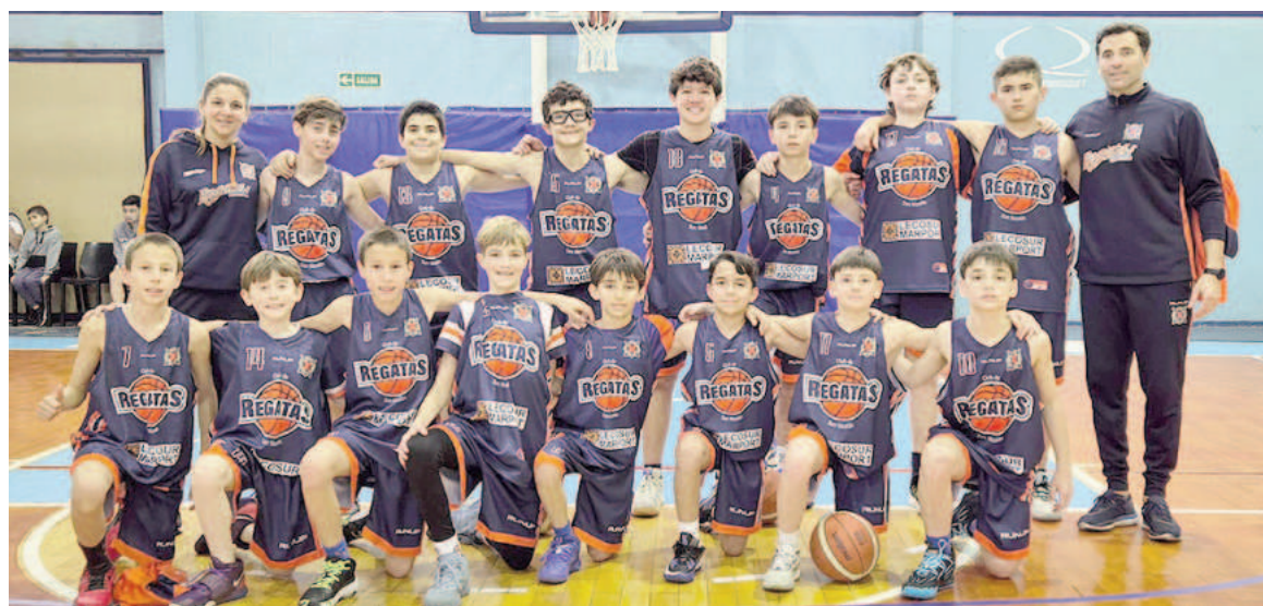
Regatas ganó sus tres partidos en la Capital Federal el pasado fin de semana.

Con 76 encuentros que se jugaron durante el fin de semana, se puso en marcha la competencia nacional del Minibásquetbol. Participaron 46 equipos divididos en cinco regiones. La siguiente fase será en septiembre. Y allí estará el club de San Nicolás.