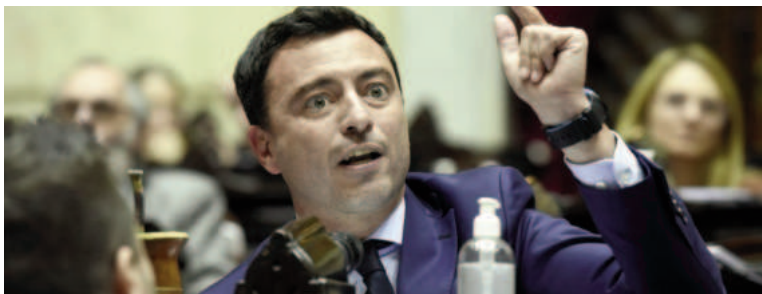
Rodrigo de Loredo, presidente del bloque de la UCR.

El bloque de la Unión Cívica Radical de la Cámara de Diputados pidió hoy una sesión especial para el miércoles próximo, luego de la convocatoria al recinto solicitada por el PRO y La Libertad Avanza para tratar un temario amplio que incluye la declaración de la esencialidad educativa.