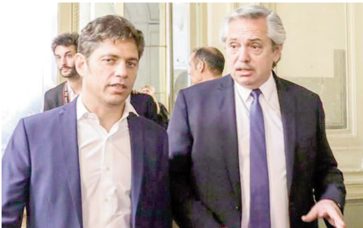
Kicillof pidió que la Justicia actúe rápido en la denuncia contra Fernández.

Es que la presencia del mandatario bonaerense se da en medio del escándalo por la denuncia de violencia contra Fernández. Y