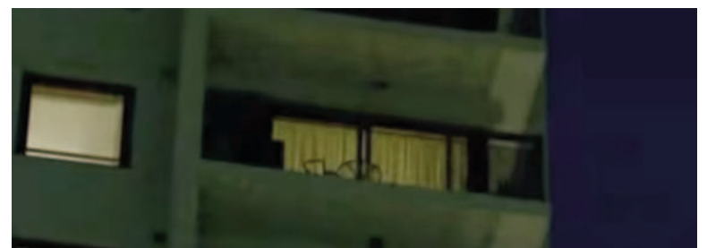
El departamento en donde vive Alberto Fernández.