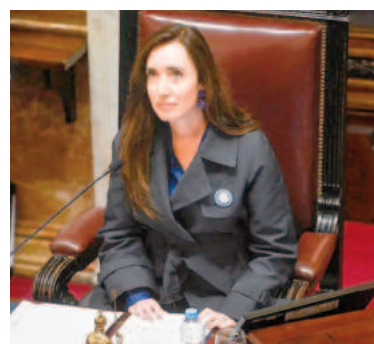
Villarruel calificó como impresentable a Fernández.

El tuit de la vice se da luego de la aparición de dos fotografías en la