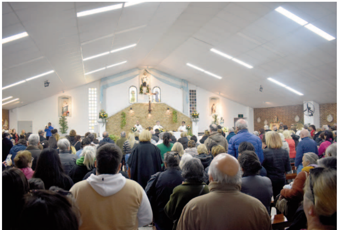
Hoy a las 15:00 se realizará la tradicional procesión por barrio Prado Español y luego la misa central en la Parroquia San Cayetano.

En este contexto de crisis, la parroquia San Cayetano elabora unas 80 raciones de comida por día para asistir a personas que se encuentran en situación de vulnerabilidad y con bajos recursos.