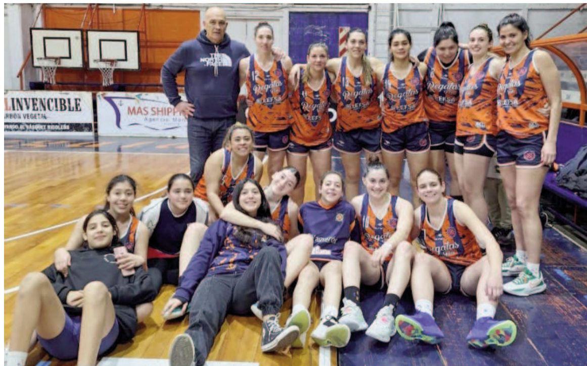
En un año de transición, Regatas se mantiene como protagonista en la Rosarina.

En cuanto a Regatas, lleva tres victorias consecutivas, después de haber arrancado el certamen con un traspie en reducto ajeno frente a Ta-