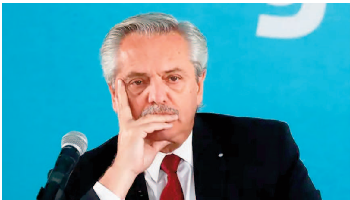
El expresidente declaró que demostrará su inocencia tras la denuncia por violencia de género.