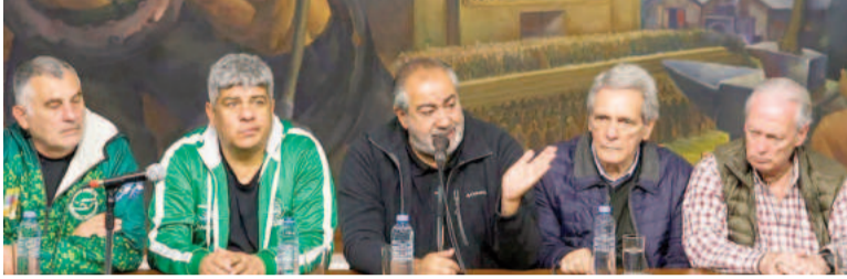
La CGT marcha este jueves a Plaza de Mayo.

La CGT, las dos CTA y los movimientos sociales encabezarán hoy una marcha en el centro porteño por San Cayetano, que sumó la incorporación de sectores de la izquierda y concluirá con un acto en Plaza de Mayo donde se leerá un documento crítico hacia el gobierno de Javier Milei. Bajo el lema «Paz, Pan, Tierra, Techo y Trabajo», los sindicatos de las tres centrales junto al Movimiento Evita, Barrios de Pie y Corriente Clasista y Combativa (CCC), conocidas como «cayetanos», confluirán en Plaza de Mayo, donde desde las 13 habrá un acto, donde denunciarán «la emergencia alimentaria, social y laboral». Desde 2016, en los años de la gestión de Mauricio Macri, la marcha se viene realizando todos los 7 de agosto, día en que se homenajea al patrono del pan y el trabajo, cuando los sindicatos y movimientos sociales convocaban masivamente con tono crítico, aunque luego bajaron el perfil en la era Alberto Fernández, con los organizadores cultivando una postura oficialista, y ahora retomaron la fecha para protestar contra las políticas de la administración de Javier Milei.