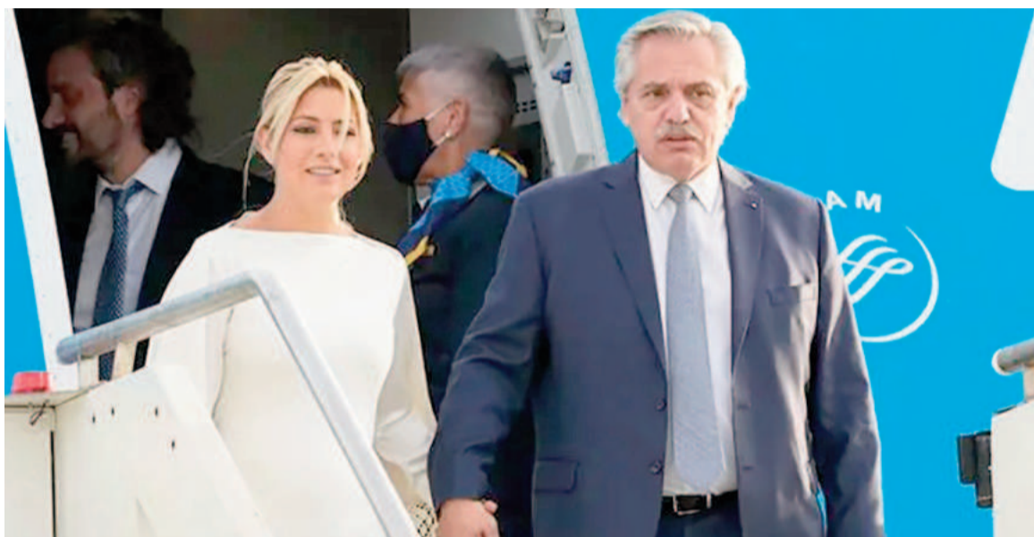
Fabiola Yañez denunció a Alberto Fernández por violencia de género.