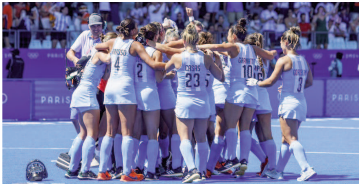
Las argentinas van por la revancha ante las neerlandesas. WEB

En la fase de grupos, las dirigidas por Fernando Ferrara avanzaron en el segundo lugar, ya que le ganaron a Estados Unidos, Sudáfrica, España y Gran Bretaña, pero empataron 3-3 frente a Australia, que finalizó con la misma cantidad de puntos y con una mejor diferencia de gol.