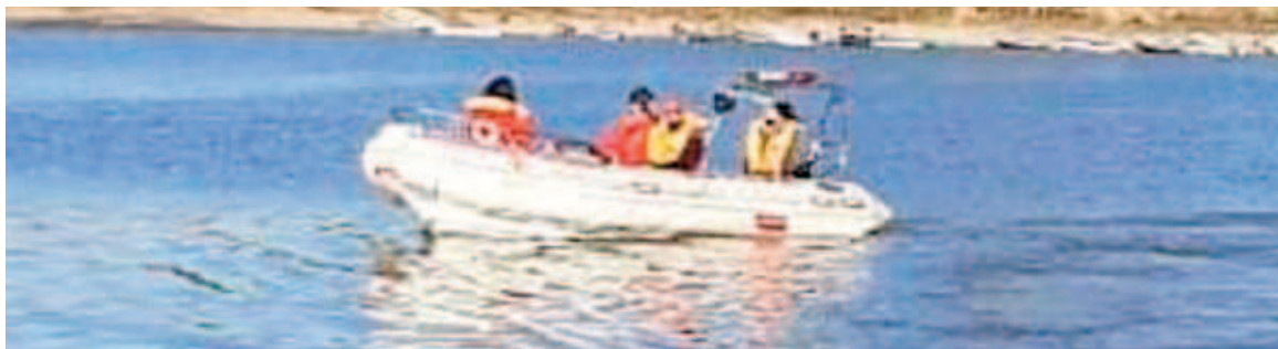
Hallan en el Paraná el cuerpo de un hombre que buscaban.

Fueron los mismos lugareños quienes días atrás habían avistado su lancha flotando en el medio del río con su mascota