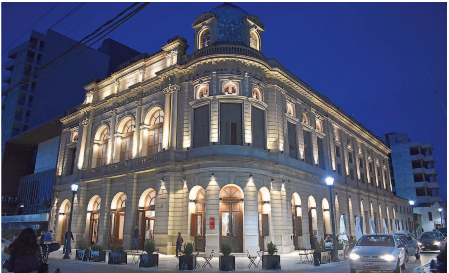
Con visitas guiadas, harán “un viaje hacia la inauguración del Teatro San Nicolás” para celebrar su 116º Aniversario.

“Sin dudas, estas visitas guiadas teatralizadas serán un viaje al pasado y permitirán a los nicoleños tomar aún más dimensión del valor que tiene esta parte del patrimonio local”, aseguran desde el Municipio local.