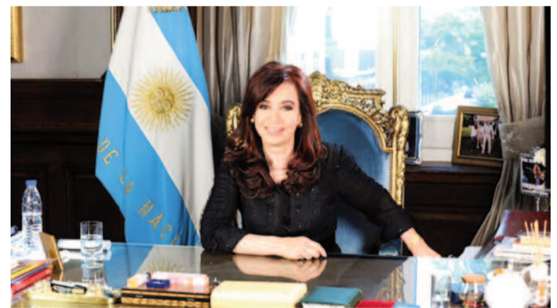
La expresidenta Cristina Fernández de Kirchner.

o libertario y se definió como “apolítico”. “Yo el día del atentado apunté a la cara. Gatillé una vez, no dos, y no le volví a dar recarga al arma porque fui interceptado”, admitió.