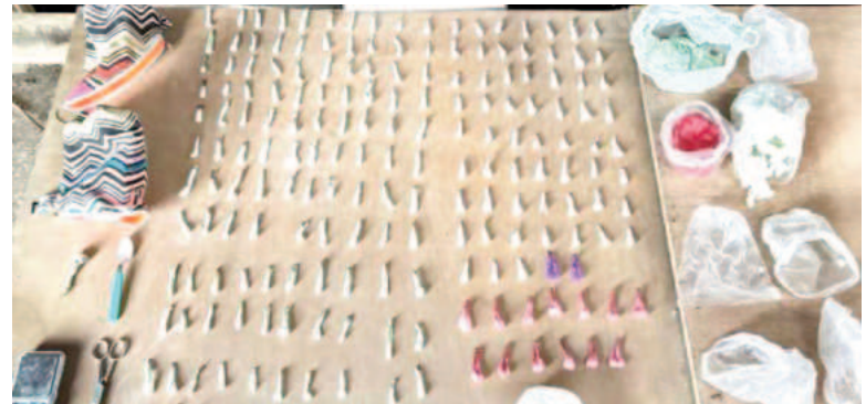
En los operativos se incautaron 185 gramos de clorhidrato de cocaína.