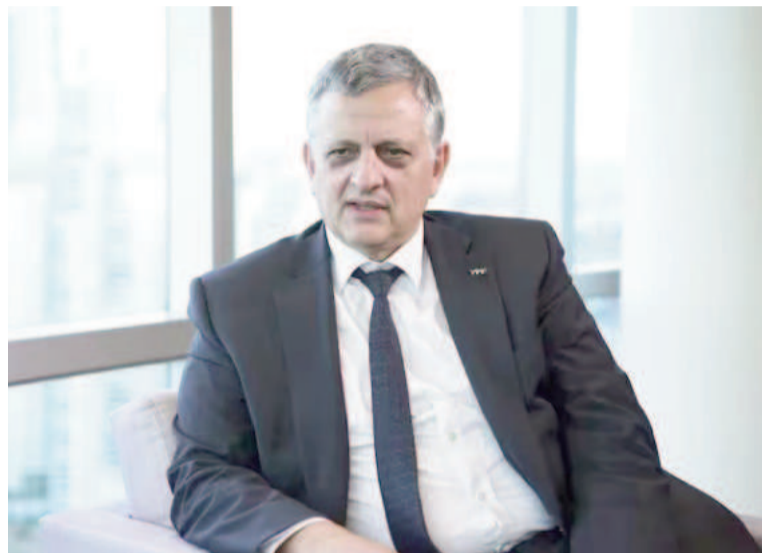
El presidente y CEO de YPF, Horacio Marín.

Para el primer tramo, la inversión se estima en aproximadamente USD 190 millones. Este fortalecerá todo el sistema de evacuación de petróleo