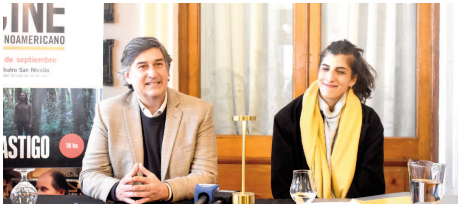
El Festival tendrá lugar en el Teatro San Nicolás el próximo 31 de agosto y 1° de septiembre.

-18.00: «Amores incompletos» (México, 2022). 99 min. ESTRENO EN ARGENTINA