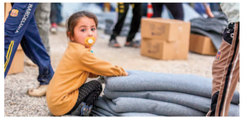
Unicef alerta de que más de 1.500.000 chicos pasan hambre en la Argentina.

“En 9 de cada 10 hogares con niñas y niños, los ingresos no alcanzan para comprar la misma cantidad de productos básicos que en 2023, de acuerdo con nuestra octava encuesta sobre la