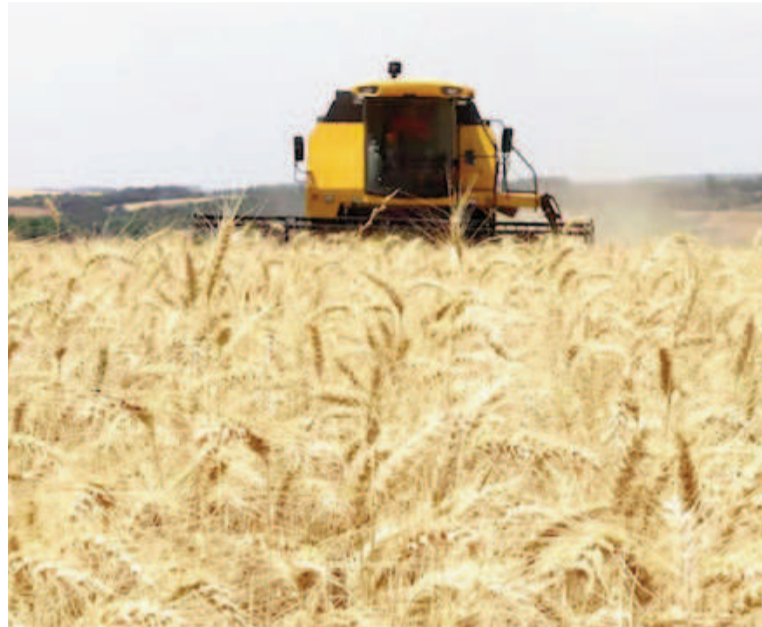
Cada 14 de agosto se celebra el Día del Cerealista.

Con el pasar de los años, el país vio nacer diferentes organismos que regulan y coordinan esta actividad económica. Uno