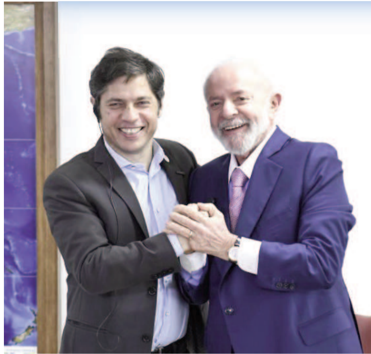
El gobernador bonaerense se entrevistó con el presidente del Brasil.

"Profundizar nuestros vínculos con este socio comercial clave es fundamental para potenciar el crecimiento bonaerense y seguir cons-