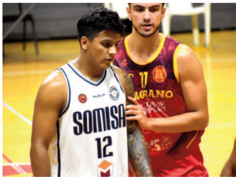
Somisa y Belgrano compartirán el Grupo B y se enfrentarán dos veces en la fase regular.

Regatas, La Emilia y Sacachispas integrarán el Grupo A de la Región Norte, junto a Independiente y Defensores Unidos de Zárate y a Atenas y Platense de La Plata. Y en el B jugarán Belgrano, Somisa, Defensores y Los Andes, que tendrán como rivales a Unión Vecinal y Banco Provincia de La Plata, Ciudad de Campana y Costa Brava de General Rodríguez. En el C fueron ubicados Náutico de San Pedro, Boca de Tigre de Escobar, Estudiantes de La