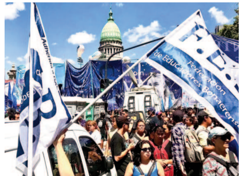
Docentes bonaerenses marchan contra el proyecto para declarar a la educación como servicio esencial.

Mayor inversión en educación: Demandamos un aumento en la inversión para asegurar una educación pública de calidad.