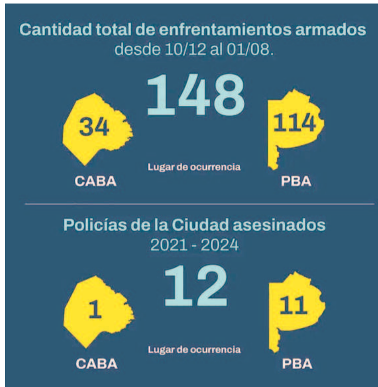
Las cifras publicadas por Waldo Wolff en «X».

Se trata, según el funcionario porteño, de "un 42% de aumento del delito en la Provincia de Buenos Aires porque, en definitiva,