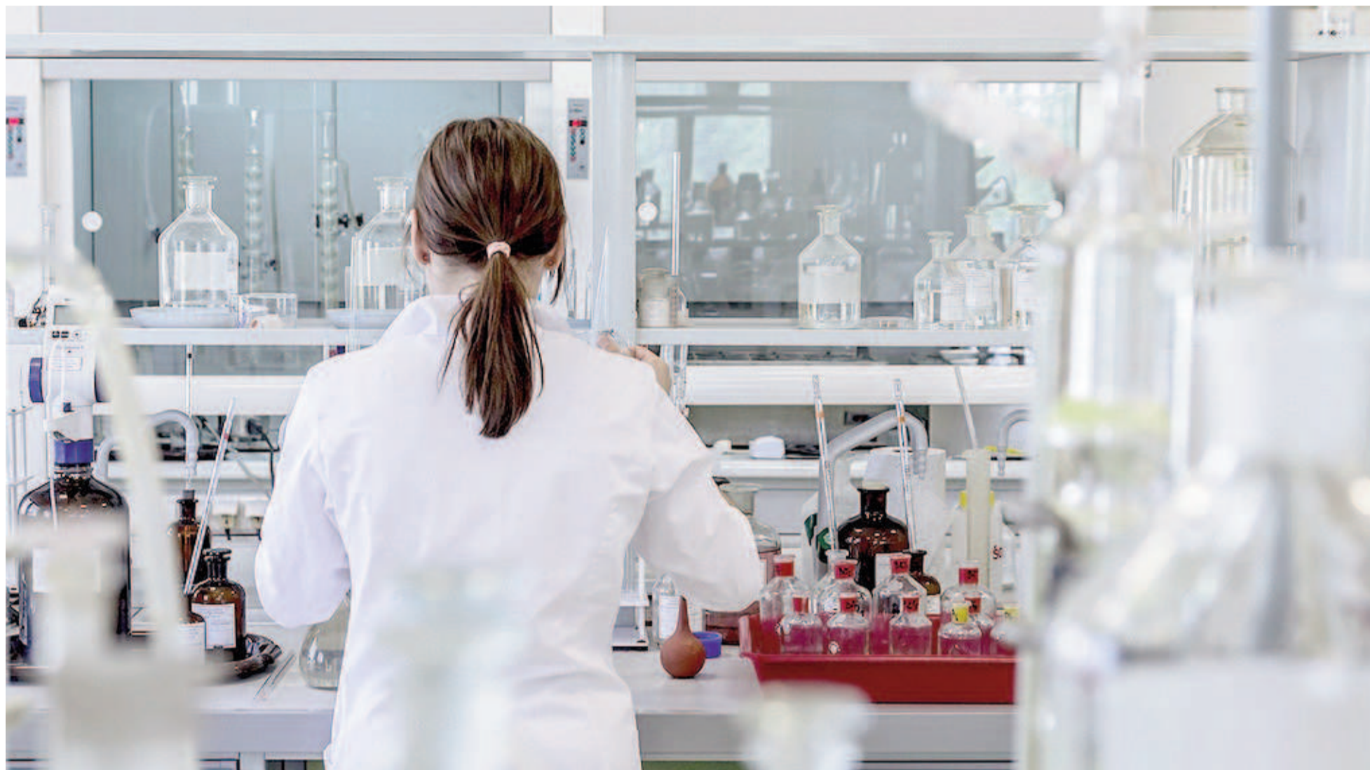
“El fundamento de las instituciones que rigen nuestra profesión es hacer que los servicios que se brindan sean de calidad y estén al alcance de todos”, sostuvo Tonello / ILUSTRACIÓN