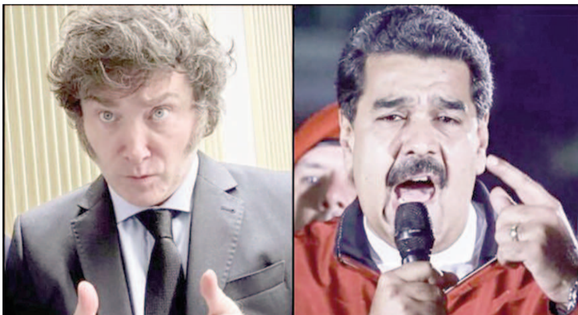
El presidente Javier Milei y el mandatario venezolano, Nicolás Maduro.

Con tono reflexivo, apuntó contra los que apoyan al gobierno de Maduro: “¿No les llama la atención que todos los políticos, periodistas,