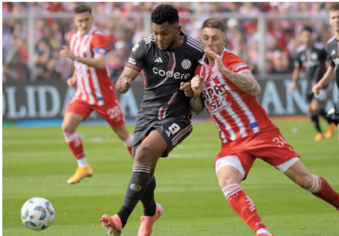
El equipo de Núñez cosechó una igualdad como visitante. WEB

Con Marcelo Escudero como DT interino, previo a darle el pase al Muñeco Gallardo, el Millonario igualó 0-0 ante el Tatengue, uno de los animadores del torneo.