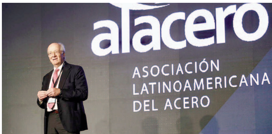
La edición 2023 de Alacero Summit se había llevado a cabo en Sao Paulo (Brasil).

En esta oportunidad las ponencias y los paneles estarán centrados en