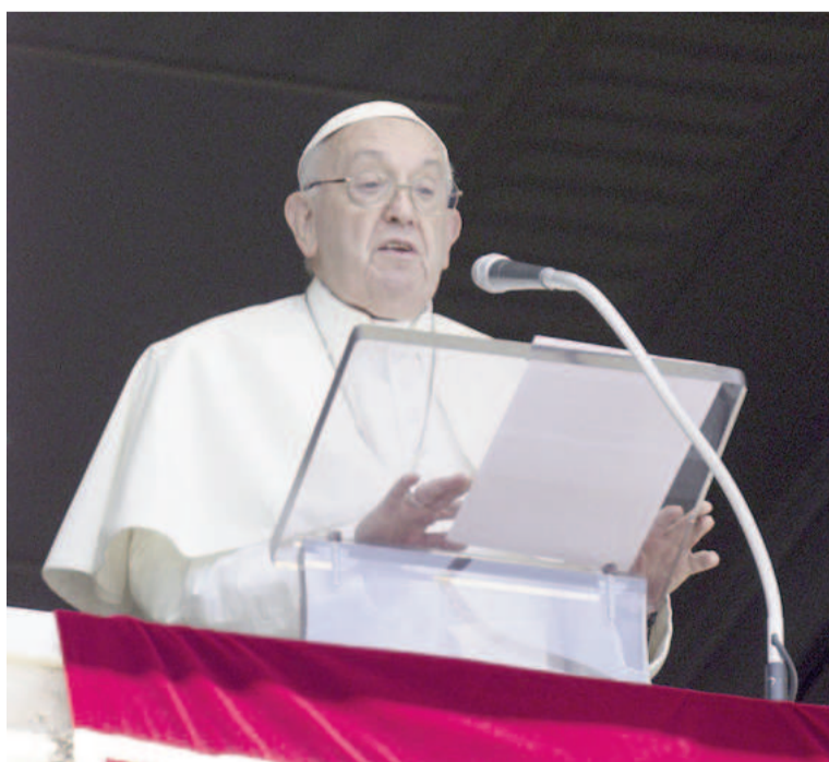
El papa Francisco expresó su preocupación por la situación de Venezuela.

En paralelo, la situación en Venezuela sigue siendo tensa. La oposición no reconoce los resultados oficiales de las elecciones del domingo pasado, y las manifestacio-