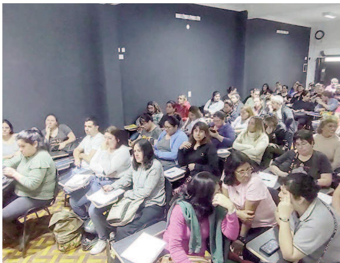
El pasado jueves 1º de agosto comenzó el curso de "Gestión y Abordaje Integral del Sistema Alimentario Escolar" en la escuela de ATE.

Más de 100 trabajadores comenzaron el curso, dictado por la nutricionista Guillermina Giorello, quien es profesional responsable de la re-