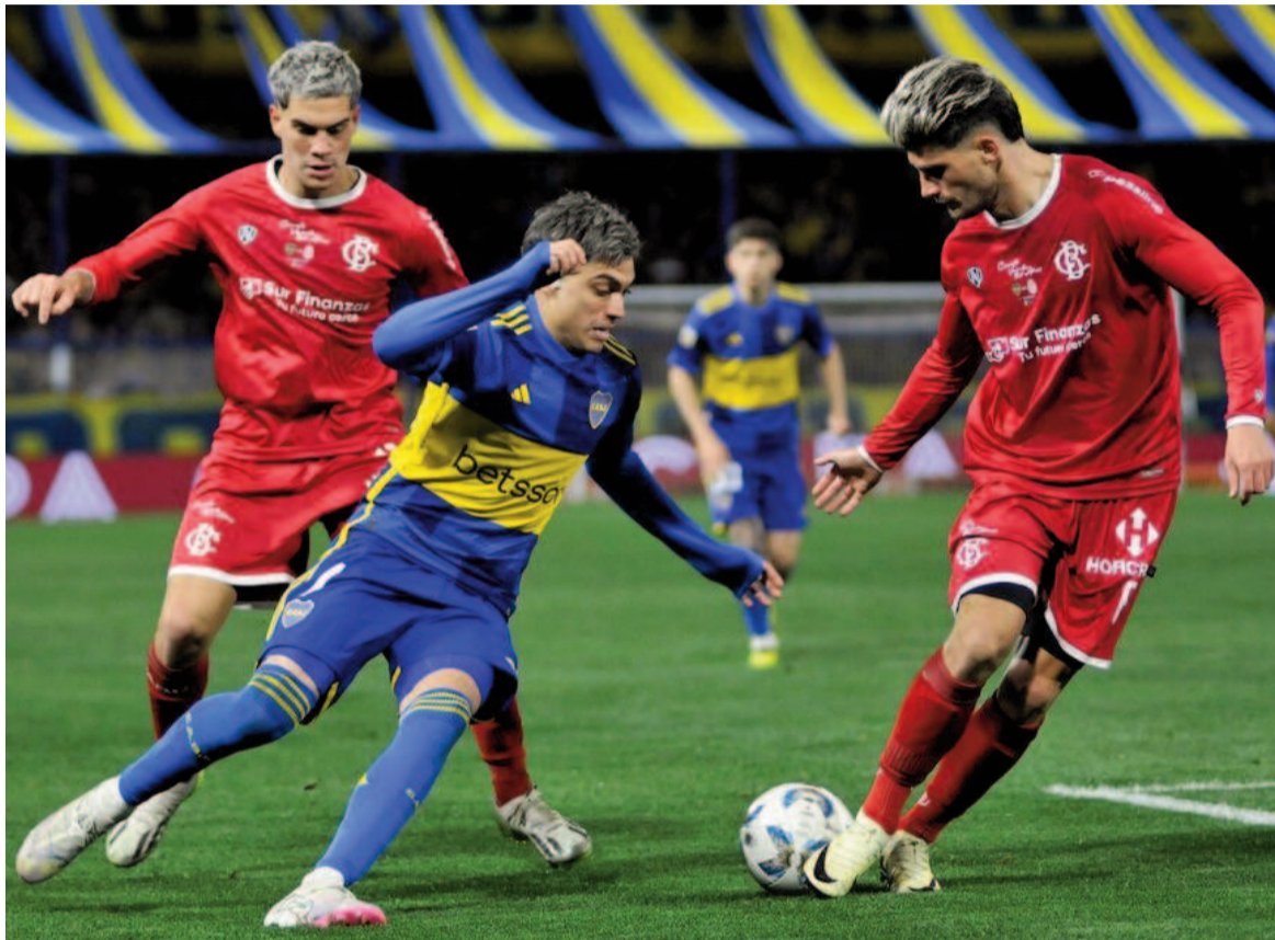
El conjunto de La Ribera solo pudo sumar un punto en casa.