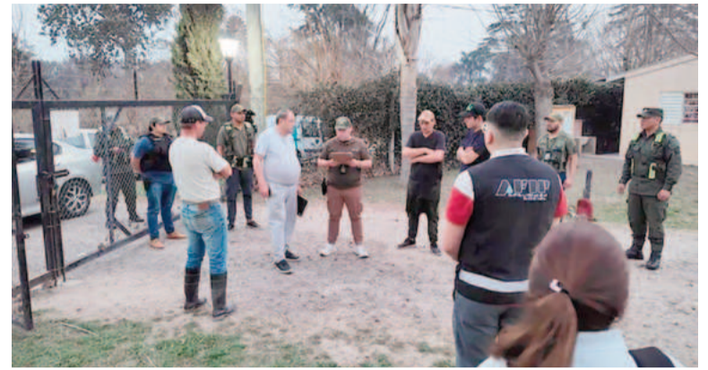
Hallaron a 19 trabajadores en situación de explotación laboral.

"El delito no distingue límites políticos. Los números desnudan una realidad incontrastable que no se resuelve con eslogan. La seguridad de la Ciudad depende también de un conurbano ordenado y trabajando en sintonía. Es la única salida tras décadas de abandono y desidia. Nosotros tenemos diferencias ideológicas, diferencias políticas", opinó el titular de la cartera sobre la inseguridad en el territorio gobernado por Kicillof. "Ahora, cuando tocan a alguien de una fuerza para mí no hay diferencia", cerró Wolff al respecto.