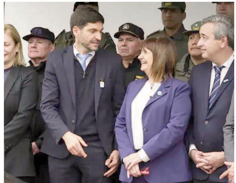
La ministra y el gobernador volverán a verse las caras este lunes

«Yo decía que tenía que pulverizar la inseguridad y la provincia de Santa Fe es testigo de la enorme tarea de la ministra Bullrich exterminando la inseguridad», sostuvo.