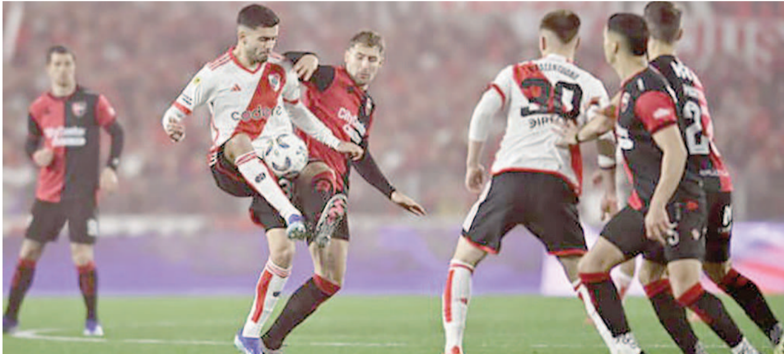
Escena del encuentro que disputan River y Newell's en el estadio Monumental.

El Millonario empató 0 a 0 ante su gente y no pudo descontarle puntos al líder Huracán. El equipo de Gallardo completó una discreta actuación pese a haber buscado el gol por todos los medios. Debutó Marcos Acuña en el local.