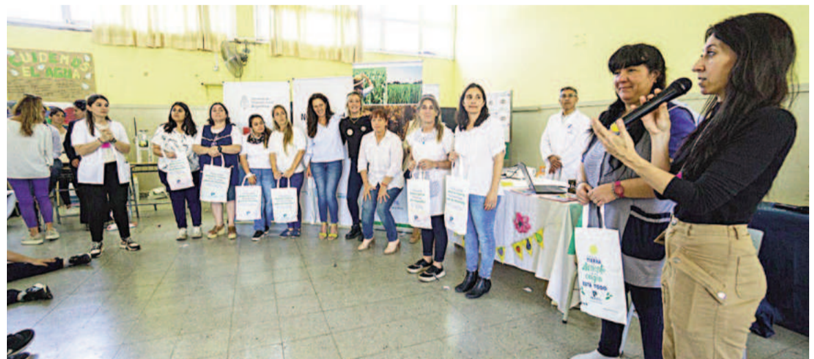
El año pasado el cierre de la campaña “Alimenta tu mundo” se desarrolló con una jornada participativa en la escuela primaria José Manuel Estrada N°4.

El año pasado, en su segunda edición, la campaña se centró en el Día Mundial de la Alimentación. Contó con la participación de un total de 27 escuelas, siendo en su mayoría escuelas públicas, quienes organizaron y desarrollaron distintas actividades educativas, recreativas y lúdicas alcanzando con ellas a 1715 de niños, niñas y adolescentes de 2 a 18 años de edad. El cierre de la actividad se desarrolló con una jornada participativa en la escuela primaria José Manuel Estrada N° 4, donde cada colegio presentó un stand interactivo en el cual se desarrollaron juegos y se hizo intercambio de lo trabajado durante la campaña. Además, se planteó un concurso audiovisual.