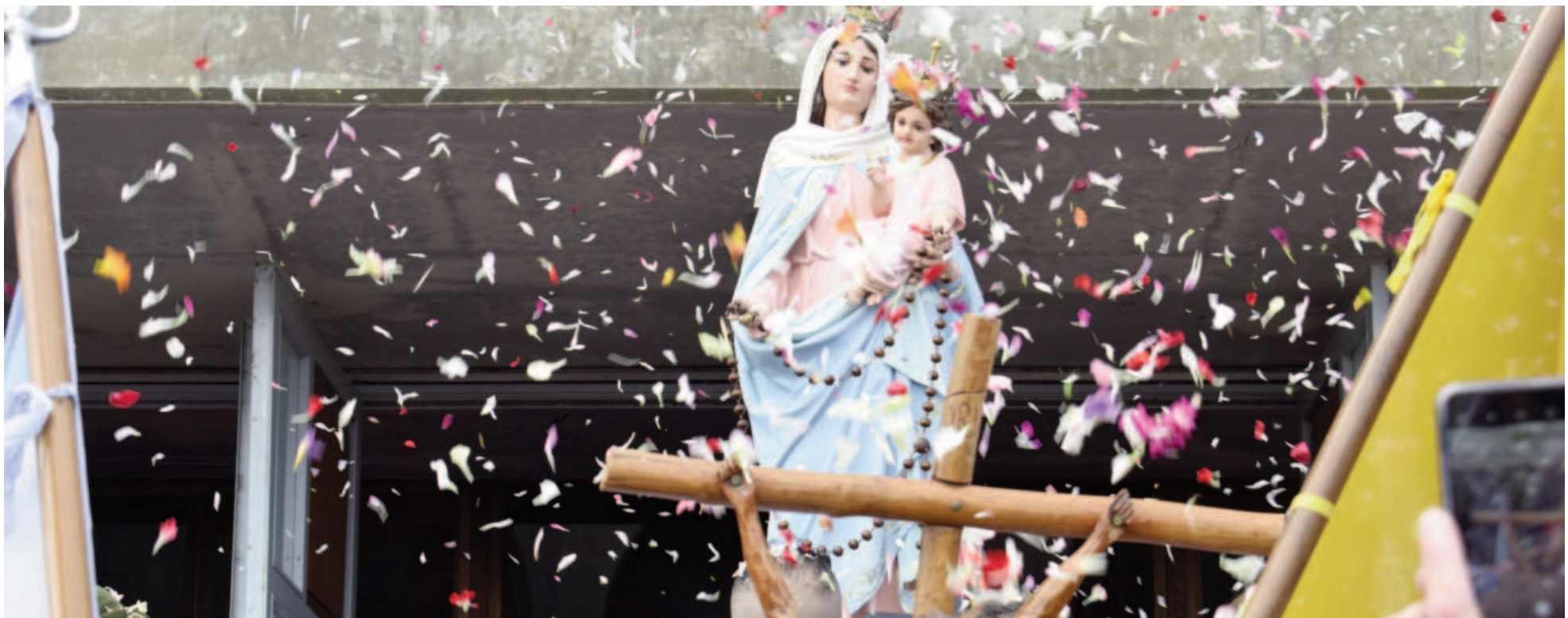
El fenómeno religioso que revoluciona San Nicolás se encuentra próximo a un nuevo aniversario