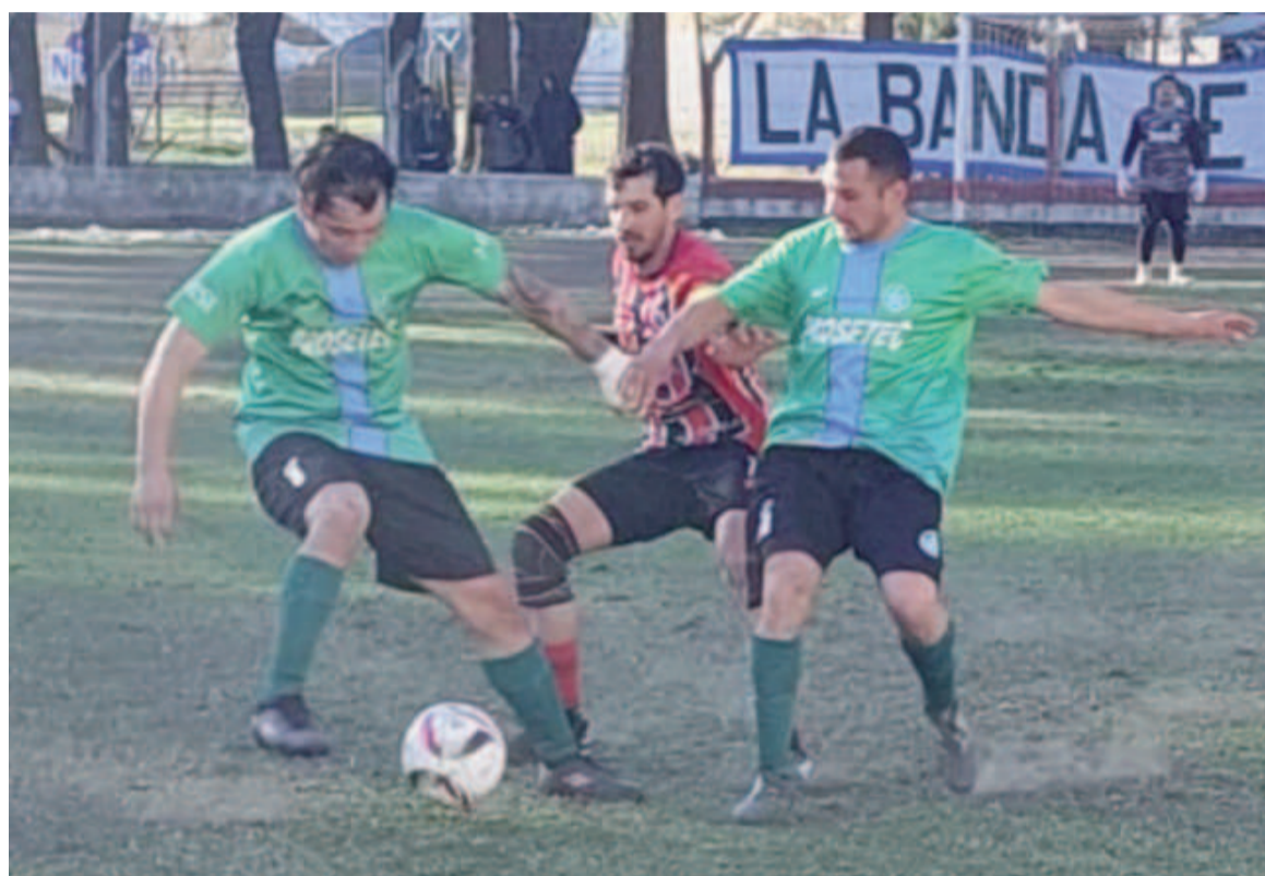
Rojo debutó en el Clausura con un buen triunfo en casa.