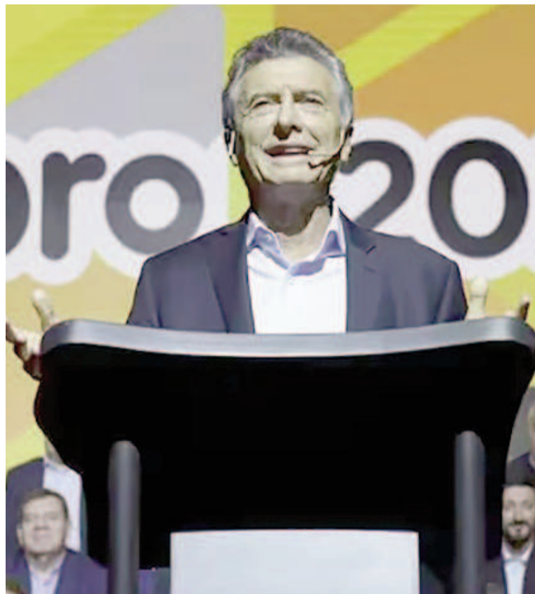
Macri, presidente del PRO, se expresó junto a los suyos, a favor del veto presidencial.

El texto enfatizó la necesidad de “ratificar los valores” que unen a los integrantes del partido, y destacó la importancia de trabajar por el cambio que promete Milei tanto como apoyar iniciativas que favorezcan el crecimiento, la libertad y la democracia. Según el comunicado, el PRO busca hacer lo co-