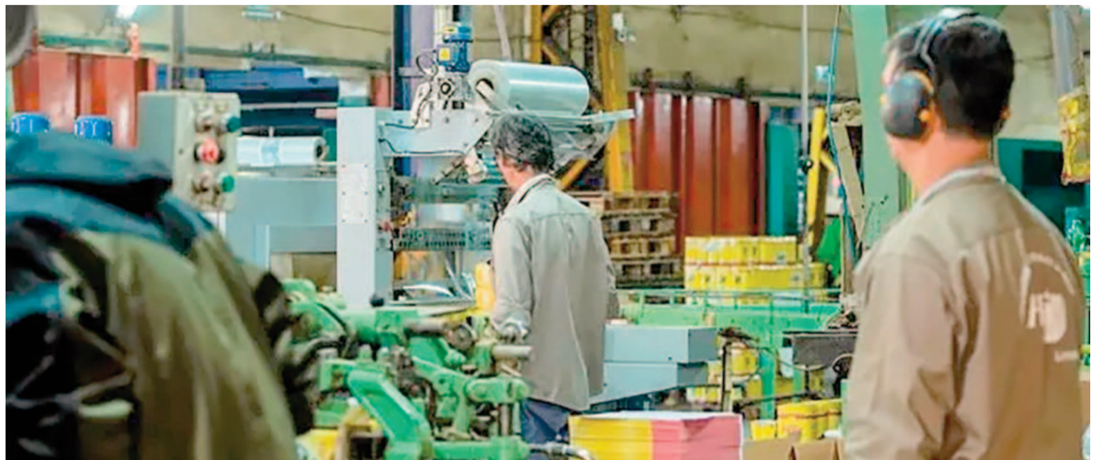
La actividad sigue en caída en todos los sectores, siendo el más afectado Químicos y plásticos.

En el acumulado del año, la mayor retracción la muestra "Químicos y