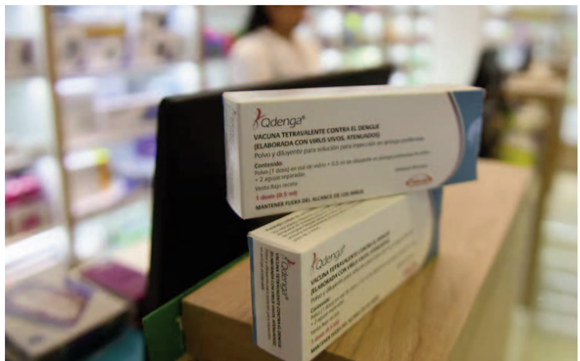
Los especialistas recomiendan esta época como ideal para la aplicación de la vacuna contra el dengue.

El dengue es una enfermedad viral transmitida por el mosquito Aedes aegypti , que representa un reto significativo para la salud pú-