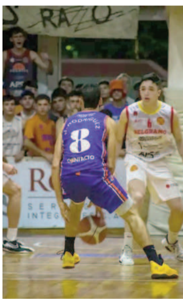
Regatas y Belgrano se enfrentarán hoy por la quinta fecha del Clausura.