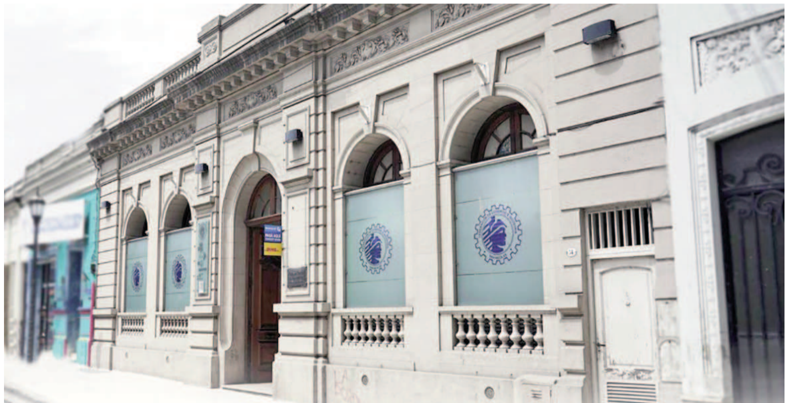
Desde el sector comercial piden que el RIGI llegue a terreno bonaerense, pero sin dejar de lado a las pequeñas y medianas empresas.

Vale destacar que estos dichos por parte del mandatario bonaerense llegan luego de que trascendiera la presunta decisión del directorio de