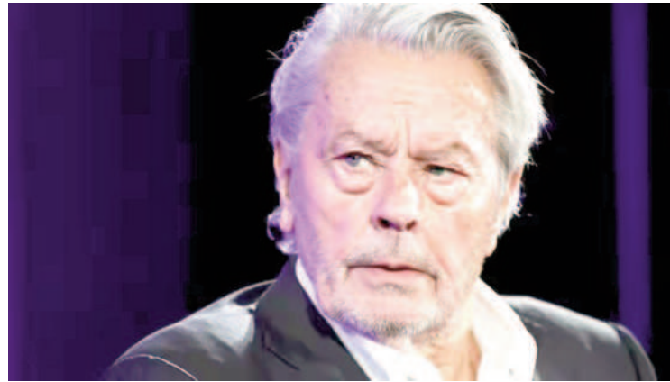
Murió el legendario actor francés Alain Delon a los 88 años.

"Me voy a ir, pero no me iré sin dar las gracias", agregó el hombre que vivió sus últimos años en su casa de un pequeño pueblo del noreste de Francia, rodeado de altos muros, donde tenía previsto ser enterrado no muy