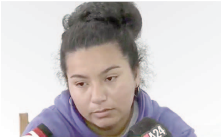
La mamá de Loan y un reclamo a Macarena.

Asimismo, añadió: «Ya inicié acciones legales contra todos los que hablaron mal de mí, no quiero tener problemas con los Estados Unidos y en verdad que se dijeron muchísimas cosas que no sé de dónde sacaron».