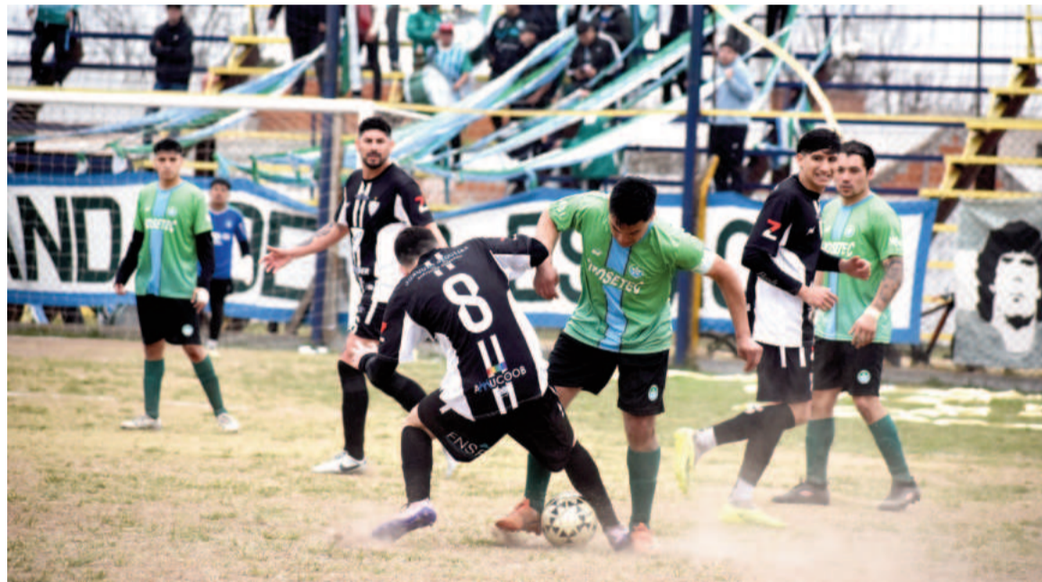
En la cancha de Doce hubo poco fútbol y nada de goles. EL NORTE

En Soler y América, el equipo de la Estación y el Pañero empataron 0 a 0, en el arranque de la Zona A. La igualdad le terminó cayendo bien a un partido friccionado y con pocas situaciones en las áreas.