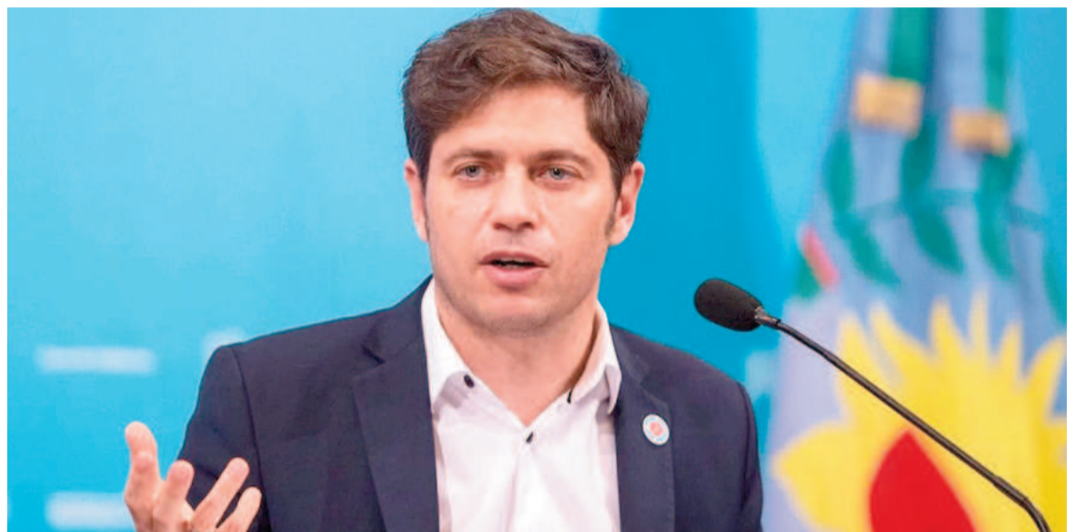
El gobernador Axel Kicillof volvió a cargar contra Milei.

“Es una situación donde a nosotros nos honra cumplir con los compromisos. Estas cosas no son magia, sino que, en este caso, es eficacia pero es sensibilidad con el pueblo de la provincia”, manifestó. Para finalizar, indicó que los