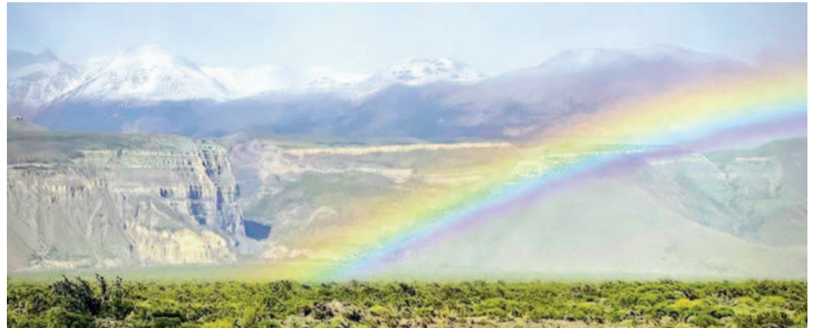
Hermosos paisajes de la Patagonia fueron reconocidos a nivel internacional.