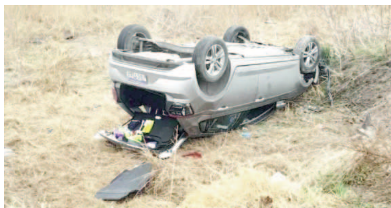
Así terminó el vehículo siniestrado.

En las primeras horas de este domingo se dio un impresionante despiste en el km 384 de la vieja Ruta 9, entre Cañada de Gómez y Armstrong. El auto salió de la traza y así terminó volcando. Bomberos voluntarios de