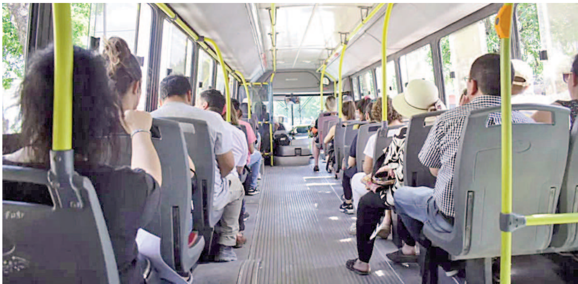
La UTA lanzó un paro por 48 horas para este jueves y viernes aunque, en principio, la medida de fuerza no alcanzaría al transporte público de San Nicolás.

Así lo dejó asentado ante el Gobierno nacional la federación que nuclea a las concesionarias de servicios de corta y media distancia del interior. Anticiparon que iniciarían procedimientos preventivos de crisis para avanzar con suspensiones y desvinculaciones. En guardia, la UTA lanzó un paro para jueves y viernes.