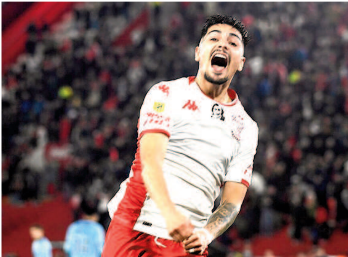
El conjunto de Parque Patricios continúa en la punta. WEB

En el Estadio Tomás Adolfo Ducó, el Globo superó 1-0 al conjunto cordobés con gol de Alarcón y mira a todos desde lo más alto.