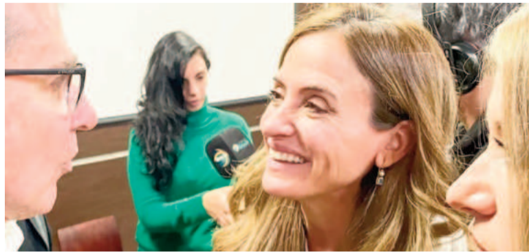
Diputada nacional Victoria Tolosa Paz.

Estas declaraciones surgen luego de que Tolosa Paz participara esta semana del Primer Encuentro de la Niñez y Adolescencia en la Univer-