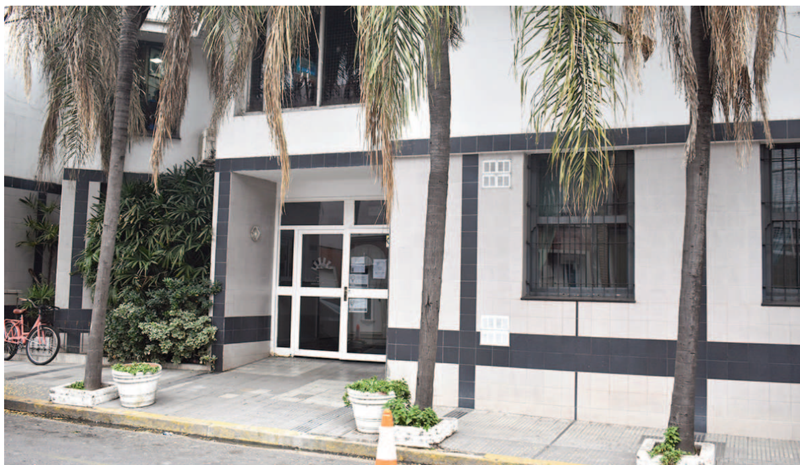
Hoy, lunes, los trabajadores de la Clínica Santa Isabel darán inicio a una medida de retención de tareas.

«(...) Me presento ante esta autoridad y digo: que en virtud de la continuidad de los incumplimientos efectuados por parte de la firma empleadora I.E.P.S.I. S.A. con domicilio en calle Urquiza 130 de la ciudad de San Nicolás, provincia de Buenos Aires, y ante la falta reiterada y sostenida de respuestas y/o solución alguna, siendo que la nombrada se encuentra debiendo SAC correspondiente al período 2023 un porcentaje del 70% y junio 2024 completo, a pesar de encontrarse los plazos ampliamente vencidos», expresa el escrito al que tuvo acceso este diario.