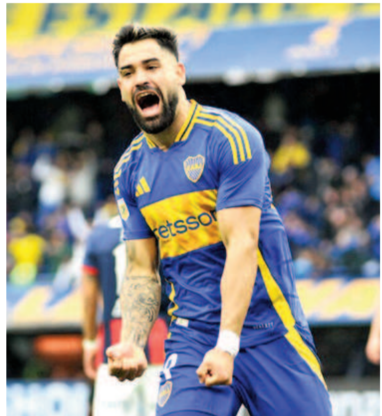
El Xeneize reaccionó y obtuvo un valioso triunfo.

Incidencia: expulsado 49m ST Marcelo Saracchi (B).