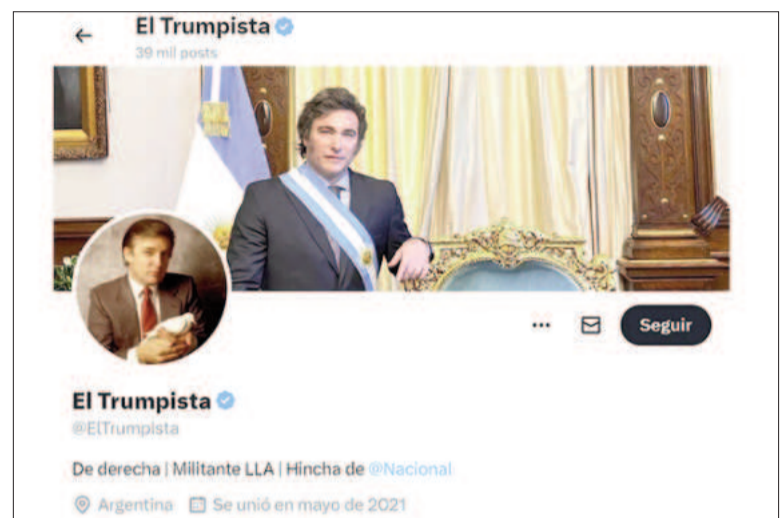
Felipe Solá reveló la identidad de jefe troll libertario.