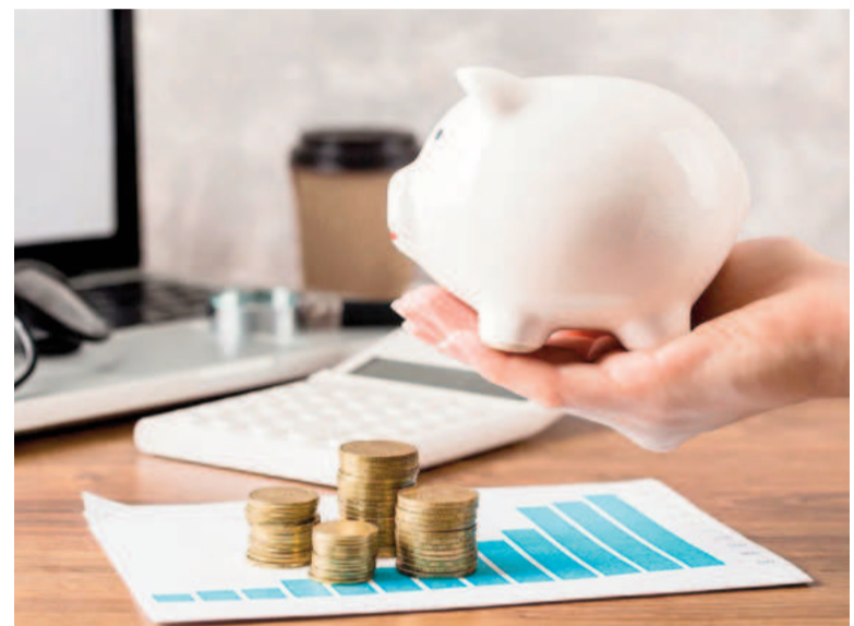
En el contexto económico actual existen algunos bancos que han mejorado su oferta.

altas para plazos fijos Banco Bica: 40% TNA Banco Voii: 39,25% TNA Banco Meridian: 39% TNA BiBank: 38% TNA Crédito Regional Compañía Financiera: 38% TNA Banco Macro: 37% TNA Banco del Sol: 37% TNA Banco Dino: 37% TNA Banco de Tierra del Fuego: 36% TNA Banco Nación: 37% TNA Banco Provincia: 35% TNA Banco Galicia: 35% TNA Banco Hipotecario: 35% TNA BBVA Argentina: 34% TNA Banco ICBC: 33,5% TNA Banco Santander: 33% TNA HSBC Argentina: 31,5% TNA