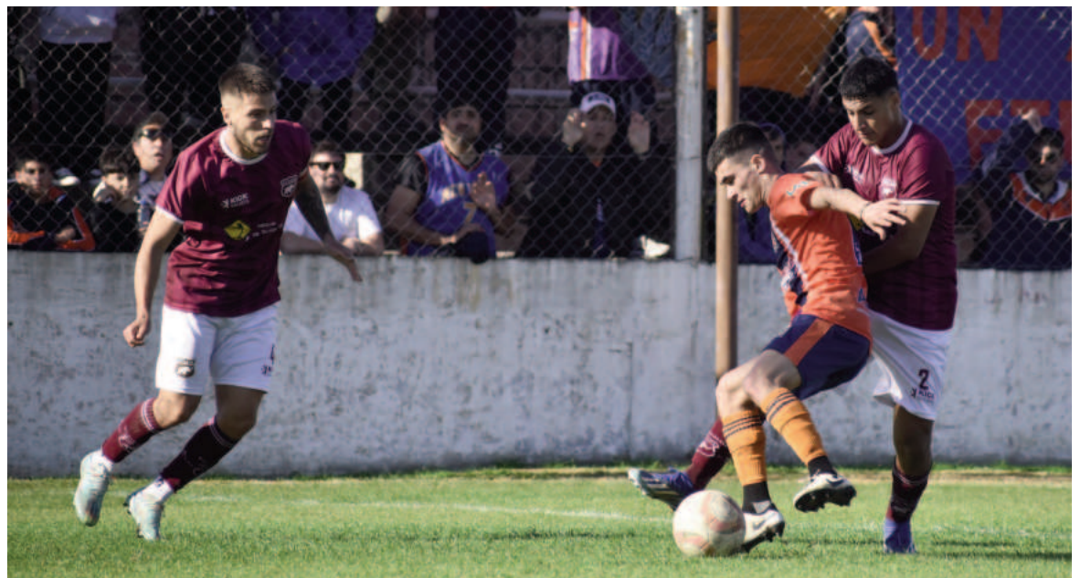
Regatas y Defensores llegan a la revancha en igualdad de condiciones. EL NORTE

Por el lado de Defensores no habrá venta antes del sábado, por lo que los simpatizantes que lleguen al Prado Español el día de partido podrán adquirir los tickets en la boletería, que se abrirá a partir de las 13.30.