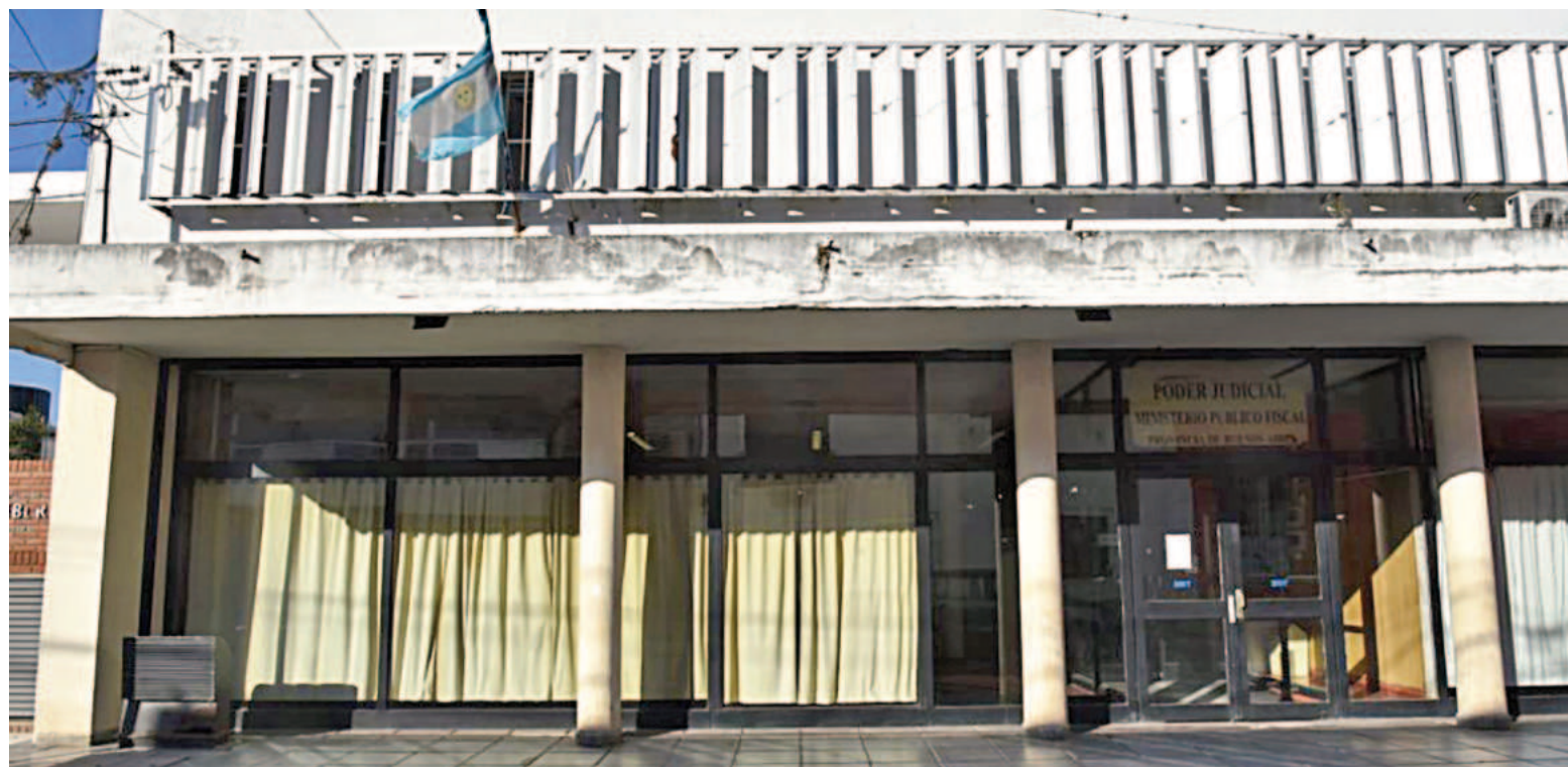
Ayer se realizó la audiencia indagatoria en la Fiscalía N° 15, donde la acusada escuchó los cargos y se negó a declarar.

La mujer había sido aprehendida el martes en horas de la noche en