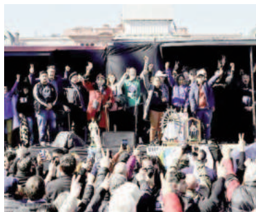
El acto en Plaza de Mayo fue por San Cayetano.

"Es importante que estemos unidas las tres centrales sindicales, movimientos sociales y diversos organismos