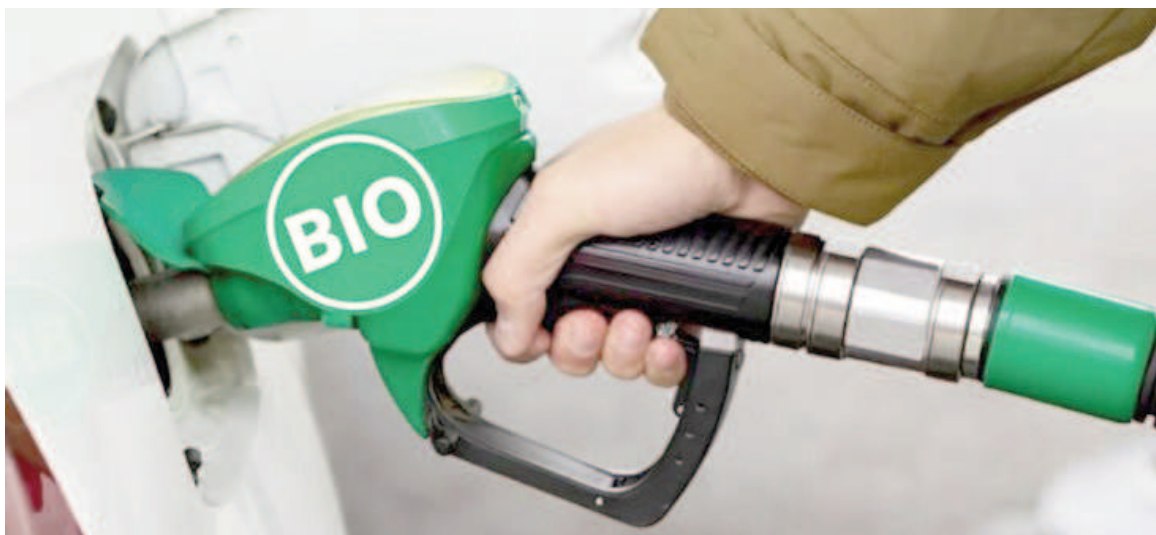
Ajuste de precio en los biocombustibles puede arrastrar otras subas.

Por otro lado, el precio mínimo de adquisición por litro del bioetanol elaborado a base de caña de azúcar se fijó en $ 644,525, cuando estaba $ 465,480 (un incremento del