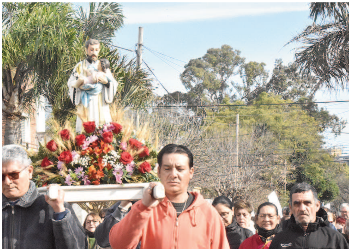
Devotos de San Cayetano participaron de la procesión y misas en la tarde de ayer. EL NORTE

Durante la Reforma Protestante, revolución que se oponía a la Iglesia católica, declaró: "Lo primero que hay que hacer para reformar a la Iglesia es reformarse uno a sí mismo". San Cayetano falleció el 7 de agosto de 1547 a sus 66 años,