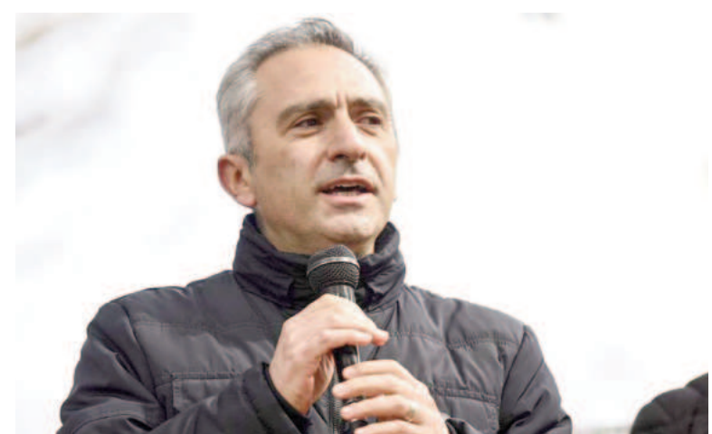
El «Cuervo» había señalado que estaban esperando mercadería.

Tras los señalamientos del ministro de Axel Kicillof se firmó el convenio por el que la provincia de Buenos Aires se quedará con el 30% del stock de alimentos que hay en los galpones, mientras que la Provincia se hará cargo de la logística y el retiro de aceite, arroz con carne, lentejas, yerba y puré de tomate. Asimismo, se acordó que dentro de 90 días la cartera bonaerense deberá presentar un informe, con carácter de