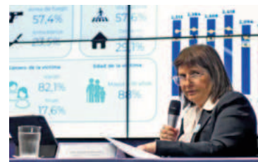
La ministra de Seguridad de la Nación, Patricia Bullrich, presentando las estadísticas.

En relación con el último punto mencionado, Bullrich adelantó que en los próximos días se enviará al Congreso