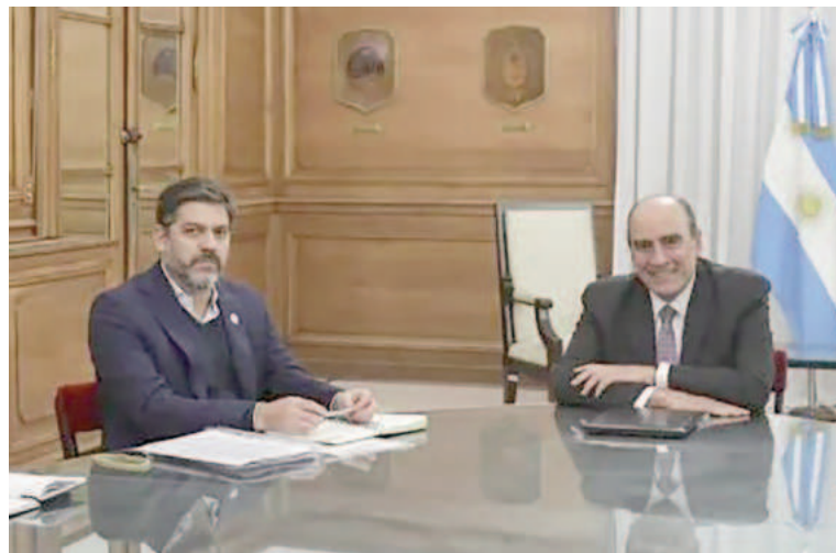
Bianco y Francos. Provincia y Nación cara a cara.

«Se le planteó el tema de los recursos provinciales y la preocupación por la situación social compleja que tiene que ver con la falta de empleo, ingresos, cuestiones alimenticias, el boleto. Y después planteamos dis-