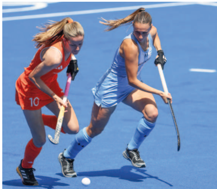
Las Leonas fueron superadas claramente por Países Bajos.