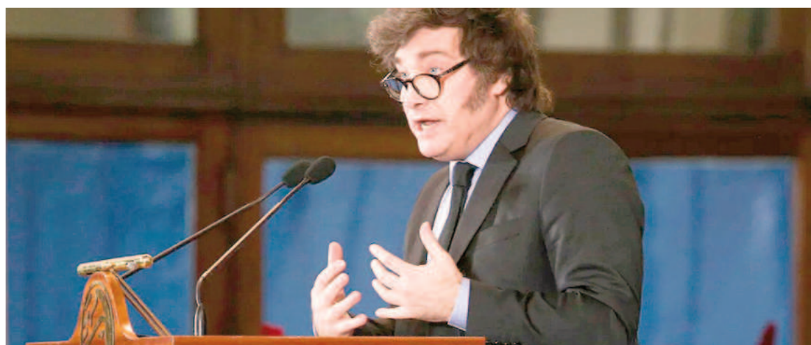
Cargada agenda cumplirá este jueves el presidente de la Nación.

A las 9, Milei se entrevistará con el gobernador de Neuquén, Rolando Figueroa, y ambos partirán en helicóptero hacia Loma Campana, previo a sobrevolar los yacimientos de Vaca Muerta.