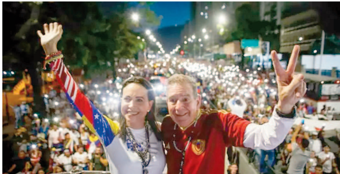
María Corina Machado y Edmundo González Urrutia durante una de las manifestaciones post elecciones.

Según esa dependencia, los opositores -así como otros líderes partidarios- comenzarán a ser investi-