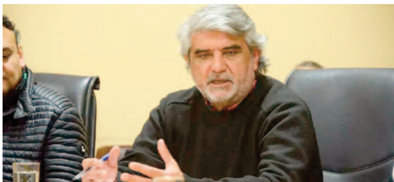
El ministro Walter Correa.

El Gobierno bonaerense recibirá este jueves en paritarias a gremios de distintos sectores y, en la previa, el ministro Walter Correa (Trabajo) sostuvo que «de los dos lados de la mesa nos consideramos compañeros». «De los dos lados de la mesa nos consideramos compañeros y compañeros. Axel (Kicillof) respeta esa cuestión paritaria, esa cuestión del diálogo», sostuvo el funcionario bonaerense este miércoles.