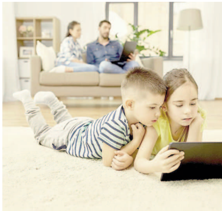
El uso de tablets en edades tempranas podría afectar el desarrollo emocional.

Esta relación sugiere que el uso de tablets no solo podría estar afectando la capacidad de los niños para manejar sus emociones, sino que también los niños que son más propensos a experimentar frustración y enojo podrían recurrir con mayor frecuencia a los estos dispositivos electrónicos, tal vez como un mecanismo de afrontamiento. Esta dinámica podría crear un ciclo vicioso que dificulte el desarrollo de