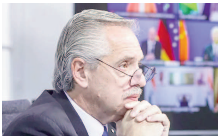
Dura imputación por «lesiones graves doblemente agravadas por el vínculo».