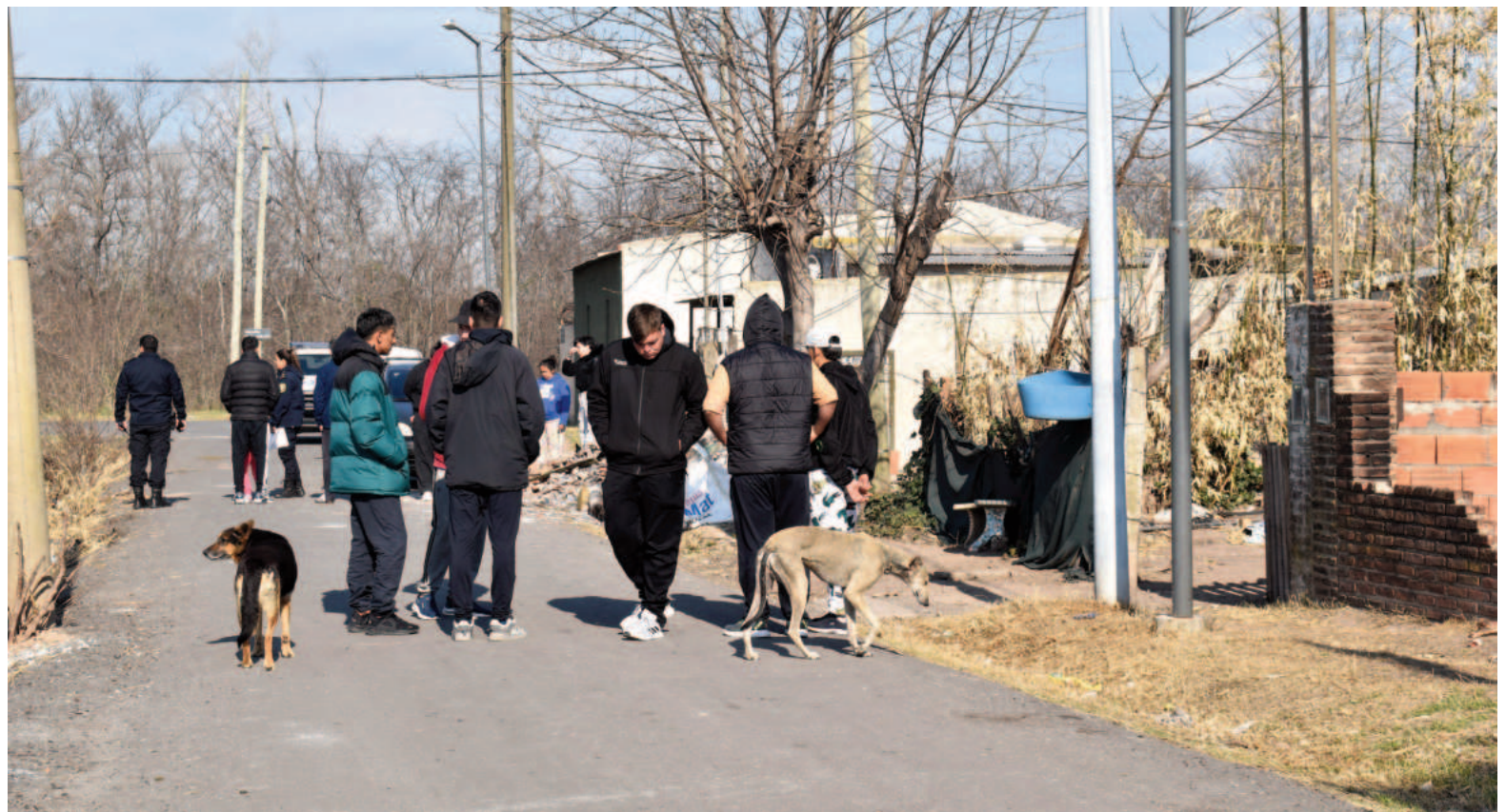
El hecho ocurrió en calle Rademil al 1100, en barrio Virgen de Luján.

informó la detención de dos sospechosos, aprehendidos en barrio Cooperación. Se trata de un hombre de 31 años y otro de 18, quienes se desplazaban a bordo de un Fiat Punto color negro.