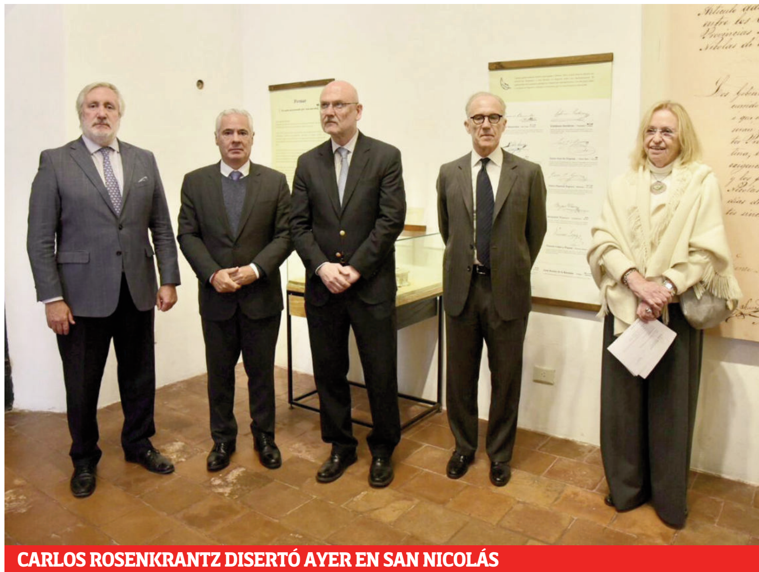
CARLOS ROSENKRANTZ DISERTÓ AYER EN SAN NICOLÁS

La unidad productiva está clausurada desde el 20 de marzo por una cautelar judicial. Desde el 11 de mayo hasta el 11 de agosto los trabajadores estuvieron suspendidos. Ese régimen se prolongó una semana, a la espera de avances judiciales que todavía no se produjeron. La empresa no sólo recurriría a un plan de retiros voluntarios, sino que sumaría una desvinculación masiva de sus operarios. Local 3