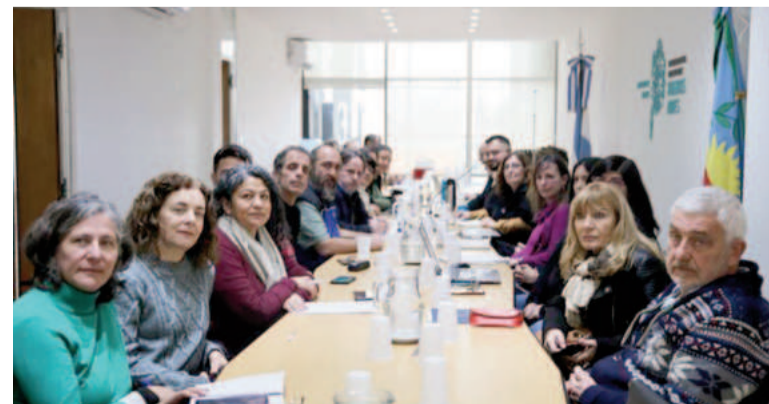
Hoy jueves será una Jornada de paritarias bonaerenses.

En tanto, según pudo saber esta agencia, las partes venían manteniendo conversaciones informales en la previa a la convocatoria de hoy. En esa línea, es probable que hayan acercado posiciones.