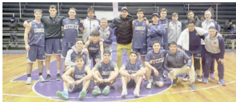
Somisa es uno de los líderes con puntaje ideal que tiene la competencia, junto a Regatas "A".