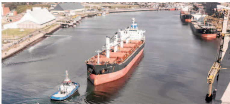
El campo se abroquela y mete presión a Axel Kicillof por una licitación.

En ese marco, el funcionario provincial anticipó «una cláusula de reserva de carga para la provincia de Buenos Aires que fue un pedido expreso del gobernador» del 30% pero únicamente