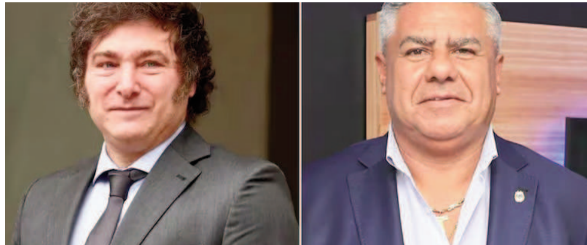
Javier Milei y Claudio «Chiqui» Tapia, dos miradas antagónicas sobre el fútbol

El presidente estableció por decreto que la entidad no puede prohibir a las SAD que participen de competencias ni expulsarlas. Claudio "Chiqui" Tapia se opone e hizo aprobar una cláusula que prohíbe la participación de clubes que sean gerenciados por empresas.