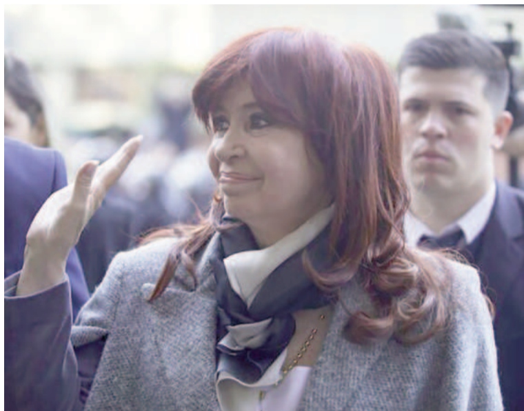
La expresidenta declaró en el marco del juicio por el intento de magnicidio.

Además, Fernández de Kirchner advirtió cómo se fue incrementando