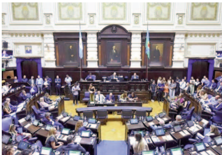
Hoy sesionaría la Cámara de Diputados bonaerense.

“Si ellos van con Alberto y Fabiola, que no se quejen, los nuestros tienen derecho a sacar los carteles de la foto con Astiz. Pero vamos a tratar de que no se salga de los carriles del debate parla-