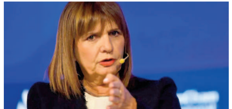
La ministra Patricia Bullrich.

«Fue abalado por todas las instancias judiciales y validado a pesar de haber sido atacado en distintos juzgados», argumentó. “Con esto establecimos que las protestas se iban a realizar sin cortar las calles. Estamos ante un cambio de paradigma, una nueva etapa del orden público donde los ciudadanos están libres de este flagelo que parecía imposible de sacar”, aseguró, lo que cosechó el fuerte respaldo de los empresarios asistentes.