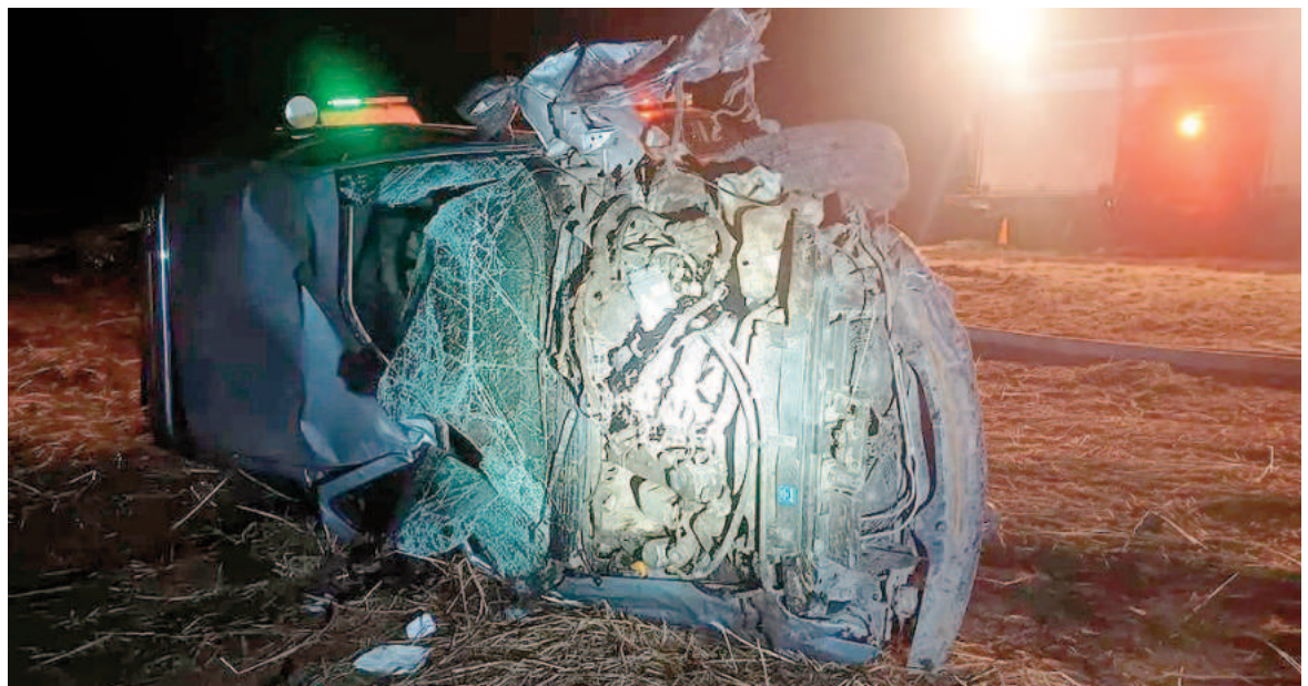
La camioneta sufrió averías sumamente importantes.

El Servicio de Atención Médica de Emergencias (SAME) los atendió en el lugar, y afortunadamente, no fue necesario trasladarlos a un hospital. Las autoridades destacaron la suerte de los ocupantes, considerando el estado en el que quedó la camioneta. La curva de Peña en la Ruta 188 es conocida por su peligrosidad, y las autoridades viales reiteran el llamado a los conductores a extremar las precauciones al transitar por esa zona, especialmente en condiciones de baja visibilidad o asfalto húmedo.