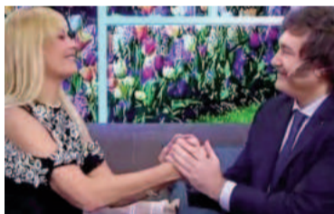
El presidente oficializó su relación con la exvedette.

En su programa de Ciudad Magazine, “Empezar el día”, la conductora habló de su relación y se animó a ponerle un título. “¿Estás contenta? ¿Estás enamorada?”, le preguntaron sus compañeros y “Yuyito” respondió: “Estoy contenta. Estoy de novia. Sí, hay que acostumbrarse a la palabra novia también, ¿eh? Hay que acostumbrarse cuando no la venís trayendo de mucho tiempo. Pero bueno, es muy lindo. La verdad que es lindo, es hermoso. Está bueno intentarlo”.