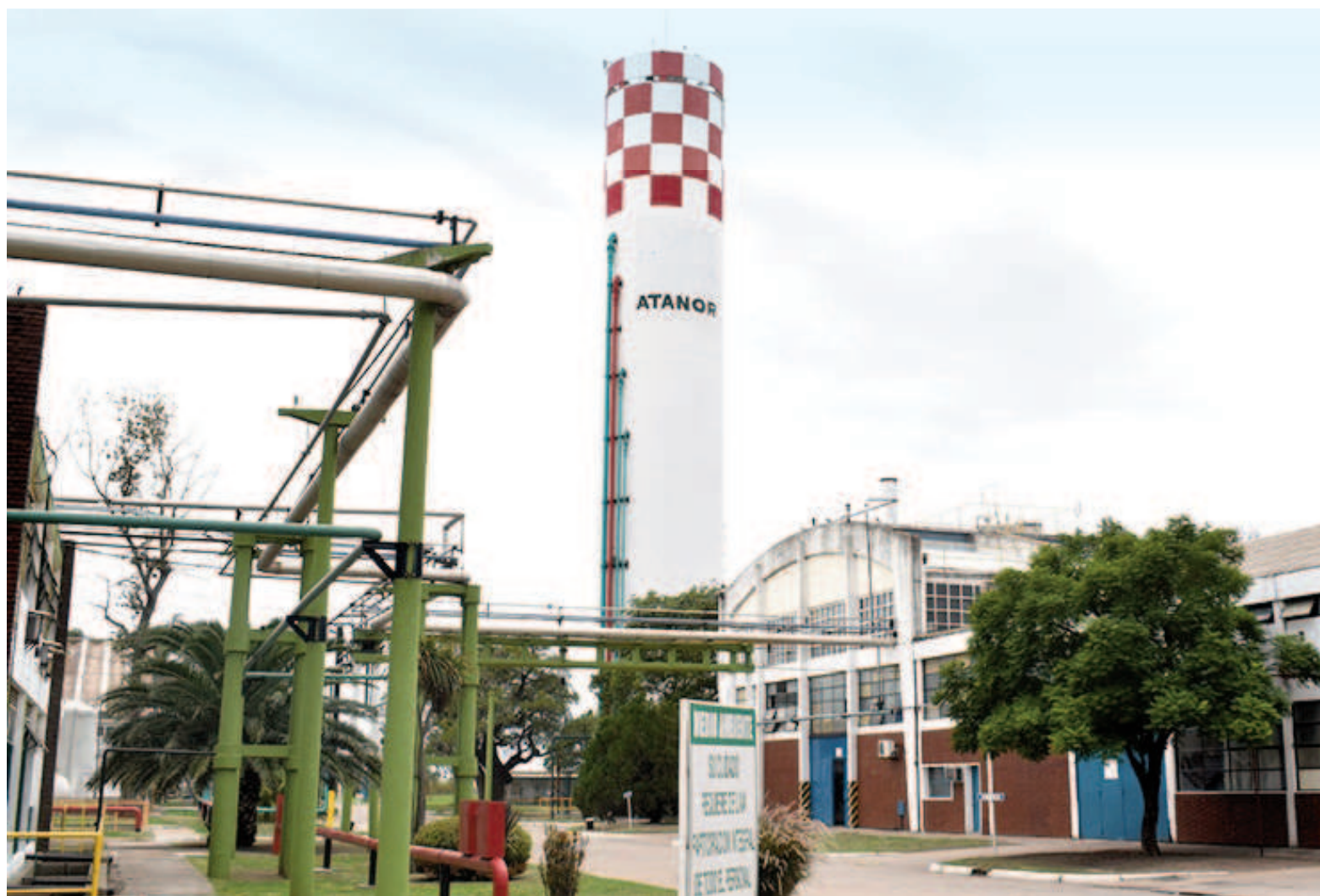
La planta de Atanor permanece clausurada y sin actividad productiva desde el 20 de marzo pasado por una cautelar judicial.

Ya en aquel momento había trascendido que en caso de mantenerse la clausura total, la empresa del