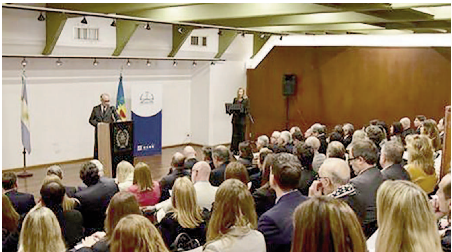
La actividad se llevó a cabo en el auditorio de la Casa del Acuerdo de San Nicolás

Ante un auditorio de la Casa del Acuerdo colmado de magistrados y funcionarios judiciales, el doctor Rosenkrantz brindó la conferencia "Jueces y Principios", inaugurando de este modo el ciclo promovido por la SCBA para conmemorar el 30 aniversario de las últimas reformas en