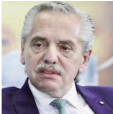
El expresidente Alberto Fernández.

Fernández había hecho circular el viernes una carta de renuncia dirigida a la Mesa Directiva del Consejo del PJ, lo que