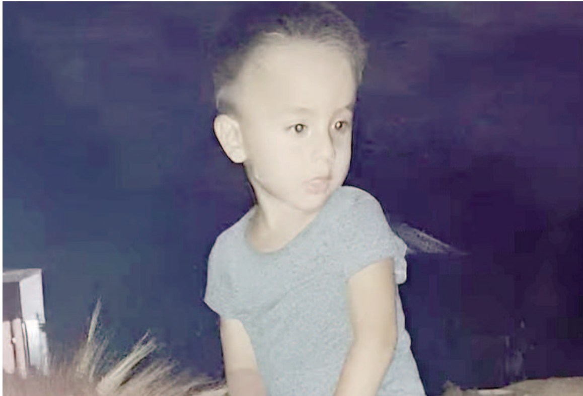
Desde el 13 de junio nada se sabe del niño correntino.

sería blanca sino negra, según el detalle que dieron los nenes en la cámara Gesell.