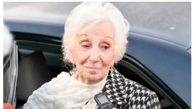
De Carlotto le suelta la mano a Maduro.

En una línea similar a la expuesta por la expresidenta, agregó: “Es un país donde tiene de arrastre lo que fue el fundador de ese partido político (Hugo Chávez). Y a este hombre (Maduro) yo no tengo palabras para juzgarlo, porque no puedo hablar de lo que no sé. En esto tienen que estar los políticos, pero los países también, porque están condenando para que presente las actas”.