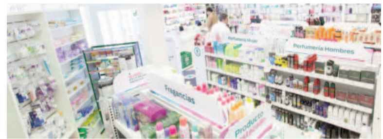
Farmacias y perfumerías, los más perjudicados.

«El principal problema de los comercios minoristas en julio fue la falta de ventas», seguido por «los altos costos de producción, donde las empresas reclaman la necesidad de reducir impuestos nacionales, provinciales y municipales para devolver la rentabilidad al sector», apuntó el organismo. Y si bien resaltó que «los planes de financiamiento le devolvieron algo de dinamismo al mercado», alertó de que «es poco, porque la gente está menos dispuesta a endeudarse, especialmente si las