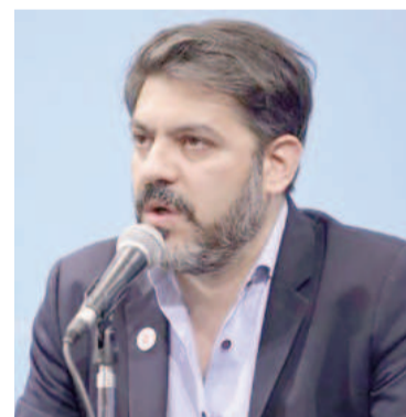
El ministro Carlos Bianco.

Además, aseguró que intendentes de la zona costera, de la región capital y el colegio de ingenieros formarán