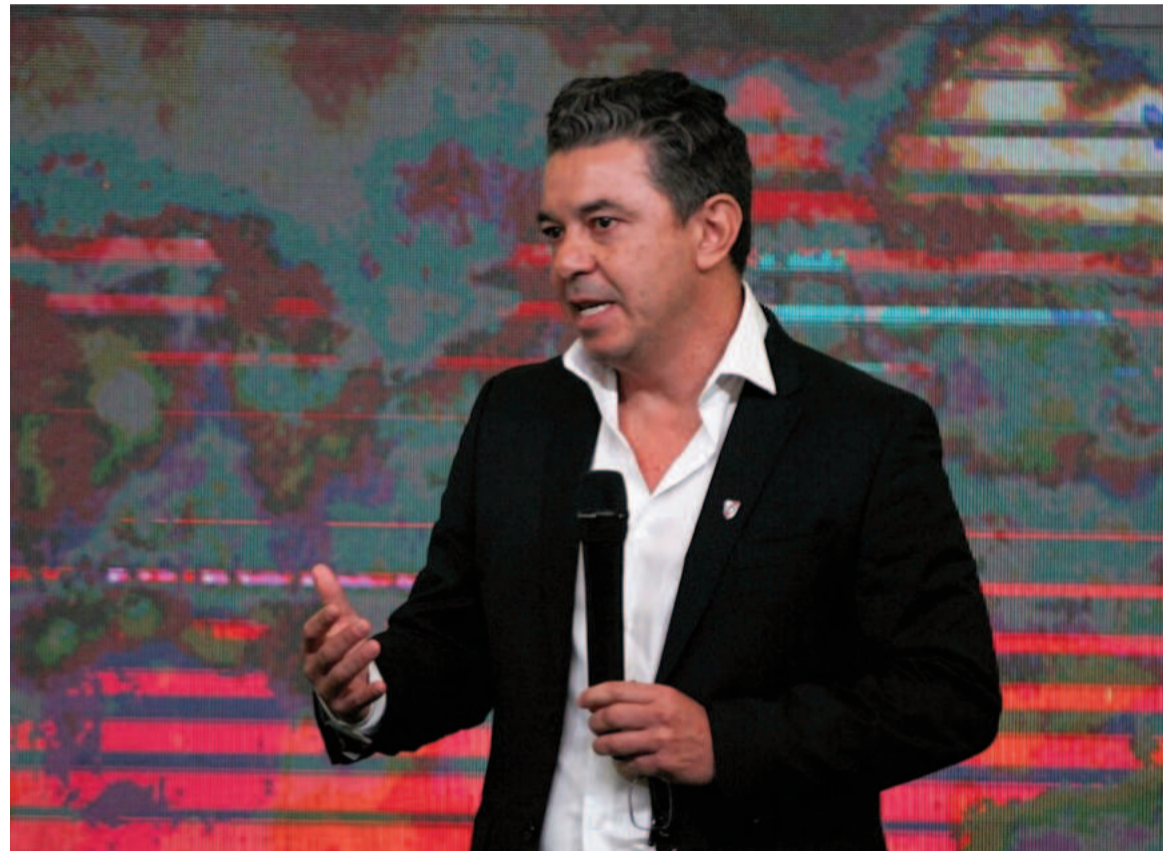
Marcelo Gallardo arrancó otra era en el club de Núñez.

«Tenemos que recuperar el espíritu de club y de equipo», definió el DT durante su presentación. El sábado dirigirá contra Huracán, el puntero de la Liga Profesional. La mente, en la Libertadores.