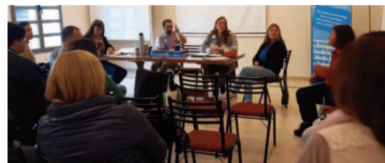
La única moción en la asamblea departamental fue la del rechazo a la propuesta.