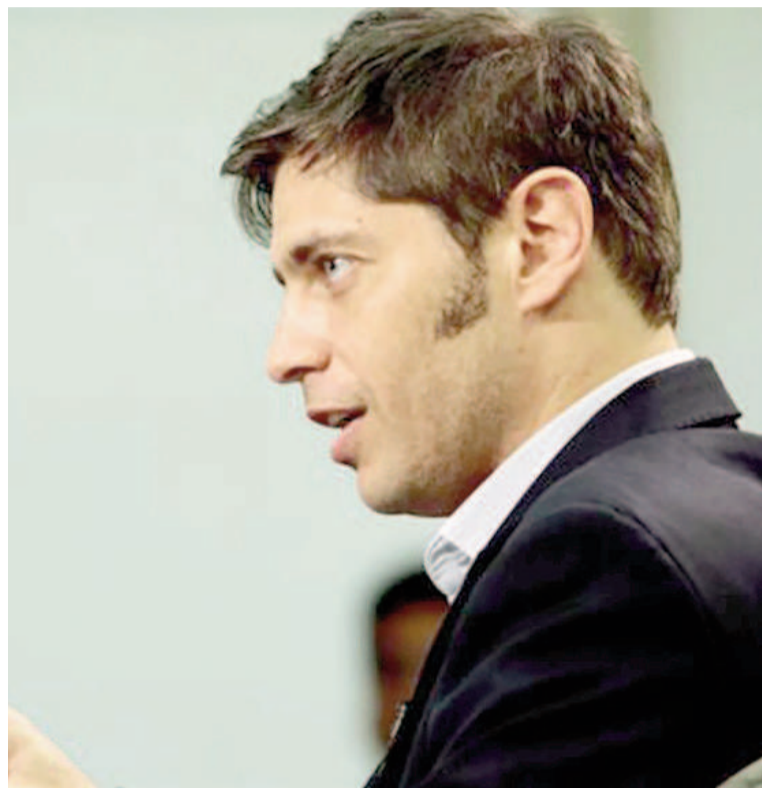
El gobernador Axel Kicillof volvió a cargar contra Milei.

“Todos los sectores tenemos muy clara la gravedad del fenómeno Milei. En el caso de la Provincia, son cotidianas y diarias las dificultades y los ataques que recibimos. Tenemos que hacer un gobierno en estas circunstancias, y no estamos de acuerdo con Milei ni hacemos lo que aconseja”, sen-