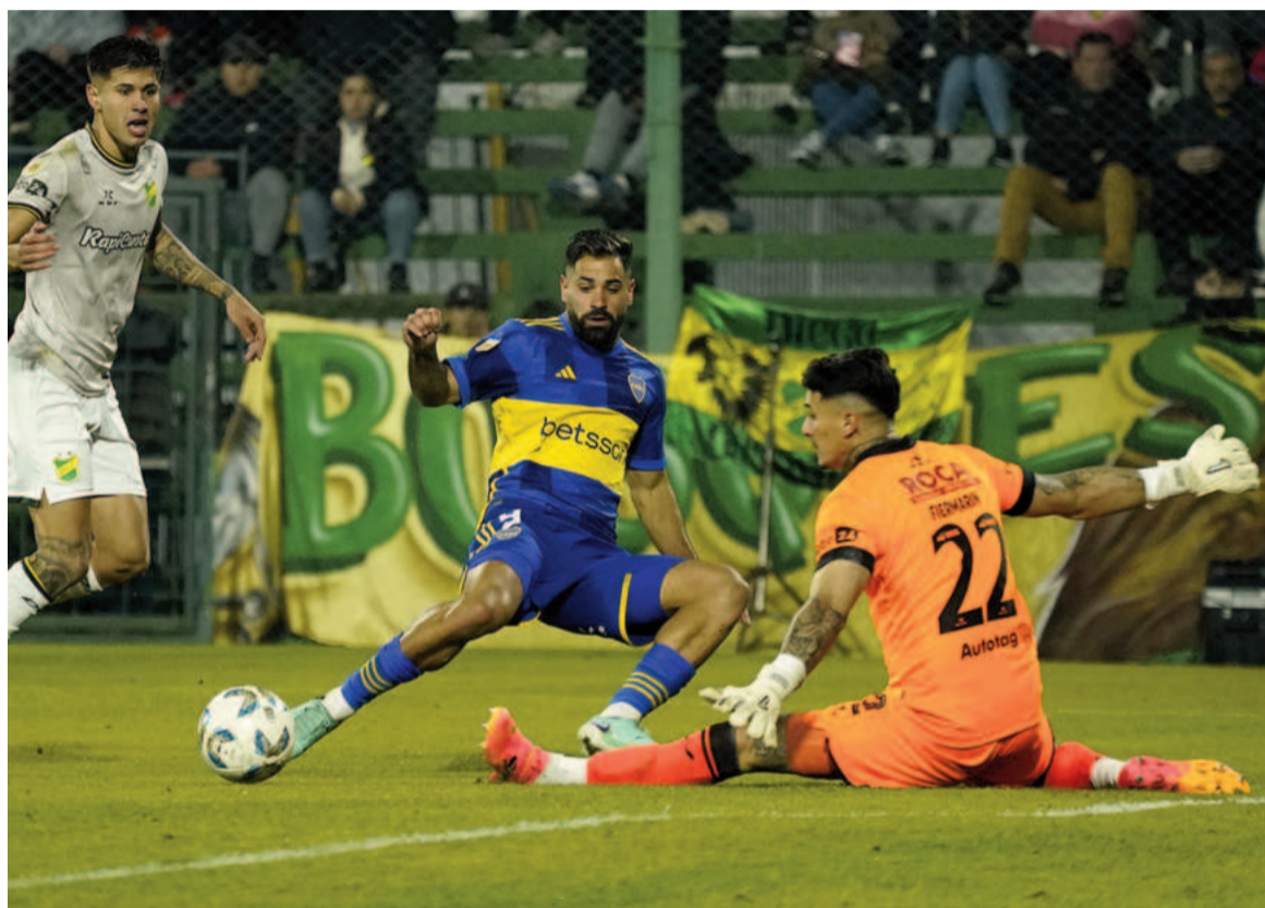
El equipo de la Ribera reaccionó y logró sumar un punto.

El Xeneize, que viene de empatar con Independiente del Valle, empató 2-2 en su visita al Halcón. Ramos Mingo y Molinas anotaron para el local, Merentiel y Gutiérrez en contra para el visitante.