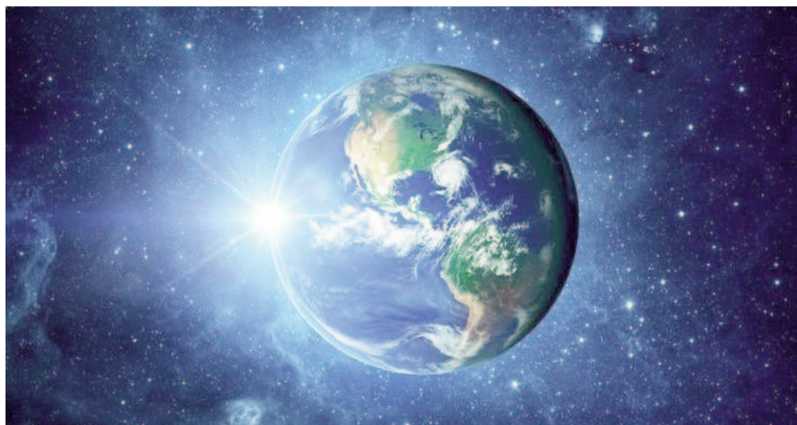
La redistribución de masa desde los polos hacia latitudes más bajas está ralentizando la rotación de la Tierra.

Esta regla establece que, en un sistema físico cerrado donde no actúan fuerzas externas, el momento angular total, es decir la medida de la cantidad de rotación que posee un objeto en movimiento, se conserva.