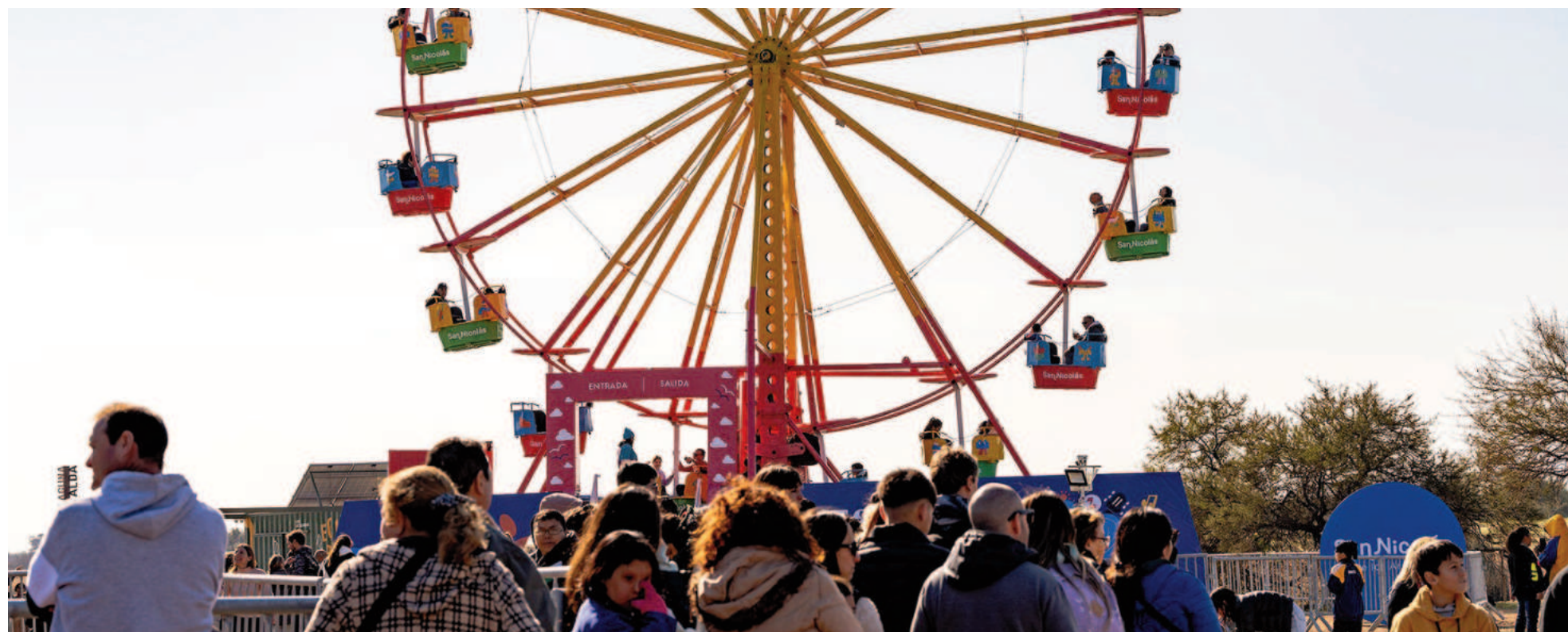
La entrada al festival es libre y gratuita, y únicamente se dan turnos en el lugar para la Vuelta al Mundo, un juego de 17 metros de altura.

El gran atractivo para las vacaciones de invierno que organizó la Municipalidad de San Nicolás acaparó la atención de las familias nicoleñas y de ciudades de la región. Los novedosos juegos como la 'Vuelta al Mundo', los inflables Flora, el laberinto y el Yaguarón, entre otros, contaron con gran demanda de niños y jóvenes. La propuesta se extenderá hasta el domingo 28, de 10:00 a 18:00.