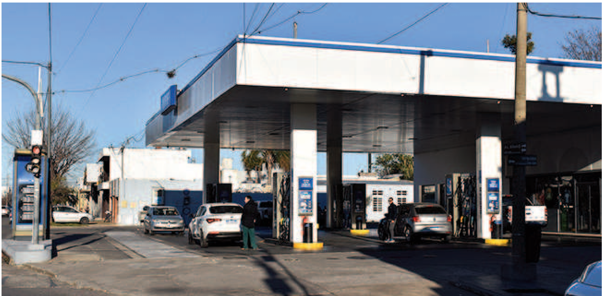
En el ámbito del expendio, señalan que naftas y gasoil podrían evidenciar una suba de entre un 10 y un 16 por ciento.

La pausa establecida para distintos impuestos concluye a fin de mes y un porcentaje de esa carga impactará de lleno en el precio de los combustibles. En esta ciudad el litro de nafta súper en la estaciones de la petrolera nacional se paga hoy $1093. Desde sendas entidades del interior de la Argentina que integran a los empresarios del expendio, anticiparon que el nuevo incremento cobraría forma ya en los días iniciales del mes próximo.