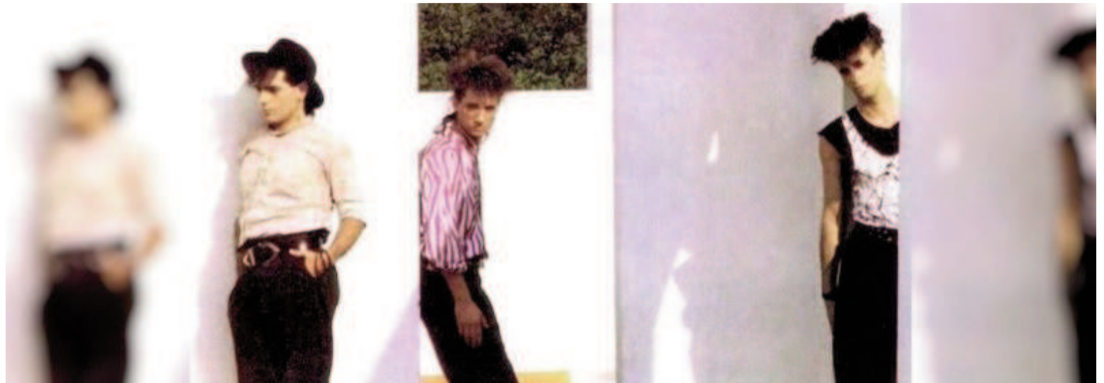
Soda Stéreo en una foto tomada en 1985, en la terraza de Centro Cultural Recoleta (CABA).

El baterista confió en una entrevista que el lanzamiento será este año, aunque no reveló fecha ni nombre. El músico explicó que se trata del primer tema que escribieron como banda y que tiene a Gustavo Cerati en la voz.