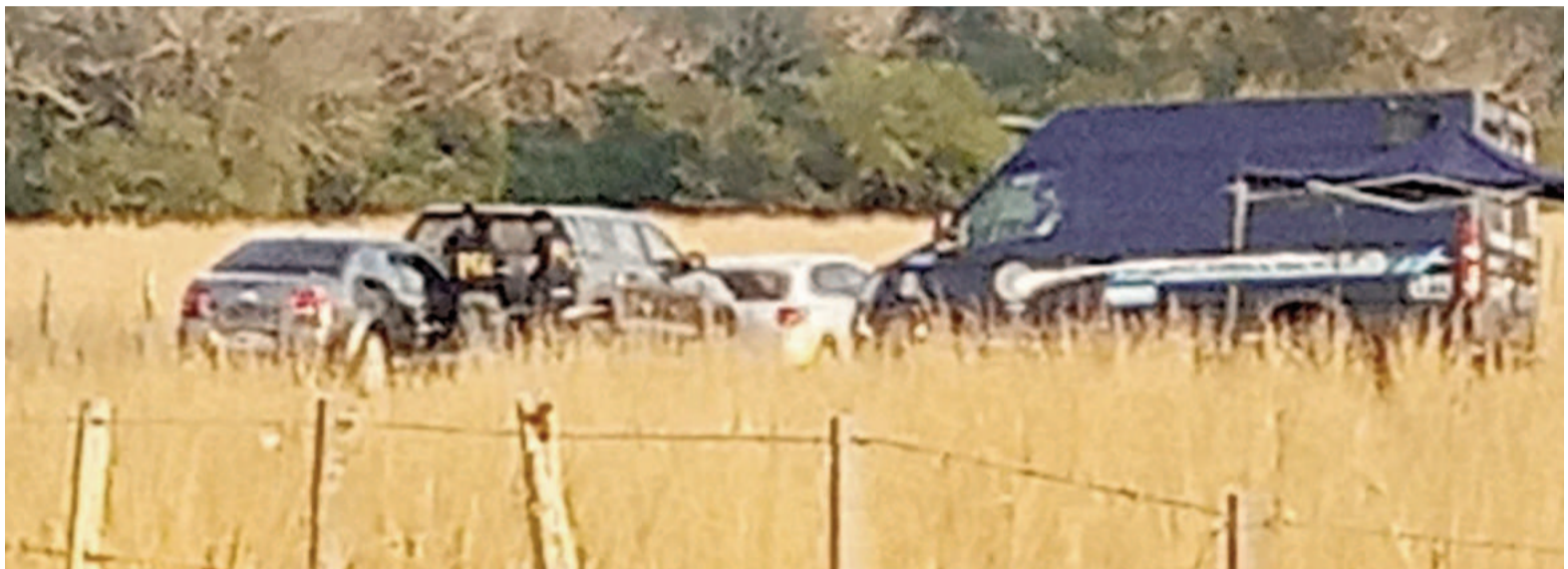
Allanamiento en la casa de un ambulanciero en un campo cercano a 9 de Julio.