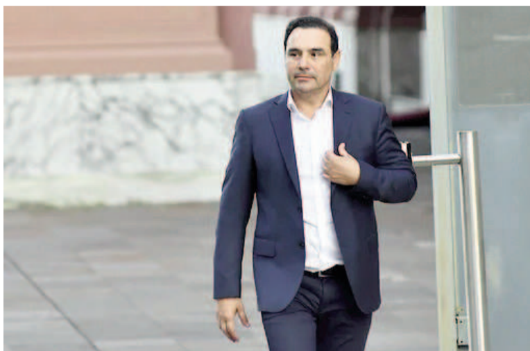
Una mujer denunció por violación al padre del gobernador correntino.

mento de radicar la denuncia judicial buscó testigos, pero ninguno se quiso presentar.