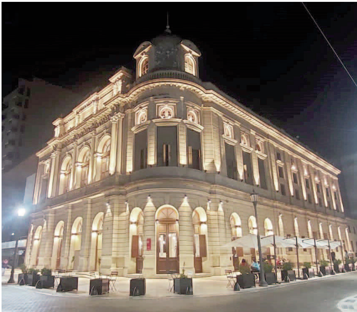
El Teatro San Nicolás fue declarado Monumento Histórico Nacional en 2011.

Por otro lado, la funcionaria anticipó que en el teatro están terminando un proyecto tecno-