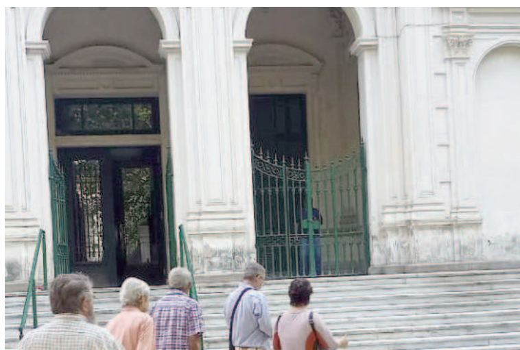
La megacausa se lleva a cabo en el TOF N° 2 de Rosario.

Se espera, luego del receso invernal y cuando se retomen las