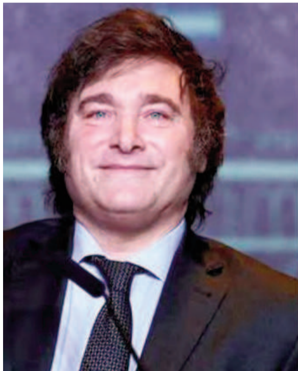
Milei embiste contra funcionario del FMI pero Georgieva lo defiende.

En este contexto, Milei y su ministro de Economía solicitaron al