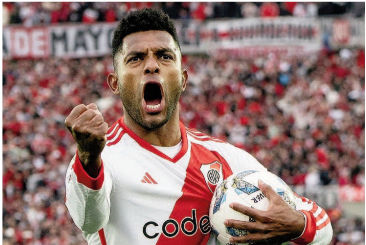
El Millonario igualó ante el Granate en tiempo adicional.

Por su parte, el Millonario prefirió apostar por un juego más central. Franco Mastantuono, el joven mediocampista por el que Real Madrid se mostró interesado, hizo prevalecer su calidad por sobre su edad y condujo los hilos del ataque riverplatense. Se juntó con Manuel Lanzini para formar una interesante sociedad de creación en el último cuarto del terreno de juego. Si bien no se pisaron, les costó encontrar destinatarios en los pases finales. Facundo Colidio y Solari no estuvieron finos ni en la recepción ni en la definición.