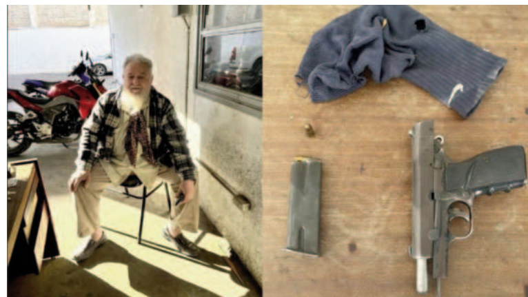
El detenido junto al arma que le secuestraron.

El detenido inicialmente se identificó como integrante de una fuerza policial federal, pero los encargados de la seguridad sospecharon. "Hubo oposición a la aprehensión, pero ya está detenido. Esta persona no poseía documentación que justificara la tenencia del arma. Se ha puesto en conocimiento a las UFI