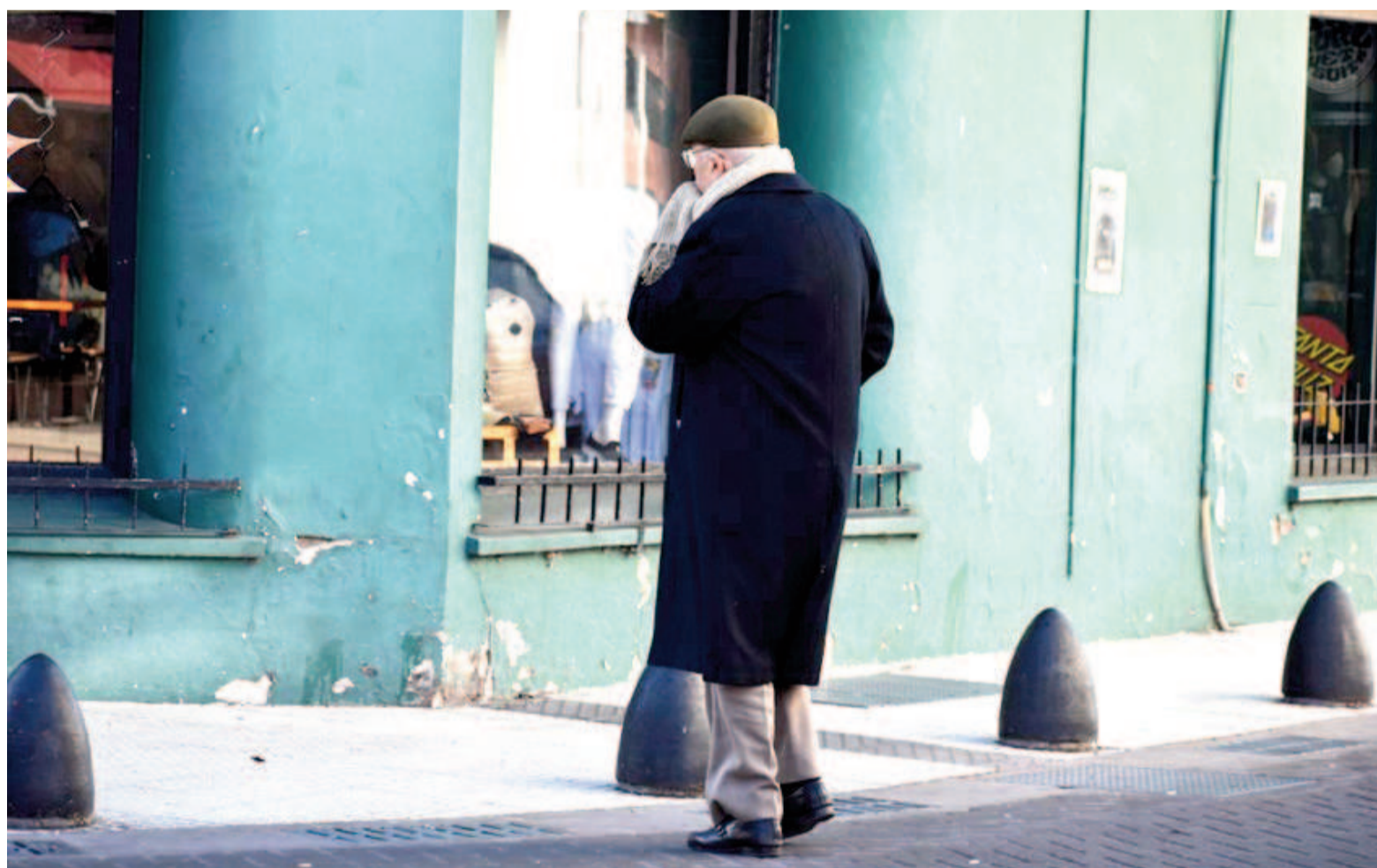
La sensación térmica bajo cero de ayer es un anticipo de lo que se espera para hoy, con temperaturas reales de -1 °C y -2 °C, respectivamente.

Y aquello era apenas un anticipo de lo que cabe esperar, al menos, durante las jornadas de hoy y mañana. Para este viernes el organismo nacional pronosticaba una mínima real de -1 °C en San Nicolás, que además registrará durante toda la jornada vientos ingresando desde el sur. Seguramente tal circunstancia volverá a tener impacto sobre la sensación térmica. Lo mismo, e incluso más acentuado, cabe esperar para el sábado, cuando la temperatura real mínima descenderá un grado más hasta ubicarse en -2 °C, todavía con persistencia de vientos del sur. La serie de tres días –viernes, sábado y domingo con mínimas y máximas de 1^{\circ}/13^{\circ} , -1^{\circ}/9^{\circ} y -2^{\circ}/11^{\circ} , respectivamente– configuran para las temperaturas medias de esta región un escenario de "ola de aire frío", según indicó a EL NORTE el meteorólogo Mauricio Saldívar, responsable de Meteored Argentina. El domingo, en tanto, se produciría una circunstancia que probablemente implique el fin de la ola: durante esa jornada, según pronosticaba el SMN, habría un cambio en la dirección predominante del viento, que soplará desde el nor-