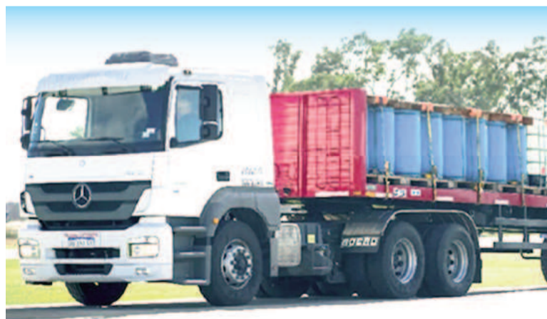
Aumentaron los costos en el transporte de carga.

Los rubros más afectados a raíz de este incremento fueron los precios