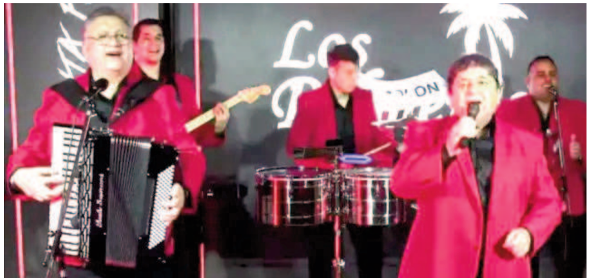
Los Palmeras se presentarán en el Festival «Tucumán es la Patria» el próximo domingo 7 de julio.

bernador de Tucumán, será quien reciba a Milei. El peronista mantiene un acercamiento al presidente en los últimos meses y lo acompañará durante su estadía. Además, decretó asueto administrativo para el lunes a partir del mediodía.