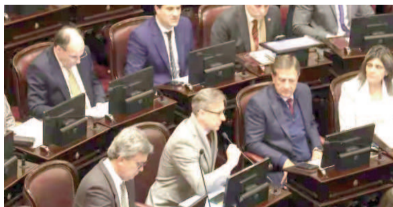
El senador y líder de la bancada radical, Eduardo Vischi, frenó la avanzada kirchnerista.