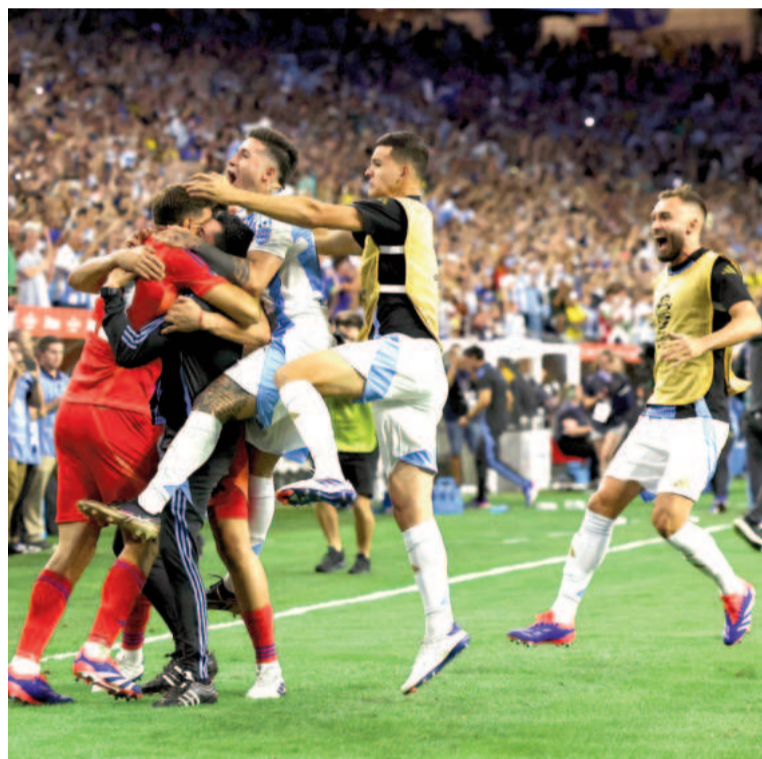
El equipo conducido por Scaloni sufrió para doblegar al Tri en Houston. WEB

Ya en el complemento, Ecuador volvió a tomar la pelota y empezó a