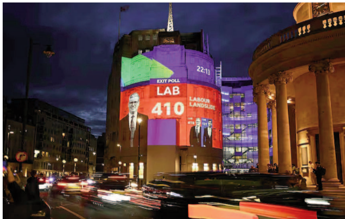
Un cartel anuncia el boca de urna con la victoria laborista de 410 escaños contra 131 de los conservadores.

Según un sondeo de boca de urna de la BBC, ITV y Sky, los laboristas ganarían las elecciones generales con una mayoría de 170 diputados. Los conservadores sufrieron su peor derrota desde principios del siglo XX.