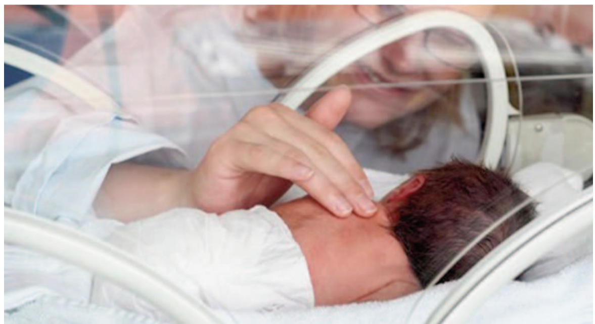
La ceremonia de entrega del ecógrafo a Neonatología será este lunes en el Hospital San Felipe. ILUSTRACIÓN