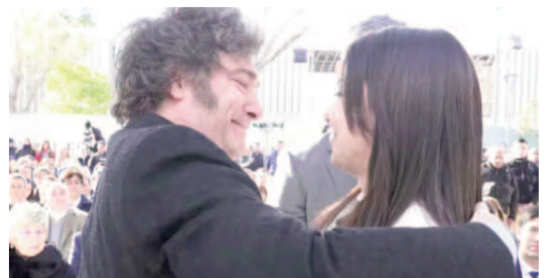
Javier Milei volvió a defender a Sandra Pettovello, ahora en San Juan.

Milei afirmó que el programa, impulsado desde el Ministerio de Capital Humano en acuerdo con los ministerios de Educación provinciales, "tiene un corazón: darle recursos y herramientas a los docentes, y elevar la