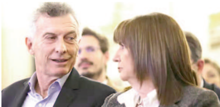
Mauricio Macri y Patricia Bullrich, y una relación que se distancia.

Un dirigente macrista reafirmó el punto clave del enfrentamiento: más allá del apoyo a "los cambios que proponga el gobierno de Milei", el PRO "no debe fusionarse con La Libertad Avanza". El macrismo (que cuenta con el apoyo de los gobernadores del PRO), consolidado en la conducción partidaria, tras la asamblea publicó un documento en el que marca el rumbo a seguir: "Somos el cambio o no somos nada. El PRO no se fusionará con otros partidos. Apoyamos al gobierno de Javier Milei y todas las iniciativas que acompañen el cambio que la Argentina votó".