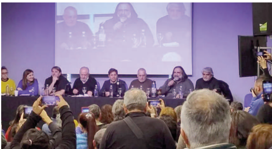
El gobernador bonaerense participó de un plenario de la CTA.

El Gobernador también sostuvo que el plenario “es un espacio ne-