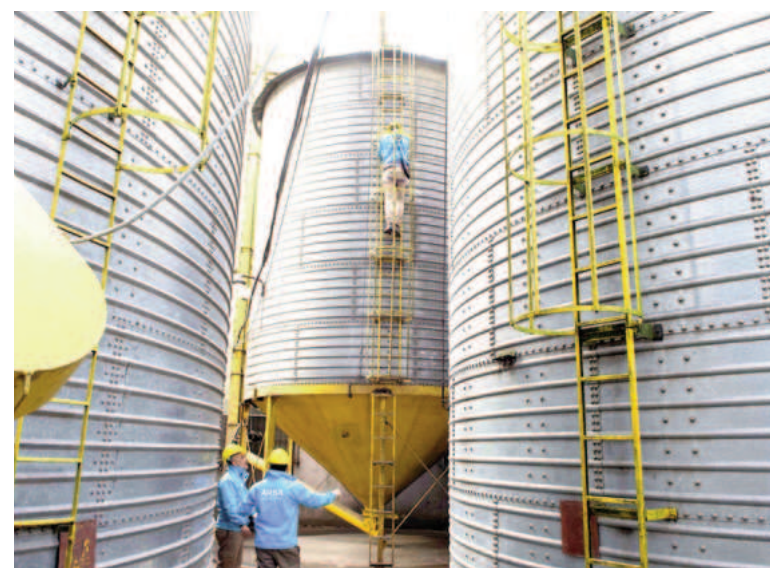
ARBA desplegó controles antievasión en la zona núcleo.