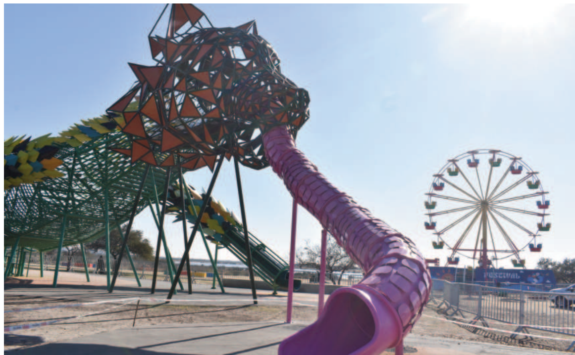
El acceso principal será por Av. Illia y Dámaso Valdés, y también se podrá ingresar por el Eco Parque en la Costanera. EL NORTE

Este año se incorpora, también, la Vuelta al Mundo, un juego que alcanza los 17 metros de altura. En este caso, quienes quieran subir deberán inscribirse previamente solicitando