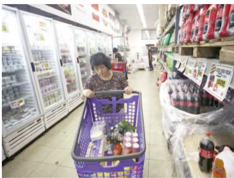
La inflación de junio fue superior a la de mayo.

las declaraciones de Caputo al indicar que el IPC se ubicaría por debajo de los 5 puntos porcentuales. Fue una oportunidad para que el mandatario atacara a las previsiones de los “econochantas” que, según sus dichos, preveían números más altos.