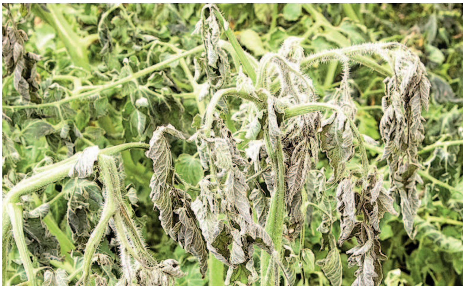
Según advirtió la Bolsa de Comercio de Rosario, las bajas temperaturas y las consecuentes heladas ya repercutieron en cultivos de todo el país.

Desde el comienzo de julio, hace poco más de una semana, las temperaturas mínimas y máximas prácticamente no superaron los 10°. Las mínimas se mantuvieron entre -2 y -7,5 °C en varias regiones: el norte de Buenos Aires, el sudeste de Córdoba y el sur de Santa Fe fueron las áreas más afectadas. Chacabuco registró la temperatura más baja del período, con -7,8 °C. Mientras que localidades como Rojas, Bengolea, Hernando y Álvarez también expe-