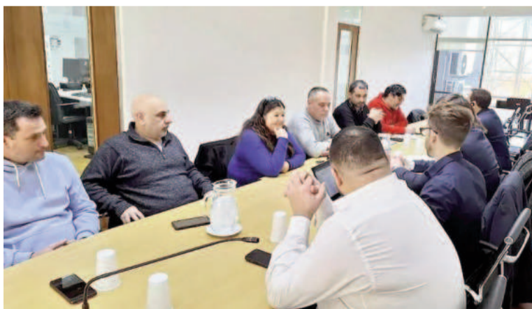
Los judiciales también aceptaron el 6,5% de la Provincia.

“Valoramos que en un contexto tan difícil como el que está atravesando el país y la provincia de Buenos Aires, el gobierno provincial siga apostando a sostener la negociación paritaria y permita