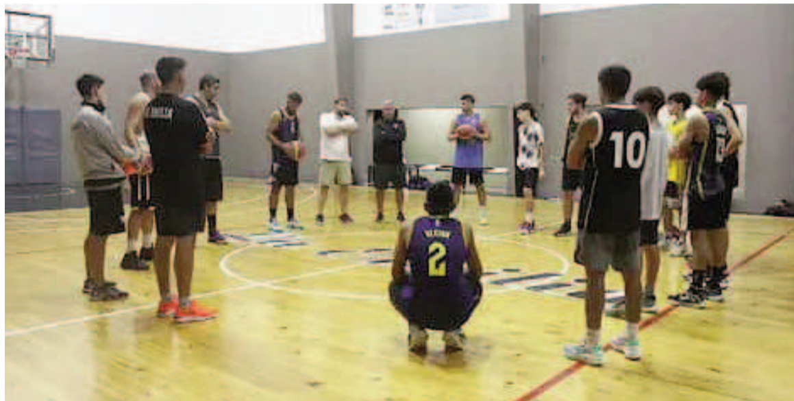
La Emilia hizo todo lo posible para ser campeón. Hoy podría encontrar su merecido premio.

En caso de ganar los emilianos se consagrarán por primera vez campeones en la máxima categoría desde la creación de la Asociación de Básquetbol de San Nicolás y la instauración de la competencia en 1985. En tanto, si hoy Mitre se queda con el triunfo el campeonato será para Los Andes de Villa Ramallo (otro que nunca festejó hasta el momento). Ganando, el Pañero llegará a los 26 puntos y alcanzará en lo alto de la tabla a Los Andes (quedando ambos con un récord de 12-2), aunque ante esta posibilidad, en el desempate de favorecerá La Emilia, que