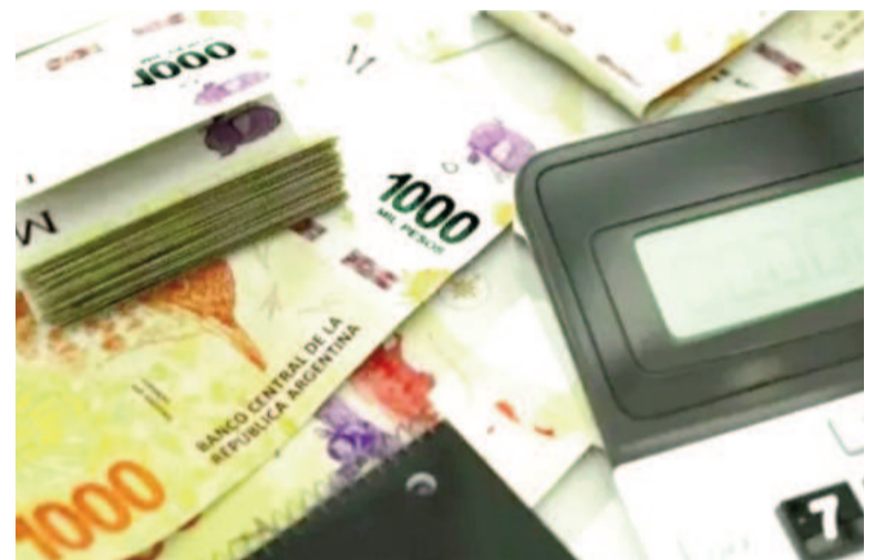
Aún resta conocer la normativa correspondiente a la AFIP, al Banco Central y la CNV.

Tras la promulgación de la reforma fiscal, el Gobierno reglamentó parte de la ley 27.743 a través del decreto 608, el cual abarca el blanqueo de capitales para compra de inmuebles y vehículos, entre otros. El decreto, publicado este viernes en el Boletín Oficial, establece la implementación de un Régimen de Regularización de Activos del país y del exterior. Sin embargo, aún resta conocer la normativa correspondiente a la AFIP, al Banco Central y la CNV. A partir de su implementación, quienes blanqueen dinero destinado para la compra de inmuebles o automóviles podrán hacerlo sin pagar multas ni penalidad hasta la suma de $100.000 dólares.