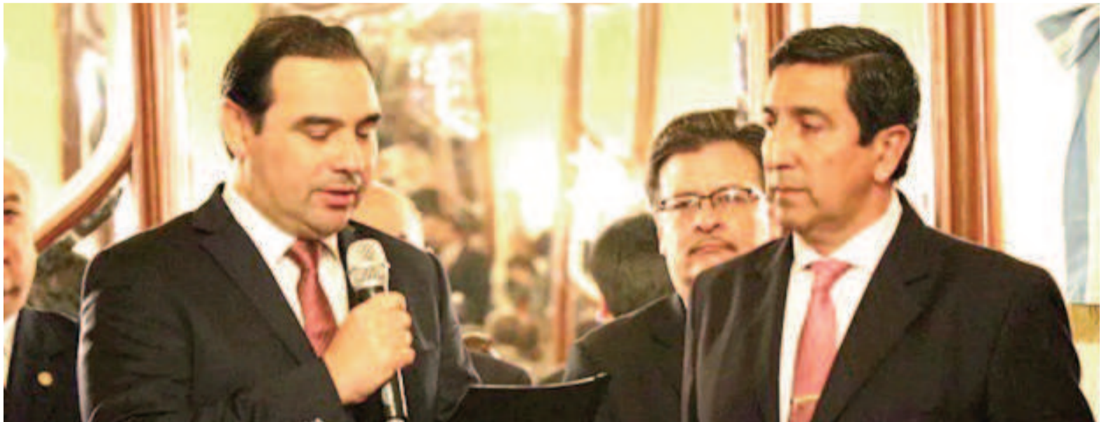
Duarte asumió el cargo en el segundo mandato de Gustavo Valdés.

La medida fue dada a conocer hace minutos y se espera que el lunes 15 de julio el gobernador Gustavo Valdés le tome juramento en Casa de Gobierno. Vallejos es diputado nacional desde 2023 por el partido de la Unión Cívica Radical. Su periodo iba a durar hasta 2027, pero ante esta nueva función que cumplirá no hay información sobre qué sucederá. Esta renuncia se da en la misma jornada en la que Fernando Burlando