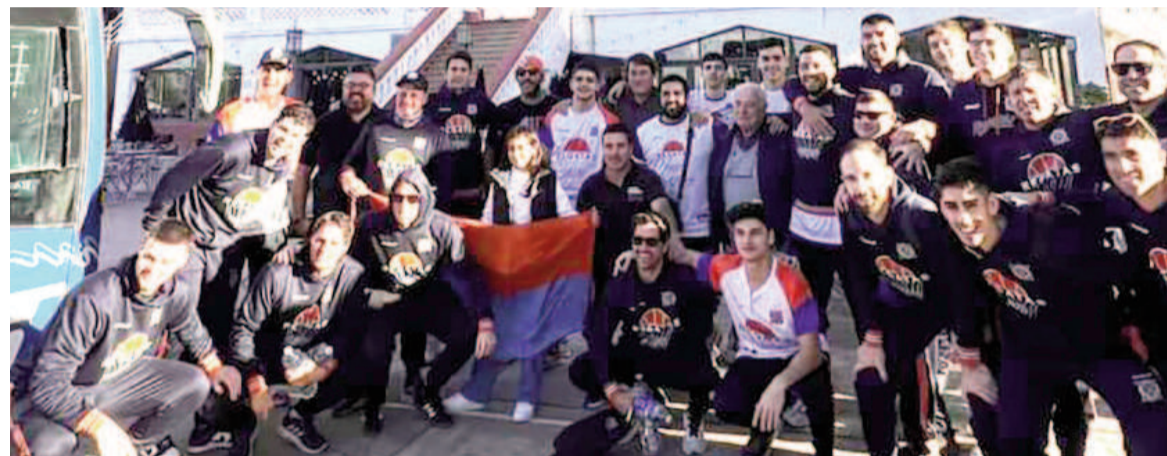
El plantel de Regatas viajó ayer por la tarde rumbo a la Capital Federal.

El Náutico buscará igualar la serie por el ascenso de la región Sur cuando visite en la Capital Federal desde las 20.30 al equipo porteño, que le ganó el domingo en Villa Ramallo y quedó match point. Si ganan, los regatenses llevarán la definición a un tercer juego.