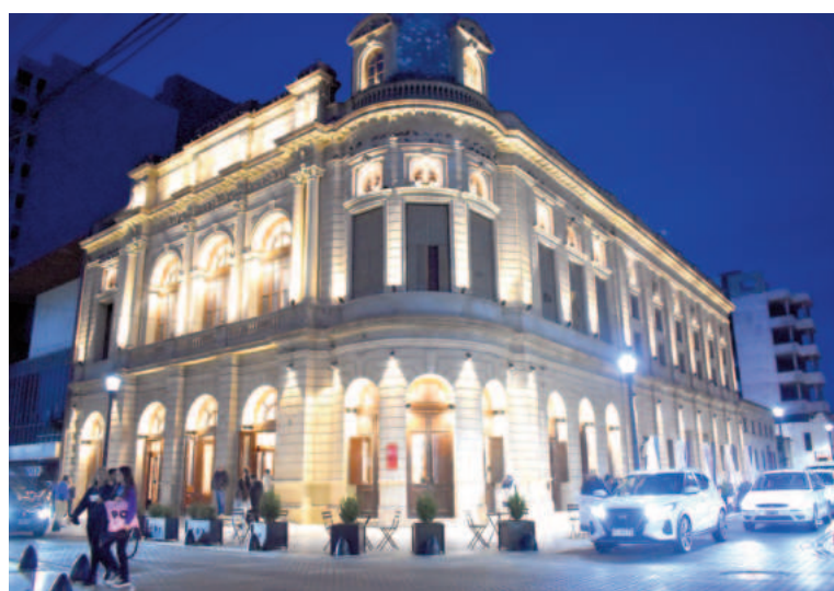
“La noche porteña” invita a los nicoleños a una puesta colmada de música y danza en el Teatro, de la mano de Cultura Ternium.

mitirá contribuir con Manos que Dan para la creación de una Escuela de Streaming, proyecto de