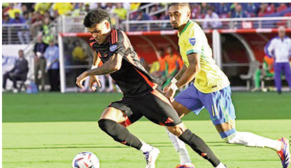
Colombia y Brasil igualaron en San Francisco y el Cafetero ganó el Grupo D.