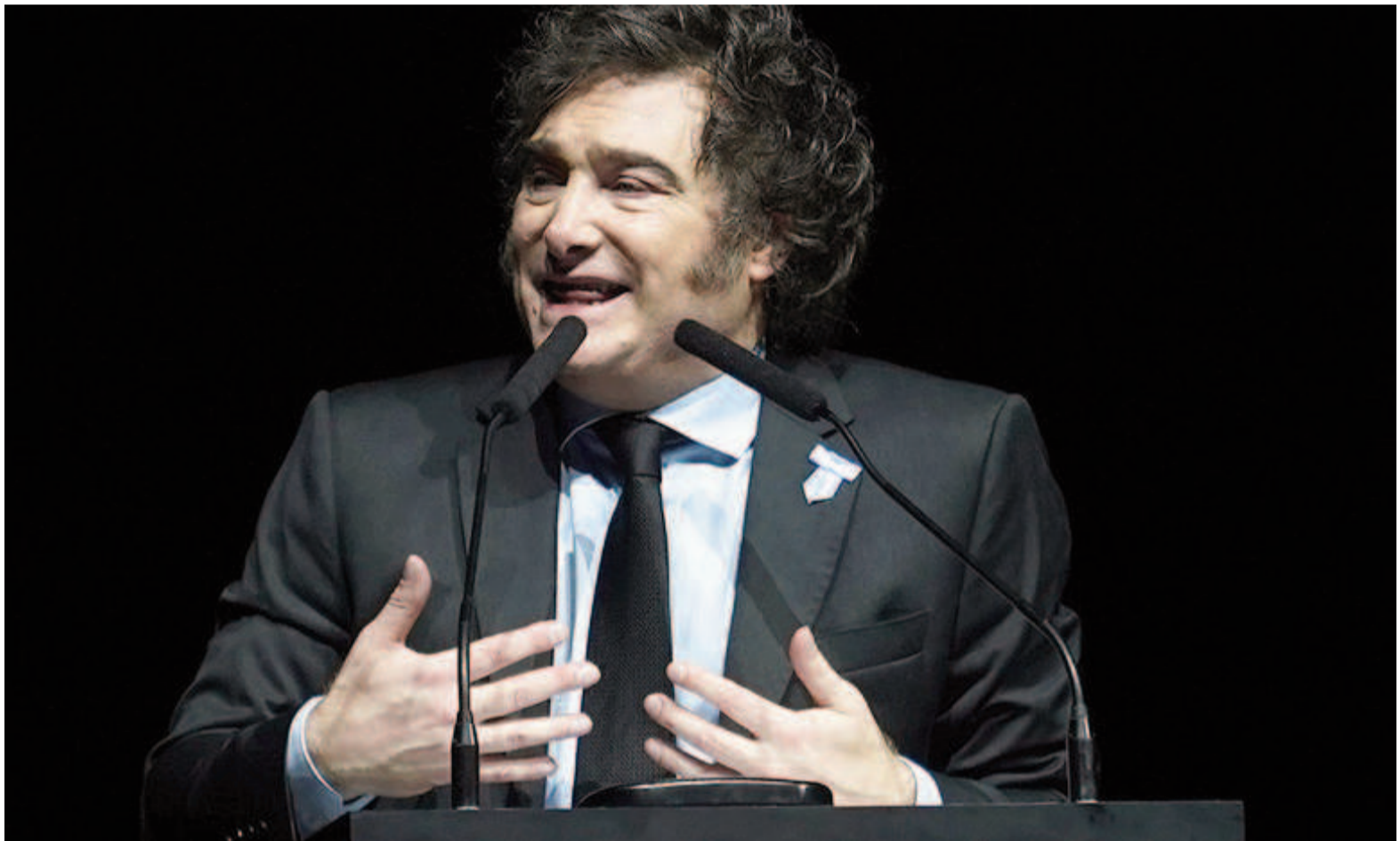
Milei habló de autogolpe y Bolivia llamó a su embajador en Buenos Aires.

Al insistir con la idea del «fraude montado», el mandatario salió al cruce, también, del comunicado que el Gobierno de Arce dio a conocer este lunes demandando respeto y rechazando por «inamistosa y temeraria» la comunicación oficial de Argentina. Desde Bolivia advirtieron que la amistad entre los países «no debe ser perturbada por intereses mezquinos e ideologías fascistas». Además, Bolivia citó al embajador argentino –que asistió esta noche– y llamó en consultas a su diplomático en Argentina. Al dar cuenta de ese comunicado, la canciller interina de Bolivia, María Nela Prada, confirmó, además, que citaron al embajador argentino en La Paz y llamaron en