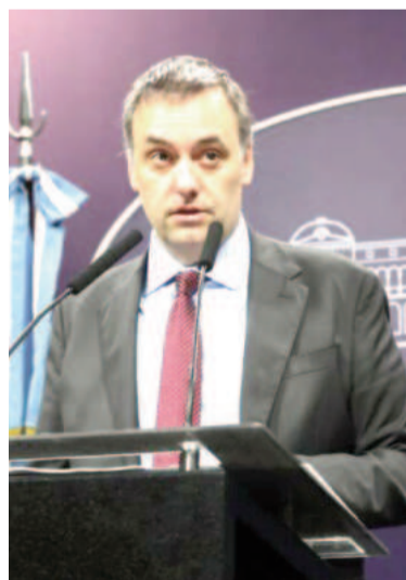
Vocero presidencial Manuel Adorni.

generando confusión en algo donde no lo hay. El camino es claro, la convicción es firme y sabemos lo que vamos haciendo a cada paso. Con el Gobierno anterior el riesgo país llegó a 2900 puntos. Ahora esos mismos cuestionan el nivel del riesgo país de estos días que, por supuesto, está explicado en un 100% por lo que ellos dejaron".