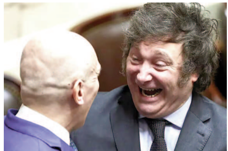
Javier Milei ríe durante una charla con José Luis Espert en el Congreso.

De todos modos, Espert pidió mirar los datos positivos que se generaron desde la llegada de Milei a la Casa Rosada: "El BCRA ha acumulado 10.000 millones de reservas netas; el riesgo país era el doble en septiembre de 2023; el dólar libre ajustado por los precios hoy sería de $2600 y estamos en $1400. Entonces, hay un medio vaso vacío, que son las tapas de los últimos días, pero hay un medio vaso lleno porque veníamos de un lugar horrible y estamos muchísimo mejor que en ese lugar horrible".