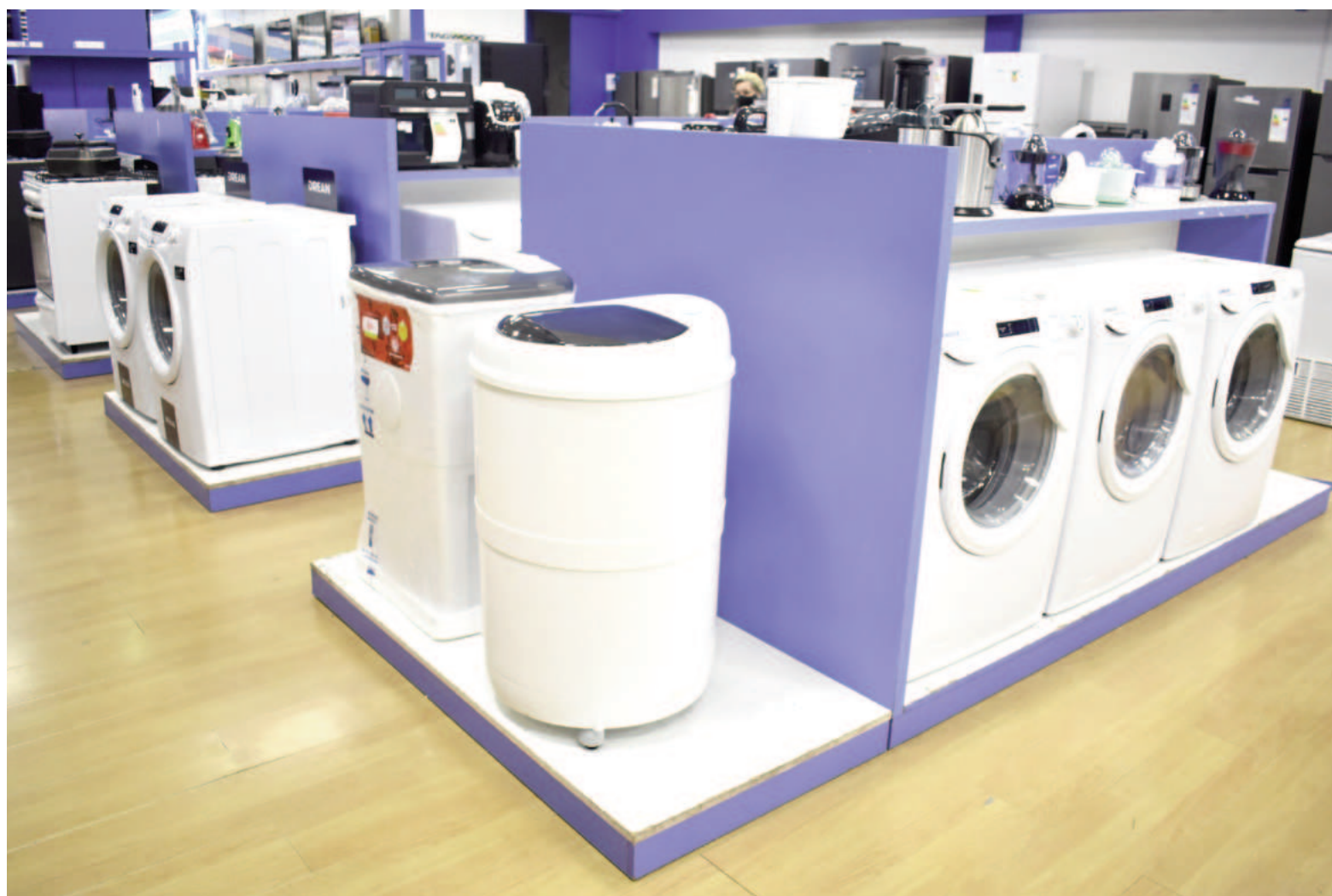
La venta de los productos de línea blanca se frenó de manera abrupta en las principales sucursales de cadenas de electrodomésticos.

“Si vamos a lo fino, todos los electrodomésticos de la línea más premium no tienen salida desde el año pasado. Antes, cuando se te rompía la heladera o el lavarropas, venías