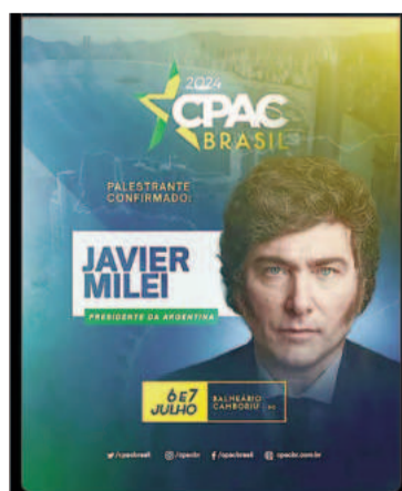
Brasil promueve la visita de Milei.

El vocero presidencial, Manuel Adorni, confirmó que «por cuestiones de agenda no va a ir a la cumbre del Mercosur, como tenía previsto días atrás», para evitar «una sobrecarga en la agenda». Es que el lunes próximo está previsto el inicio, a la medianoche, de la vigilia previa al Pacto de Mayo, que se firmará en Tucumán.