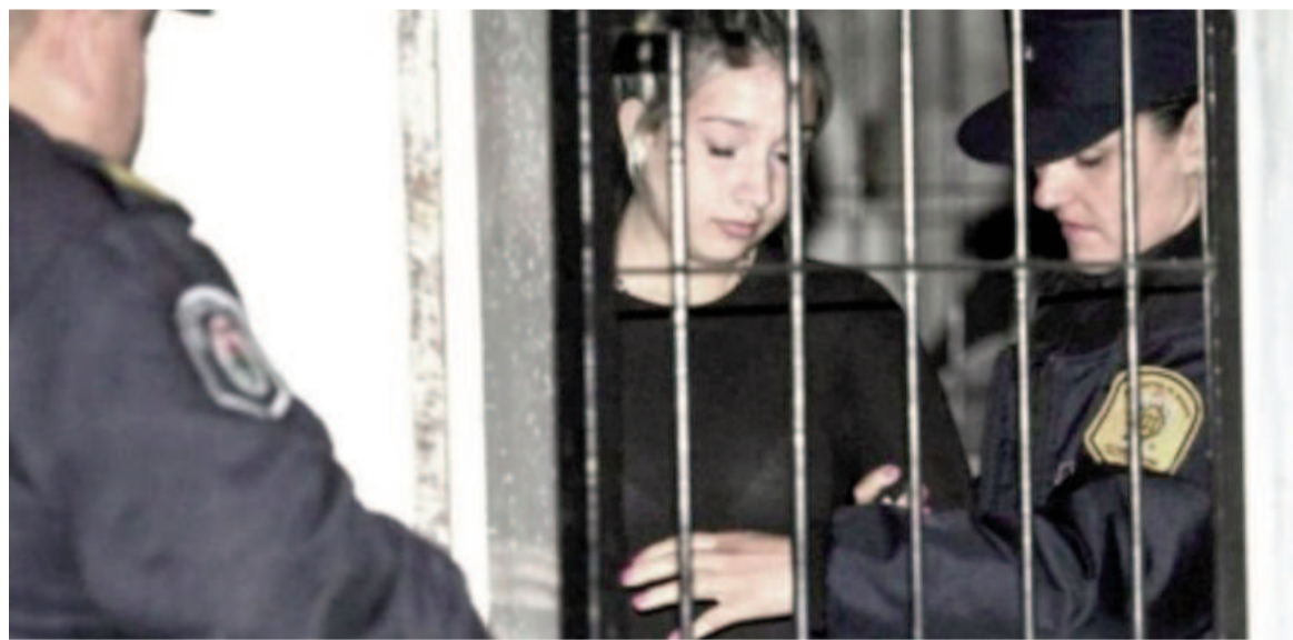
El máximo tribunal rechazó el recurso extraordinario y confirmó así la sentencia.

El fallo fue firmado por los jueces Ricardo Lorenzetti, Juan Carlos Maqueda y Horacio Rosatti. "El recurso extraordinario, cuya denegación originó esta queja es inadmisibles", di-