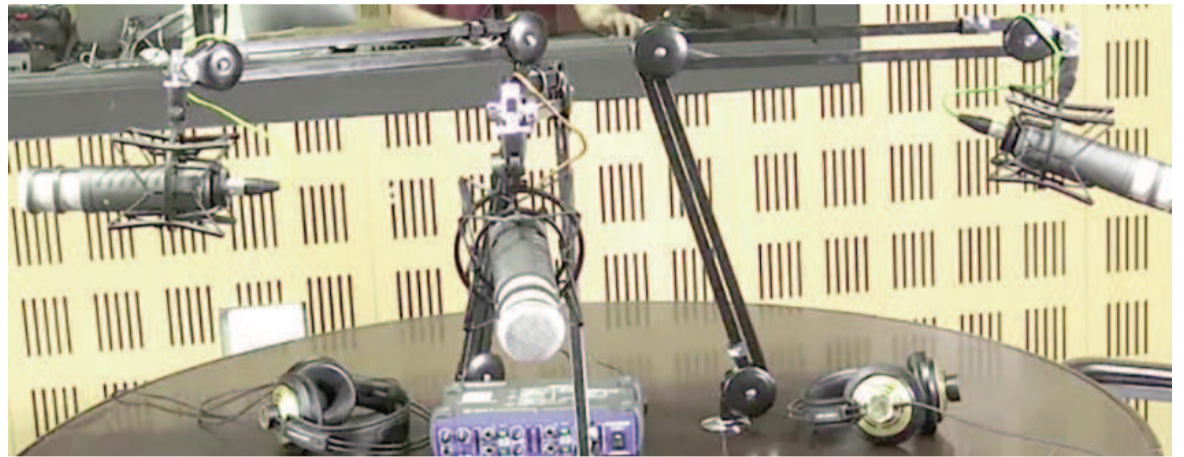
Estudio de radio, uno de los lugares de tareas del locutor.

Entonces, el 3 de julio de ese mismo año, 21 locutores se reunieron en la redacción de la Revista Antena y dicho encuentro se estiró hasta la madrugada. Así, se creó la Sociedad Argentina de