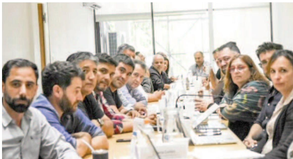
Los gremios provinciales vuelven a reunirse en paritarias.

Hasta el momento, los sueldos de los empleados públicos aumentaron en la provincia un 25% en enero (que incluyó parte del acuerdo de 2023), un 20% en febrero, un