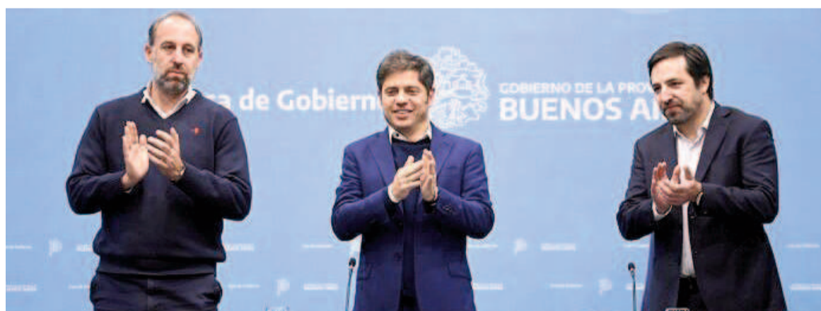
El gobernador Axel Kicillof efectuó anuncios junto al ministro de Salud, Nicolás Kreplak.

En el Salón Dorado de la Casa de Gobierno, el gobernador Kicillof