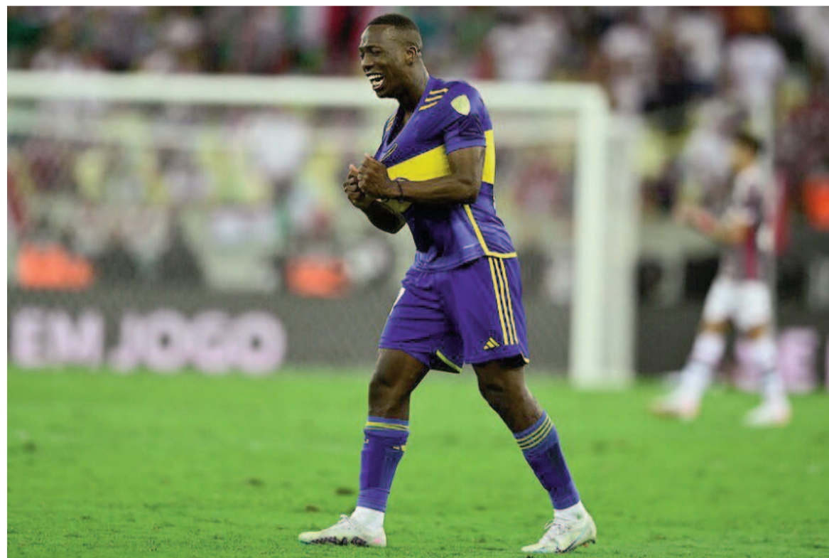
El conjunto de la ribera tratará de rescatar un buen resultado. WEB

El Xeneize visitará hoy desde las 21.30 a Independiente del Valle con un plantel diezmado entre los convocados a la Sub 23, el yerro en las inscripciones y la lesión de Cavani.