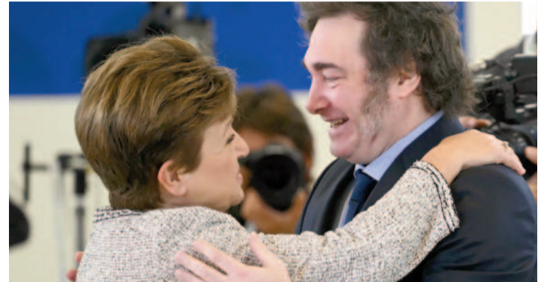
Georgieva, titular del FMI, junto al presidente Milei durante la reunión del G7, en junio pasado.

Dijo además que las metas fiscales y de reservas se siguen alcanzando y que se ve una reducción de la inflación