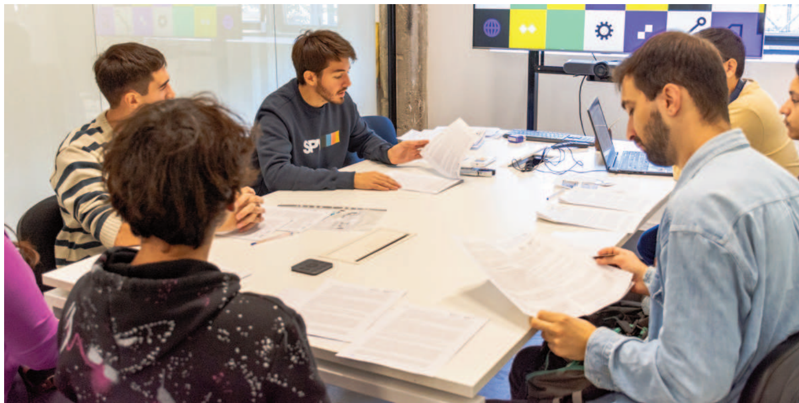
El curso es gratuito y está diseñado para brindar a los participantes una base sólida en desarrollo web.

de 19:00 a 21:00 horas, con la opción de elegir entre los días lunes y miércoles o martes y jueves, adaptándose así a diferentes disponibilidades.