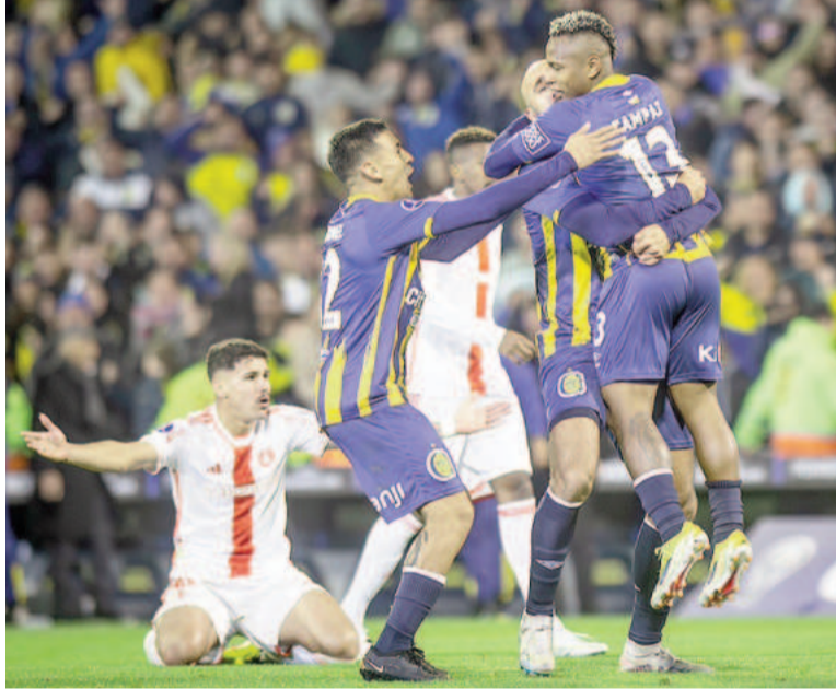
El equipo de Russo sacó ventaja como local y definirá en Porto Alegre.

Sin dudas tras el descanso el conjunto local, dirigido por Miguel Ángel Russo volvió al campo de juego con otra actitud y a buscarlo desde la primera pelota. Tanto fue