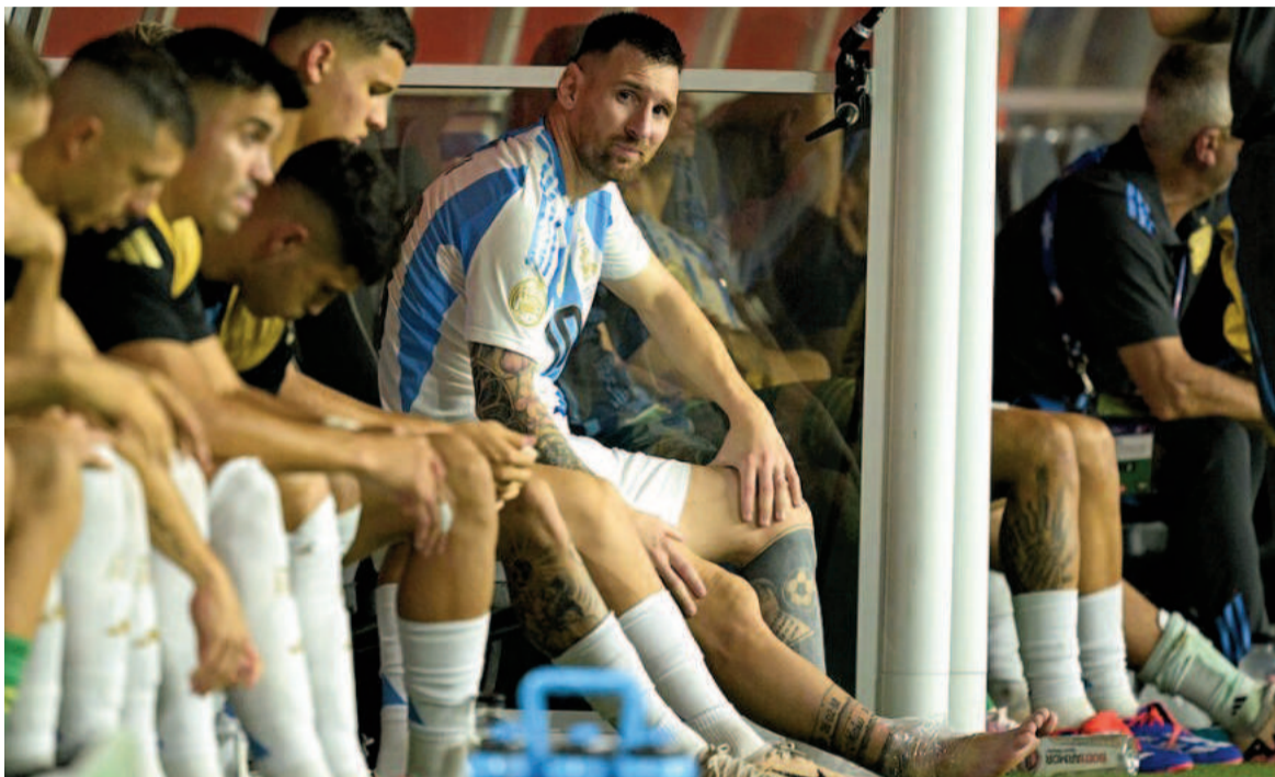
La lesión del crack rosarino no resultó tan grave. WEB

Inter Miami confirmó el grado de lesión que tiene la Pulga en su tobillo derecho, pero de todas maneras no será sometido a cirugía ya que el problema se corrige solo. Aún así, estará un tiempo prolongado inactivo.