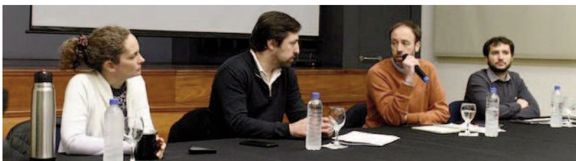
"Tenemos un sistema que está haciendo un muy buen trabajo", sostuvo Nicolás Kreplak.

El ministro de Salud, Nicolás Kreplak, enfatizó la capacidad del sistema de salud para llegar a todos los bonaerenses con calidad, incluso en tiempos de crisis. "Tenemos un sistema que está haciendo un muy buen trabajo", comentó, subrayando la importancia de valorar el esfuer-