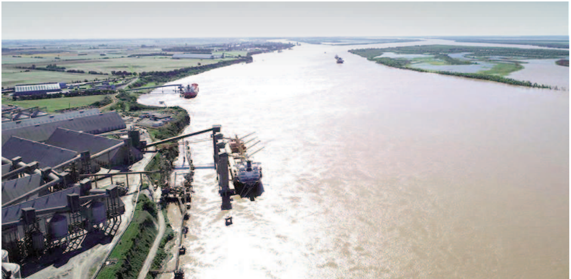
Ayer lunes, la medición del río Paraná en San Nicolás arrojó un registro de 1,13 metros, muy por encima del 0,53m relevado el jueves.