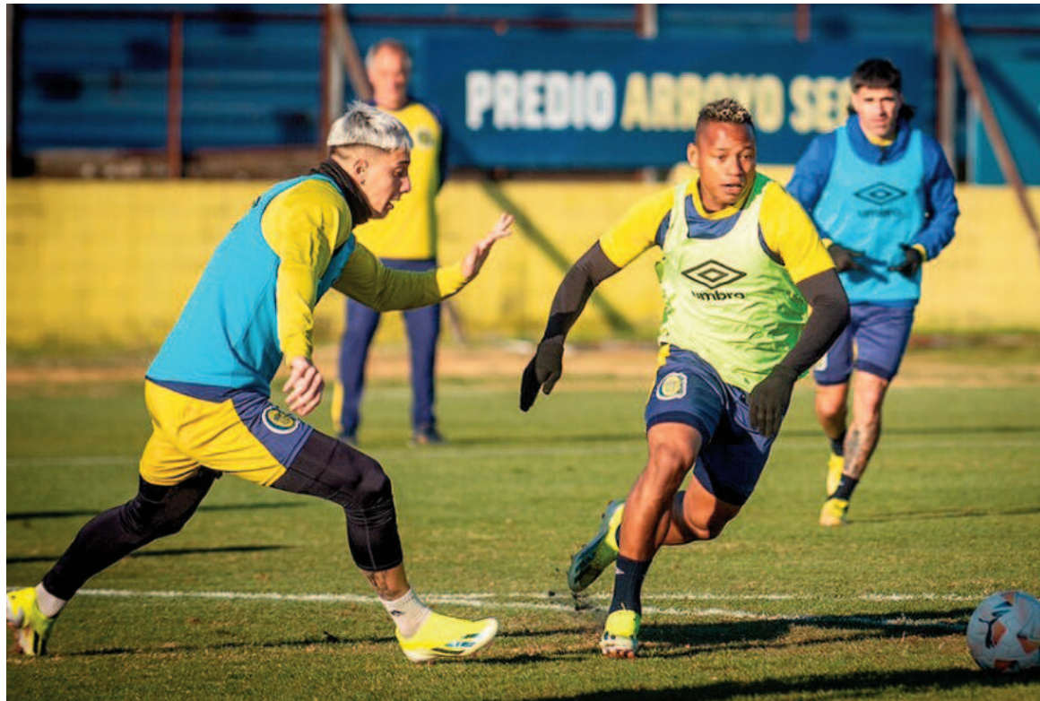
Central irá por la clasificación ante el Inter brasileño. WEB

El canalla visitará hoy desde las 21.30 a Internacional de Porto Alegre necesitando un empate para seguir en carrera, tras el 1 a 0 conseguido en Arroyito en el partido de ida.