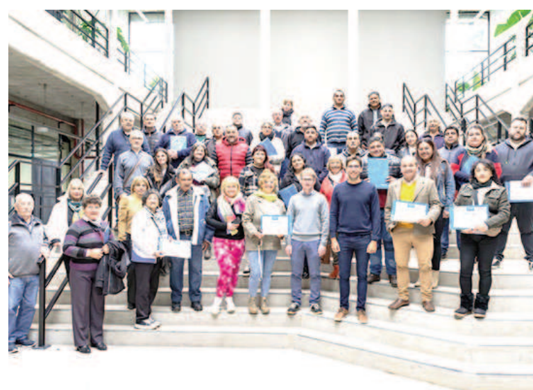
El intendente recibió a los vecinalistas en la Municipalidad.

En esta oportunidad, asumieron las comisiones vecinales de los barrios Parque Sarmiento, Los Pinos, San Martín, Los Viñedos, Ponce de León, Santa Clara, Santa Rosa, Somisa, Tierras del Sol, Suizo, Trípoli, Autopista, 7 de Septiembre, Villa Esperanza, Cavalli, Colombini, Colonial, Islas Malvinas, Las Mellizas, La California, Las Viñas y Los Fresnos.