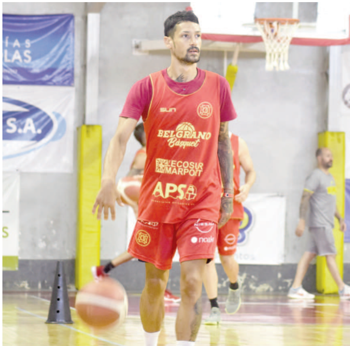
El Cachorro cambiará de colores a partir del próximo Prefederal.