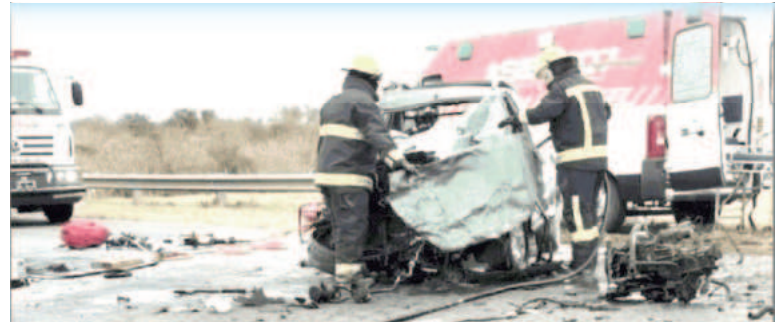
El choque se dio por razones que se investigan.