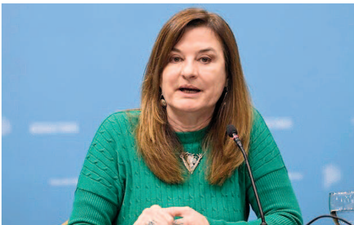
La ministra de las Mujeres, Políticas de Género y Diversidad de la provincia de Buenos Aires, Estela Díaz.

que se fortalecerá la línea 144 ante la falta de respuesta nacional, que hace que las mujeres terminen desistiendo de comunicarse, para que todas las llamadas del conurbano, que antes por una cuestión de líneas y de antenas entraban a la nacional, ingresen al 144 bonaerense.