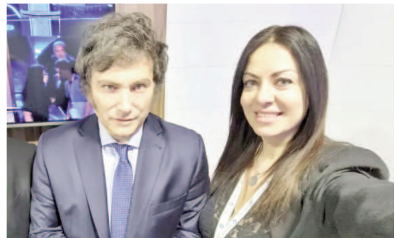
Sigue la polémica por los alimentos retenidos en depósitos del Ministerio de Capital Humano.

Para el Gobierno, la resolución del juez Lara Correa "reconoce el trabajo que se viene realizando" desde el Ministerio de Capital Humano. "Los argumentos por los cuales el juez hizo lugar a la medida podrían ser utilizados para rechazarla. Se validó la implementación actual de