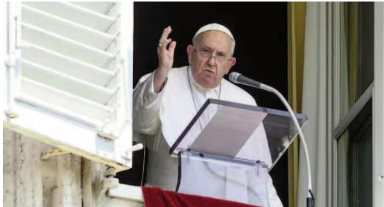
El papa Francisco durante la oración del Ángelus en el Vaticano.

Recién en 1907 se creó la actual Diócesis de Santiago del Estero en cuyo territorio había funcionado la