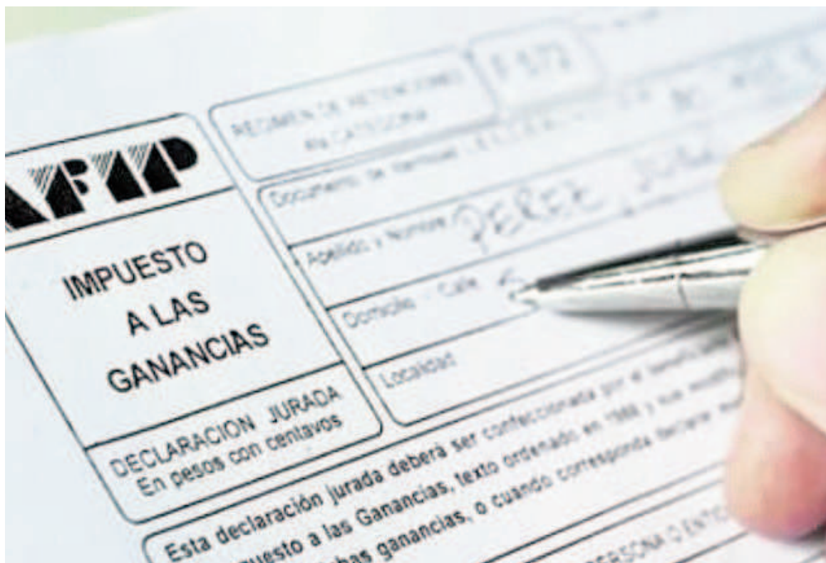
El Gobierno reglamentó los cambios en el Impuesto a las Ganancias tras la aprobación del paquete fiscal.

En ese sentido, la actualización del mínimo no imponible se hará de forma trimestral durante este año, en septiembre, y luego de forma se-