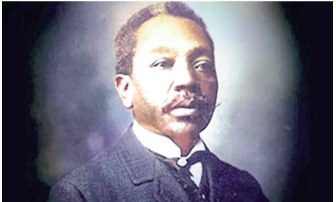
Gabino Ezeiza fue uno de los precursores de la payada en Argentina.

Gabino era conocido como el 'Negro' Ezeiza. Nació en el barrio porteño de San Telmo el 3 de febrero de 1858 y falleció el 12 de octubre de 1916. El cantante y compositor fue uno de los precursores de este género narrado y contribuyó para profesionalizarlo al introducir el contrapunto (la payada a dúo o duelo cantado).