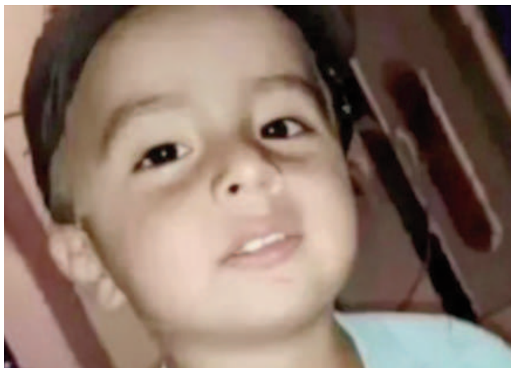
La Conferencia Episcopal Argentina mostró su preocupación por el caso Loan.

"Junto al Equipo No a la Trata, perteneciente a la Conferencia Episcopal, queremos reiterar en este día nuestra mirada sobre la situación actual y afirmar la necesidad de un Estado activo en el combate del delito de Trata de personas, con diseño, planificación, ejecución, seguimiento y control de las políticas públicas de prevención. Es imprescindible contar en todo el territorio nacional con personas que tengan formación y experiencia. Es prioritario contar con presupuesto para la prevención, la