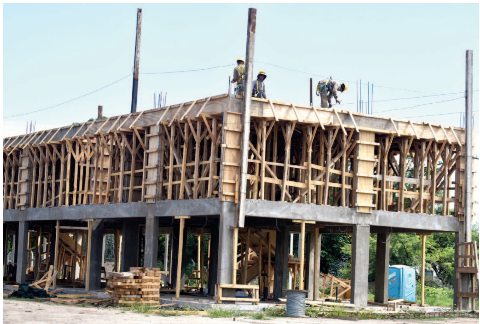
Sólo entre diciembre y febrero, la Uocra de San Nicolás perdió más de 180 puestos por la paralización del desarrollo Procrear de zona sur.

En cuanto al impacto del freno en la obra pública, en el dato de empleo de noviembre se contaban – por ejemplo – los 120 obreros que