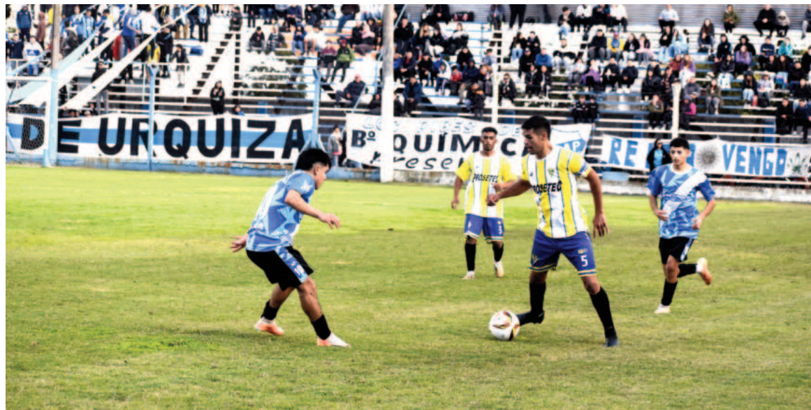
Doce visitará a Conesa con la premisa de conseguir la recuperación. EL NORTE

Viene de quedar libre y en su última presentación venció a Defensores por 3 a 2, luego de remontar un 2 a 0 en contra cuando apenas iban 10 minutos.