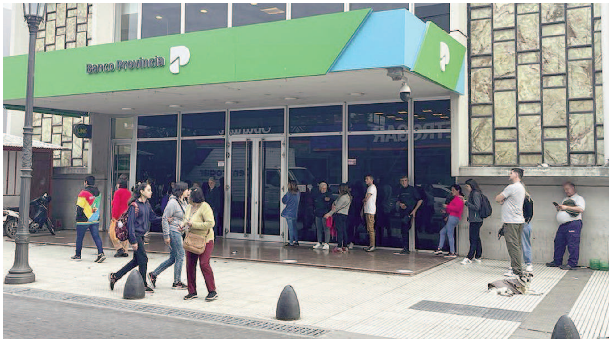
El porcentual a añadir en los salarios de los trabajadores y trabajadoras del sector se conocerá el próximo jueves cuando el Indec informe el IPC de mayo.