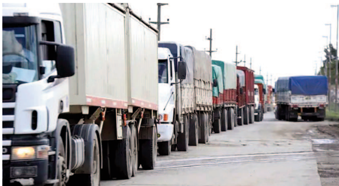
La Federación señaló que estos nueve municipios recaudan $25.000 millones anuales a través de sus tasas aplicadas al tránsito pesado hacia las terminales portuarias.

La Federación de Acopiadores argumentó que “el mal ejemplo de establecer una suerte de barrera interna se ha extendido y pasó a formar parte de las rentas generales