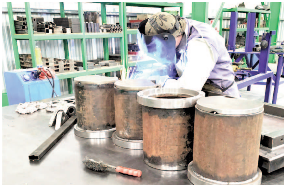
La Secretaría de Trabajo exhortó a las partes en conflicto a «mantener la mejor predisposición y apertura para negociar». ILUSTRACIÓN

«Esta autoridad de aplicación ha tomado conocimiento que la UOM ha dispuesto la realización de medidas de acción directa en las empresas nucleadas por la Cámara de la Pequeña y Mediana Industria Metalúrgica Argentina (Camima), la Asociación de Fábricas