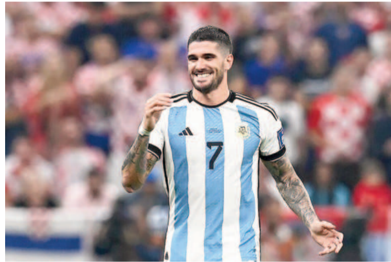
La Selección albiceleste tendrá una difícil prueba en Estados Unidos.

En tanto, Guido Rodríguez, afectado recientemente por un cuadro gripal, se entrenó de manera diferenciada, aunque muestra signos de recuperación. Luego de este partido, el equipo albiceleste se enfrentará a Guatemala, el viernes 14