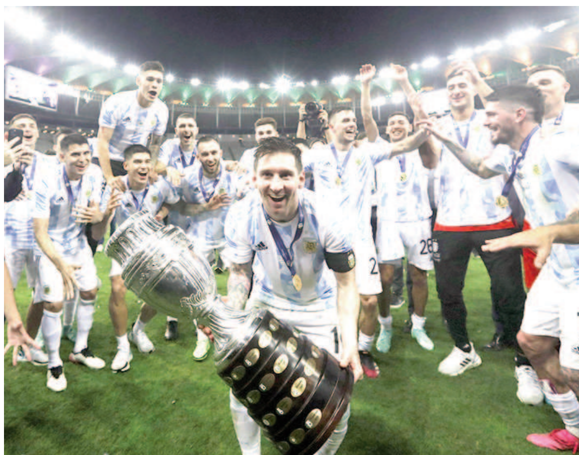
La opción más económica en cuanto a entradas se da en la fase de grupos.

Para los fanáticos que buscan una estadía más económica, los precios comienzan alrededor de los 200 dólares