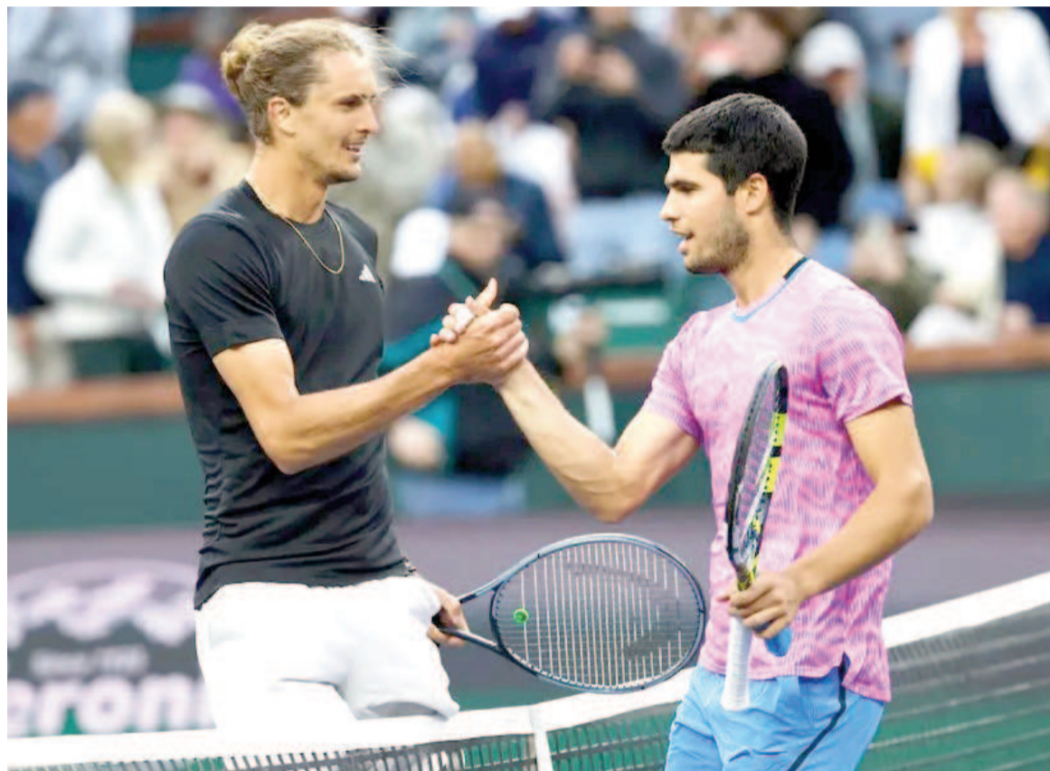
Dos de los mejores tenistas de la actualidad definirán el tercer Grand Slam del año.

«Nos hemos acostumbrado a Rafa, pero antes de él también hubo otros españoles que lograron cosas importantes. Así que quiero dejar mi huella, mi nombre en esa lista», se-