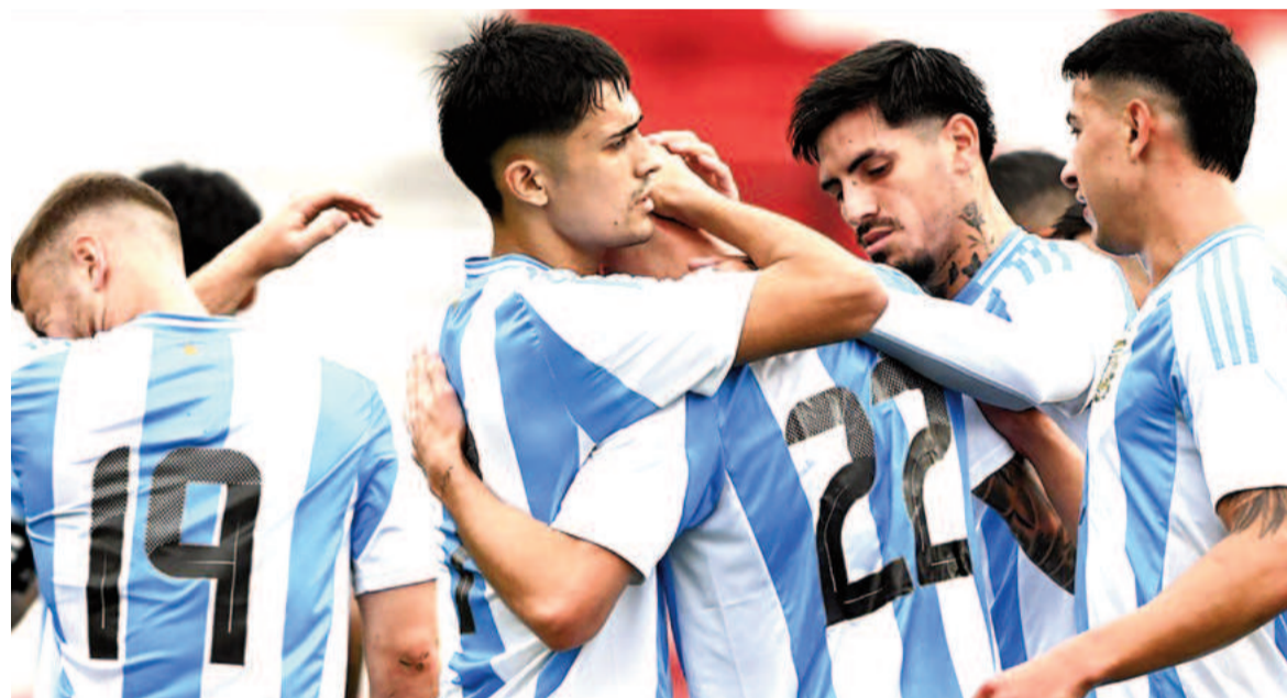
La Selección Argentina fue una aplanadora ante el conjunto guaraní.