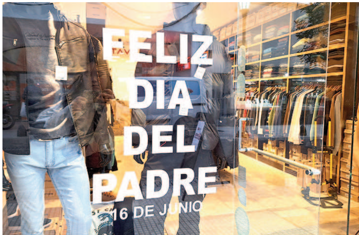
Pese a la suba de precios, los comercios esperan vender más este año.

Dentro del mundo de la moda, hay varias opciones con diferentes rangos de precios. Por ejemplo, las camperas de abrigo oscilan entre $59.000 y los $112.000, los suéteres pueden encontrarse des-