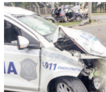
La imagen escalofriante que dejó el accidente ocurrido en la madrugada de ayer.

En el móvil policial viajaban dos mujeres y dos hombres, todos per-