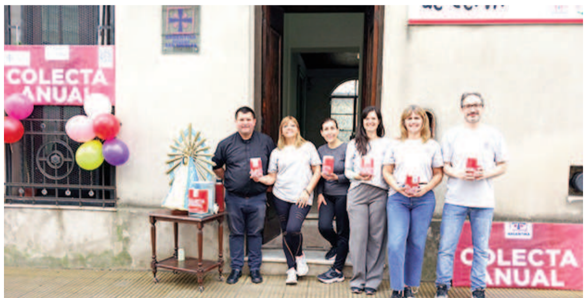
Hoy la sede de Cáritas San Nicolás -Rivadavia 106- abrirá de 10:30 a 17:30 para recibir donaciones.

Con esta colecta, Cáritas invita a la sociedad a hacer un aporte económico concreto, que tendrá una incidencia directa en la mejora de las condiciones de vida de tantas familias y personas vulnerables de las comunidades más postergadas del país. Porque, además de la ayuda inmediata y la contención espiritual que se brinda en todas las parroquias, capillas y centros barriales, el aporte económico recibido ayudará a sos-