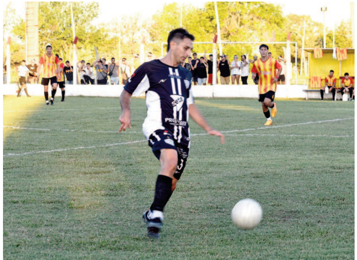
El Pañero buscará un triunfo en casa para sellar su clasificación. EL NORTE

Los Andes (17) será local ante Social (2) a partir de las 15.00, duelo en el que el Tucura necesita ganar