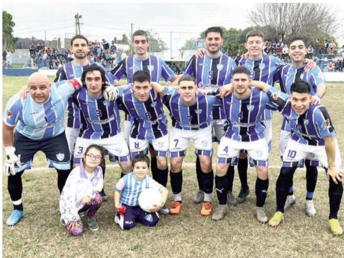
La Academia fue implacable contra Doce y sueña con pelear arriba.