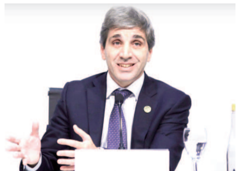
El ministro Nicolás Caputo volvió a celebrar números verdes en el déficit fiscal.

Durante los primeros cinco meses de 2024, los gastos totales de la Administración Nacional acumularon una caída de 27,6% en términos reales: los gastos primarios registraron una baja de 31,3%, mientras que los intereses de la deuda mostraron un incremento de 1,5% interanual real.