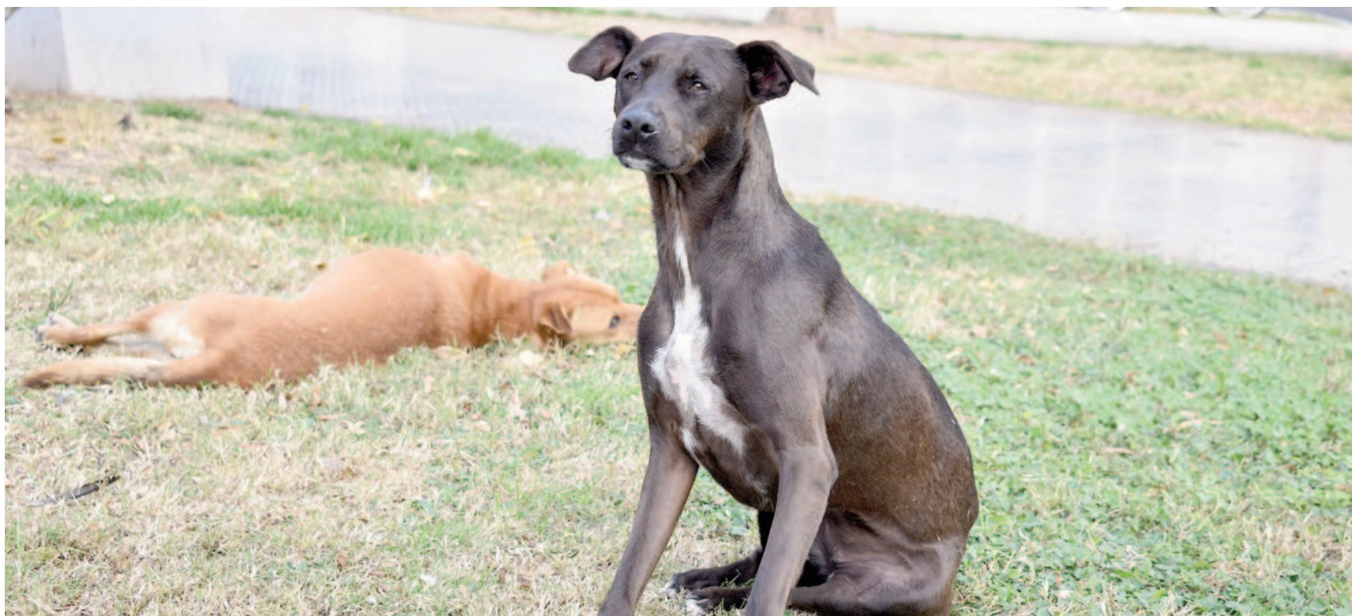
En plaza Mitre pueden verse.