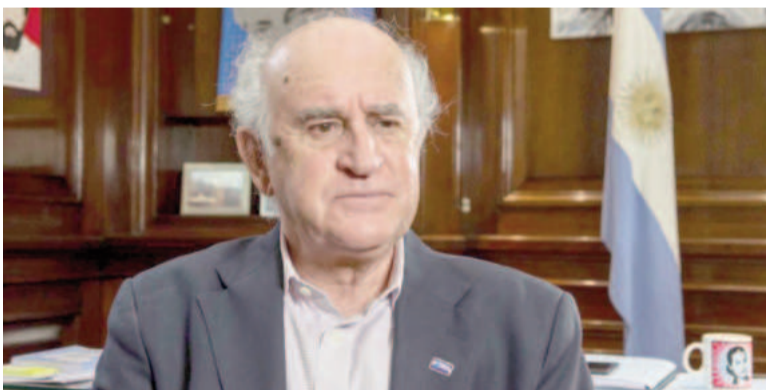
Oscar Parrilli, senador de Unión por la Patria.

Oscar Parrilli, senador de Unión por la Patria, fue terminante con la postura que tomará su espacio el próximo miércoles cuando la Cámara Alta del Congreso debata sobre la Ley Bases, principal objetivo del Gobierno. "Vamos a rechazarlo, porque sobre todo, no ataca el problema fundamental de la deuda externa. Nosotros tenemos 33 votos, hay un dictamen por separado del senador Lousteau, los números están muy ajustados. Lo único que le pedí es que no sean teros, dicen y vociferan de un lado y votan de otro modo", indicó el legislador.