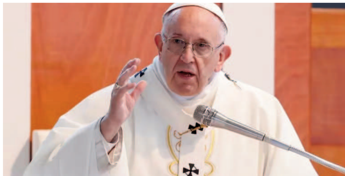
El sumo pontífice ya se había pronunciado en diversos encuentros acerca de los peligros detrás de la IA.

Por primera vez en la historia, un Pontífice participará en la Cumbre que reúne a los líderes de los siete países más industrializados del planeta. Fue invitado por la anfitriona del evento, la premier italiana Giorgia Meloni, para participar en una sesión sobre inteligencia artificial.