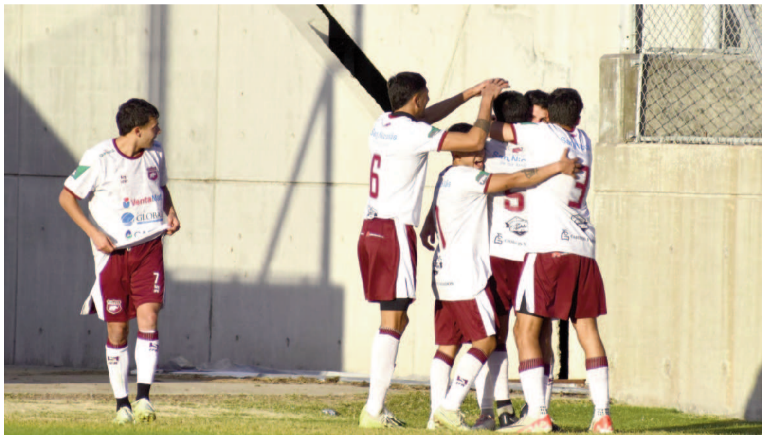
Defensores buscará esta tarde seguir por la senda del triunfo como local.