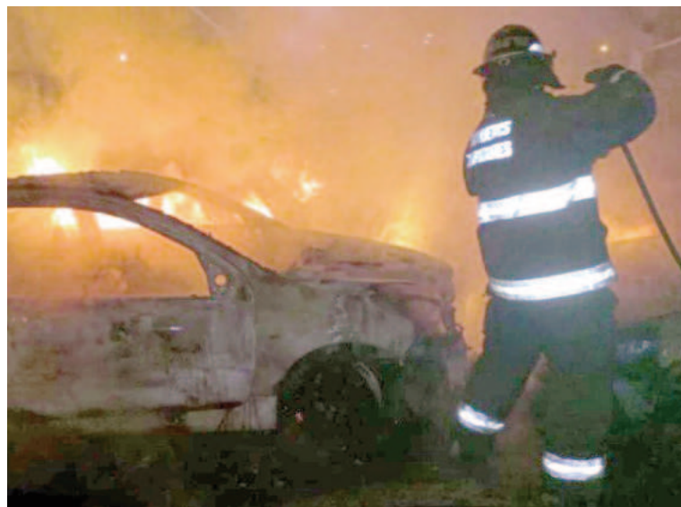
Los bomberos trabajaron en el lugar este domingo.

Personal de bomberos actuó sobre el fuego desatado en los autos sin que existiera riesgo de propagación de las llamas hacia otros bienes o inmuebles de la cuadra.