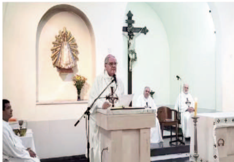
Monseñor Ojea, oportunamente, le reclamó a Milei la inclusión de la problemática.

Más allá de la declinación presidencial a incorporar la educación al Pacto de Mayo porque la convocatoria es “específicamente” económica; esta semana, durante un pasaje de su presentación en el Senado, el jefe de Gabinete, Nicolás Posse, admitió la posibilidad de que el acuerdo federal amplíe su agenda e incorpore entre sus puntos fundacionales a la Educación como política de Estado.