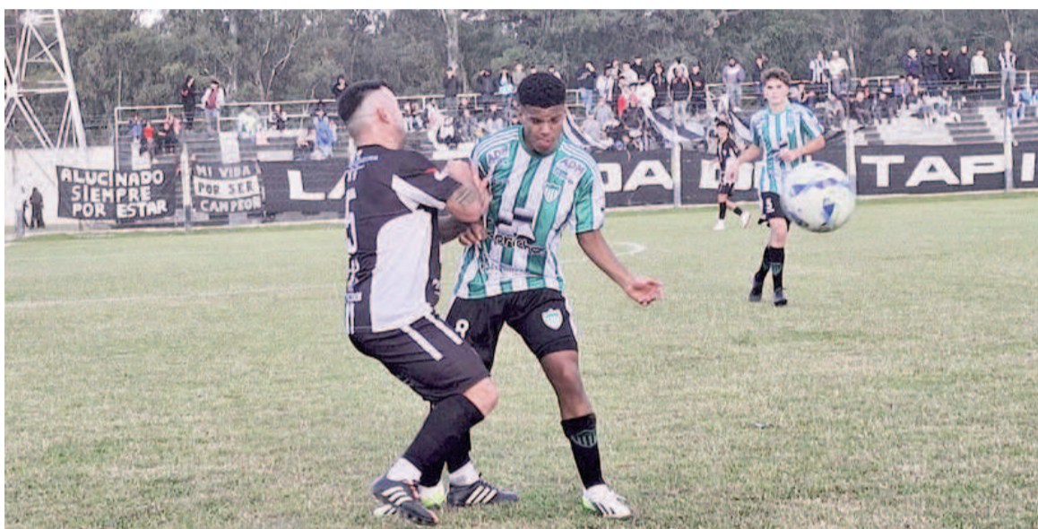
El Verde sumó su cuarto triunfo al hilo en una cancha muy difícil.

El partido no dejó mucho. Pero eso poco le importó a Los Andes. Un equipo bien ordenado, parejo, molesto y combativo. Que pegó en el momento justo y que aguantó cuando La Emilia se venía. Que pudo rematarlo con alguna contra y que no se puso colorado cuando tuvo que reventarla. Tres puntos cruciales