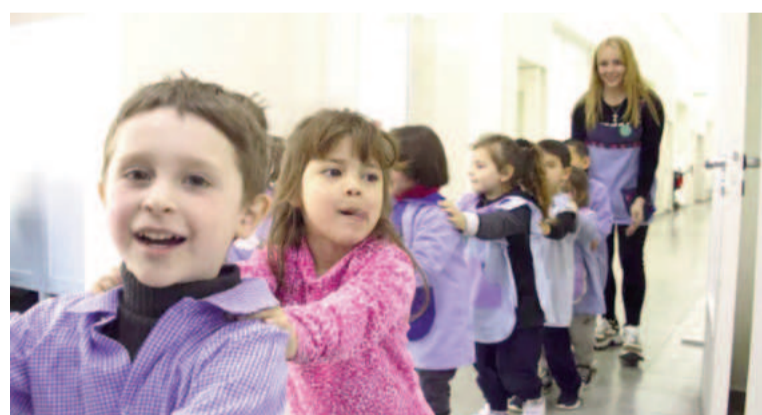
Primera infancia, el objetivo del nuevo plan de cobertura social.

Garantizar el desarrollo de los niveles de lectura y escritura apropiados para los estudiantes de tercer grado. Garantizar oportunidades equitativas de alfabetización como motor para la aceleración de aprendizajes en los estudiantes de cuarto grado en adelante. Desarrollar dispositivos de seguimiento y evaluación que