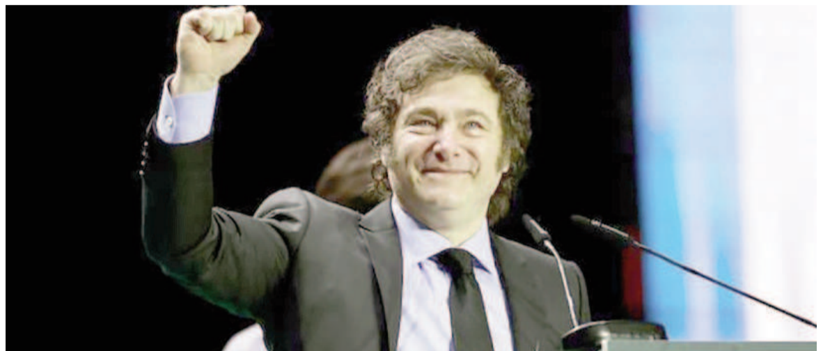
El presidente Javier Milei en el Palacio de Vistalegre donde Vox celebró su festival Viva 24.

“No tienen precedentes en la historia de las relaciones internacionales y aún menos en la historia entre relaciones de dos naciones unidas por fuertes lazos de hermandad”, dijo Albares, y señaló que consultó a Josep Borrell, encargado de la diplomacia europea, quien consideró que las declaraciones ofensivas del presidente argentino representan “un ataque al conjunto de la Unión Europea”. “Las elites globales no se dan cuenta de lo destructivo que puede llegar a ser implementar las ideas del socialismo, porque lo tienen demasiado lejos”, dijo Milei desde el escenario del acto del partido Vox, objetivo principal de su viaje a Madrid. “No saben qué tipo de sociedad y país pueden producir y qué calaña de gente atornillada