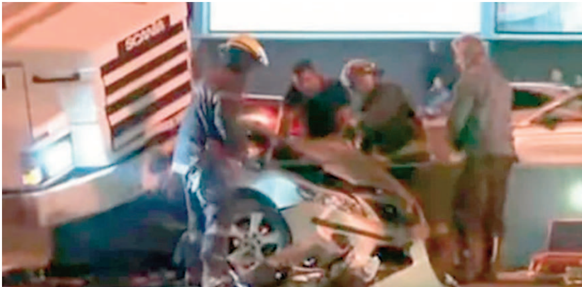
Un camión perdió la carga y el contenedor se cruzó de vía. Son diez vehículos involucrados en total.

El accidente se dio en dirección a la zona norte, a la altura de la bajada de Pelliza, en Vicente López. La carga del transporte cayó en el camino hacia la Ciudad de Buenos Aires y causó otros impactos en cadena.