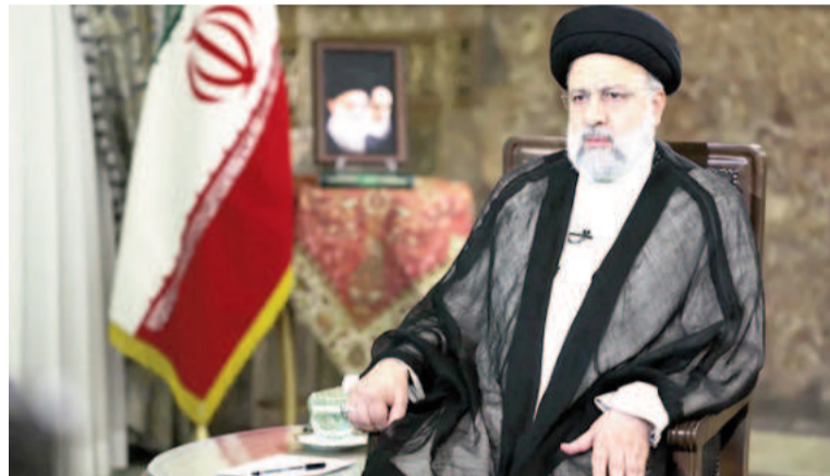
El presidente de Irán, Ebrahim Raisi, en una entrevista.

Con esa formación, entró en el mundo de la judicatura en la década de los 80. Primero fue fiscal de la ciudad de Karaj y, posteriormente, en la provincia de Hamedan, hasta que en el año 1985 dio el salto a la capital al ser nombrado sustituto del