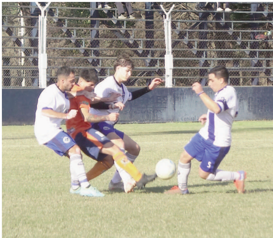
El equipo de La Ribera rescató un valioso punto para seguir en el segundo puesto.

En el quinto minuto adicional el equipo de La Ribera logró igualar con un polémico penal convertido por Mauro Ressi, quien decretó el 2 a 2 frente a Somisa en el Barrio.