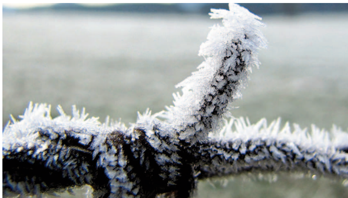
Este año, a diferencia del año pasado, el descenso de las temperaturas fue marcado y poco común para mayo.

De acuerdo a registros históricos, la fecha de ocurrencia de las primeras heladas meteorológicas en el sur de la región pampeana y sur de Cuyo, suele darse en promedio entre el 1º y el 15 de mayo. Mientras que en la