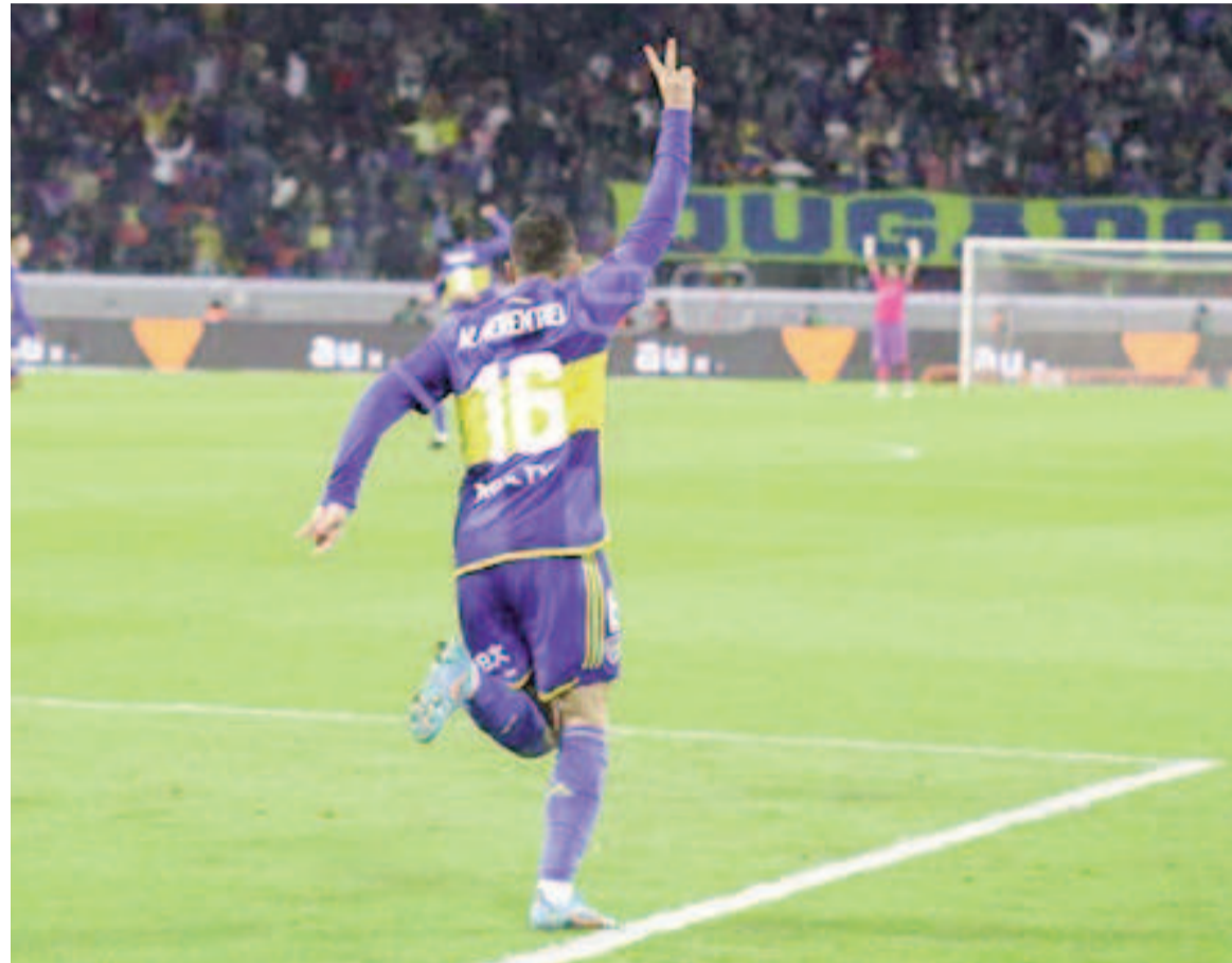
El equipo de la Ribera despertó en el complemento y sumó sus primeros puntos. NA

El Xeneize venció 4 a 2 a Central Córdoba en el Madre de Ciudades, con sendos dobles de Ezequiel Fernández y Merentiel. Reaccionó en el segundo tiempo tras ir perdiendo 2 a 0.