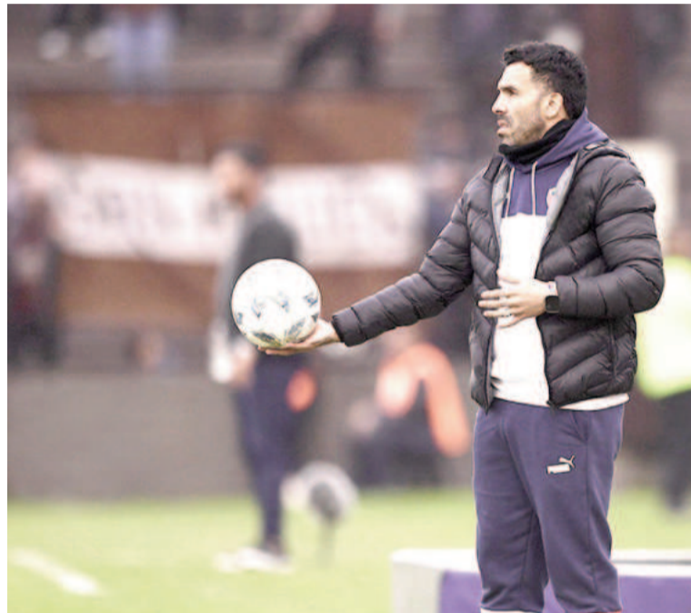
El Apache se despidió del Rojo: «Le quiero agradecer al hincha».