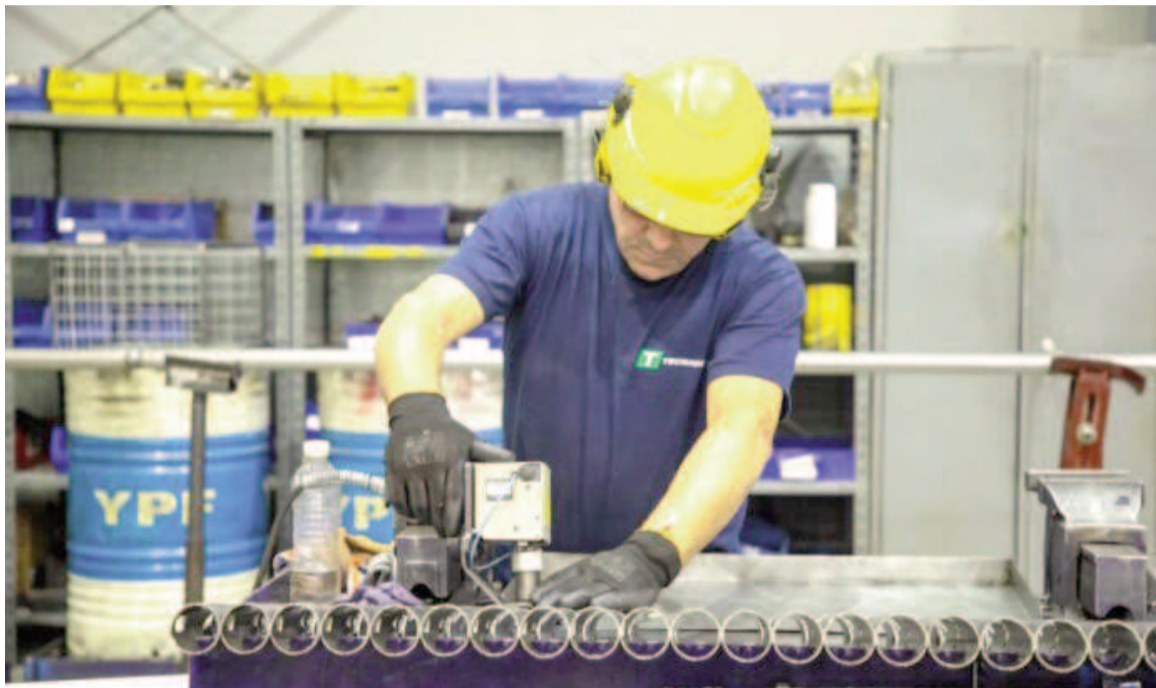
Nueva caída en abril para las industrias pymes, según Confederación Argentina de la Mediana Empresa.

El sector retrocedió 13,7% anual a precios constantes en