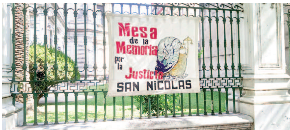
En total son 12 los acusados en la causa, entre ellos exmilitares y exagentes de las policías federal y bonaerense. ILUSTRACIÓN