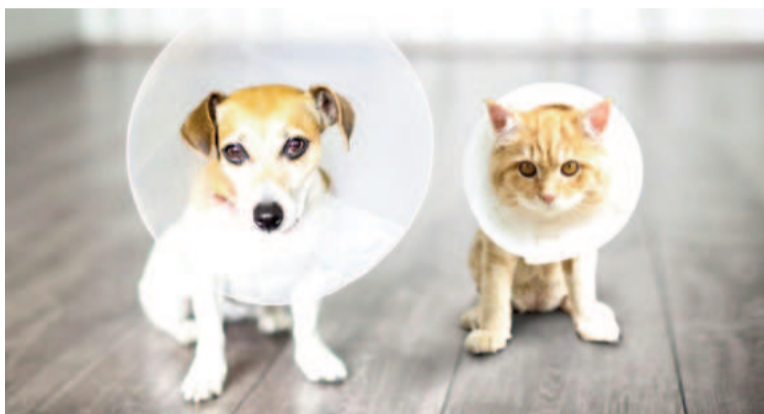
Es usual que se aplique un cono protector en el cuello de los animales recién operados para evitar que se laman la herida y transmitan bacterias que puedan generar una infección / ILUSTRACIÓN

sente cierta condición médica más delicada –como una infección– y requiera una intervención más compleja, se realiza una ovariectomía. Ante este panorama, los valores fluctúan entre $88.000 y $126.000. Y para los felinos $79.000.