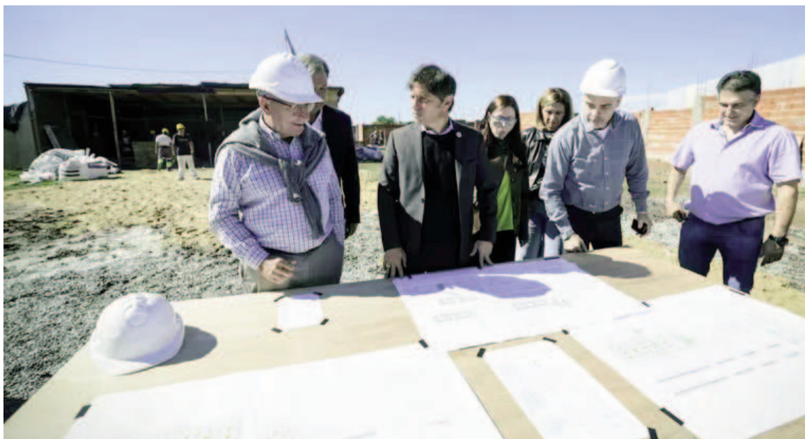
El Gobierno bonaerense prometió hacerse cargo de las obras nacionales inconclusas.

nocen que son alrededor de 900 las obras públicas que han sido paralizadas. En un relevamiento que armó antes de finalizar su mandato como ministro de Obra Pública de la Nación,