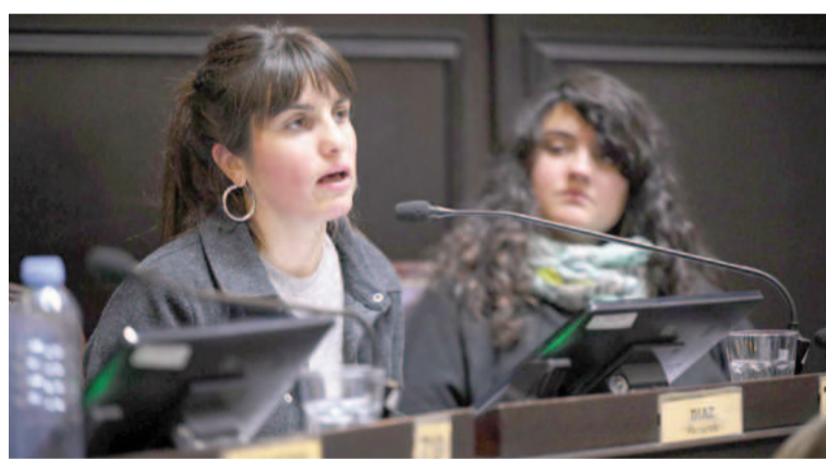
Fernanda Díaz, diputada provincial de Unión por la Patria.

Asimismo, Díaz destacó que si bien se ha anunciado un aumento del 70% en la partida presupuestaria, este incremento está principalmente destinado a cubrir gastos operativos,