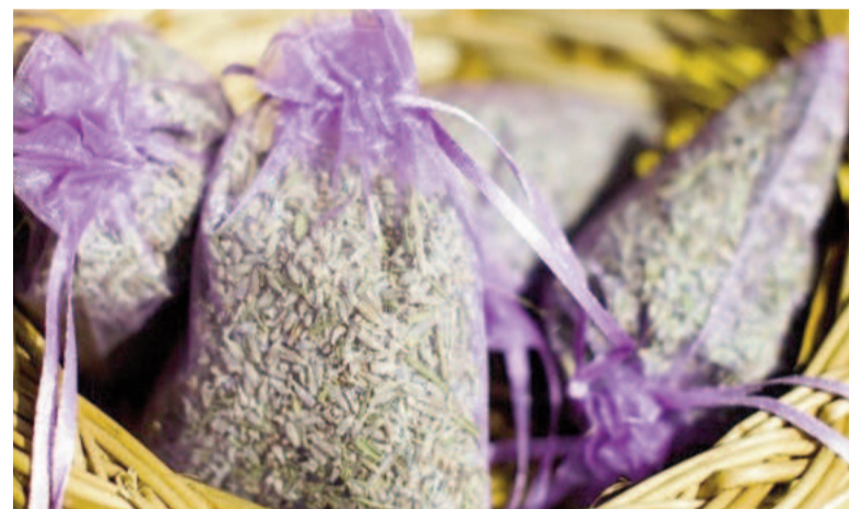
La lavanda es uno de los repelentes naturales más eficaces.

-Limpiar y ordenar: Se recomienda limpiar cada zona del armario con vinagre blanco al menos cada dos o tres meses. A las polillas les atrae la ropa sucia y los espacios con poca ventilación, por lo que resulta fundamental ahuyentarlas