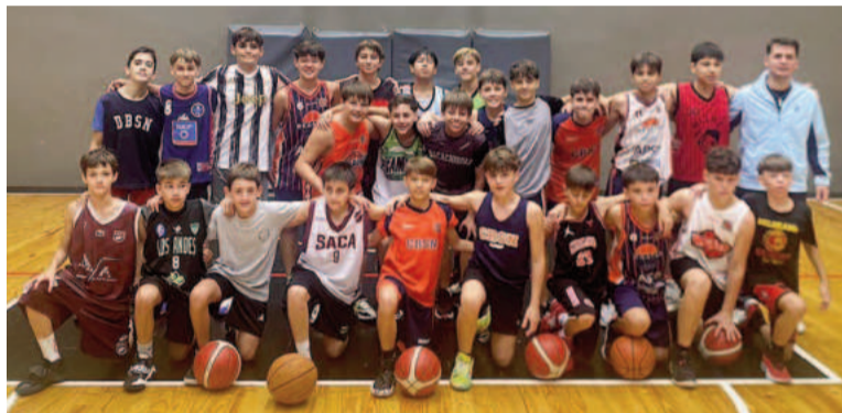
La Selección Sub-13 de San Nicolás en plena preparación.