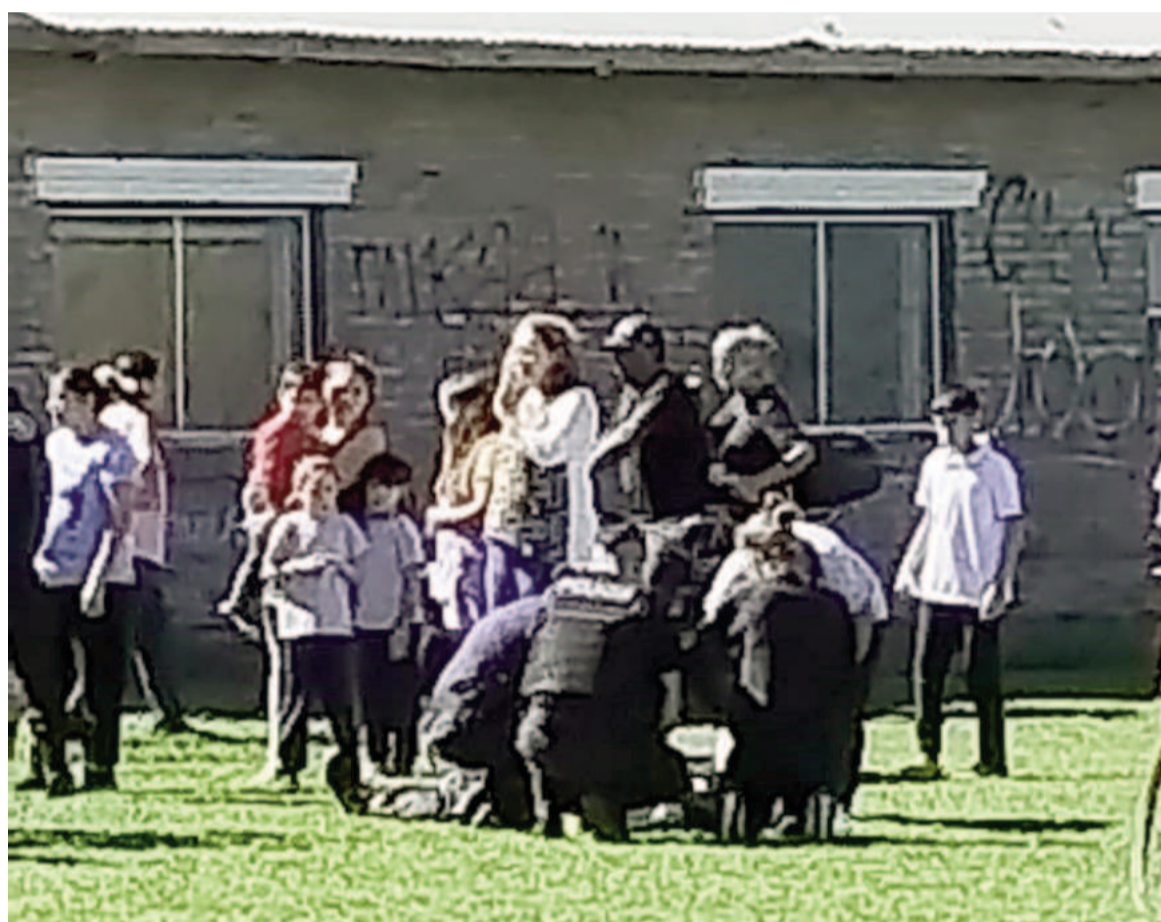
El ataque fue presenciado por un gran número de personas, ya que tuvo lugar en el horario de salida de clases. EL NORTE

Conforme a los primeros testimonios, la víctima salió del establecimiento y cuando se encontraba a escasos metros del Centro Deportivo y Cultural de barrio Moreno lo habrían estado esperando otros tres menores, quienes también serían estudiantes y lo atacaron. Uno de ellos tenía un elemento cortopunzante con el que le provocó una herida en el lado izquierdo a la altura del pecho de poca profundidad que, en principio, no pondría en riesgo su vida. De todas formas, el adolescente fue trasladado en ambulancia al Hospital San Felipe para ser eva-