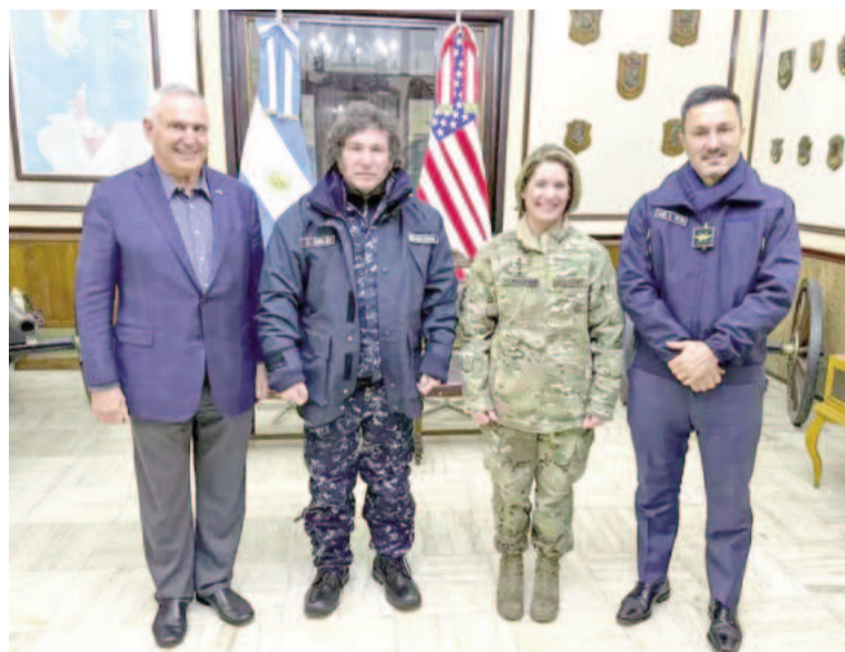
Milei y Richardson, durante su estada en la Argentina.

El anuncio del gobierno norteamericano está en línea con las recientes gestiones que realizó la pre-