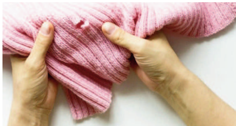
Las polillas son insectos que se alimentan de fibras de telas.

-Clavo de olor: Pueden ponerse ramitas en los bolsillos de algunas prendas, sobre todo en abrigos y