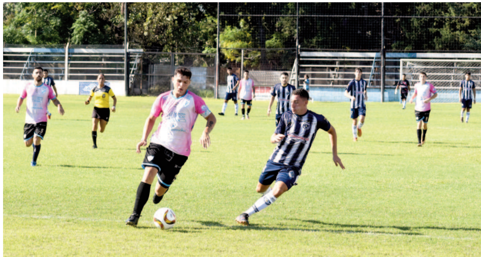
Paraná será local ante el Granate esta noche en un choque entre dos de los tres que permanecen invictos.

Hoy desde las 20.00 se enfrentarán en cancha de Rivadavia y Necochea en un duelo de dos que aspiran a ser protagonistas. El Granate marcha como único líder con diez puntos, mientras que el Albiceleste se ubica séptimo con cinco unidades.