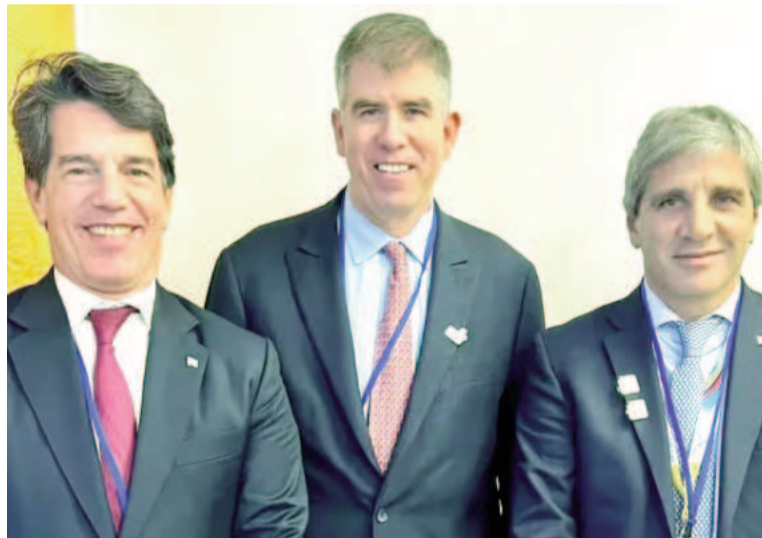
Posse, Shambaugh y Caputo durante la reunión con el titular del Tesoro.

Antes del encuentro en el Tesoro, Caputo y Posse dialogaron con Gita Gopinath para analizar el actual programa que Argentina tiene con el Fondo Monetario Internacional (FMI). La reunión duró cuarenta minutos y sirvió para repasar las metas previstas para este trimestre, que el gobierno tiene por cumplidas.