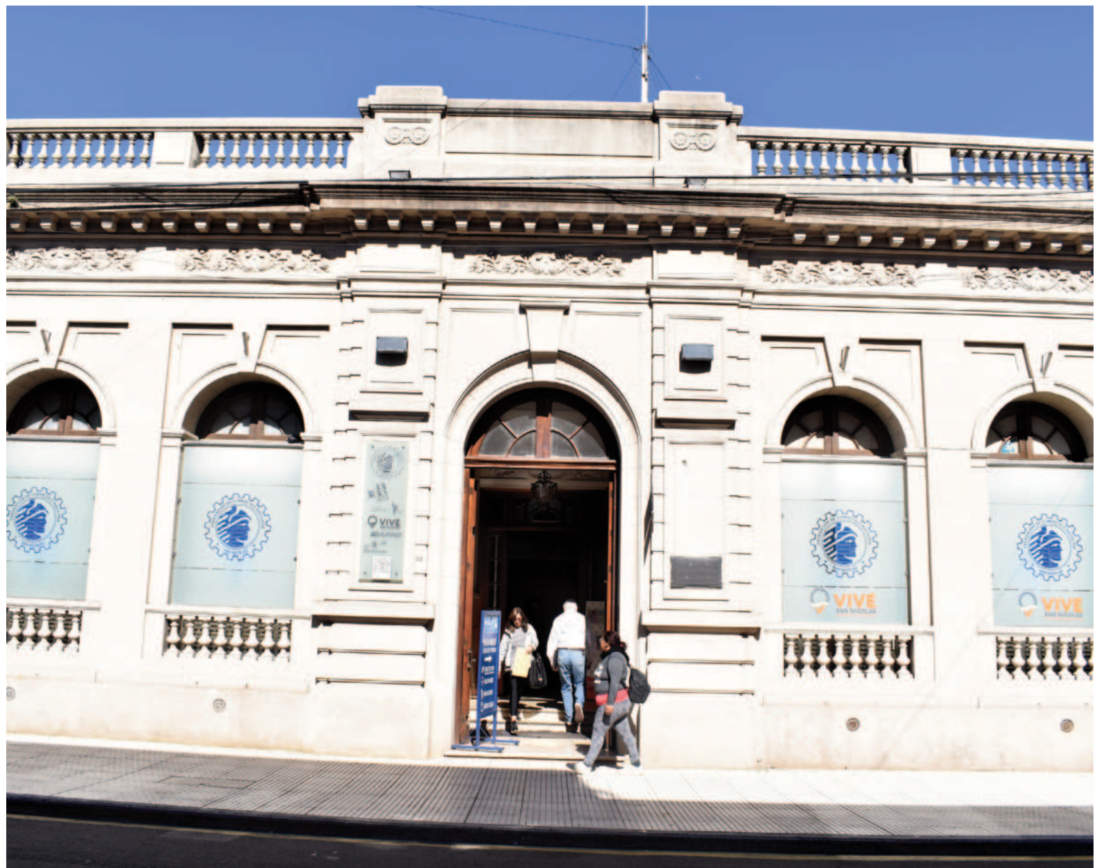
La Federación de Comercio e Industria de San Nicolás, ubicada en Urquiza 32, cuenta actualmente con alrededor de 300 socios.

Por otra parte, enumeró las actividades que la institución realiza y los beneficios de ser parte de ella: “La entidad organiza exitosamente rondas de negocios para emprendedores, que han sido muy concurridas, de gran importancia para industriales y comerciantes de la ciudad y la región. La participación en