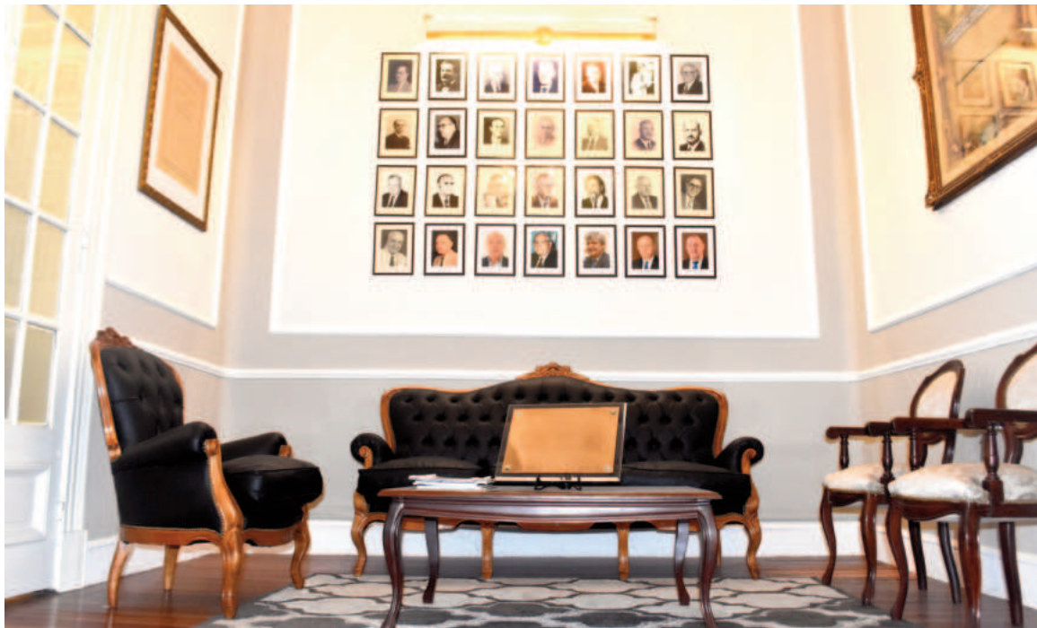
La Federación de Comercio e Industria de San Nicolás tiene su sede en Urquiza 32, y en sus paredes recuerda su historia.

de 1913, cuando se reunieron un grupo de hombres con el fin de organizar el sector comercial e industrial. Existía un vacío a llenar y un camino complejo por delante. La necesidad