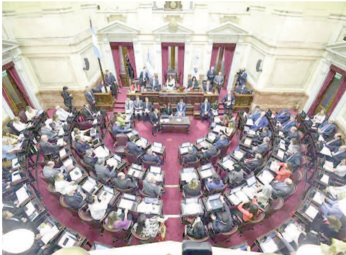
El pleno de la Cámara Alta aprobó los pliegos de los nuevos embajadores propuestos.