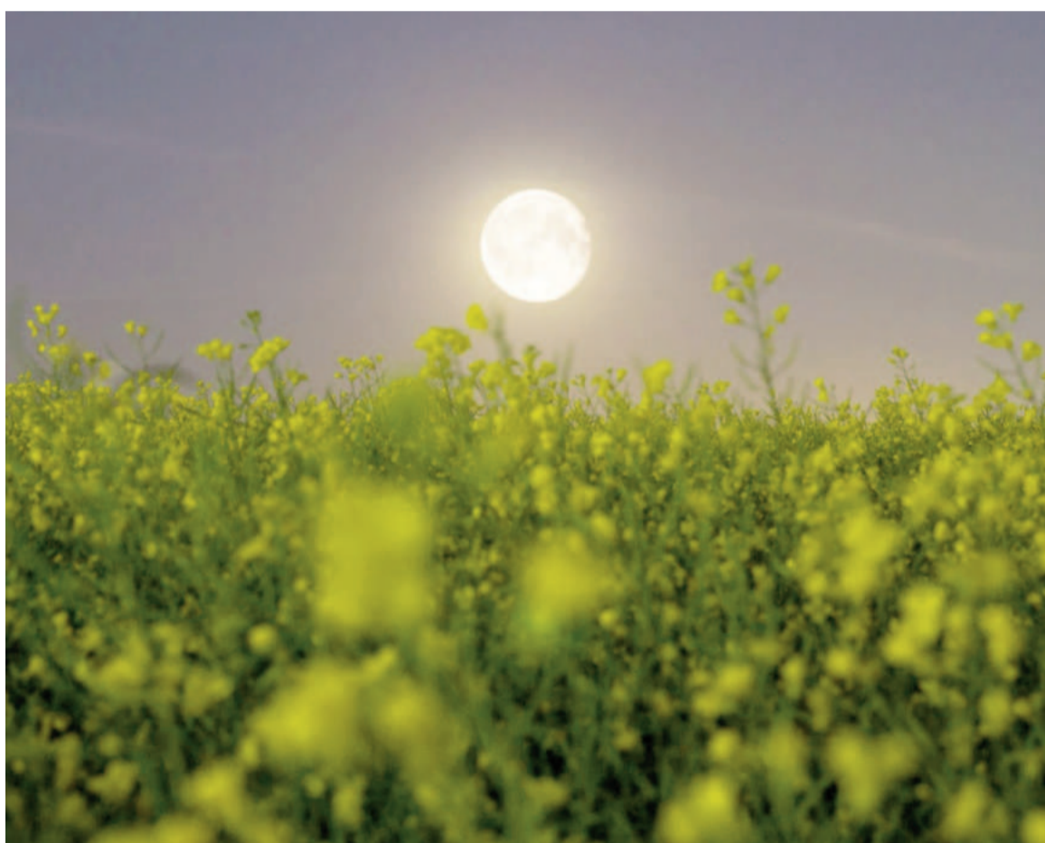
Este ambicioso proyecto busca establecer las bases para futuras misiones de larga duración. ILUSTRACIÓN WEB

Entre los experimentos seleccionados por la NASA, destacan tres instrumentos científicos que buscan responder preguntas clave sobre la viabilidad de la vida humana en la Luna. El Lunar Environment Monitoring Station (LEMS) un sismómetro de alta precisión para desentrañar los secretos del subsuelo lunar a través del estudio de los terremotos lunares. El Lunar Effects on Agricultural Flora (LEAF), por su parte, experi-