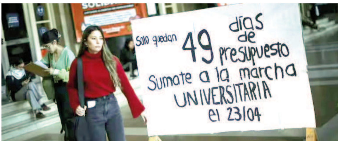
Docentes y estudiantes igual marcharán el 23 de abril en contra del ajuste padecido.