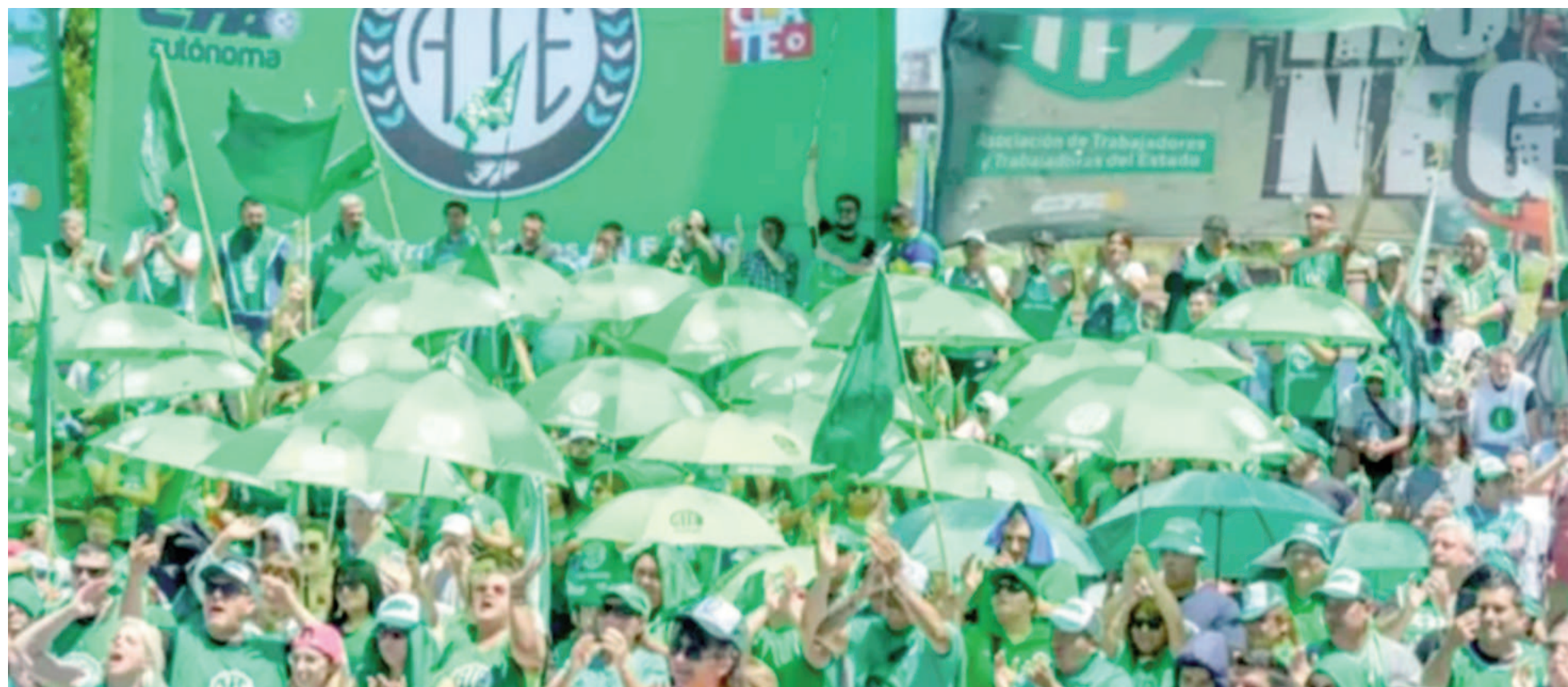
"ATE se solidariza con los trabajadores cesanteados de la Anses, el Ministerio de Trabajo y el Renaper, y exige el cese de despidos y reincorporación inmediata".

La Asociación Trabajadores del Estado (ATE) seccional San Nicolás se unió ayer a la jornada de lucha que llevó a cabo el gremio en todo el país debido a los despidos masivos en los organismos públicos nacionales. En ese marco, el sindicato estuvo pendiente del ingreso de los trabajadores a las sedes de los Centros de Referencia (CDR). "ATE repudia las acciones de un gobierno que habla de respetar la ley, pero que ha decidido violar normas fundamentales y el derecho constitucional a la Estabilidad en el Empleo Público (art. 14 bis)", señalaron desde el gremio local.