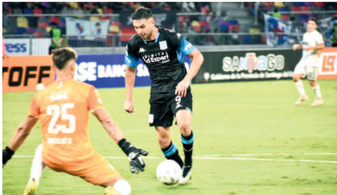
Racing buscará comenzar el certamen continental con una victoria en rodeo ajeno.

El equipo dirigido por Gustavo Costas visitará hoy desde las 21.00 a Sportivo Luqueño por el Grupo H. Habrá dos cambios con respecto al equipo que venció a Central Córdoba.