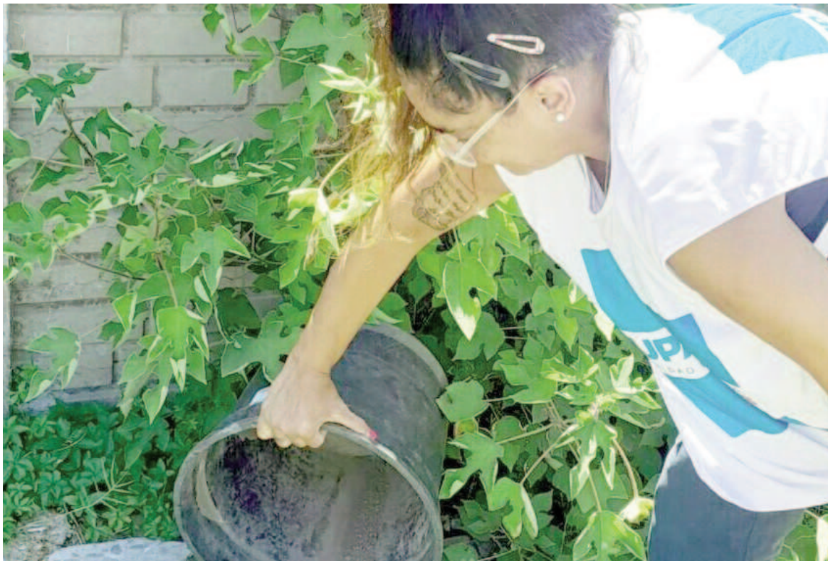
El descacharreo es una de las medidas a ejecutar como prevención.

En las últimas semanas se observa una disminución en la velocidad de crecimiento de contagios, pero desde Salud bonaerense consideran que puede obedecer a la demora en la notificación.