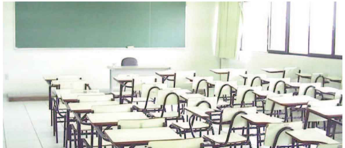
Las aulas otra vez vacías, ahora por paro de Ctera. Desde la gestión Milei ya van dos paros.

El gremio docente reclama, entre otras cosas, la restitución del Fonid y la convocatoria a la paritaria nacional.