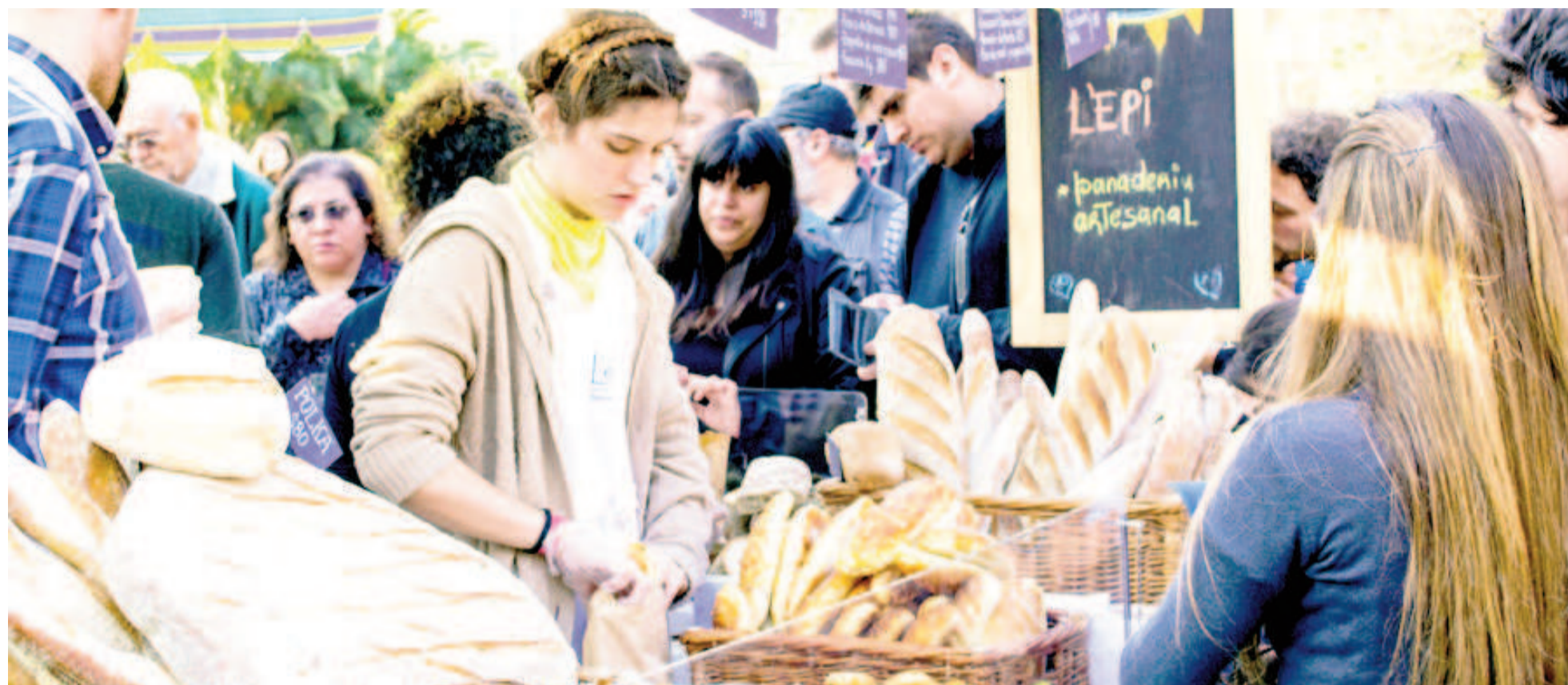
Pequeños productores nicoleños presentarán una feria de alimentos saludables este sábado en el Parque San Martín.

La iniciativa será el sábado 6 de abril y llega de la mano del programa Pequeñas unidades productoras de alimentos nicoleños (PUPAN), que regula y acompaña a los productores locales que inician su actividad. Además, busca promover el comercio de alimentos saludables elaborados en la región y fomentar la generación de trabajo genuino, basado en los principios de la economía social y solidaria.