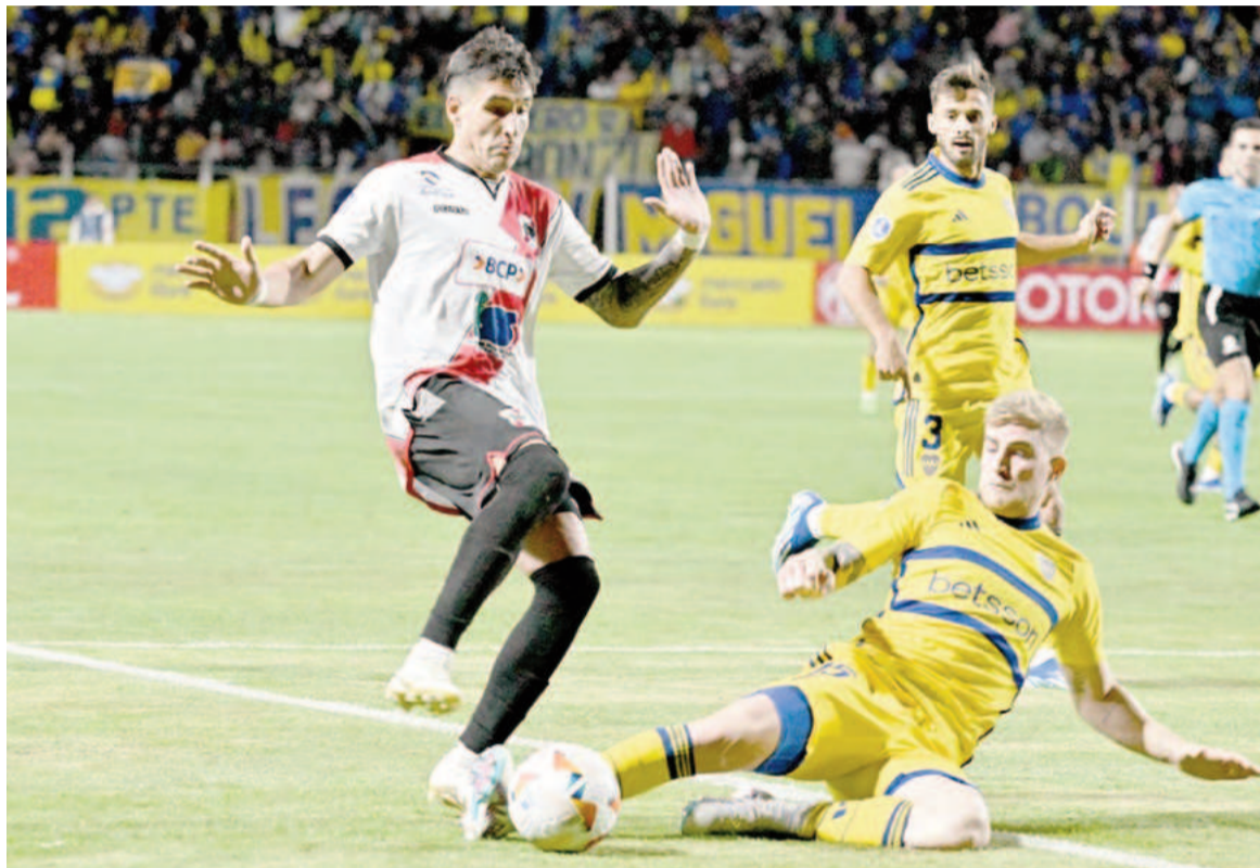
Con una formación alternativa el Xeneize logró un empate en la altura de Potosí. ■■