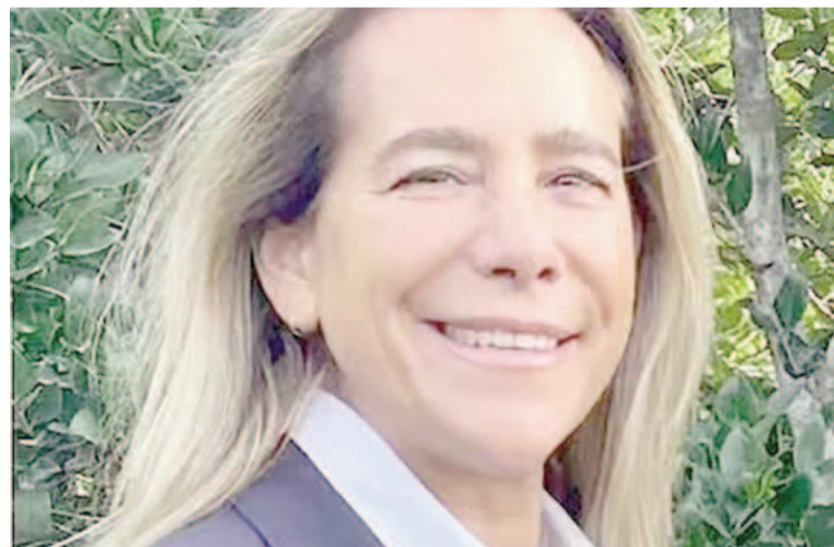
Nueva salida en el gobierno de Javier Milei: renunció la subsecretaria de Trabajo.