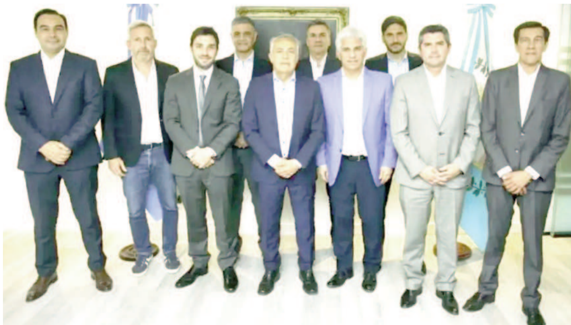
Los gobernadores de Juntos por el Cambio (JxC) arribarán a Casa Rosada por la negociación de la Ley Bases.

No obstante, está abierto aún el debate por el tema fiscal y financiero. Por esa razón, este miércoles, los mandatarios provinciales mantuvieron una charla por videollamada para aunar criterios sobre esas cuestiones.