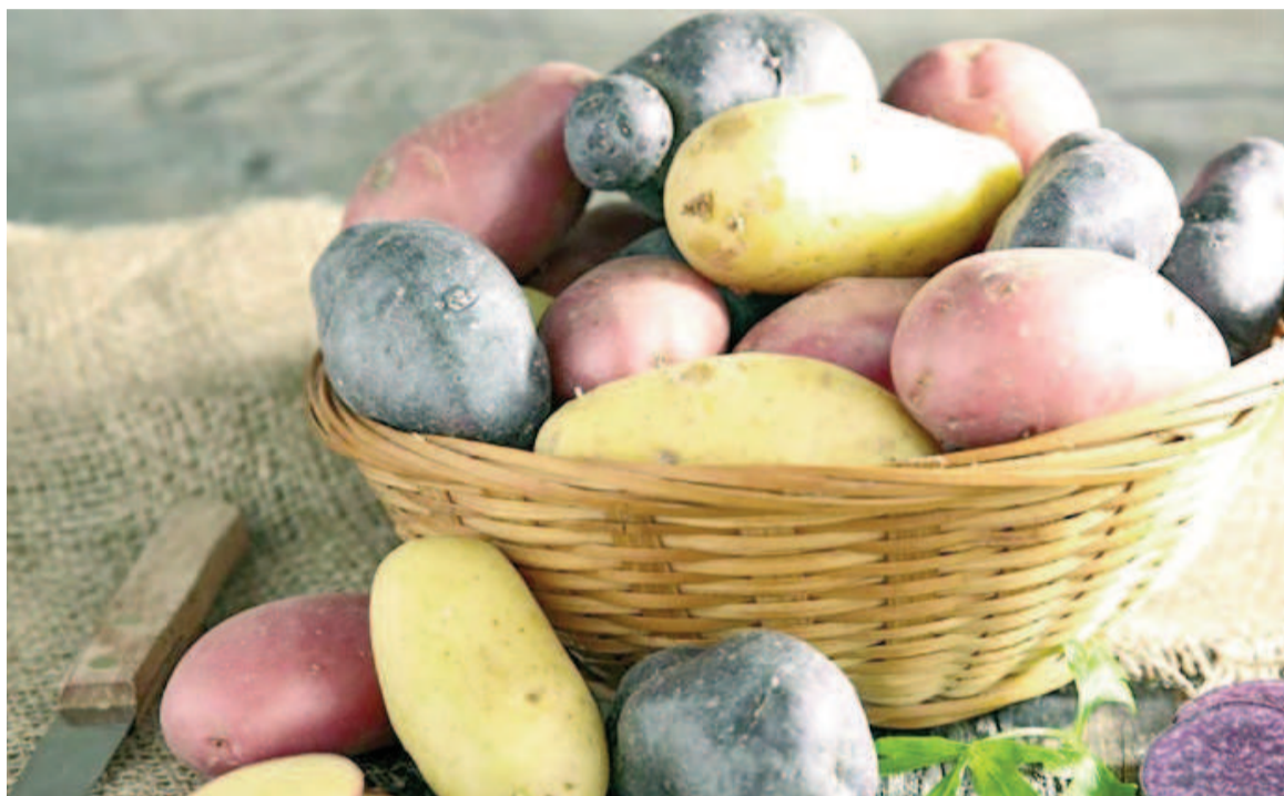
En una porción, la papa aporta cobre, potasio, fósforo, hierro, zinc, magnesio y vitamina C.

El Instituto Nacional Autónomo de Investigaciones Agropecuarias (Iniap), dependiente del Ministerio de Agricultura de Ecuador, promueve el consumo de la papa por las propiedades nutricionales que posee, como fuente importante de vitaminas y minerales, que contribuyen a pre-