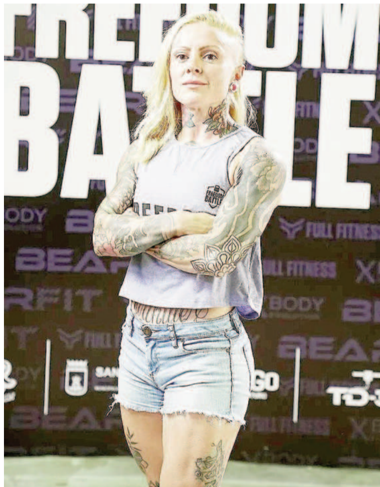
La nicoleña compitió por primera vez a nivel individual en Santiago del Estero.