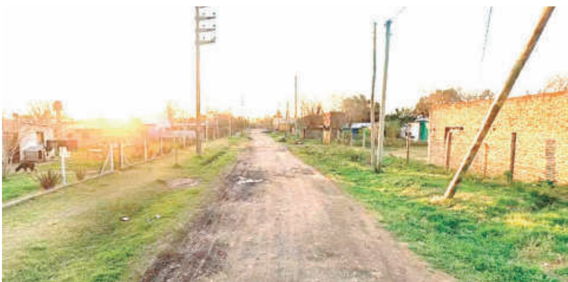
La calle en la que ocurrió el hecho en Moreno.

Pese a la amenaza, el dueño de la moto se resistió a los golpes y enfrentó a los delincuentes. Tras pelearse con algunos de ellos, logró que la banda desistiera de su intención de llevarse la moto y huyeran. Sin embargo, el plan de escape salió mal. Según confirmaron fuentes judiciales a Infobae, en el apuro por escapar de la zona, ya que el escándalo había lla-