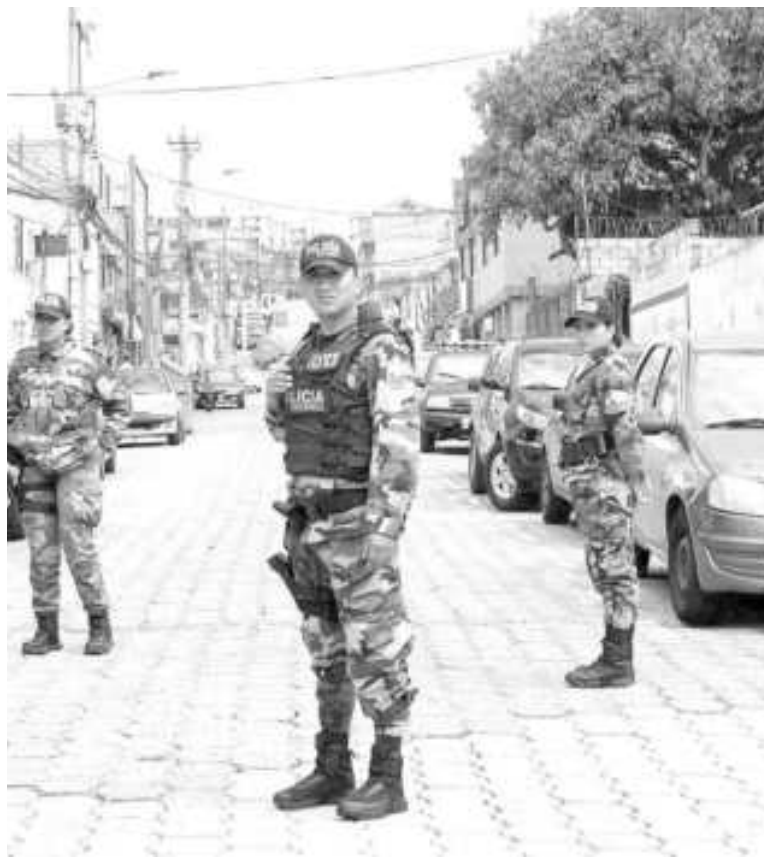
Ecuador atraviesa una grave situación

Para Burdman, la dolarización implantada por el presidente Jamil Mahuad en el año 2000 supone un factor que "facilitó el desarrollo de mecanismos de lavado de dinero de la droga en Ecuador y eso trajo consigo la radicación