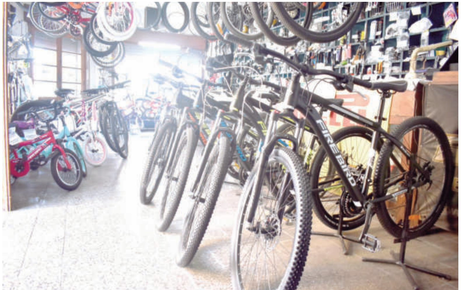
Se dispararon los precios de las bicicletas y mermó la venta.

“Desde que cayó la venta por la situación económica del país, acá adoptamos la modalidad de taller al paso. Es de lo que más nos deja dinero. Vienen principalmente jóvenes, que ahora en verano usan mucho la bicicleta para ir con sus amigos a los clubes o campings, a que le arreglemos la cadena, una pinchadura y cosas así. Nosotros habíamos abierto