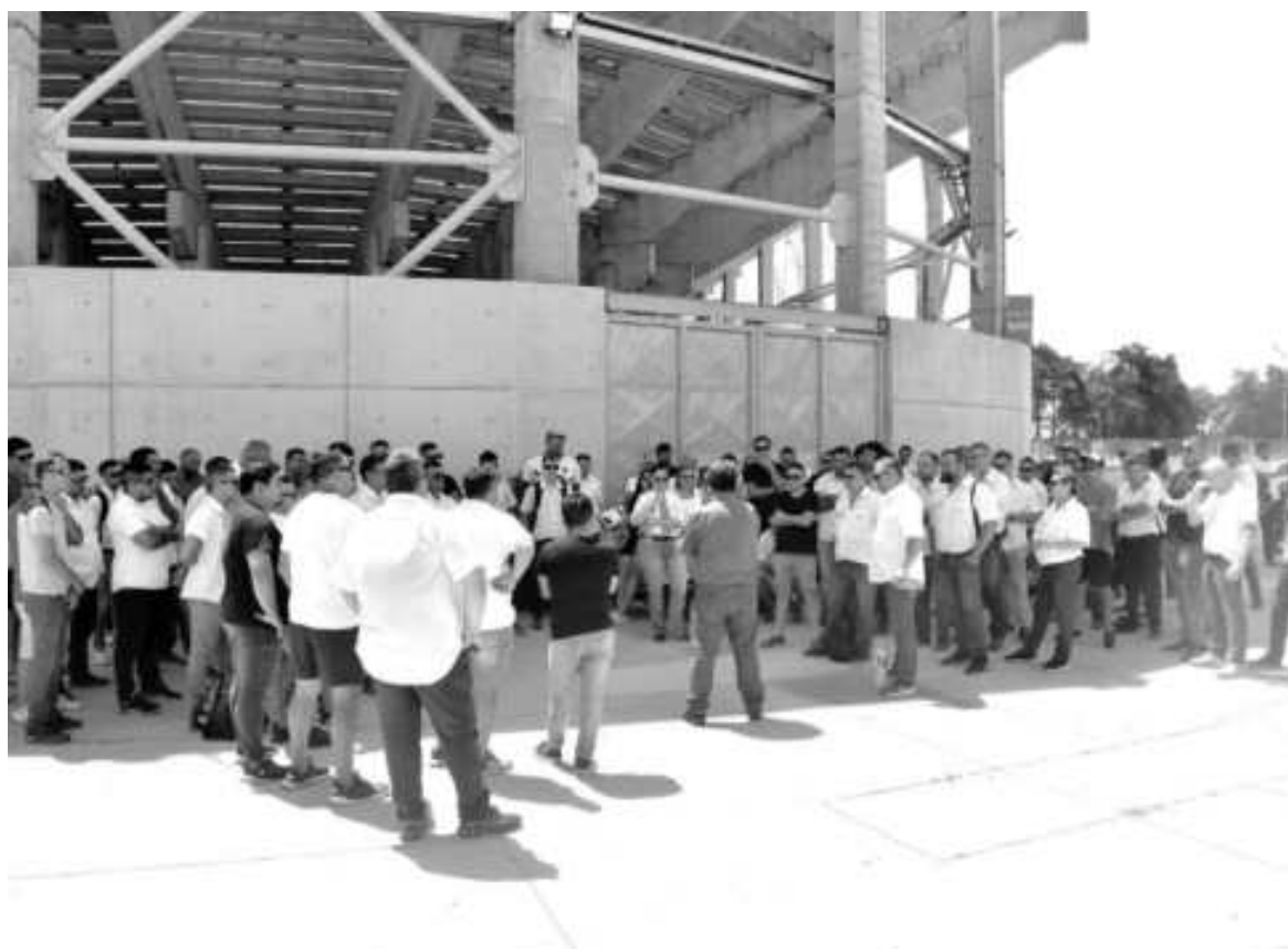
Con salarios y aguinaldos sin cobrar no solo en San Nicolás sino en varias ciudades del interior, la UTA reabrió la negociación paritaria con la Fatap. EL NORTE

Mientras muchas empresas del interior del país adeudan salarios y aguinaldos –entre ellas la nicoleña Vercelli Hnos–, la UTA reabrió las negociaciones paritarias para hacer frente a la inflación del 25,5% registrada en diciembre. Piden un retroactivo del 22% para ese mes y mejoras del 27% y del 33% acumulativas para enero y febrero. Los empresarios advierten que “decenas de miles de puestos de trabajo” están en riesgo de “destrucción” en el interior.