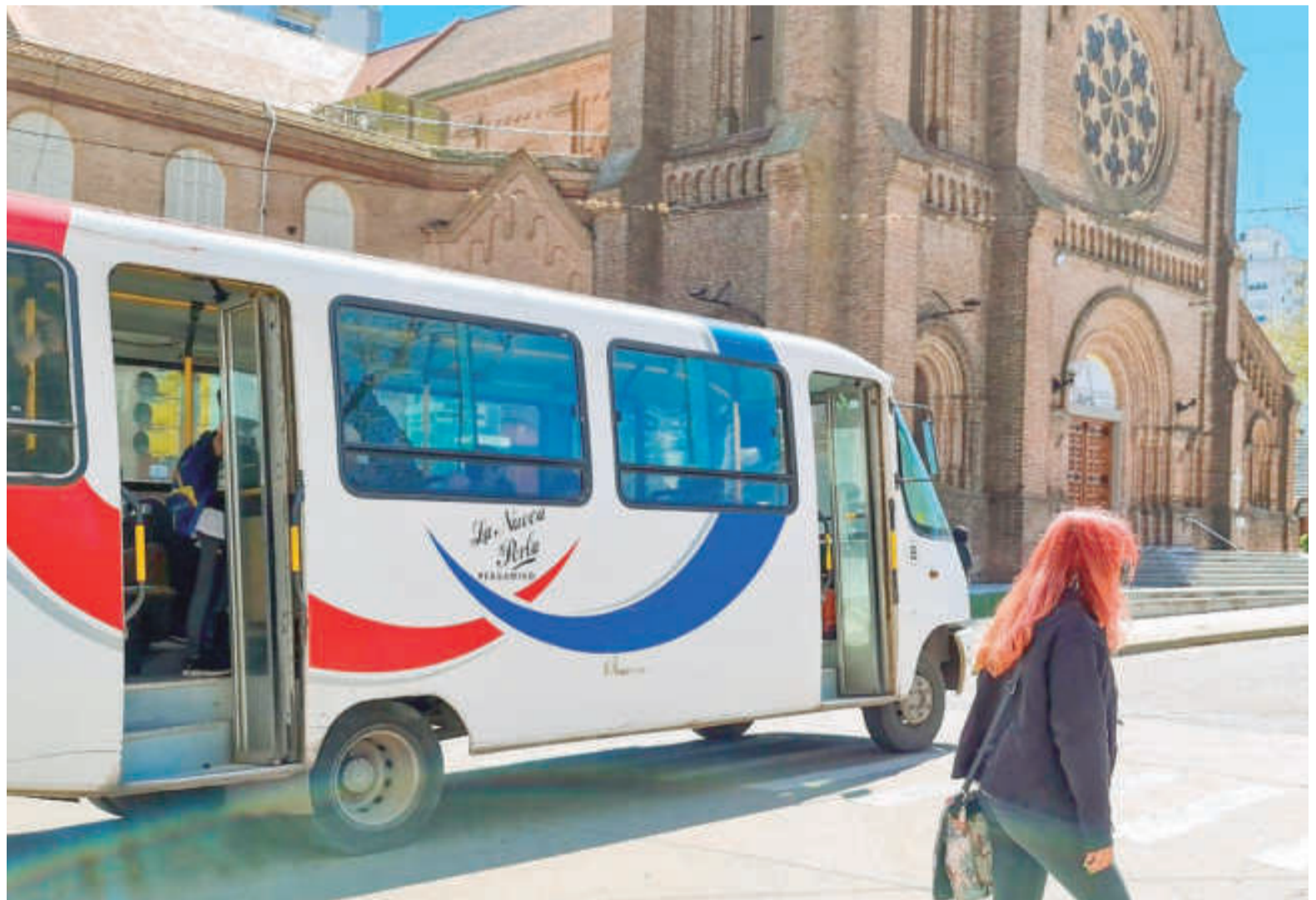
El pasaje de $500 que se paga en Pergamino es el más caro entre los relevados por la AAETA en las principales ciudades del país.

En efecto, el distrito que lidera el ranking es Pergamino con una tarifa de $500, seguido por Bahía Blanca, con $345. En tanto, Junín y Merlo