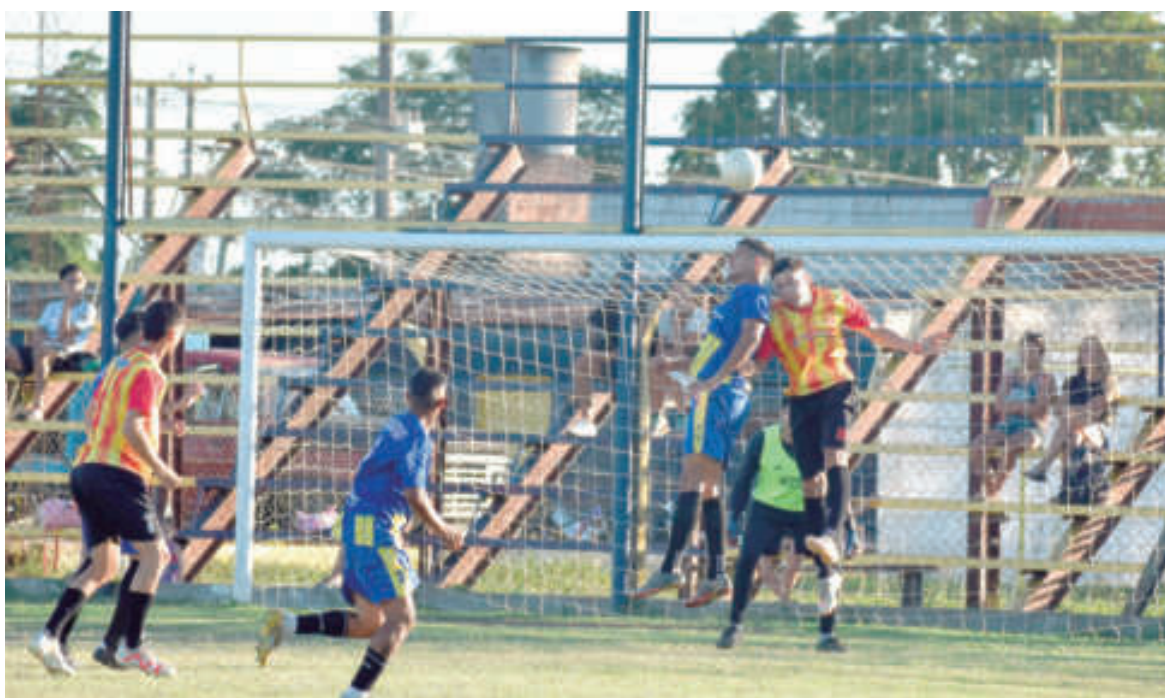
El primer amistoso quedó en manos del Rojo.