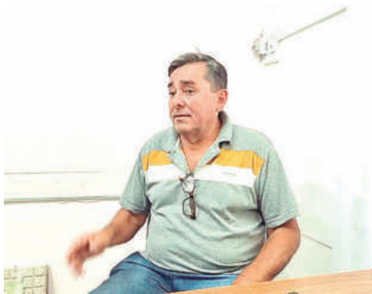
El responsable del área de Aguas y Cloacas brindando las recomendaciones.

Con respecto a los valores obtenidos en los análisis, aseguraron que los mismos están dentro de los parámetros normales, no registrándose hasta el momento anomalías. “Si hay algún barrio que tiene algún valor alto de nitrato, tratamos de mezclar el agua con otra área para conseguir