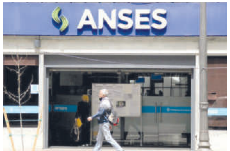
La valuación actual de los activos del FGS es aprox. de u$s 5.500 millones

Luego precisó que “la valuación actual de los activos del FGS es aproximadamente de 5.500 millones de dólares” que, según sus cálculos, “servirían para pagar