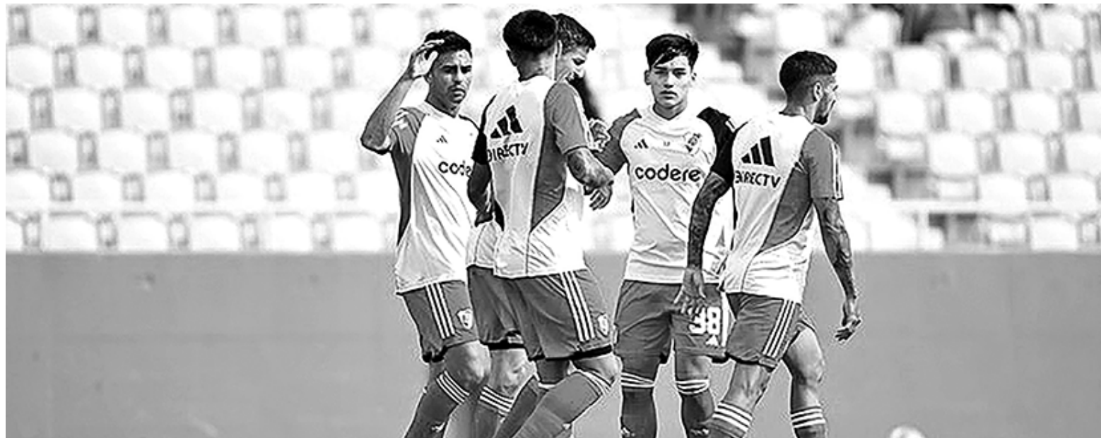
El Millonario igualó en su primer ensayo. WEB

El Millonario, que planteó un once diferente por tiempo, igualó 2-2 en un ensayo formal a puertas cerradas en Florida ante un elenco compuesto por futbolistas que se desempeñan en la liga estadounidense.