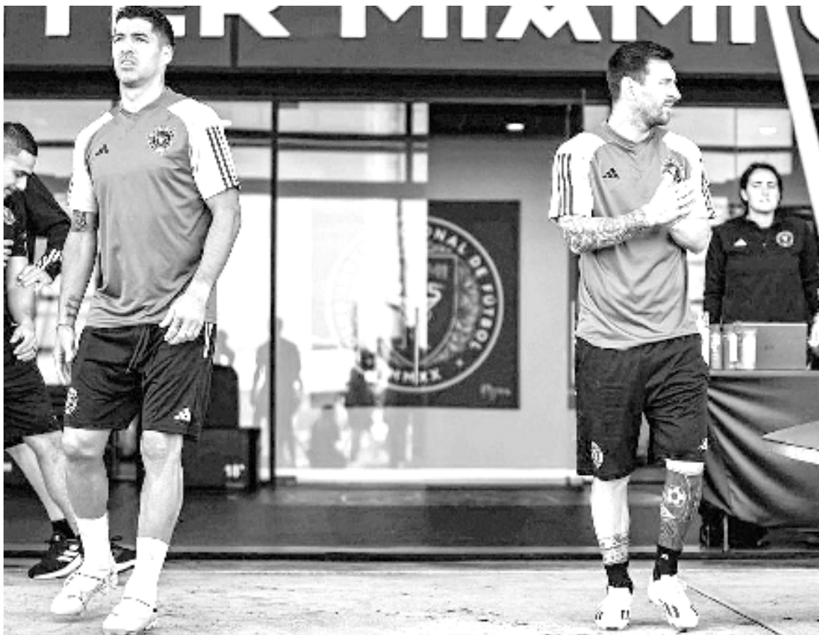
Messi y Suárez juntos otra vez.

La «Pulga» y el «Pistolero», ambos de 36 años, se mostraron sonrientes en las instalaciones de la franquicia de Florida. No compartían plantel desde mediados de 2020 cuando el uruguayo salió de Barcelona.