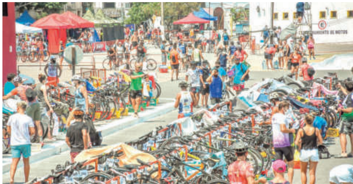
La Paz, "Tierra de triatlón". WEB

puntuables para el Circuito Entrerriano y para la Gran Final del Campeonato Argentino, y casi todo el mapa del país dará presente, ya que 21 de las 24 provincias, más la Ciudad Autónoma de Buenos Aires, tendrán representantes en las carreras (las excepciones son Chubut, La Rioja y Río Negro).