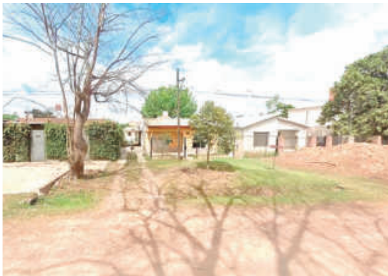
La casa donde hallaron los cuerpos.

Las víctimas fueron halladas por la policía en un domicilio ubicado en la calle 13 de Marzo al 300, en el barrio