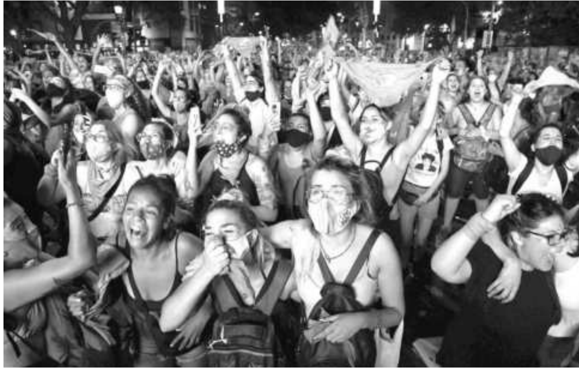
250.000 personas accedieron a un aborto legal y seguro

Y resalta que “para que estos resultados sean así se trabajó mejor la educación sexual integral a través del Plan ENIA de prevención del embarazo no intencional en la adolescencia. Este Plan trascendió las gestiones y permitió una política pública sostenida con niñas, niños,