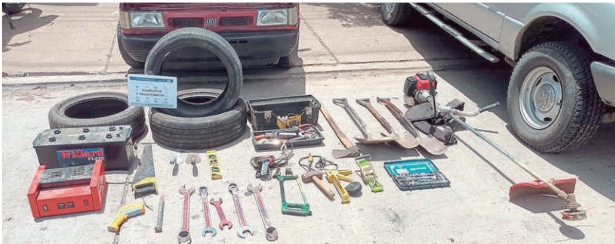
Entre los objetos incautados se encontraban una caja que contenía herramientas de mano, un gato hidráulico, una motoguadaña y tres cubiertas nuevas de automóvil.