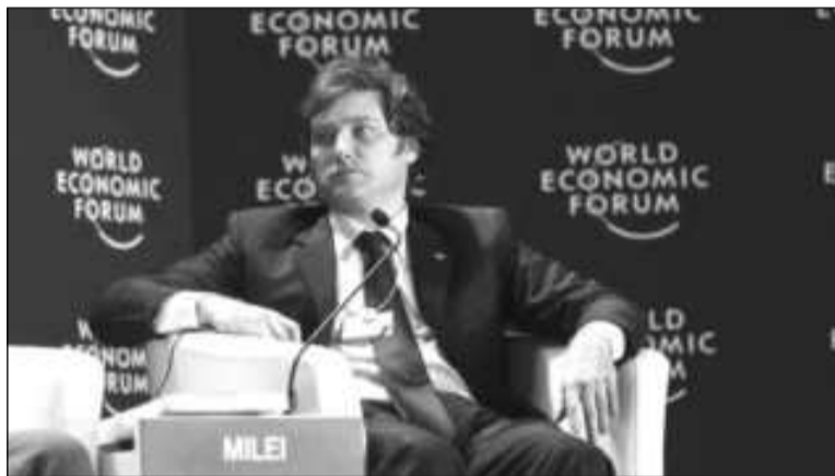
El presidente Javier Milei