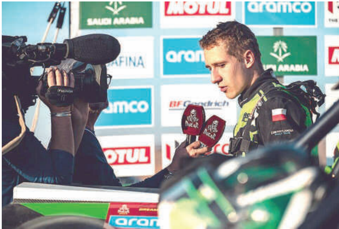
Goczal se quedó fuera de la prueba en el día de descanso. DAKAR

"Hago la estrategia de dar lo mejor y tratar de llegar. La clave es que hay ocho pilotos que están en una hora y todo puede pasar, obviamente mi