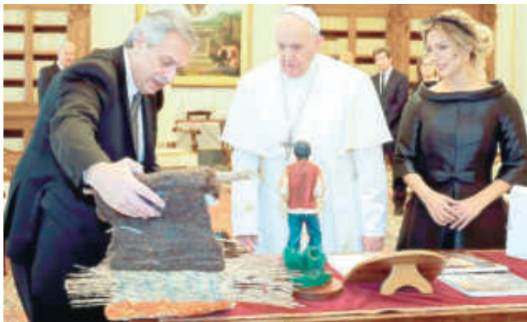
Alberto Fernández y Fabiola Yañez fueron recibidos por el papa Francisco el 31 de enero del 2020.