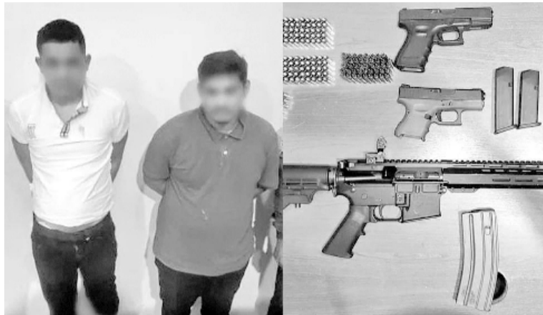
Atrapados. Los aprehendidos y las armas incautadas.

“Hemos aprehendido a 2 presuntos implicados en el asesinato del fiscal César Suárez, en Guayaquil, tras diligencias investigativas que permitieron identificar la presunta participación en el hecho criminal”,