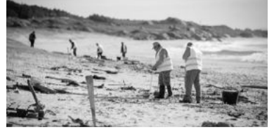
Contaminación de mares.