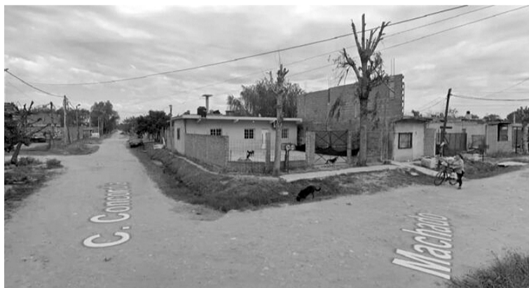
El hecho ocurrió en una vivienda en Machado y Concordia de Virrey del Pino.

Mientras un tercer sospechoso esperaba al volante del Peugeot 208 en el que se movilizaban los delin-