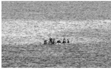
Era una embarcación escolar.