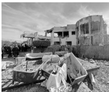
Al menos nueve víctimas fatales.

En un comunicado, el Ministerio paquistaní de Relaciones Exteriores anunció que el país había realizado “una serie de ataques militares altamente coordinados” y “con precisión contra guaridas te-