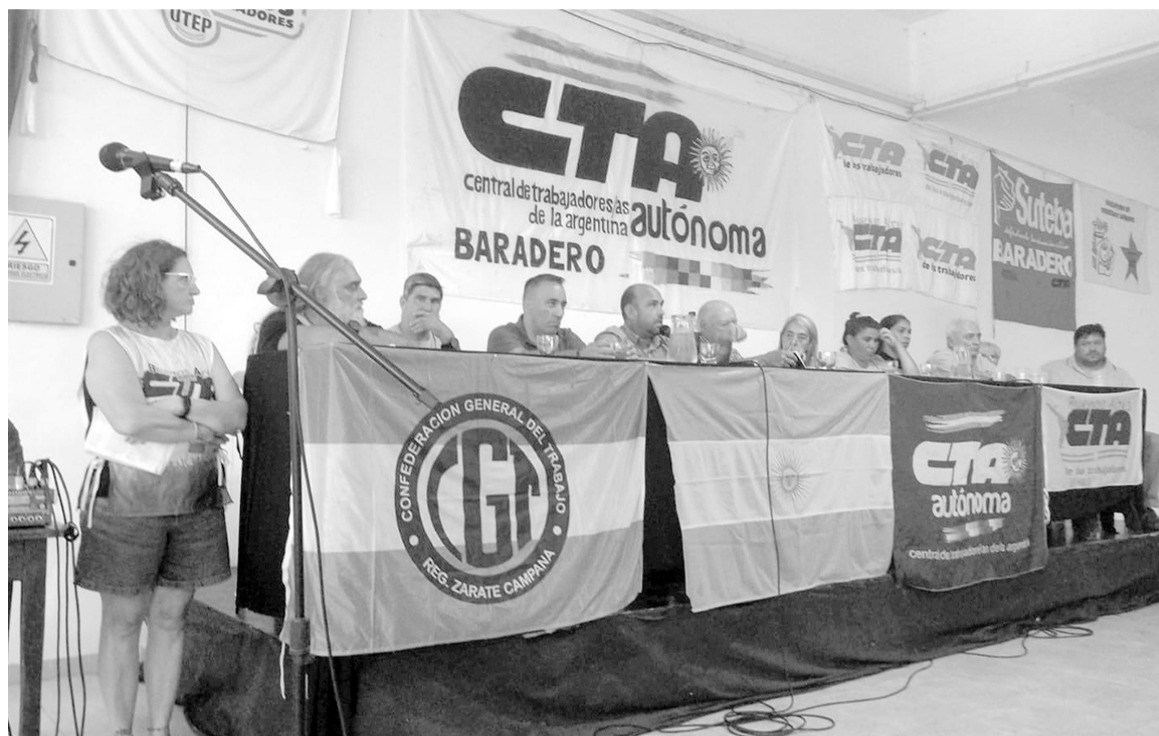
En el marco del paro general, organizaciones gremiales, sociales y políticas de nuestra ciudad definieron realizar un acto conjunto el 24 de enero en la plaza Mitre.

"Se ha tomado la decisión de descontar el día a los empleados estatales nacionales que se adhieran al paro. El salario es una contraprestación y