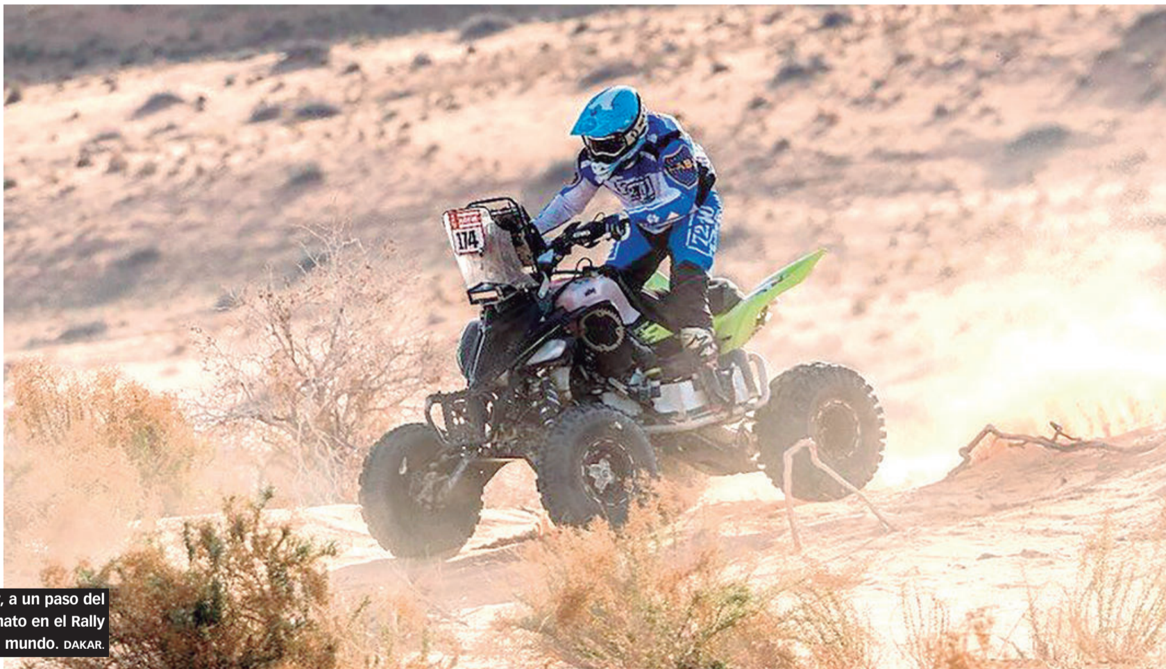
Andújar, a un paso del campeonato en el Rally más peligroso del mundo. DAKAR.

Sainz completó el podio de la undécima y penúltima etapa, que tuvo al argentino Juan Cruz Yacopini (Toyota Overdrive Racing) en el séptimo escalón.