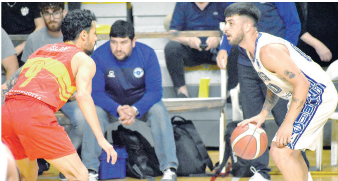
Somisa y Belgrano mañana irán por el pase a la final y a la Liga Federal 2024.

La serie entre el Rojo y Somisa se definirá mañana a las 20.30 en el "Fortunato Bonelli" a puertas cerradas de acuerdo a lo que informó la Región CAB 1, luego del descargo de la dirigencia belgranense y de un nuevo fallo del Tribunal de Disciplina.