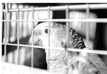
Aves autóctonas y exóticas decomisadas.

En los allanamientos se decomisaron 106 ejemplares de 42 especies, entre ellas cardenal amarillo, loro gris africano, guacamayo rojo, loro hablador, tucán grande, tucán pico verde, guacamayo bandera, guacamayo arlequín, urraca criolla, loro barranquero, rey del bosque, reina mora chica, cardenal copete rojo, fe-