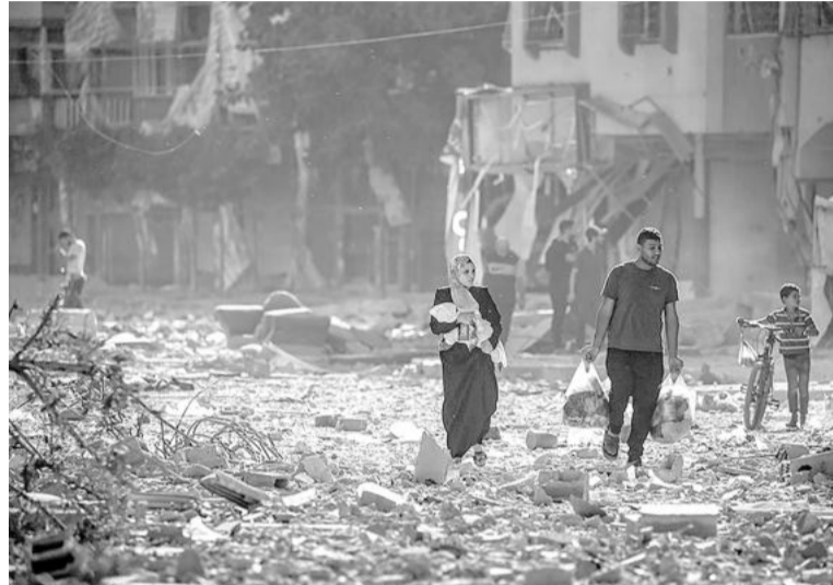
Horror. Imágenes de destrucción en la Franja de Gaza.

La demora había sido anunciada la noche del miércoles por un funcionario del Gobierno israelí del primer ministro Benjamin Netanyahu, sin dar ningún motivo, pero medios israelíes y árabes dijeron que el retraso se debió a diferencias sobre quiénes debían ser liberados y cómo. La oficina de Netanyahu dijo ayer haber recibido una "primera lista de nombres" de rehenes y que se