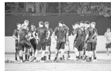
Los pibes en la práctica. - AFA -

El conjunto juvenil de la Argentina juega desde las 9.00 por un lugar entre los cuatro mejores.