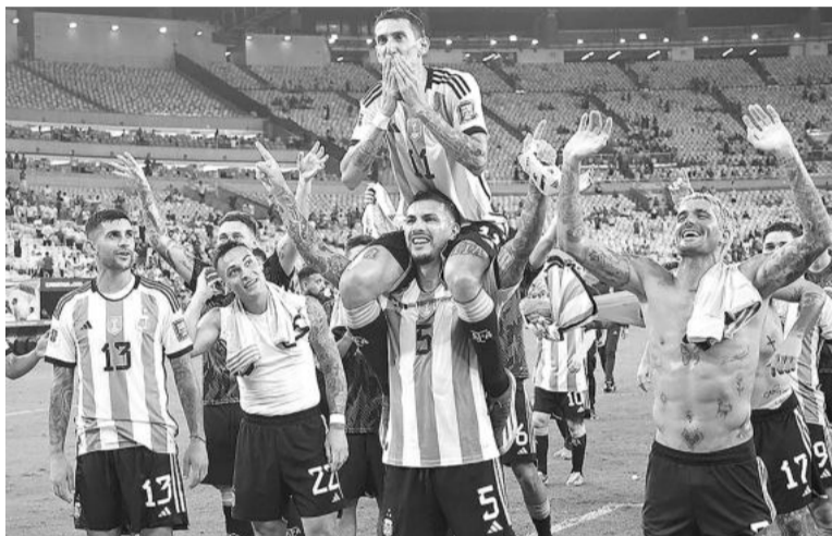
Ídolo. El autor de los goles más importantes.

“Lastimosamente no podemos dejar pasar los hechos que surgieron en el estadio, nadie merece ese maltrato ni los golpes. Familias y niños asustados en medio de un estadio donde lo único que debería