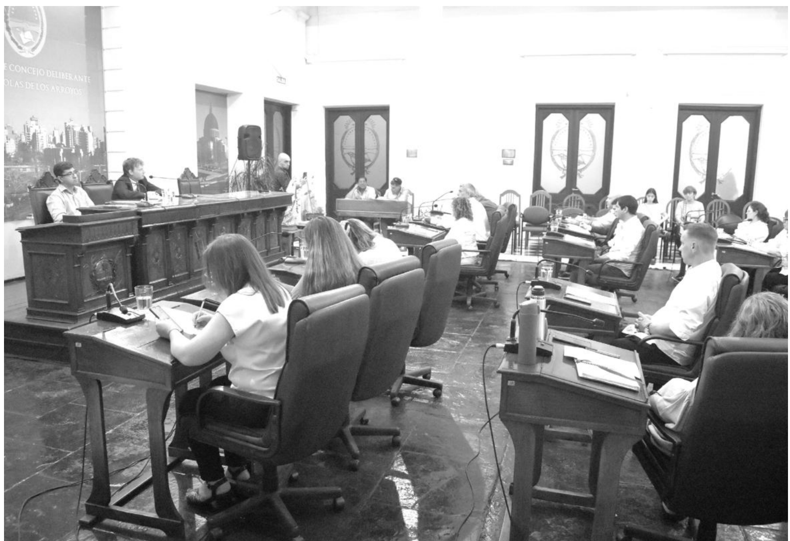
La votación por el transporte público registró siete votos por la negativa, expresados por los miembros del bloque del Frente de Todos.

“En la comisión de Obras y Servicios Públicos hemos analizado este expediente desde el 14 de septiembre pasado. Recibimos allí a representantes de la empresa Vercelli, quienes vinieron a proponer un aumento de casi el 300%, con un boleto superior