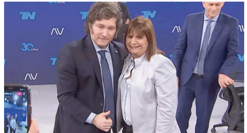
Aliados. Rivalen en la primera vuelta, socios en la segunda.

Mientras se confirmaban las distintas designaciones, Milei continuó manteniendo reuniones en su bunker del Libertador Hotel, por ejemplo con una de sus principales espaldas, el legislador porteño Ramiro Marra, y el diputado nacional electo por La Rioja, Martín Menem. Pero el nombramiento más