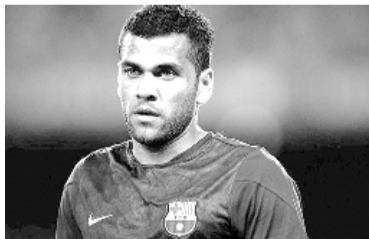
Cada vez más complicado.

El exfutbolista brasileño Dani Alves sumó ayer una nueva complicación judicial tras el pedido de parte de la Fiscalía de Barcelona de nueve años de prisión efectiva por presunta agresión sexual con penetración, en un hecho sucedido en la noche del 30 al 31 de diciembre del 2022 en la discoteca Sutton, en el centro de la capital catalana. Los letrados solicitaron, además, que se le aplique una multa de 150.000 euros para la víctima y 10 años de libertad vigilada, según lo difundido en el diario catalán Sport. Este es el segundo pedido de encarcelamiento por parte de la Fiscalía de Barcelona tras el antecedente del pasado 20 de enero,