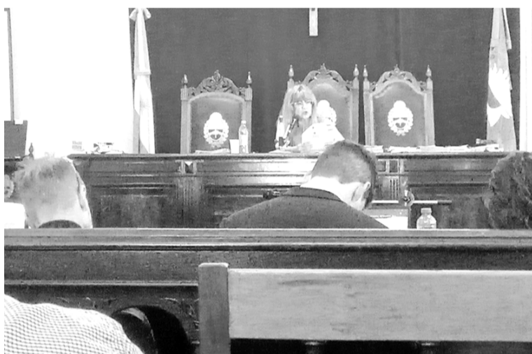
Por el homicidio están acusados dos expolicías.