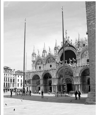
Icono veneciano.

ITALIA.- Los turistas comenzarán a pagar una entrada para visitar Venecia a partir del 25 de abril, un "peaje turístico" que solo funcionará 29 días al año y en una franja horaria limitada, anunció el Ayuntamiento de la ciudad de los canales. El precio por una entrada general será de 5 euros, confirmó el alcalde veneciano, Luigi Brugnaro, tras anunciar el calendario con los días en los que la controvertida tasa estará vigente, coincidiendo con las épocas de mayor afluencia turística del año, consignó la agencia EFE. - DIB -