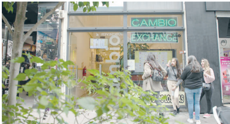
Buscado. La divisa norteamericana, más cara.

Bienes Personales: 25% en dólar tarjeta y ahorro.