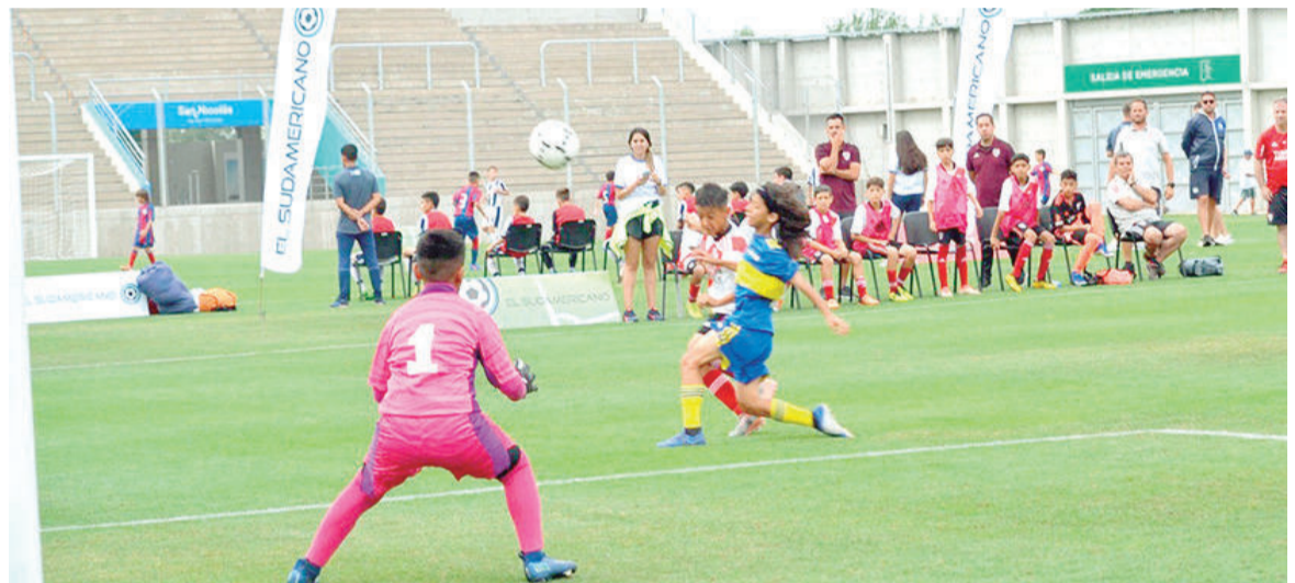
Vienen a la ciudad chicos de todo el país, Uruguay, Chile y Brasil.

Esta tarde dará inicio la segunda edición de El Sudamericano, el certamen de fútbol infantil que tiene como epicentro el Estadio San Nicolás, y que recibirá a importantes clubes de Argentina y países limítrofes. El mismo será para la categoría 2012, con una "Copa Preparación" para los 2013.