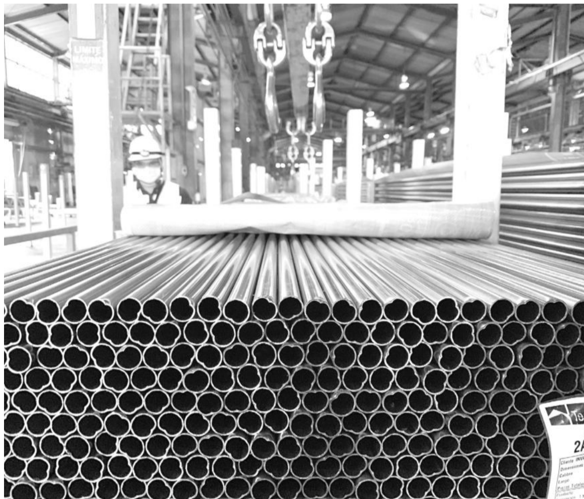
La producción de acero crudo en octubre de 2023 fue de 458.500 toneladas, resultando 7% inferior que en octubre de 2022 (493.000 toneladas).

El reporte incluye además un apartado centrado en la importación de insumos y productos semielaborados. "Continúa prácticamente cerrado el acceso al MULC para importación de materias primas no producidas en el