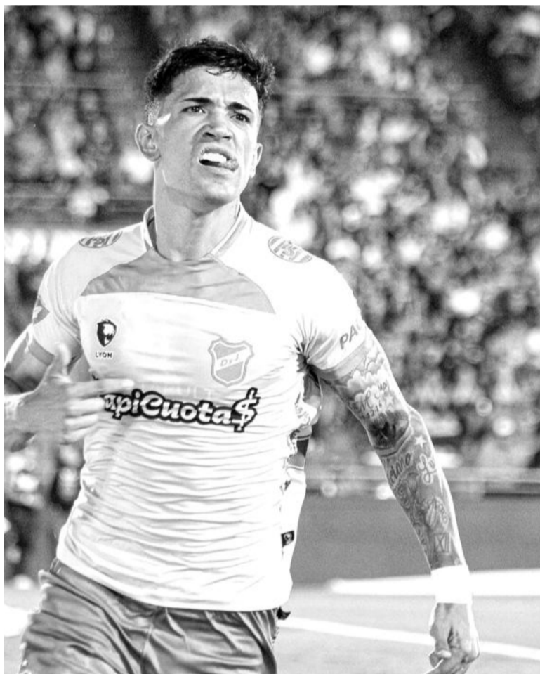
Solari le dio el pase a la final al Halcón. NA

La segunda etapa fue íntegramente dominada por un impotente Ciclón, que apenas logró generar peligro en el área del adversario y no encontró ninguna respuesta a sus plegarias en las variantes que dispuso Rubén Darío Insúa en aras de lograr el tanto que fuerce una definición desde los doce pasos.