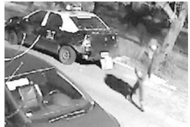
El "quemacoches" captado. - CA -