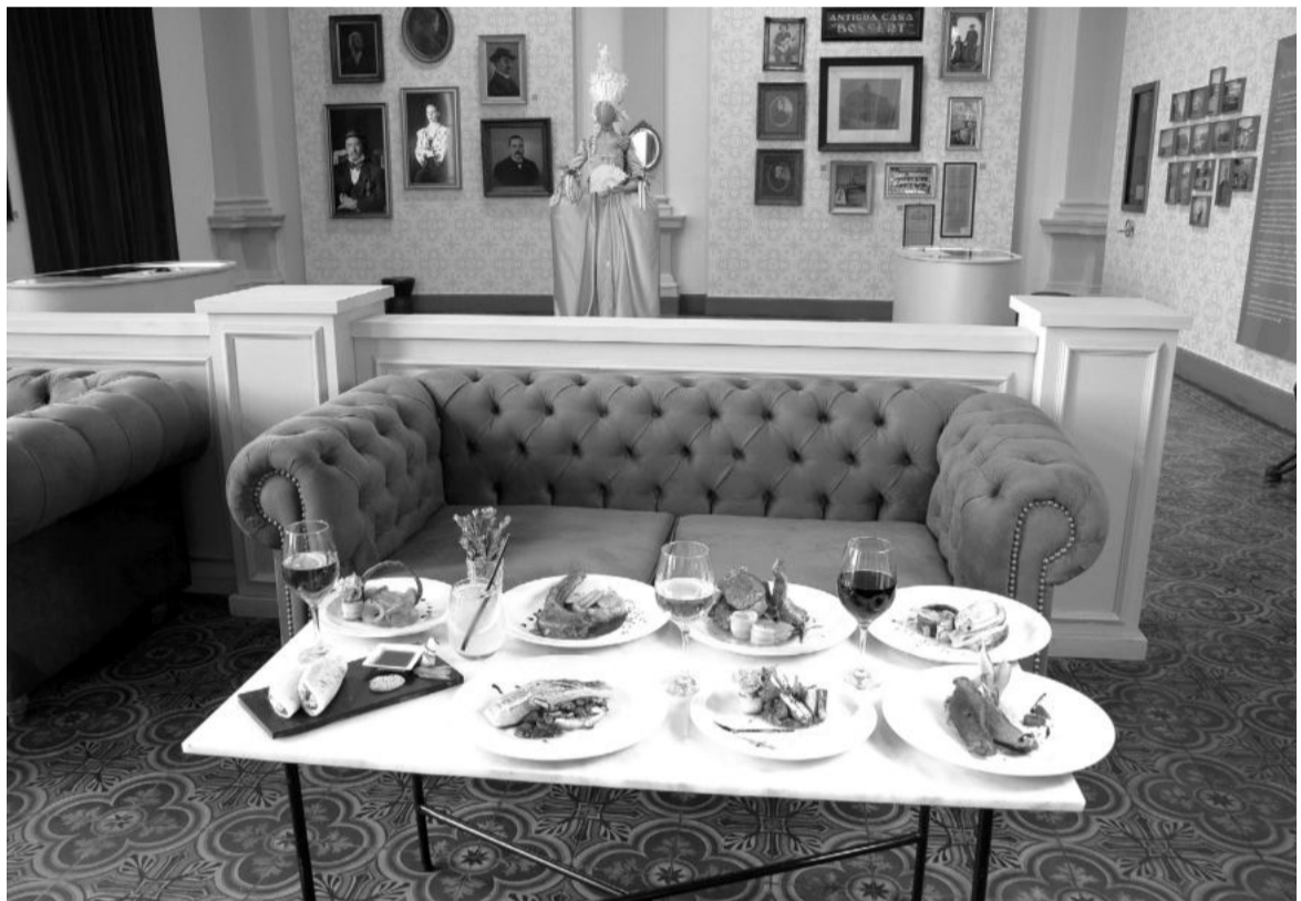
Cocktails & Shows, el nuevo atractivo cultural y gastronómico que se desarrollará en el Foyer del Teatro. ILUSTRACIÓN

La iniciativa, impulsada por la Municipalidad de San Nicolás, se desarrollará todos los viernes a las 22:00 con bandas de diferentes géneros, platos y tragos, para comenzar los fines de semana con la mejor energía en un lugar emblemático de la ciudad. La participación es con reserva previa.