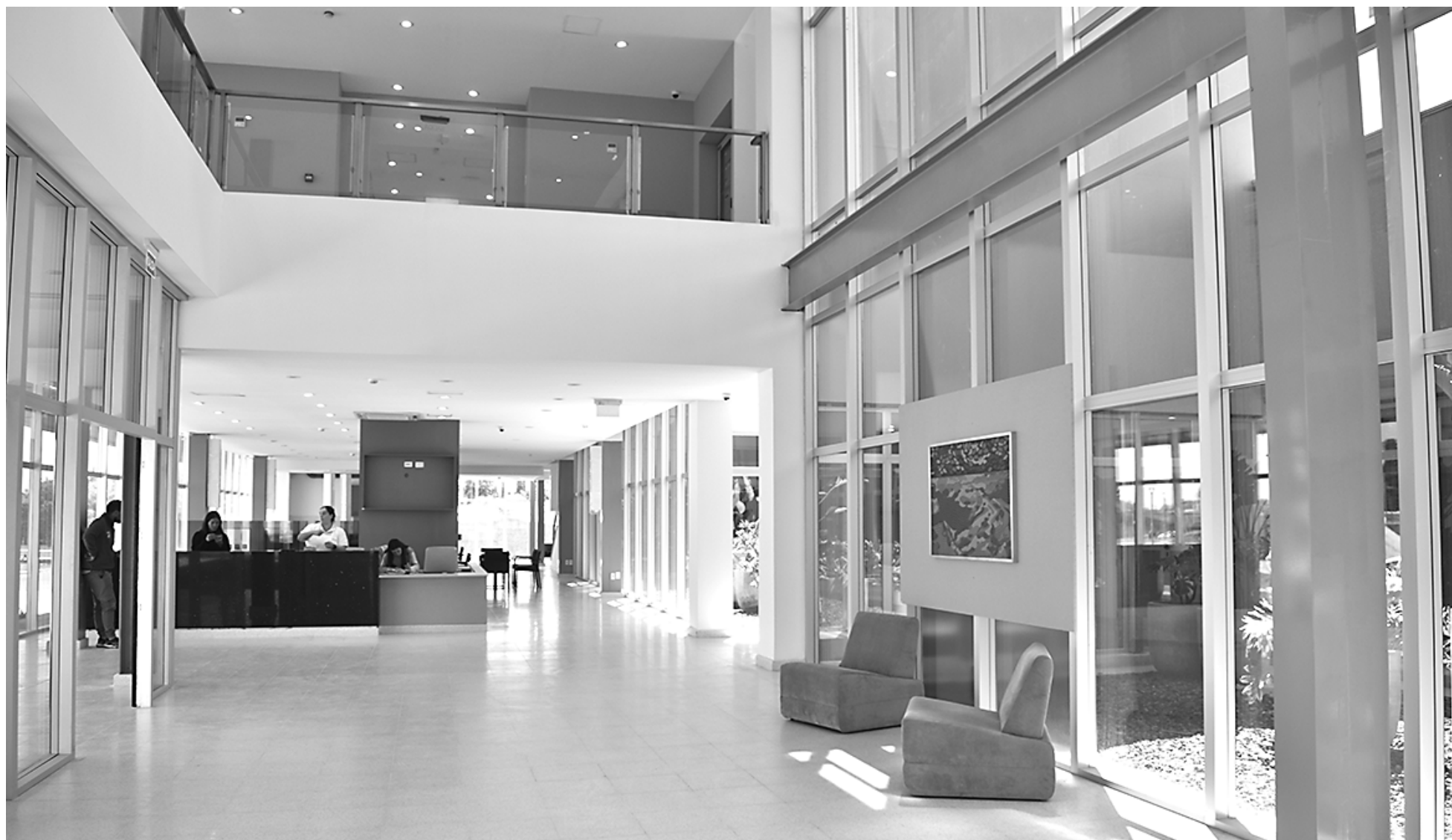
La inspección inicial será en el área de consultorios externos, y luego seguirá por el resto de las dependencias.