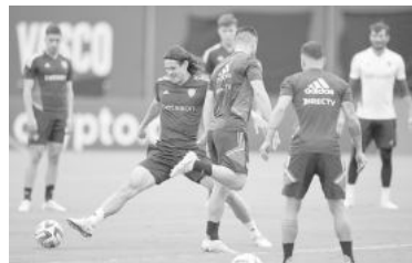
Cavani, casi seguro titular.

Es que las dos prácticas de Boca previas a la final son abiertas durante 15 minutos para los medios