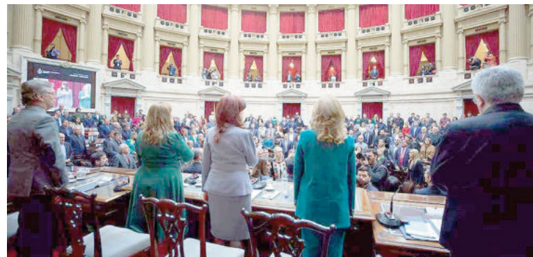
Segunda vuelta. El acto se realizó dando cumplimiento al artículo 120 del Código Electoral.

Tras la lectura de los resultados, la vicepresidenta informó que las fórmulas de UXP y LLA quedaron proclamadas para