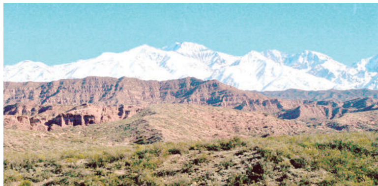
La calidad de vida en Mendoza se ve beneficiada por un clima que permite la realización de actividades al aire libre.

Una de las calidades de Buenos Aires es su gastronomía típica, que atrae a to-