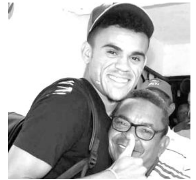
El jugador del Liverpool junto a su padre.