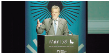
El candidato apuntó contra quienes "quieren tachar la cultura".

"Es una industria que genera trabajo, que genera divisas, que muestra a la Argentina en el mundo. Vengo acá para comprometerme a trabajar en más y mejor financiamiento para el cine argentino", reivindicó Massa al participar de la apertura del 38° Festival Internacional de