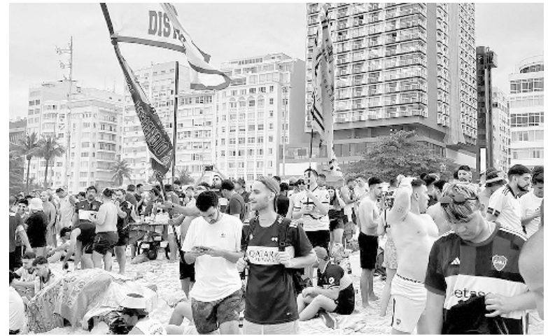
Fiesta... y terror. El color de los hinchas argentinos en Río, minutos antes de ser embocados y maltratados por la policía.

Según la policía local, previamente un argentino había sido detenido luego de patear a un perro que acompañaba a un brasileño que estaba en la playa y de arrojar una botella contra la policía. Una persona lo acusó además de haber proferido insultos racistas.