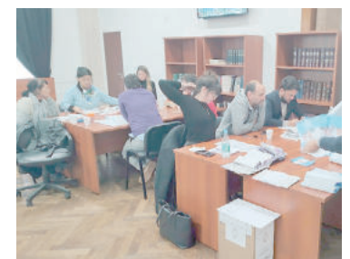
Final abierto en la capital provincial. - Belén Bártoli -

En ese marco, Alak, actual ministro de Justicia de Axel Kicillof se proclamó vencedor: "es una victoria clarísima", le dijo al diario platense El Día. Pero Garro, argumentando que del recuento