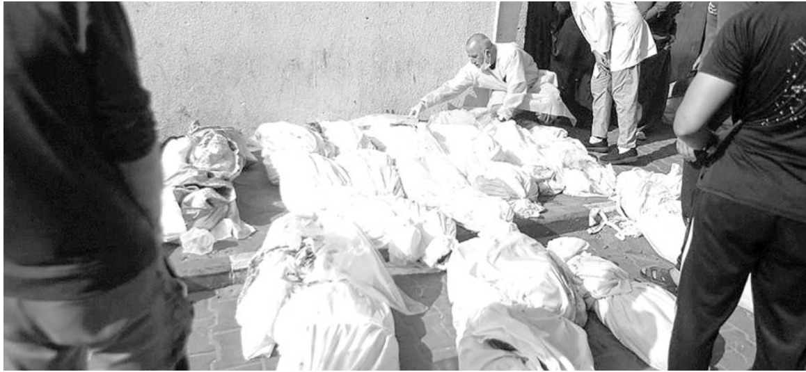
Gaza. Ya son más de 9.000 los palestinos muertos por ataques de Israel

Israel no respondió de inmediato a los comentarios de Biden, pero el primer ministro Benjamin Netanyahu rechazó esta semana un alto el fuego y prometió continuar los bombardeos y operaciones terrestres hasta destruir a Hamas y liberar a los rehenes que