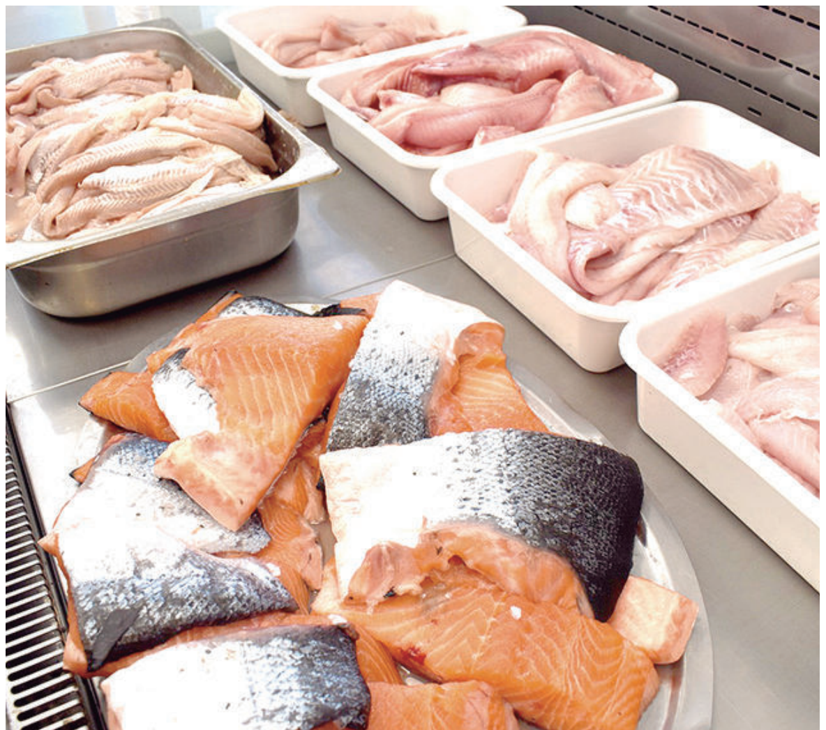
Comerciantes estiman que los precios pueden subir en los próximos días en todas las variedades de pescado.

Según comentaron los propietarios locales, el alimento más vendido es el filete de merluza sin espinas que tiene un precio aproximado de $3200 por kilo. Para dimensionar el aumento, costaba $1200 en abril de 2022. Sin embargo, el incremento más llamativo fue el valor del salmón rosado fresco que saltó a $21.000 en las últimas semanas –en agosto del año pasado se ofrecía a $8750– y que "debería estar más caro", sostuvieron. Sobre este último, cabe aclarar que la razón de ello refiere a la necesidad de su importación. Empero, puede conseguirse a un precio menor congelado que ronda los $16.000.