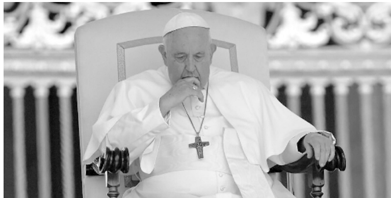
El Papa Francisco opinó de fútbol.

"Para mí, de los tres, el gran señor es Pelé", dijo el máximo pontífice argentino.