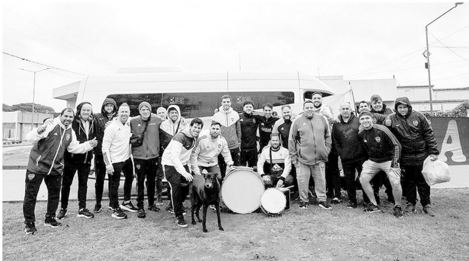
"Cada uno con su diseño particular, pero la promesa principal de todos es el tatuaje", reveló el grupo de amigos.