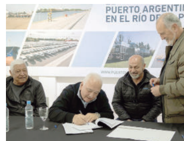
El proyecto incluirá una nueva terminal y una zona logística. - PLP -

"Esto nos permite desarrollar un modelo de negocios para brin-