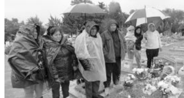
Comunidades quechua, kolla, ayмара, andinas y bolivianas.

Las familias ingresaban por la entrada de las intersec-