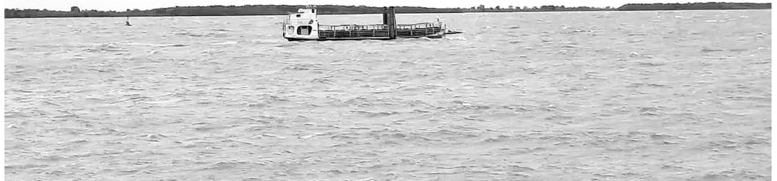
Las barcas trasladando animales ya se pueden divisar desde la zona continental.

La sequía impactó en la recuperación de pasturas, lo que complica la búsqueda de áreas seguras para su ganado. Ello lleva a que los pro-