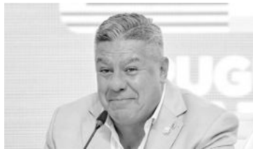
"Inexistencia de delito", consideraron los magistrados.

En su principal presentación, los letrados de Asociación del Fútbol Argentino explicaron que "el contrato firmado en mayo de 2021, y que en teoría regía hasta 2030,