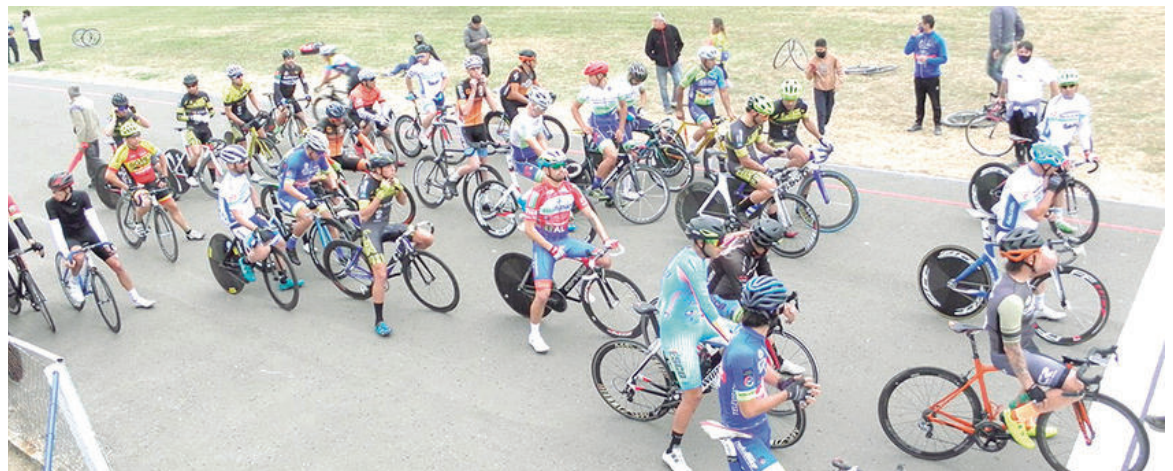
Numerosos ciclistas de la provincia estarán compitiendo el domingo en nuestra ciudad.

El primer campeonato Infanto de Ciclismo 2023 "Provincia de Buenos Aires" llegará a su fin este domingo en la pista del barrio Pezzi de nuestra ciudad. El certamen integra a ciclistas desde los 4 a los 18 años, que llegarán desde numerosas ciudades de toda la provincia.