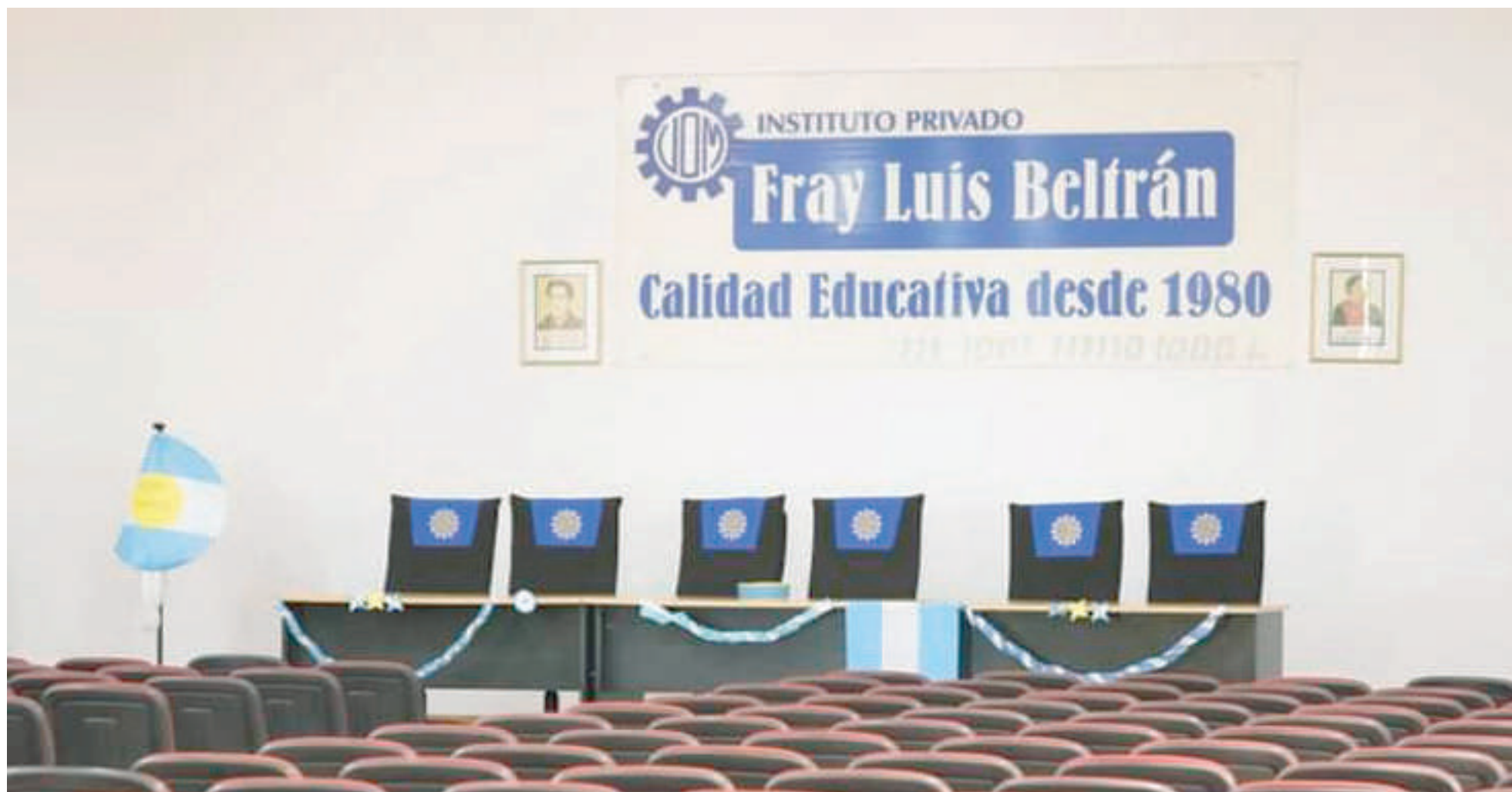
La Escuela de Educación Técnica de la UOM en San Nicolás lleva el nombre del pionero Fray Luis Beltrán.