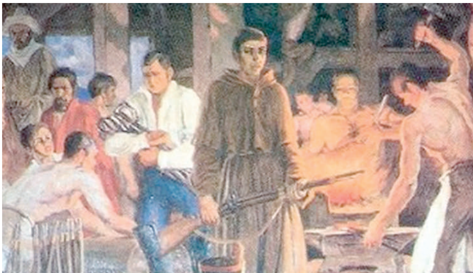
Fray Luis Beltrán acompañó a San Martín y luego a Bolívar; luchó como un soldado más.

En el año 1812, ya flamante sacerdote entró como Capellán del ejército chileno de Miguel Carrera, y sus