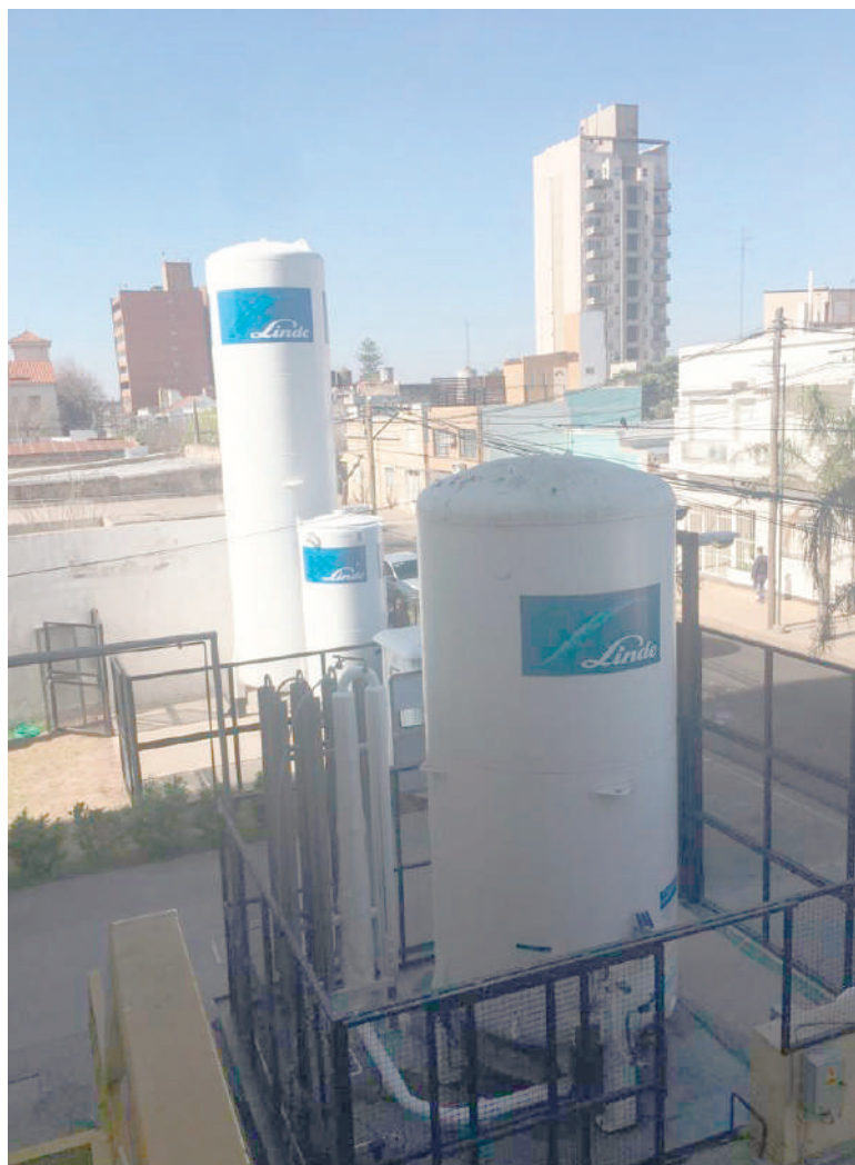
"Estratégicamente es muy importante", destacaron desde el Sanatorio de la UOM

El Sanatorio de la Fundación Nuestra Señora del Rosario (UOM) adquirió 24 camas eléctricas de última generación, con control remoto inalámbrico y con sus respectivas mesas de comer (regulables en altura). Presentan movimientos en el respaldo y pies, respaldo y barandas inyectadas en poliuretano. Están ubicadas en el segundo y tercer piso del anexo. "El objetivo es ir renovando paulatinamente todas las camas", indicaron desde la organización. También incorporó importante tecnología para el servicio de gastroenterología.