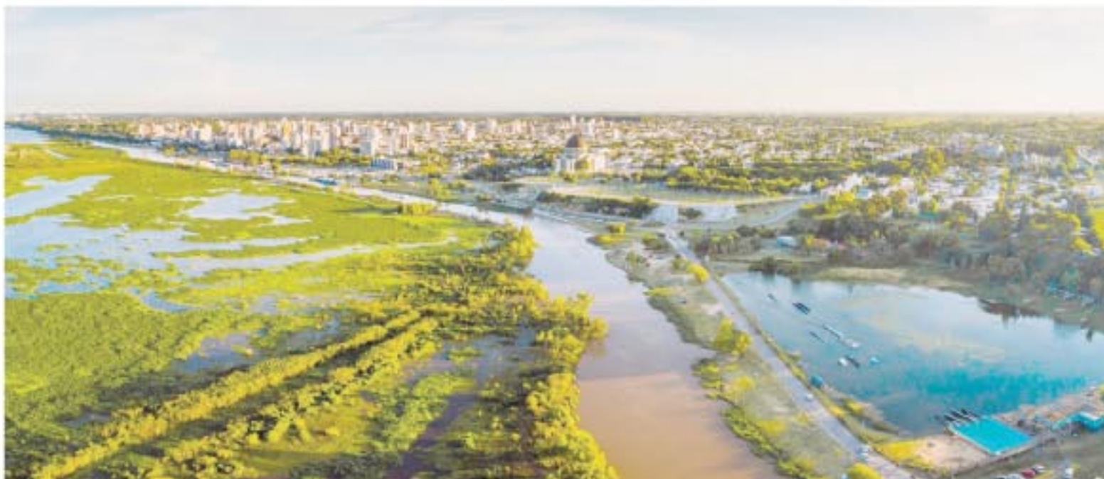
San Nicolás cumple hoy un nuevo aniversario de su fundación.