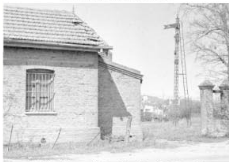
Estación de ferrocarril, Ruta 188 y Av. Savio.