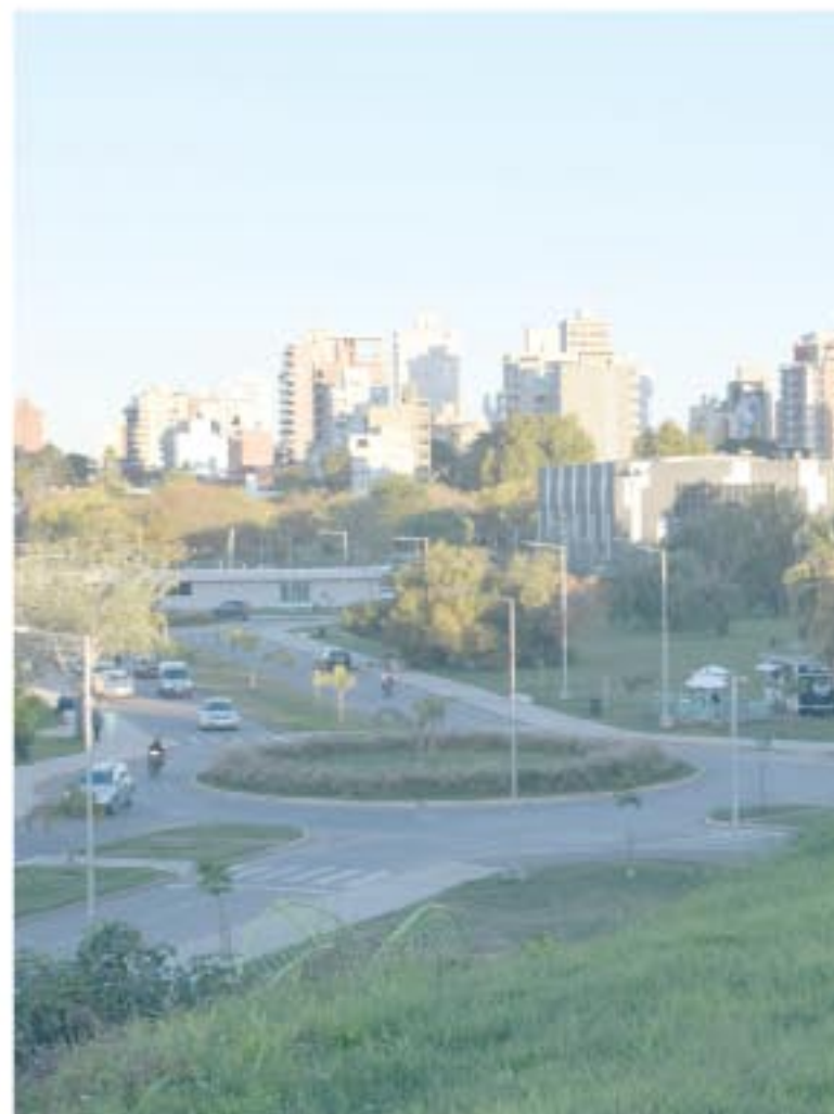
Plaza Mitre.