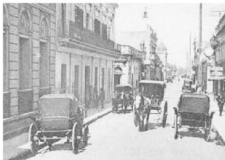
Calle de la Nación hacia Almaguero.