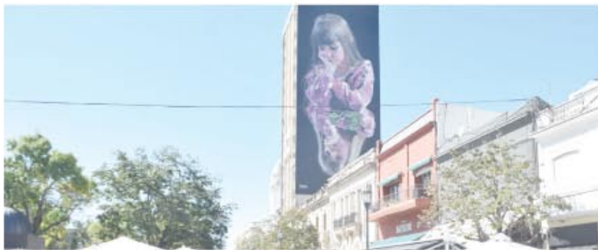
Microcentro de San Nicolás.

EL NORTE jueves 14 de abril de 2022 SAN NICOLÁS