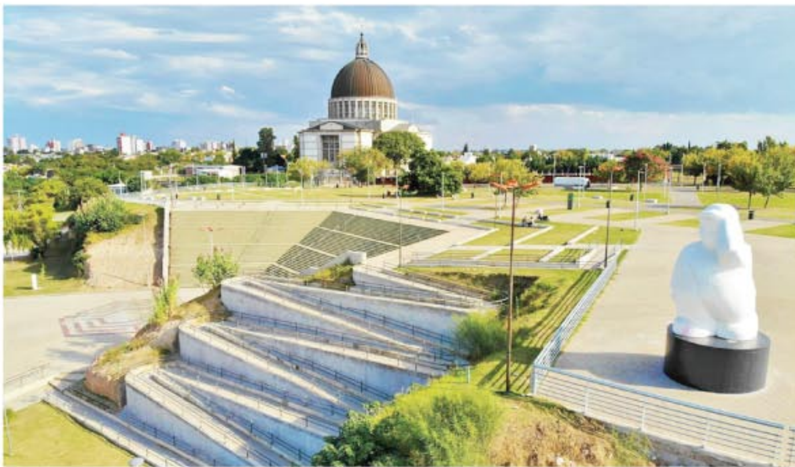
Denominada "de los Arroyos" por sus límites naturales, la ciudad se extiende a la vera del río Paraná, adornada por un paisaje de barrancas, islas y bañados.

En 1983, la ciudad se conmovió con el milagro de la aparición de la Virgen del Rosario. Un año después, comenzó la obra del Santuario sobre la Costanera Alta, realizada íntegramente con el apor-