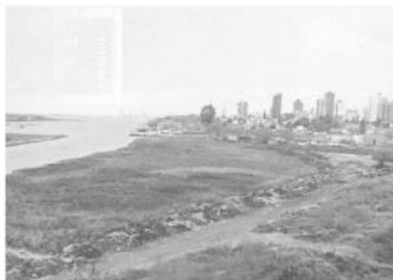
Zona de la Costanera.