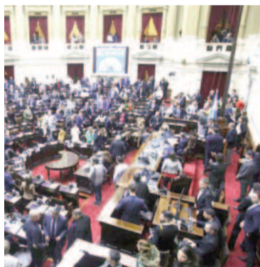
Luego de seis meses, Milei lograría una versión reducida de la Ley Ómnibus.

Lo cierto es que el Poder Ejecutivo argumenta su postura en el artículo 81 de la Constitución Nacional, que sostiene que "la Cámara de origen podrá por mayoría absoluta de los presentes aprobar el proyecto con las adiciones o correcciones introducidas o insistir en la redacción originaria, a menos que las adiciones o correcciones las haya realizado la