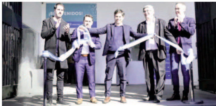
El gobernador cortó las cintas del nuevo mercado fijo de alimentos.

las bonaerenses podrán acceder a bienes de primera calidad a un mejor precio” destacó Axel Kicillof. En ese sentido, el gobernador bonaerense consideró que “Hoy estamos dando un ejemplo muy claro de por qué la Argentina no puede caer nuevamente en falsas antinomias: no tenemos que elegir entre uno o el otro, sino lograr que haya un Estado presente que acompañe al sector privado y mejore la calidad de vida de la gente”, añadió. Durante el acto inaugural, Axel Kicillof le dio otro marco a una política que impulsó desde el inicio de su gestión: “Este programa empezó hace más de cuatro años, pero hoy se vuelve mucho más necesario como consecuencia de las políticas de ajuste del Gobierno nacional” sostuvo. Se trata del sexto mercado fijo que inaugura la provincia. Anteriormente se habían puesto en marcha en Lomas de Zamora, Ense-