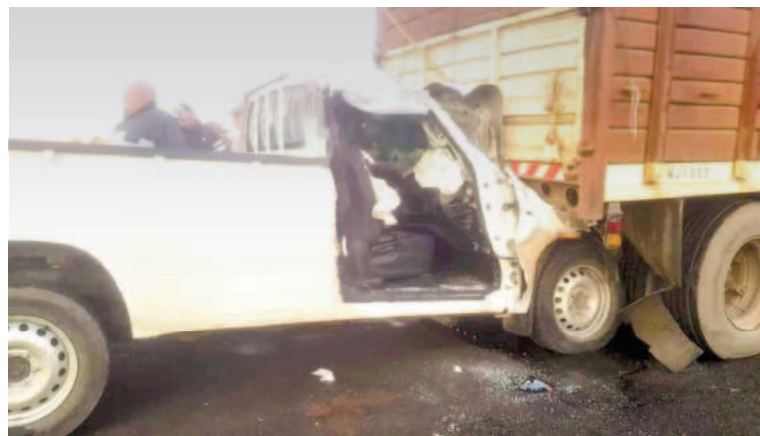
Sampedrino herido al colisionar en la Ruta 9.

El hecho fue caratulado como lesiones culposas e interviene la fiscalía número 11.