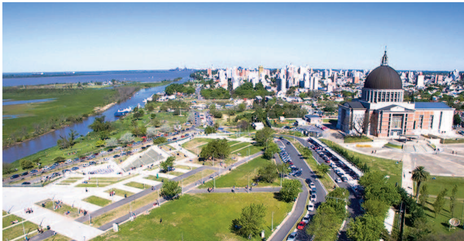
El último fin de semana largo, la principal masa de turistas viajó hacia los lugares más tradicionales del territorio argentino y San Nicolás quedó relegada.

Previo a comenzar el fin de semana largo, la Cámara Hotelera-Gas-