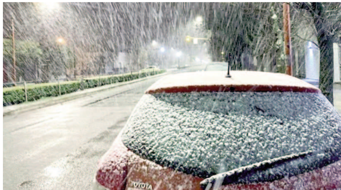
Podría caer nieve este fin de semana en Buenos Aires.

Se vive una semana con mucho frío en territorio bonaerense, y las temperaturas podrían bajar aún más desde mañana sábado. Se esperan heladas y hasta nevadas.