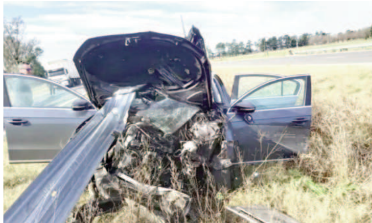
La estructura de hierro de la contención lateral se metió por el frente del vehículo en el impacto.

De acuerdo a los trascendidos, de personas cercanas al siniestro, no habría in-