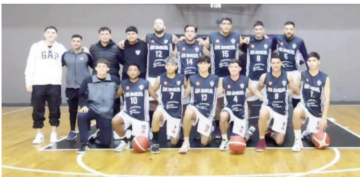
La Emilia si gana alcanzará en la cima a Belgrano "A" y a Los Andes.

Quedan por disputarse once partidos pendientes y dos fechas completas en el torneo "Federico Derrico". Una vez que se complete el calendario, el que termine primero en la tabla será el campeón. Hoy juegan La Emilia-Defensores "A".