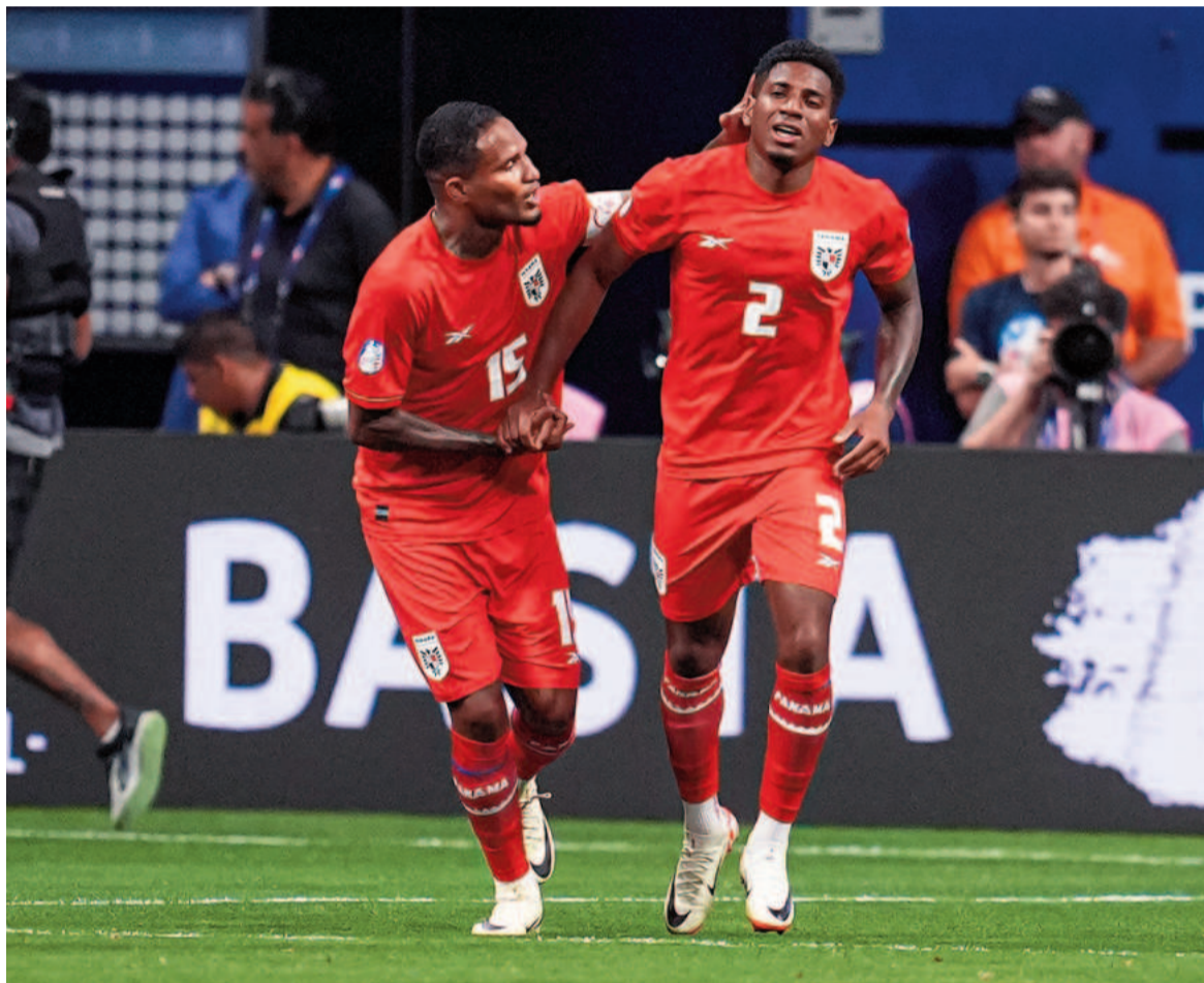
Panamá consiguió una victoria y se ilusiona con clasificar a cuartos. NA

Con la visita lanzada a aprovechar el hombre de más ante un rival