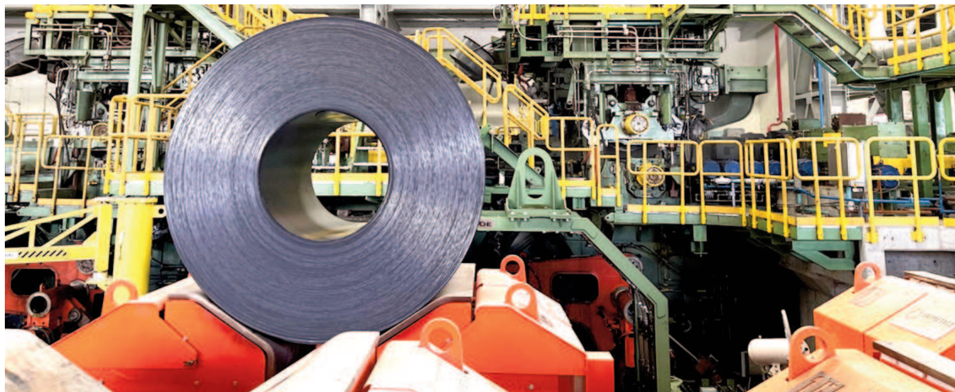
Los datos fueron relevados, elaborados y dados a difusión por la Cámara Argentina del Acero que integran Ternium y Acindar, entre otras siderúrgicas.

EN COMPARACIÓN CON ABRIL LA BAJA FUE DEL 1,5%