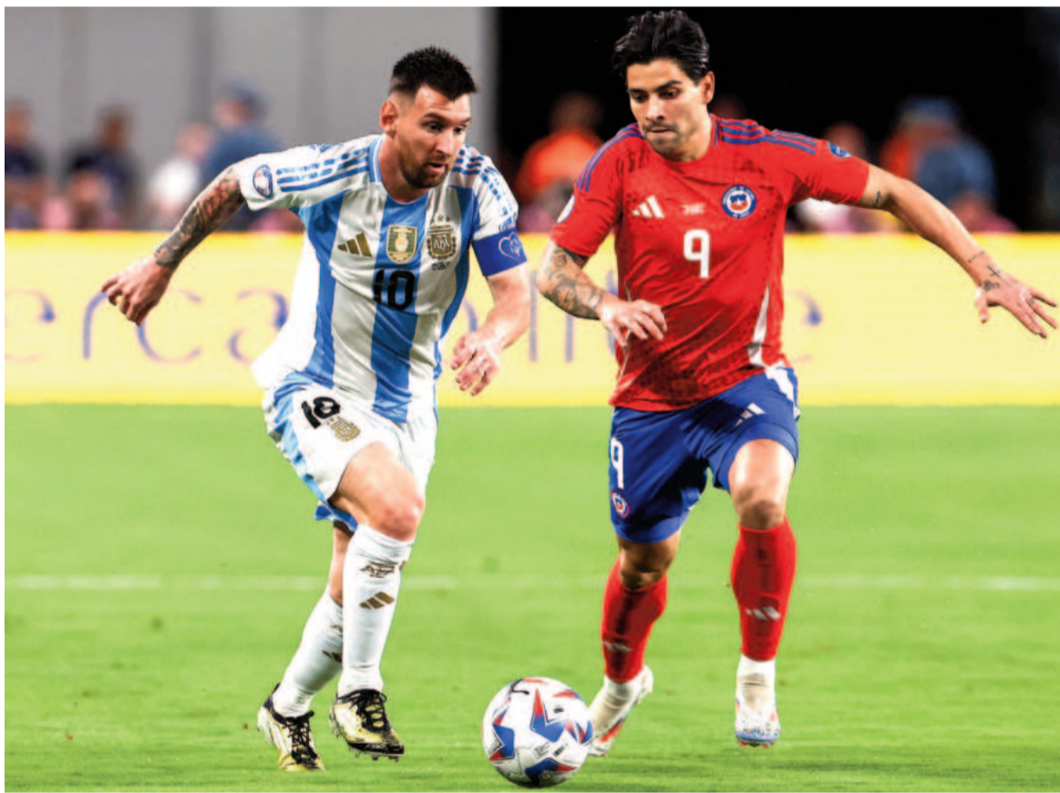
A Lionel Messi le darán descanso mañana y volverá en cuartos de final.

El rosarino, que sufrió una molestia en los aductores ante Chile, sería preservado ante la selección incaica. Por otra parte, Marcos Acuña está descartado por sufrir una lesión muscular.