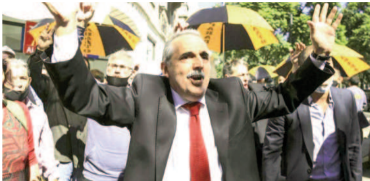
La causa contra Guillermo Moreno, inició en 2007.