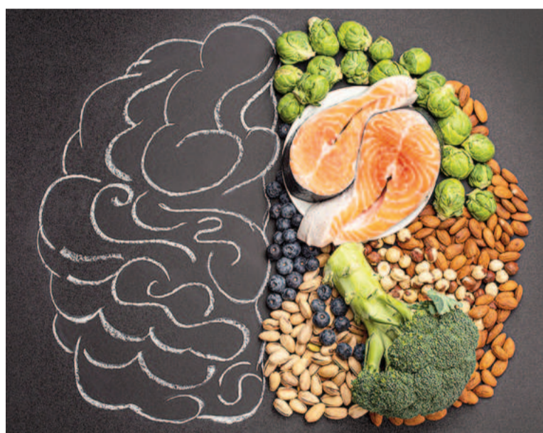
La dieta MIND combina los beneficios de la dieta DASH para bajar la presión arterial alta con la dieta mediterránea.

Tanto la dieta mediterránea como la DASH ya se habían asociado con la preservación de la función