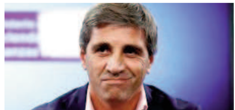
Luis Caputo celebró el resultado fiscal.

Las transferencias corrientes alcanzaron los $ 2.661.047 millones (130,1%). Aquellas correspondientes al sector privado presentaron un crecimiento de $ 1.226.170 millones (133,6%). Entre ellas, se destacan las inherentes a prestaciones sociales, las prestaciones del PAMI, el impacto de la movilidad en las asignaciones familiares (donde la Asignación Uni-