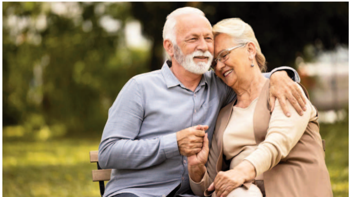
Una fecha especial para conmemorar su rol en la sociedad.

En nuestro país, la edad jubilatoria depende de la actividad, características del trabajo, años de carrera y género. Aquellas mujeres que hayan realizado sus aportes durante 30 años, podrán obtener su retiro hacia los 60 años de edad. Para los hombres, a los 65 años.