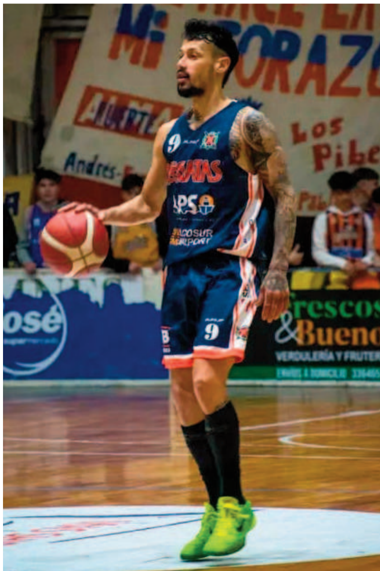
Regatas va en busca de una victoria. Hoy tendrá enfrente a La Emilia.