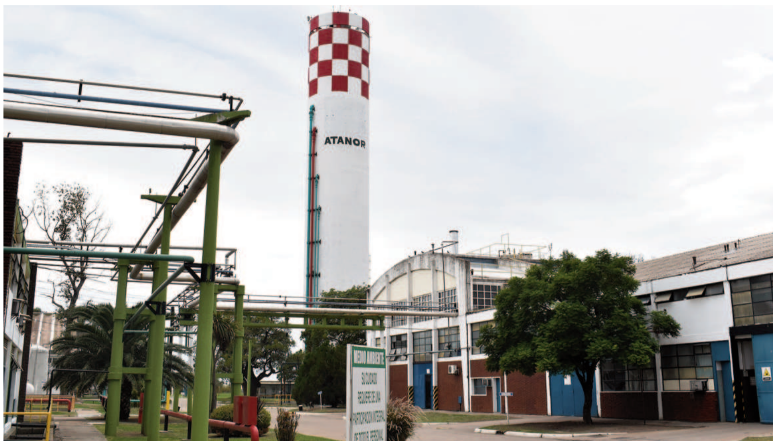
La falta de resolución del Ministerio de Ambiente jaquea la continuidad de la empresa en San Nicolás.

Si el Ministerio de Ambiente no se expide al 30 de septiembre, el panorama para los trabajadores se podría oscurecer aún más. Desde Atanor admiten que sostener la plantilla de empleados en este contexto es cada día más complicado, mucho más por los costos fijos que debe seguir afrontando un establecimiento industrial de la magnitud de Atanor. “Si el escenario no cambia, va a ser muy difícil seguir sosteniendo esto”, afirman. Los empleados, como se escribió más arriba, están protegidos hoy por un acuerdo de suspensión que vence en diez días. Ese acuerdo establece que los trabajadores perciben el 50 por ciento del salario. El lunes de