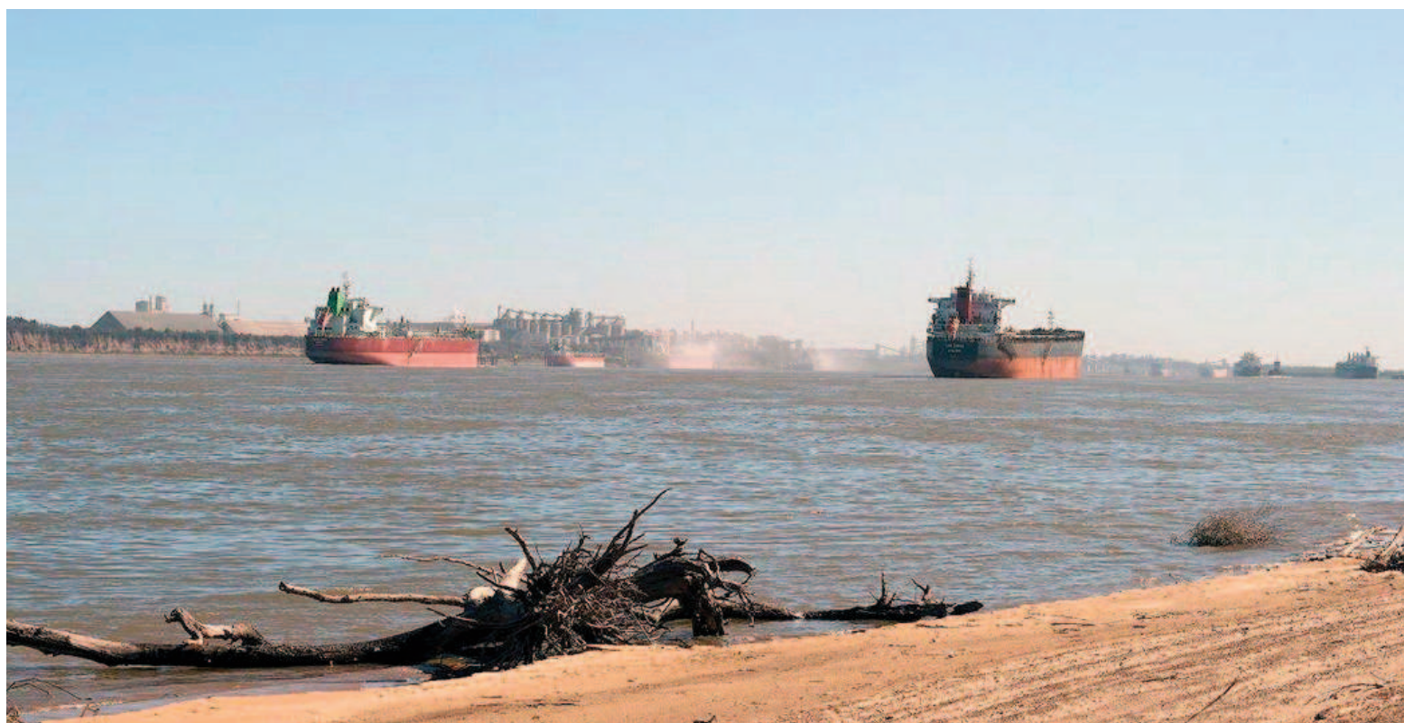
Hay barcos que prefieren evitar la navegación por la Hidrovía por la carencia de agua en el río Paraná y otros que deciden cargar menos toneladas.

Este año, la Prefectura Naval Argentina estableció un calado máximo de navegación de 8,88 metros, como una medida crítica ante la situación hidrológica del río Paraná. Hay al menos cinco embarcaciones