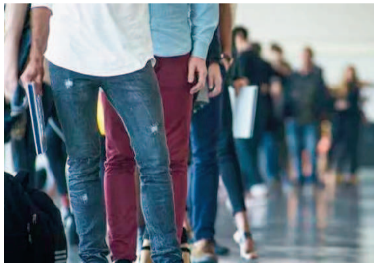
En el último año, la población activa creció en más de medio millón de personas, pero la mayoría siguen desocupados.

Así, el total de empleados registrados ascendió a 13.292.000, mientras que el empleo en negro creció a 7.400.000 personas en el total país. Lo más preocupante,