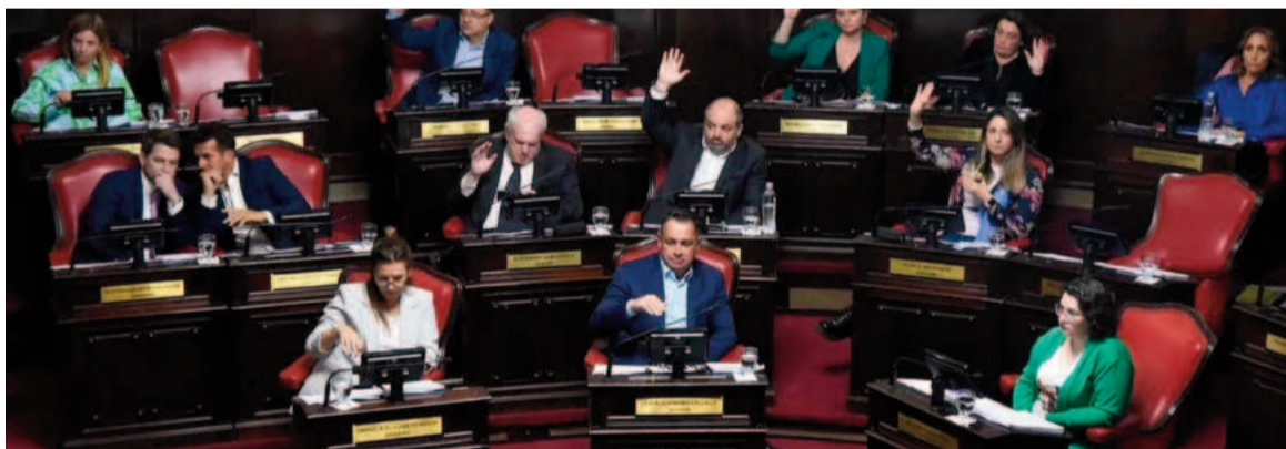
El Senado bonaerense aprobó cambios en defensa de los niños.

«Ya no podemos seguir permitiendo que las madres tengan que demostrar cuánto cuesta criar a sus hijos mientras los niños sufren hambre tras una se-