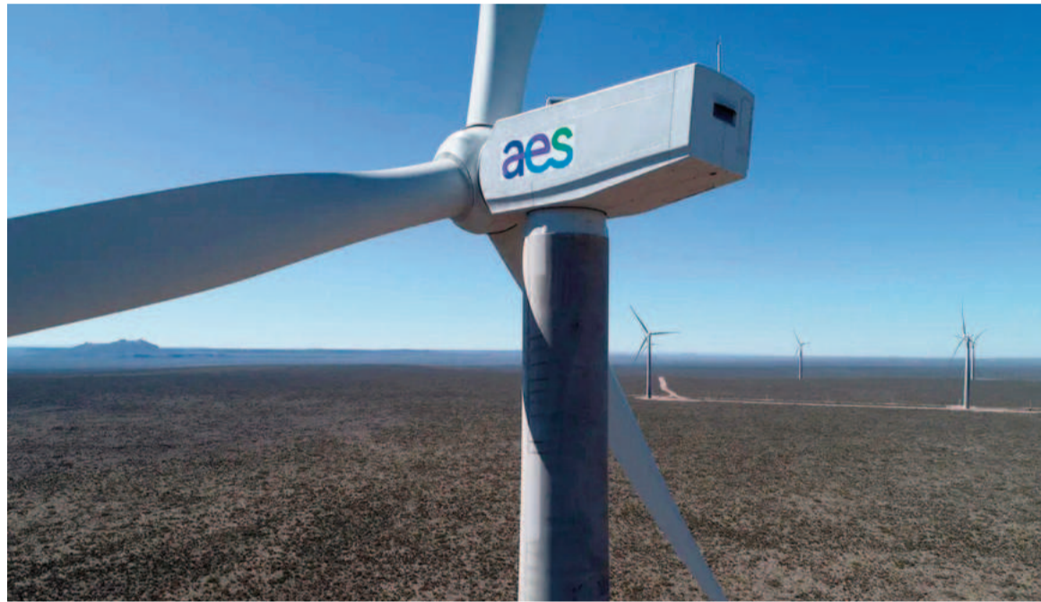
AES reconoce su rol esencial en la transición hacia un futuro energético más limpio y eficiente.

"Nuestro viaje hacia la sostenibilidad ha sido un proceso constante de aprendizaje y evolución. Desde la reducción de nuestras emisiones hasta la implementación de prácticas laborales que priorizan la seguridad y el bienestar de nuestros colaboradores, cada acción nos acerca a nuestro objetivo de contribuir de manera significativa al desarrollo