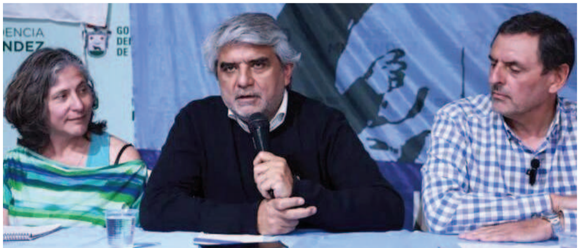
El ministro de Trabajo, Walter Correa.

boral, profesional, la ciencia y la innovación son pilares fundamentales para el progreso y el desarrollo de las y los bonaerenses que se capacitan y forman en nuestros centros