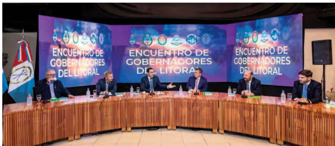
El encuentro de los gobernadores con anuncios de nueva región.

Luego, fue el turno de Passalacqua. "La lucha contra el puerto (de Buenos Aires) fue y sigue siendo durísima. Hay una difícil comprensión de lo que es el interior de nues-