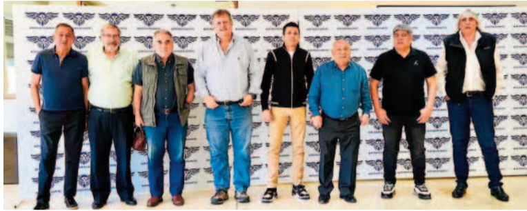
Los sindicatos resisten el anuncio del Gobierno.

El conflicto en Aerolíneas se agravó aún más luego del anuncio del vocero presidencial, Manuel Adorni, de que se iniciaron conversaciones con varias compañías latinoamericanas para que se hagan cargo de la aerolínea de bandera en caso de que los paros continúen afectando el servicio. En ese mismo momento, Biró y Brey estaban reunidos en la sede de aeronavegantes con dirigentes de las dos confederaciones sindicales del transporte, que están enfrentadas, para coordinar una estrategia común contra Javier Milei para “defender los derechos laborales que garantizan la no precarización de la actividad” y “rechazar cualquier regulación del derecho de huelga” en el sector. Allí se decidió crear una nueva estructura, la Mesa Nacional del Transporte, que la semana que viene podría lanzar un plan de lucha del sector contra el gobierno de Milei con medidas de fuerza que, según advirtieron, paralizarán los trenes, colectivos, camiones, aviones y barcos en todo el país. Además de Biró, Brey y Moyano, participaron del encuentro Omar Maturano (La Fraternidad), Mario Caligari (UTA), Omar Pérez (camioneros), Juan Carlos Schmid (Fempinra) y Raúl Durdos (SOMU). La importancia de este nucleamiento radica en que agrupa a dirigentes que integran la Confederación Argentina de Traba-