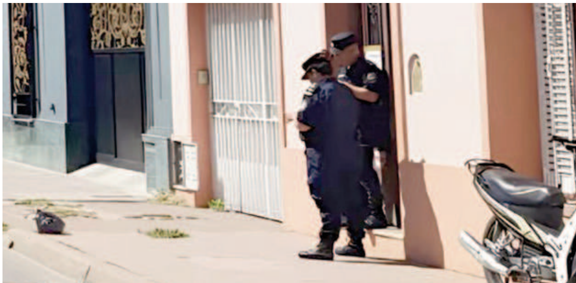
La mujer habría declarado que ambos habían consumido drogas alucinógenas provenientes de un hongo.