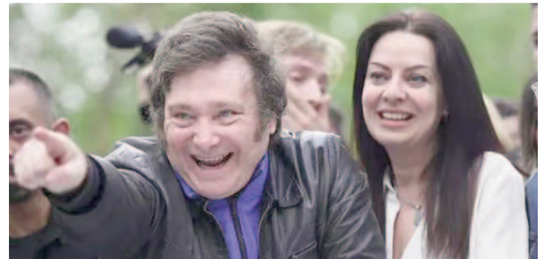
Pettovello rompió el silencio después de semanas difíciles.

"Pienso que si bajo los brazos, todo lo que hice hasta ahora no va a valer la pena. Me sirve el apoyo, es muy difícil seguir adelante", agradeció respecto a la concentración, y sumó: "No voy a dejar porque vine