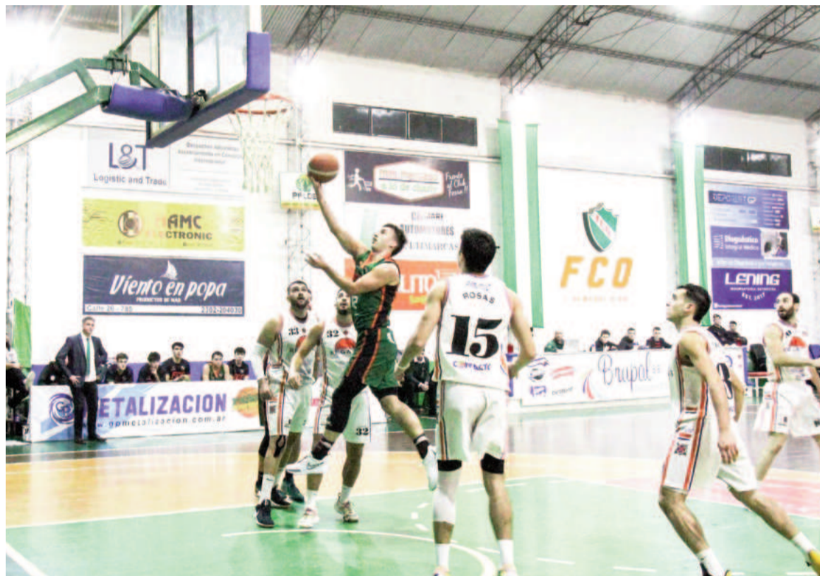
En Gral. Pico, Regatas jugó un partidazo y quedó match point en la serie.

Si Regatas vuelve a ganar hoy en la próxima instancia (la que en los hechos será semifinal por uno de los ascensos), tendría que en-