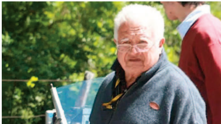
Gregorio Pérez Companc falleció este viernes a los 89 años.

En 1943, "Goyo" se había introducido en el mundo de los negocios de la mano de su hermano adoptivo, Carlos Pérez Companc, al fundar su primera empresa: la naviera homónima, de la cual se hizo cargo tras el fallecimiento de Carlos. En su momento, también asumió como titular del Banco Río de la Plata y de SADE S.A. Luego, el empresario fue diversificando ampliamente sus inversiones productivas y logró consolidarse como uno de los más influyentes del país a través del Grupo PeCom, del sector energético,