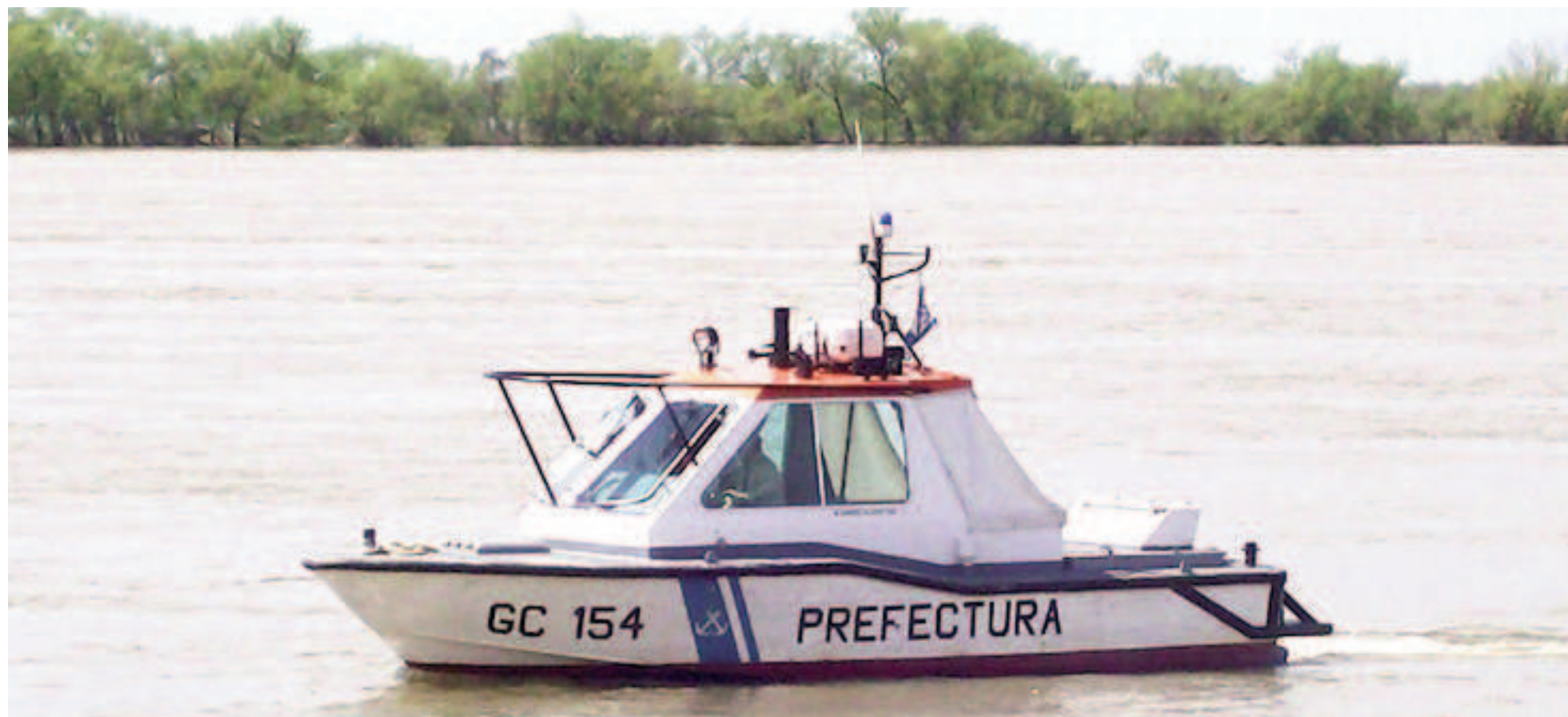
El Instituto Nacional del Agua pronostica para los próximos días alturas inferiores a las actuales, y adelantó que el nivel del río continuará bajando. EL NORTE