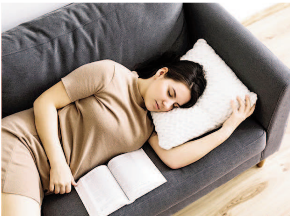
Los especialistas recomiendan tomar una siesta breve, entre la una y las cuatro de la tarde.