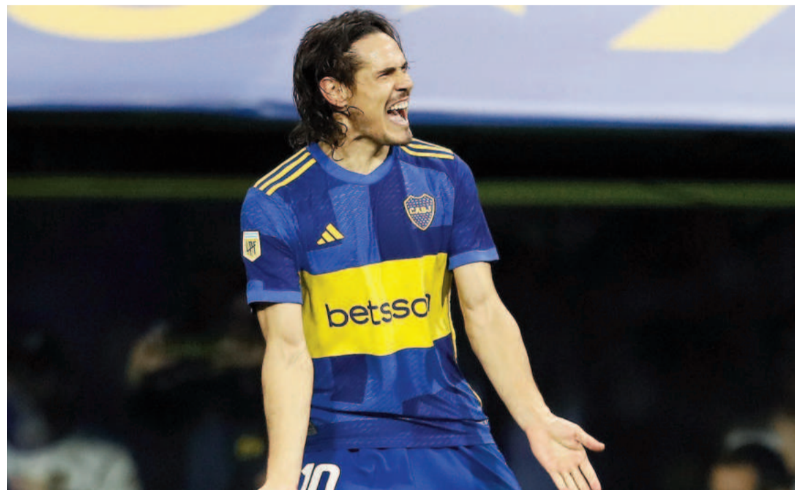
Edinson Cavani, luego expulsado, marcó el gol del triunfo en La Bombonera.

El Xeneize festejó por 1-0 con gol de Cavani en La Bombonera ante el Fortín, que padeció con dos lesiones sensibles en el fondo. En el cierre, vieron la roja el uruguayo y Ordóñez por una pelea.