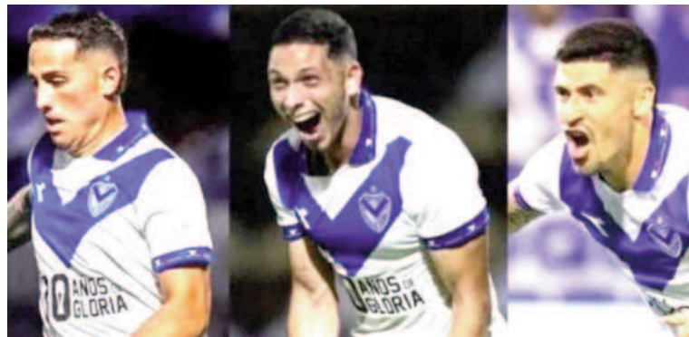
Los tres tienen, entre otras obligaciones, la de fijar un domicilio en la Argentina.

Liniers tomó la decisión de rescindirles el contrato a los tres jugadores im-