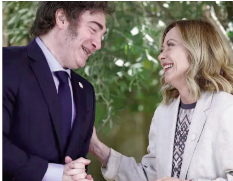
Javier Milei y Giorgia Meloni compartieron un encuentro distendido.

En el marco de la recepción de la Cumbre del Grupo de los 7, el mandatario mantuvo además charlas informales con el presidente de los Estados Unidos; con el de Francia, Emmanuel Macron; y con primer ministro de Japón, Fumio Kishida.