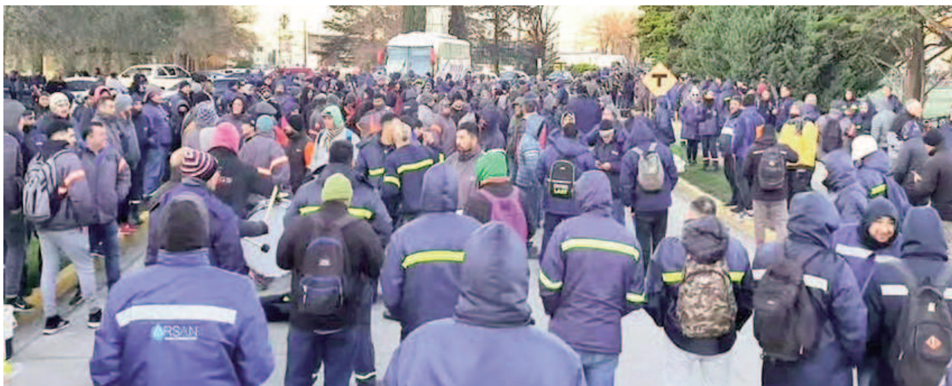
Por la falta de acuerdo salarial, los trabajadores de Acindar Villa Constitución volverían a instrumentar bloqueos al ingreso de la planta.

Tras el fracaso de la negociación que mantuvieron el jueves con empresarios por actualización salarial para la rama 21, la seccional villense del gremio metalúrgico avanzaría con bloqueos al ingreso de camiones a la planta. El parate por tres semanas de la producción que estaba previsto iniciarse el lunes próximo se movió para el 1º de julio.