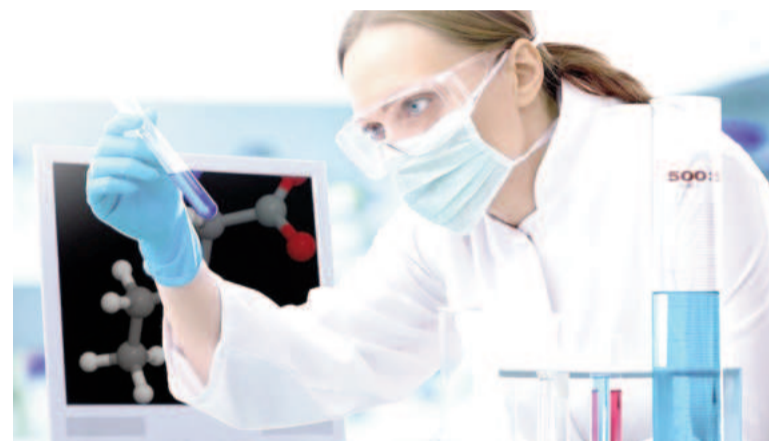
FABA promueve el desarrollo del ejercicio profesional de los bioquímicos bonaerenses. ILUSTRACIÓN

Equidad: en la Federación todos los profesionales reciben igualdad