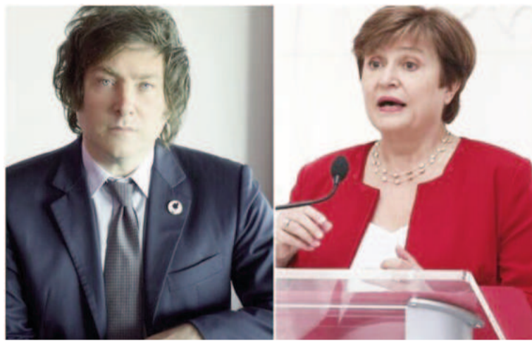
Javier Milei y Kristalina Georgieva mantuvieron una reunión bilateral.

Asimismo, Gopinath pidió modificar la política cambiaria. "La política cambiaria también debería volverse más flexible