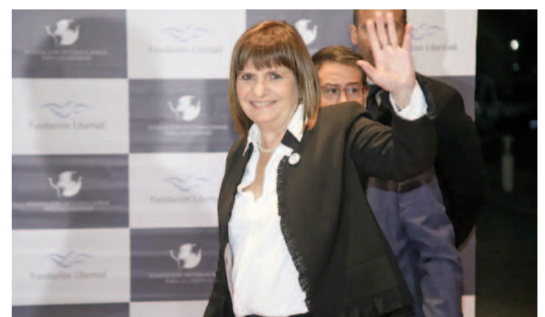
Patricia Bullrich viaja a la República de El Salvador.

Con foco en la seguridad pública, principalmente en la ciudad de Rosario (Santa Fe), la ministra Bullrich está interesada en toda la estructura que permitió bajar drásticamente el delito en El Salvador que hasta hace no mucho tiempo fue un país dominado por la violencia de las maras. De ser el país más violento del mundo y tener 145 homicidios cada 100.000 habitantes, pasó a tener 2 cada 100.000, según estadísticas que difundió el Ministerio.