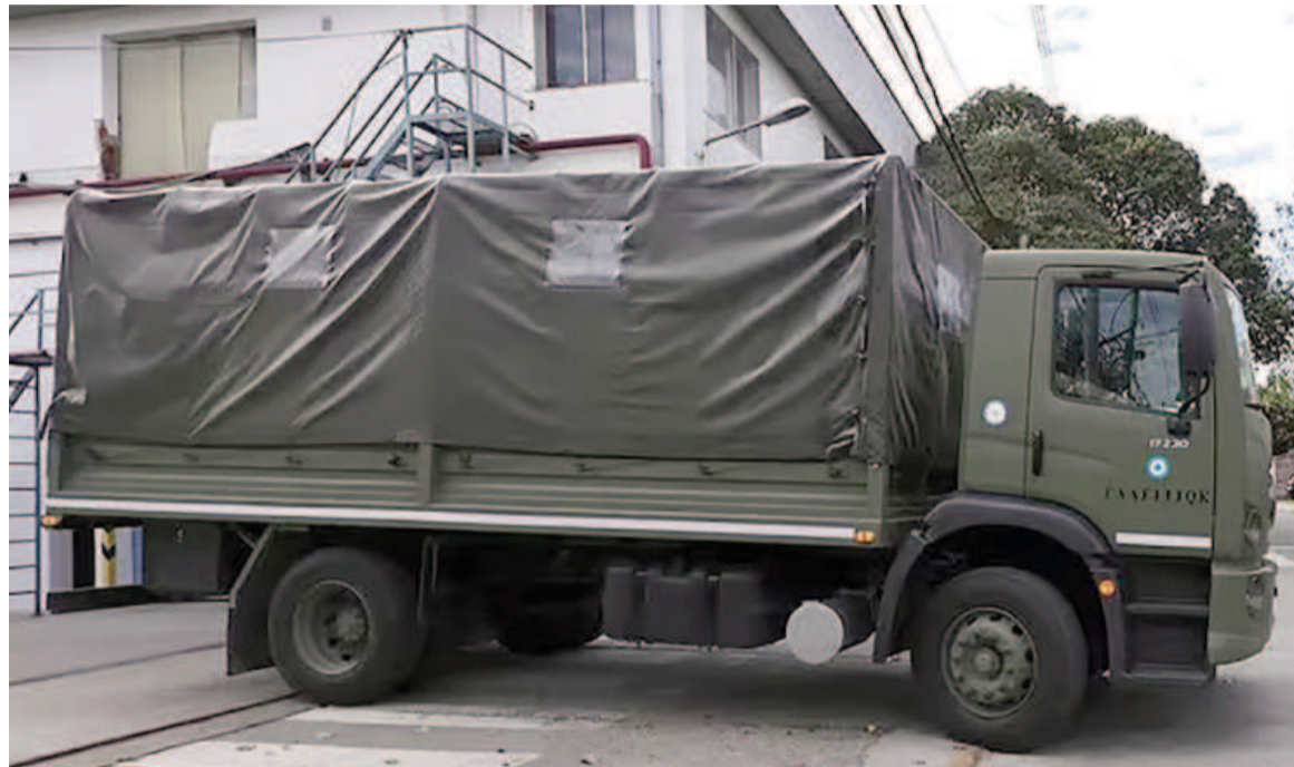
Uno de los camiones del Ejército se retira del depósito de Villa Martelli para iniciar la distribución.

“La entrega de la mercadería tendrá una duración de dos semanas, teniendo en cuenta las fechas de vencimiento de los productos. Para garantizar una logística rápida, eficiente y sin intermediarios, el operativo contará con la colaboración del Ejército Argentino y el Mi-