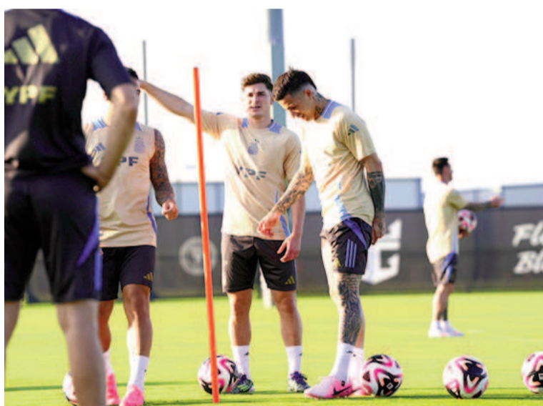
La Selección ya trabaja con plantel completo en el predio del Inter de Miami.

Si bien los focos apuntan a Martínez Quarta para ser parte de la lista definitiva por su experiencia en la Selección, ya que fue convocado por Scaloni con bastante frecuencia en el ciclo, la realidad indica que en los