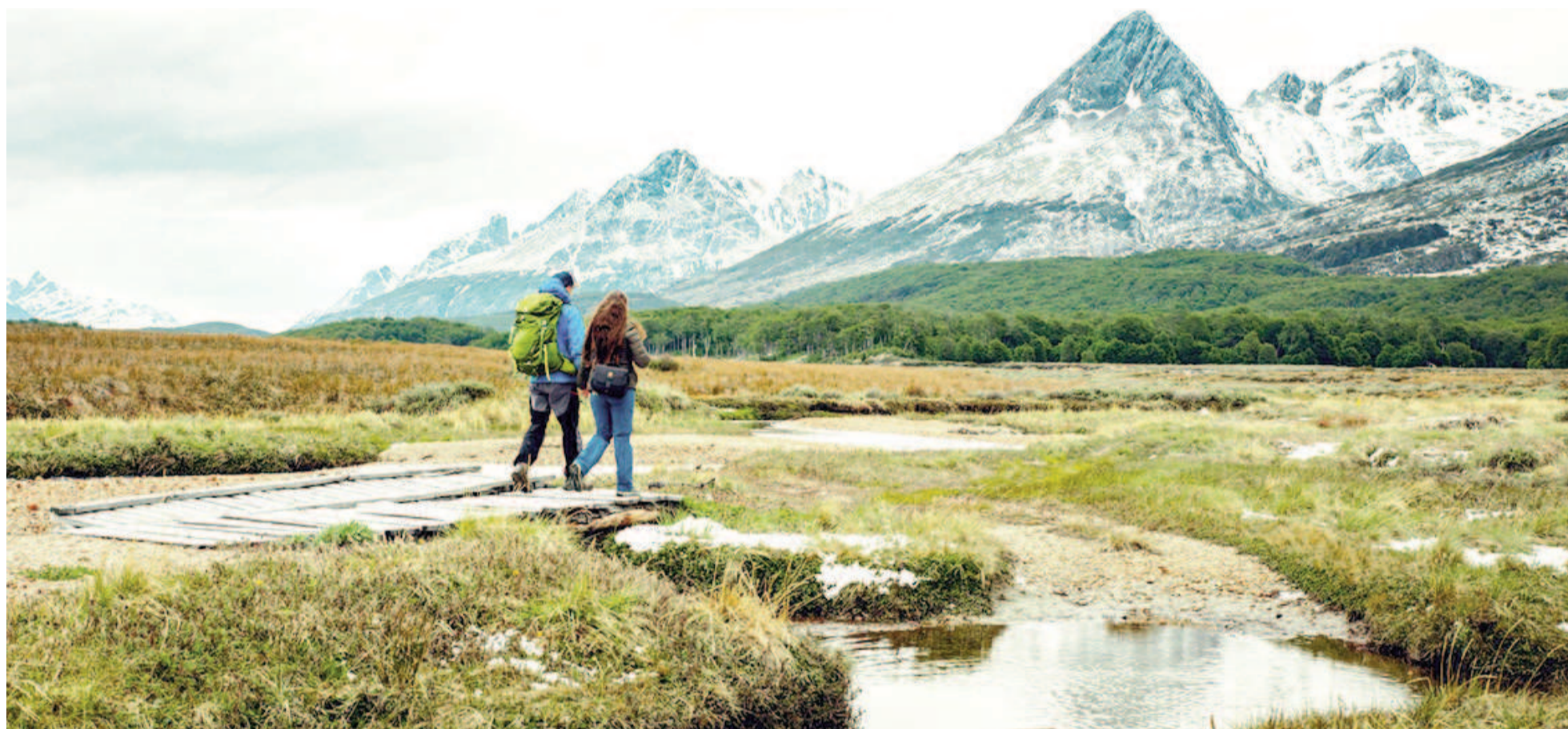
El trekking del "Fin del mundo" ofrece un recorrido de 9 kilómetros ida y vuelta, con un nivel de exigencia física medio.

Para los amantes de la aventura, el país ofrece impresionantes lugares para hacer senderismo y disfrutar de la naturaleza. Desde la imponente presencia del Cerro Aconcagua en Mendoza, el techo de América, hasta los desafiantes senderos que serpentean alrededor del majestuoso Fitz Roy en El Chaltén, cada paso invita a una conexión profunda con la naturaleza.