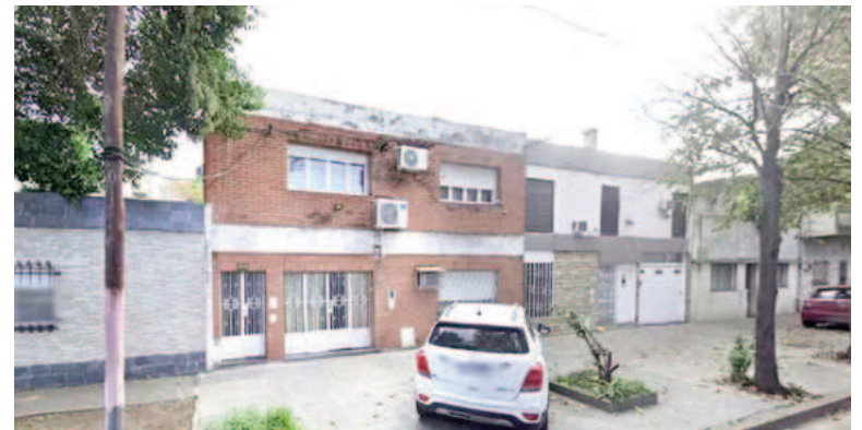
La cuadra donde ocurrió el ataque a tiros.