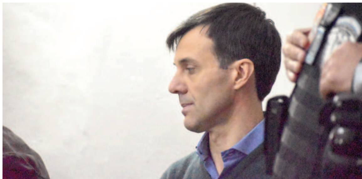
Restan aún más de 80 testimonios, entre ellos, todos los propuestos por la defensa.