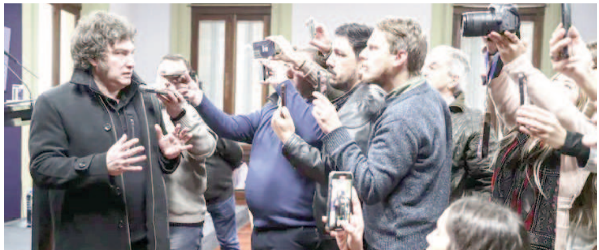
Javier Milei saludó a la prensa en Casa Rosada pretendiendo mostrarse en acción.

bramiento del asesor Federico Sturzenegger, Milei respondió que se está «definiendo» cuál será su cargo. «Porque es como estamos definiendo la próxima reforma del Estado», argumentó.