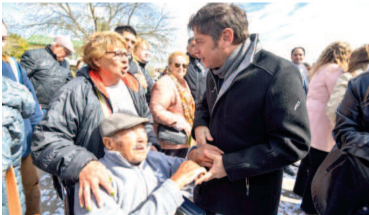
El gobernador denunció un "plan sistemático de asfixia económica".

En concreto, los montos reclamados corresponden a "compensación por el déficit del régimen jubilatorio de la provincia de Buenos Aires no transferido al Estado Nacional", a valores actualizados.