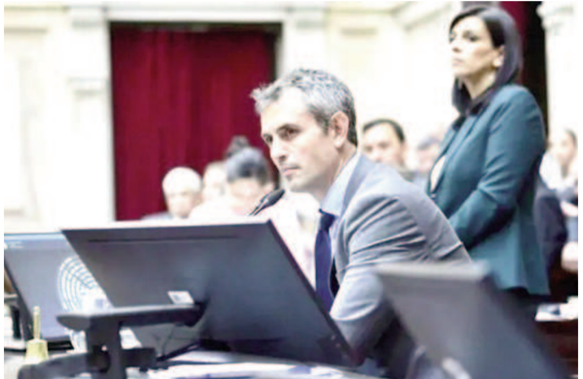
Martín Menem, presidente de la Cámara de Diputados de la Nación, quien firma los incrementos de las dietas.

En la actualidad los diputados cobran un promedio de un millón trescientos mil pesos-sin contabilizar algunos ítem como el desarraigo de 300 mil pesos que perciben los legisladores del interior del país-y con