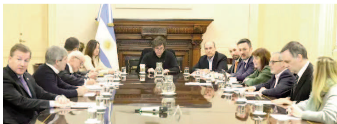
La foto oficial de la reunión de gabinete, encabezada por el presidente Javier Milei.

Mientras el mandatario se encontraba en ese viaje diplomático, estalló