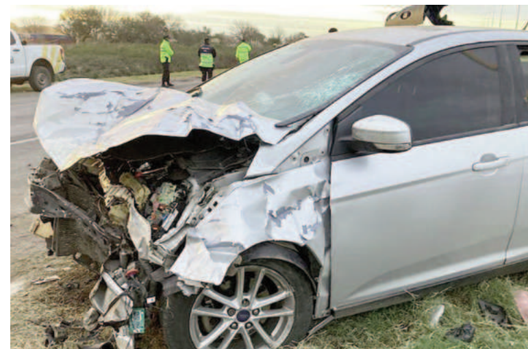
Uno de los autos involucrados en el choque en cadena.

Un siniestro vial ocurrió en la autopista Rosario-Santa Fe, mano a Rosario, aproximadamente a las cuatro y media de la tarde. El accidente involucró tres vehículos y causó heridas leves a los ocupantes, quienes fueron trasladados a diferentes centros de salud. Afortunadamente, no hay heridos de gravedad.