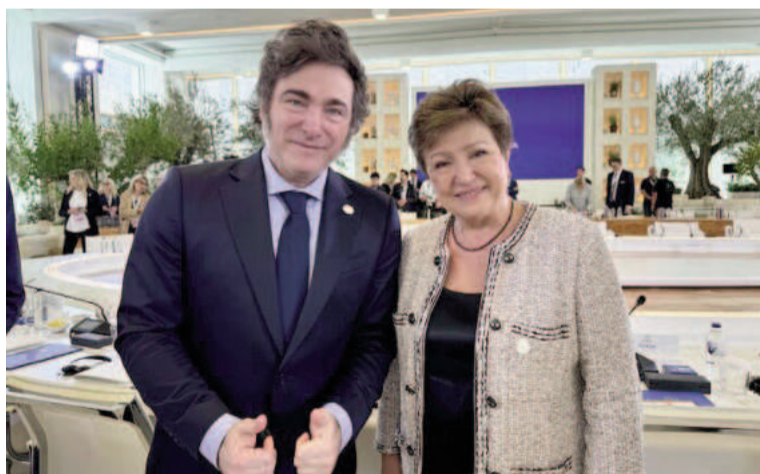
El presidente Milei con Georgieva, directora gerente del FMI.

«La firme implementación del plan de estabilización (basado en una fuerte ancla fiscal sin nuevo crédito neto al gobierno y correcciones de precios relativos) ha llevado a impresionantes compras de divisas por parte del banco central, los primeros superávits fiscales mensuales consecutivos en casi dos décadas, notablemente menores. Brechas cambiarias y diferenciales soberanos cayendo a mínimos de varios años», le reconoció el FMI al Gobierno en el staff report publicado ayer lunes.