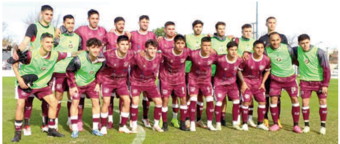
Defensores se mantuvo como único líder con su empate en Lincoln.

En el complemento, comenzó mejor El Linqueño, que dispuso de dos chances concretas a los 5' y a los 19', por intermedio de Actis y Arriola. La pelota era del dueño de casa, mientras que a Defensores le costaba generar juego; ya incómodo y resistiendo ante el ímpetu de su adversario. Fue así que a los 22', luego de varios