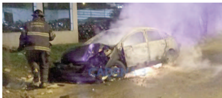
El vehículo se encontraba en la puerta de la dependencia.

Los primeros indicios señalan que el foco se habría producido de manera intencional.