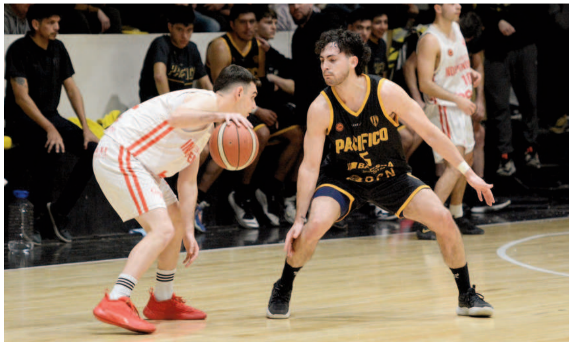
Pacífico de Neuquén e Independiente de Pico protagonizaron una reñida serie en octavos de final.

El Náutico se metió entre los ocho mejores del torneo tras haber eliminado a Ferro de General Pico. Y quedó a dos pasos de lograr el ascenso. Ahora tendrá que medirse en un cruce al mejor de tres choques con Pacífico de Neuquén.