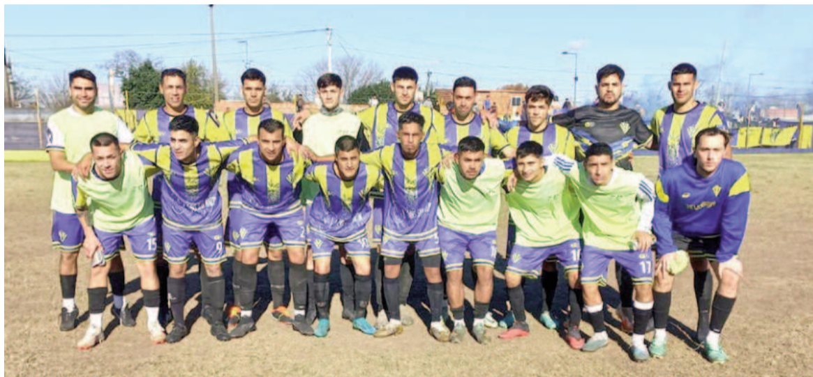
Doce empató ante Regatas y sigue con firmes chances de clasificar.