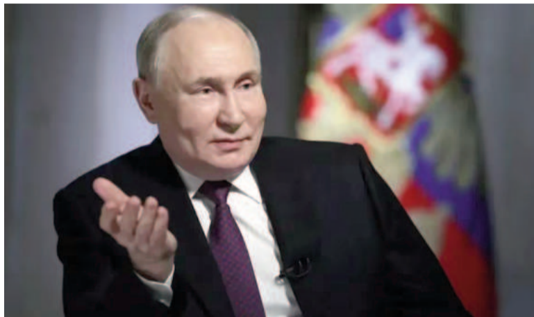
Crítica de Putin al gobierno argentino por su apoyo a Ucrania.

Recientemente, el presidente Javier Milei apoyó a Volodimir Zelenski durante su presentación en la Cumbre de la Paz, en Suiza. A raíz de ello, el gobierno de Rusia cuestionó la decisión del mandatario argentino y alertó sobre el posible envío de armamentos en ayuda a Kiev. De esa manera, la gestión de Vladimir Putin lo calificó como “acto hostil”.