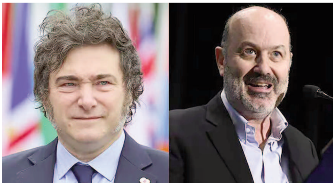
El presidente Javier Milei se reunirá con el "todo terreno" Federico Sturzenegger.

De ese modo, Francos, recientemente ascendido a ese puesto, se quedaría con el diálogo con los ministros y con las provincias, mientras que las siguientes áreas pasarían a la cartera de Sturzenegger, ex presidente del BCRA en la gestión de Mauricio Macri, según el organigrama actual de la Jefatura de Gabinete: Secretaría de Transformación del Estado y Función Pública Subsecretaría de Transformación y Re-