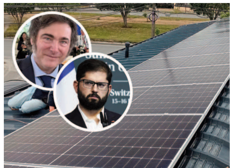
Disputa entre Boric y Milei por la colocación de unos paneles solares.

La embajada argentina en Chile envió una nota formal al gobierno chileno en la que reconoce el error y asume el compromiso de retirar los paneles que nutren de energía al destacamento de Tierra del Fuego “de manera inmediata cuando las condiciones meteorológicas