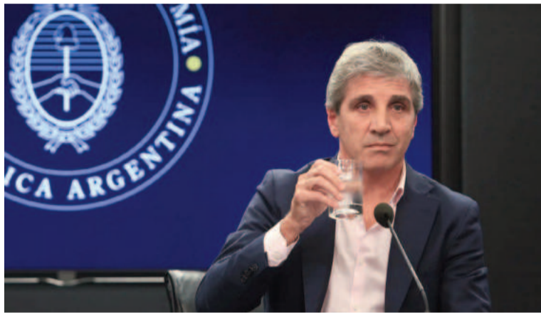
El ministro de Finanzas argentino, Luis Caputo, modificará la tasa de interés.

Para la consultora Vectorial, la nueva política económica que define el Gobierno «es consecuente con la receta exigida por el FMI» y llega