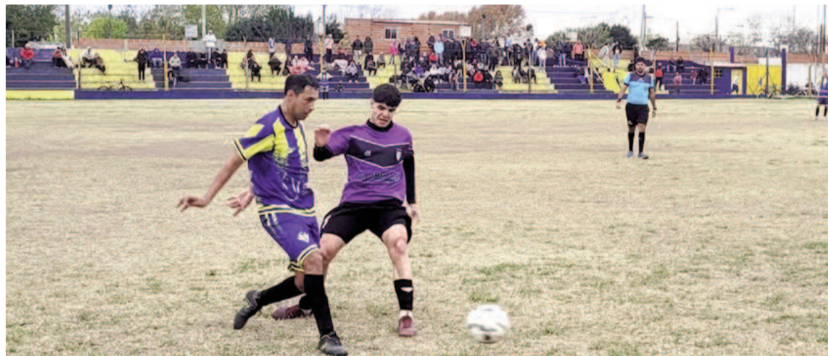
El Fortín acertó una vez y se llevó un triunfo ante Doce como visitante.