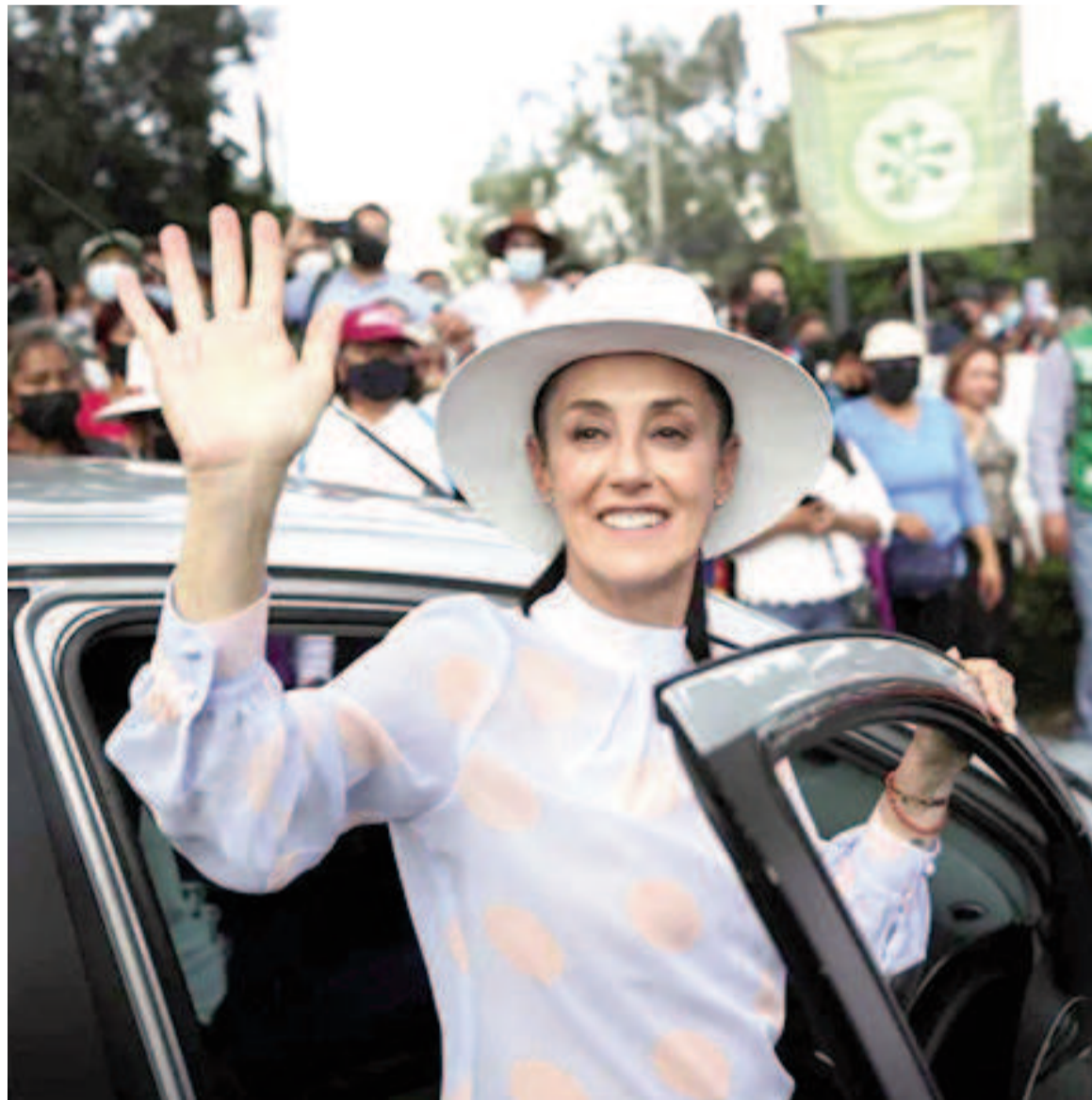
Claudia Sheinbaum se convirtió en la primera presidenta mexicana de la historia.