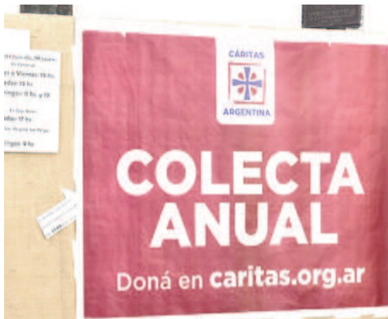
Desde Cáritas remarcaron que el 8 y 9 son el fuerte, aunque la colecta se extenderá durante todo el mes.

Desde la entidad remarcaron que el 8 y 9 de junio es el fuerte de la colecta porque participan todas las Cáritas de la diócesis; aunque acla-