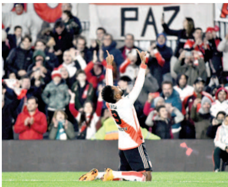
El conjunto de Núñez fue superior y ganó de la mano del colombiano Borja.