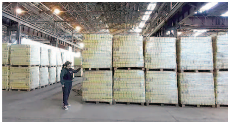
La Gendarmería en el depósito de Capital Humano en Tafí Viejo.

La Gendarmería Nacional realizó este sábado en Tafí Viejo un inventario de la mercadería que el Ministerio de Capital Humano tiene en un depósito que administra y que se encuentra en una nave de los Talleres Ferroviarios, de 22 hectáreas, cuya entrada se encuentra por avenida Independencia y Osvaldo Costello. El allanamiento se produjo en el marco de una denuncia contra la ministra Sandra Pettovello por incumplimiento de los deberes de funcionario público, debido a que los alimentos no estaban siendo distribuidos y se encuentran inmovilizados desde diciembre del año pasado, con riesgo de vencimiento.