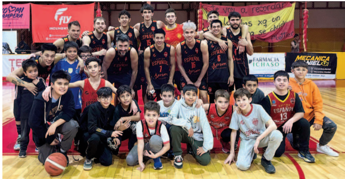
Centro Español de Plottier podría ser rival de Regatas en la próxima ronda.

natorias en comenzar serán las que enfrenten a participantes de la Sur con los del Sudeste y a los de la Metropolitana con la Litoral. Mañana empezarán las que crucen a los del Norte con la Centro-Oeste y a los de la Centro con la Metropolitana (por esta zona los últimos clasificados fueron Presidente Derqui y Sportivo Escobar por intermedio de los repechajes). Por las conferencias Sur-Sudeste a las 21.00 jugarán Ferro de General Pico vs. Centro Español de Plottier y Colón de Chivilcoy vs. Pacífico de Neuquén, mientras que a las 21.30 lo harán Del Progreso de General Roca vs. Independiente de General Pico.