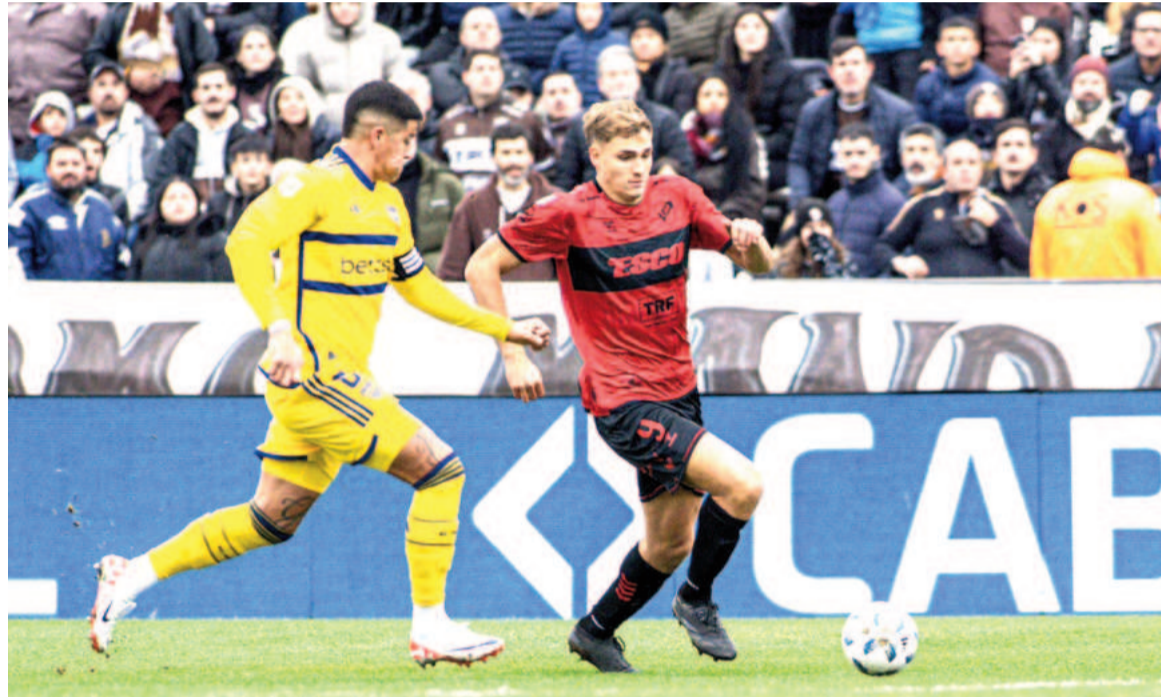
El Xeneize se fue de Vicente López con las manos vacías. NA

El partido comenzó con ambos equipos teniendo ocasiones claras antes de los 10 minutos, pero a medida que fue avanzando el trámite, éste fue perdiendo intensidad y prácticamente no hubo más llegadas.