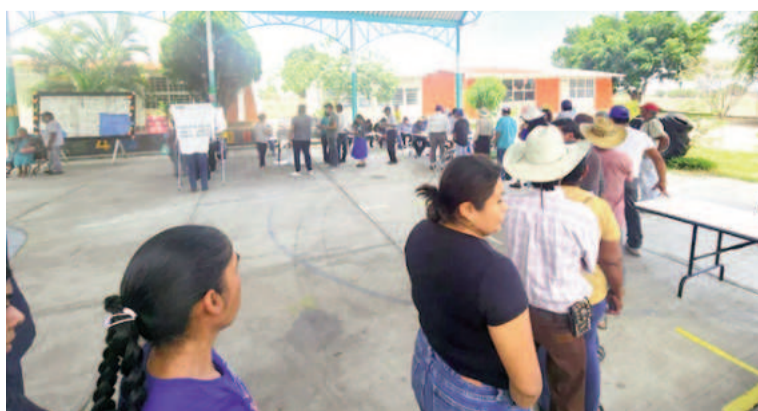
Casilla electoral en el municipio de Tlapanalá.