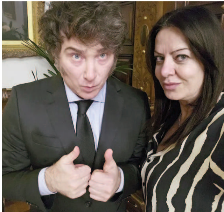
El presidente Javier Milei y la ministra de Capital Humano, Sandra Pettovello.

“¿Qué va a esperar usted de un kirchnerista? Lo lógico es que la traten de operar, que la ensucien por los medios, que le inventen cosas, que digan barbaridades sobre ella para tratar de desprestigiar. En lugar de decir ‘es falso lo que está diciendo’, no. La tratan de ensuciar, le tratan de hacer trampa, para que ella y su equipo se intimiden”, agregó.