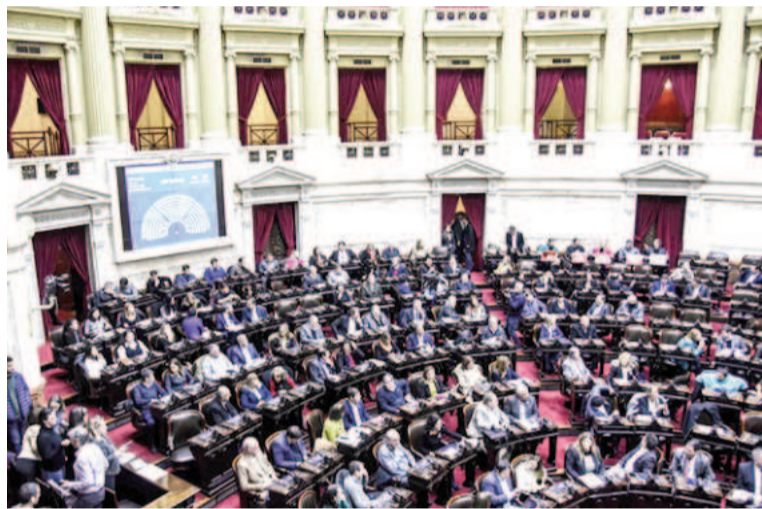
Diputados de la Nación vuelve a la actividad con la movilidad jubilatoria en la mira.

En la balanza tendrán que medir la presión que están ejerciendo los gremios universitarios docentes que anunciaron para el martes y