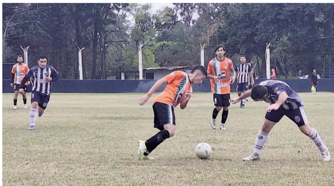
El conjunto del Barrio rescató un punto ante el Tucura y sigue en la pelea.