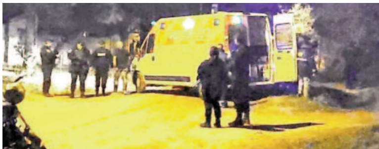
El crimen ocurrió este sábado en la localidad santafesina.

Una mujer de 62 años fue asesinada este sábado por la noche en el frente de su casa de Venado Tuerto. El crimen se habría originado en el marco de una discusión