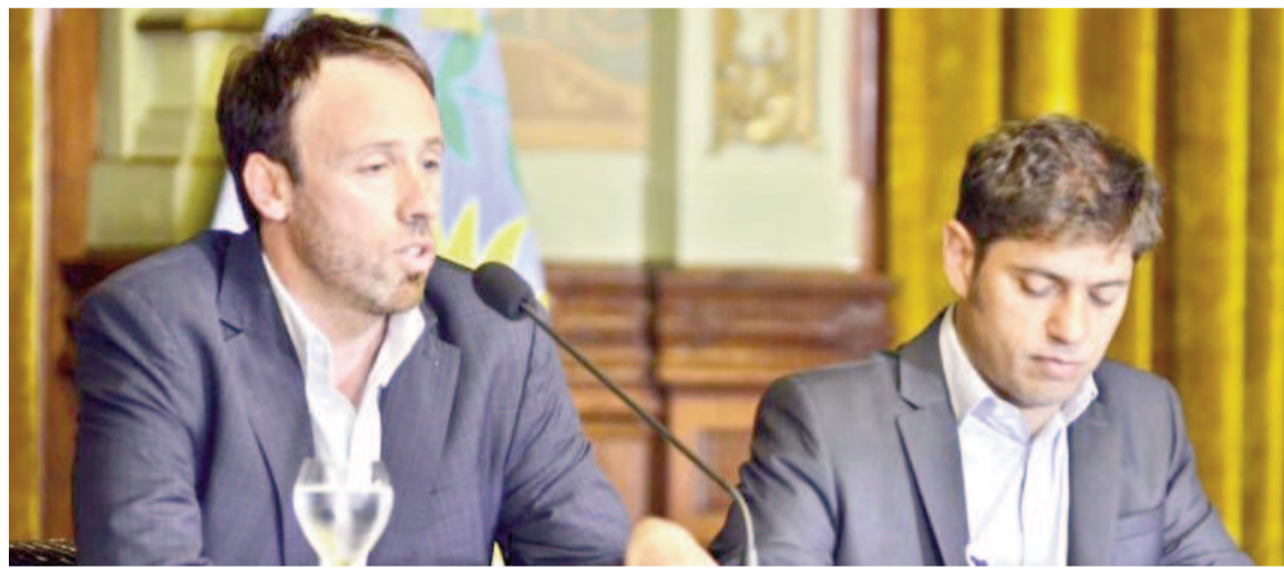
El ministro de Economía Juan Pablo López junto al gobernador bonaerense Axel Kicillof.

«En la construcción, la situación es aún peor que en la industria. En marzo, se contrajo más de 40 puntos. El insumo que presenta mayor deterioro es el asfalto (-70%), emblema de la obra pública. La responsabilidad del Estado Nacional en la recesión