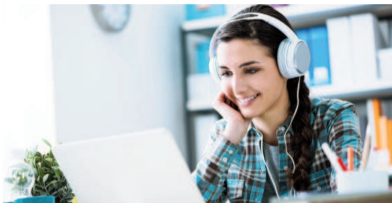
Investigadores exploran el vínculo entre la música y la productividad cognitiva.

Entre otros puntos, la ley de Yerkes-Dodson postula una relación entre el rendimiento y la excitación, representada por una curva en forma de U invertida. En términos más sencillos, sugiere que un nivel moderado de excitación conduce a un rendimiento óptimo, mientras que tanto la baja como la alta excitación pueden deteriorar el desempeño. El equipo de investigación buscaba verificar esta teoría mientras sonaban canciones.