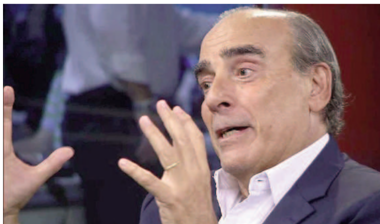
Francos negó que Milei busque derogar la Constitución.

“Ha sido un error enorme del Senado, una falta de sensibilidad al estado de ánimo colectivo”, indicó el funcionario. “Uno siente una decepción de que no se comprenda el momento, más allá de entender el re-