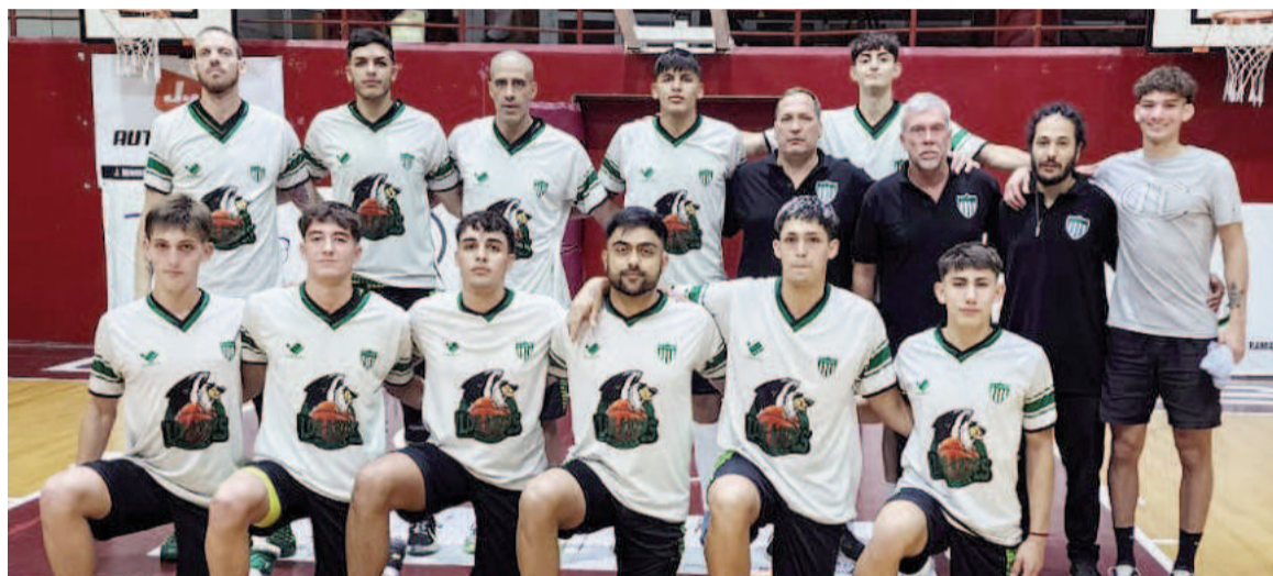
Los Andes festejó en el "Luis María Giordano".