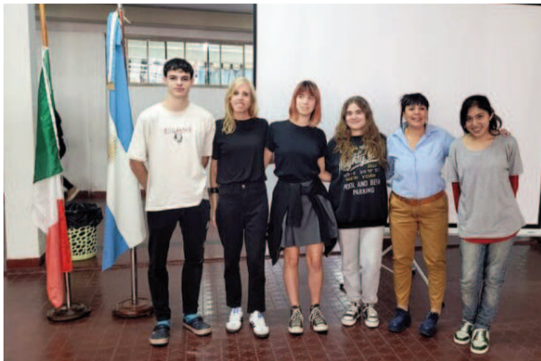
Alumnos de Ramallo participaron en concurso literario.

En noviembre del año pasado se incentivó a alumnos para participar en Italia del X Premio Internazionale Letterario e d'Arte "Nuovi Occhi Sul Mugello" (Poesía/Prosa/Arte Figurativa) en Florencia, Italia. Como cada año se recibieron las bases por mail del concurso, pero este de 2024 tenía la particularidad de que no solo participarían adultos, sino escuelas, en una de las secciones destinada a menores de 18 años.