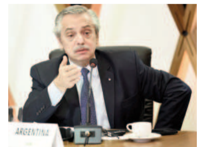
Alberto Fernández apoyó la marcha.

En su publicación recopiló una serie de imágenes donde se ven testimonios de autoridades, trabajadores y estudiantes universitarios que cuentan la situación que están viviendo las instituciones y el peligro de que cierren. Además, eligió fragmentos del presidente Javier Milei en contraposición a discursos propios durante su presidencia, donde destaca, por ejemplo, a los cinco argentinos ganadores del Premio Nobel egresados de universidades públicas. En la publicación, Alberto Fernández reafirma su postura con una frase concreta: “Todos juntos en defensa de las universidades públicas”. Al