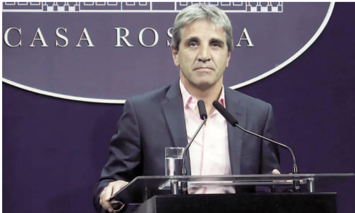
Luis Caputo cuestionó el reclamo de las universidades nacionales por el recorte de presupuesto.

Ante esto, Caputo le respondió por el mismo medio: “Lacha querido, la política es un negocio para muchos, no un servicio público”. Y apuntando contra el reclamo uni-