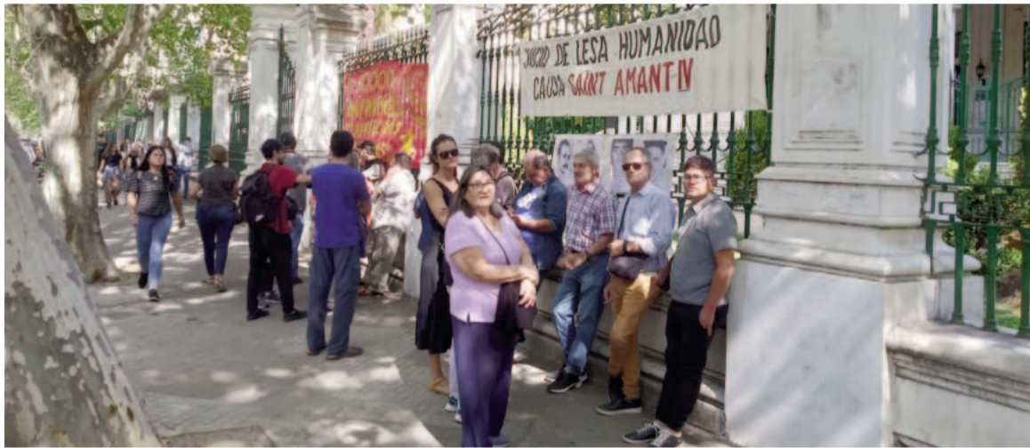
El juicio se desarrolla en las instalaciones de Oroño al 900, de Rosario.