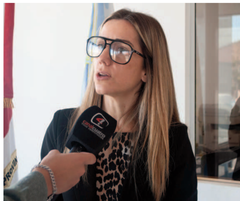
Borgatta explicó los motivos por los que se presentó el proyecto.

Para reseña histórica de la importancia y el valor histórico y arquitectónico del inmueble donde funciona la Aduana, se han tomado como fuentes para citar en el expediente presentado al historiador San-