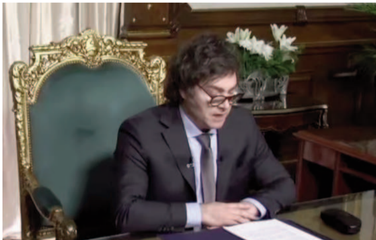
El presidente volverá a realizar una cadena nacional ahora por el superávit comercial.

El presidente ya había anticipado la decisión de encabezar