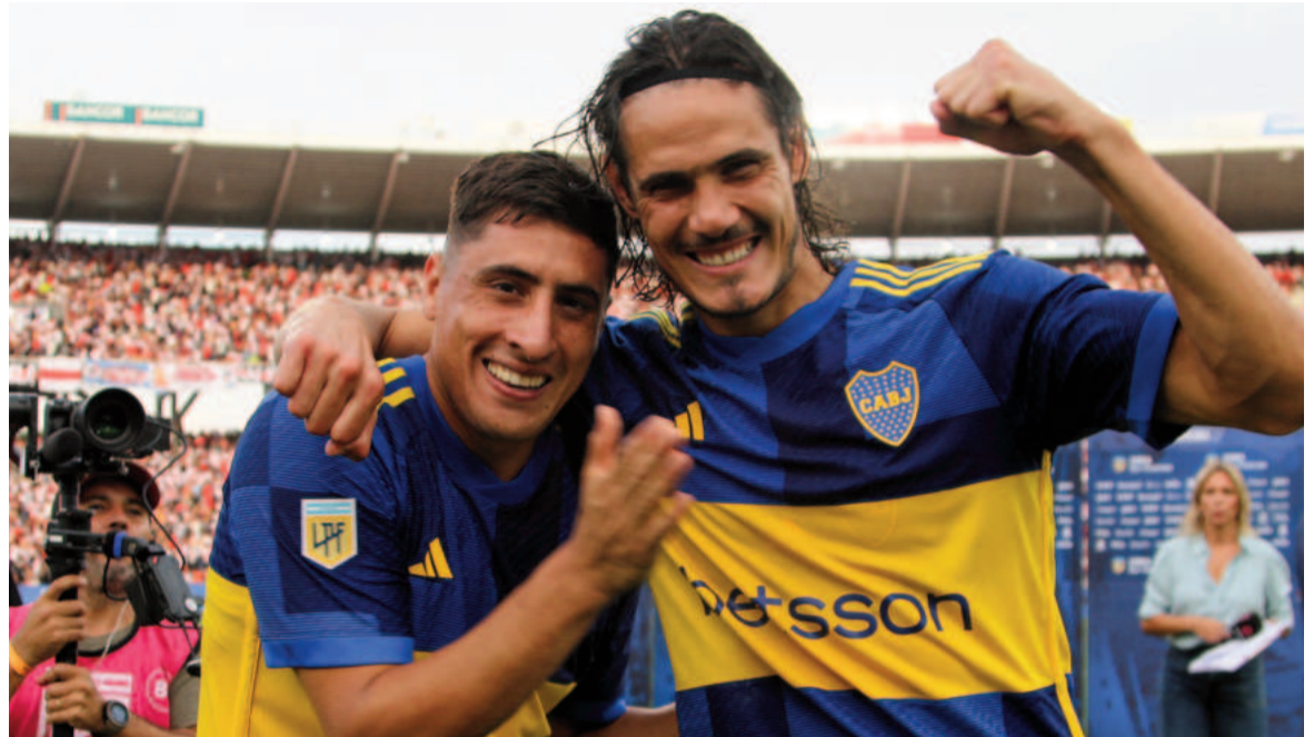
El conjunto de La Ribera fue más en el segundo tiempo y en semifinales se medirá frente a Estudiantes. NA

Con el correr de los minutos, el Millonario perdió la intensidad que lo caracterizó en el trámite del encuentro y Boca sacó provecho de ello para