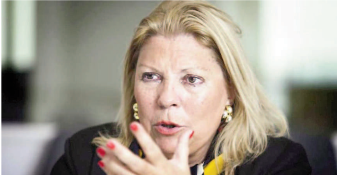
Carrió definió a Milei como “un gran actor de la escena nacional”.

Cámara de Diputados, había ganado con el 52% la Capital, mayor elección histórica, cuando se va (Mauricio) Macri y decido irme, porque me cuenta de que yo me había controlado, viste que me gritaban de todo, y yo me callaba, además me divertía, me tiraban cosas, La Cámpora, y yo los saludaba. Pero hubo un momento en que yo dije “estúpida”, en voz baja, a unas diputadas, porque no votaron una ley contra el hambre, que era la de los bancos. Y cuando