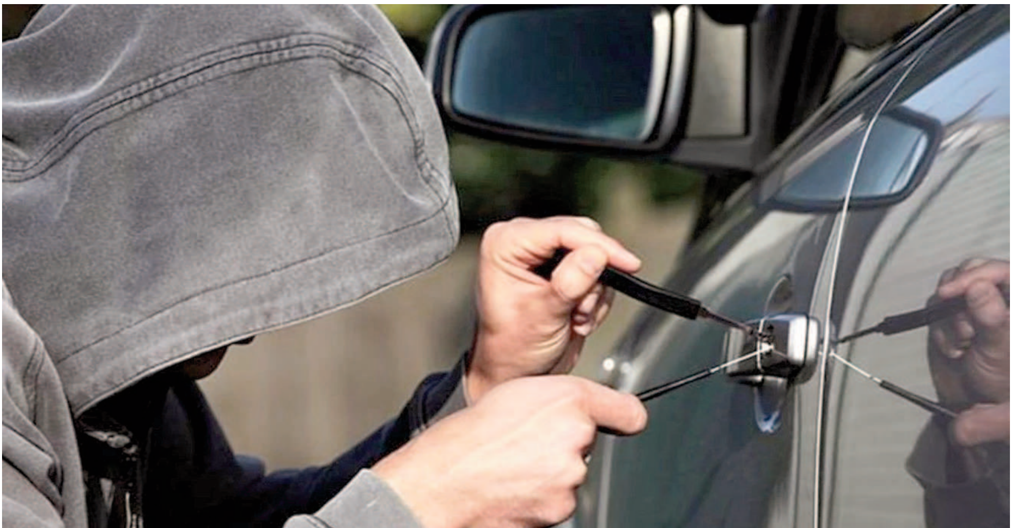
En San Nicolás crecieron los hallazgos de autos o motos que fueron hurtados en otras ciudades. ILUSTRACIÓN

A nivel nacional, se estimó que el robo de vehículos creció con respecto al año 2023. En San Nicolás, se registraron once autos robados en tres meses. No obstante, sí creció el hallazgo de vehículos provenientes de otras ciudades. La policía insiste con los operativos de saturación preventivos para evitar el delito.