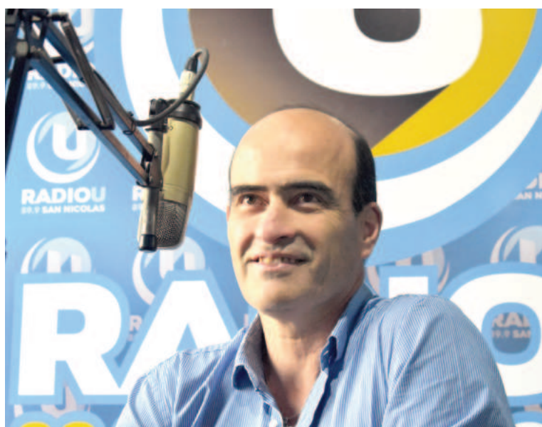
Ponce anticipó que el evento representa “una excelente oportunidad para el intercambio de conocimientos y experiencias en el campo de la Ingeniería”.

y el sector productivo es esencial para facilitar la transferencia de conocimiento y la colaboración en proyectos innovadores”, destacó.