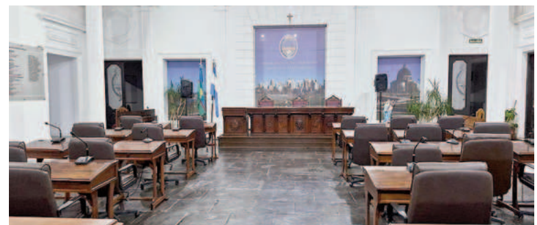
En un año, el aumento de sueldo de los ediles nicoleños fue del 198,74%.

cobran años de antigüedad, suficientes para superar sin problemas la barrera del millón de pesos. Vayamos a municipios más lejanos. El año pasado, los concejales de Bahía Blanca ya percibían un millón de pesos. Por esas épocas, era literalmente un sueldo inexistente e impensado para cualquier trabajador. “Hoy los ediles de Bahía Blanca cobran por encima de los dos millones de pesos, es una locura”, manifestó un colega de dicha localidad.