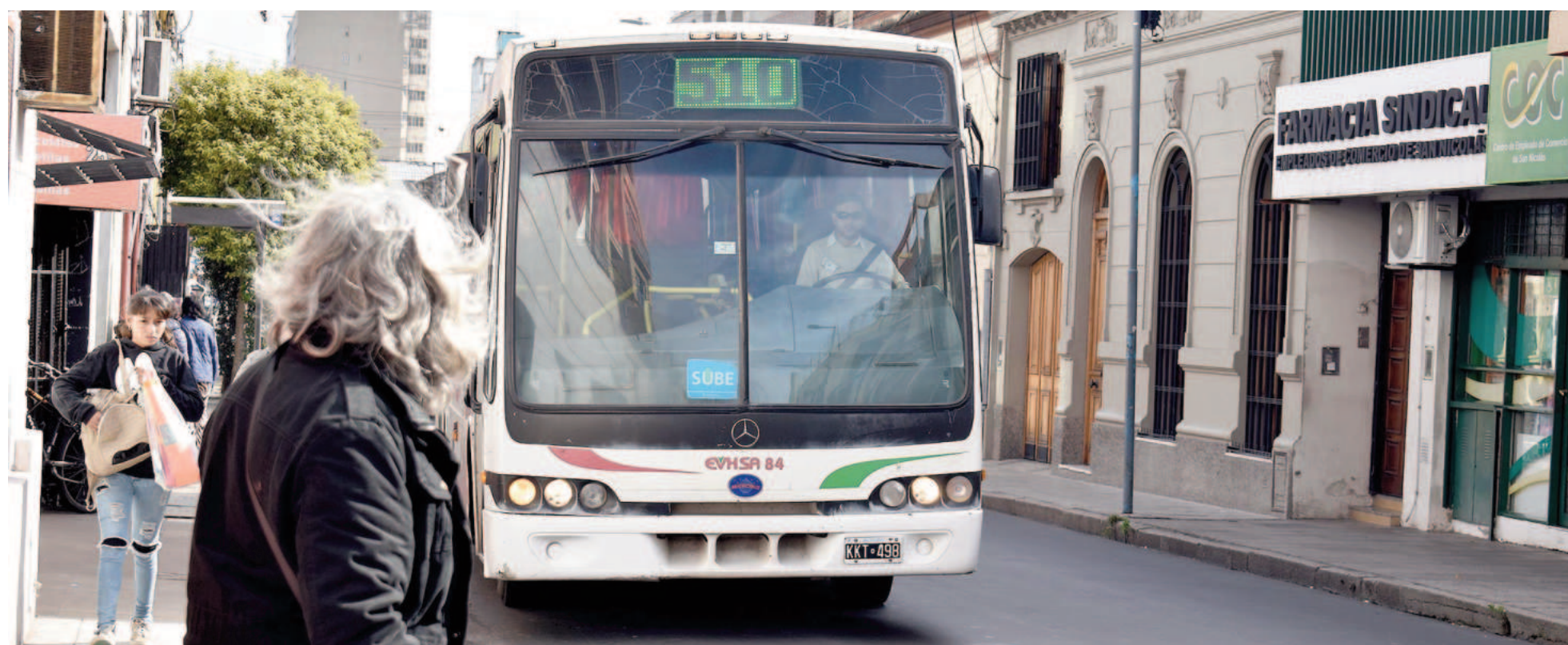
El Indec dará a difusión el jueves el IPC de mayo, fijando el próximo porcentual de incremento para el transporte público local.

El pasaje de colectivo, que hoy tiene un valor de $772, quedó sujeto a actualizaciones por IPC. Cuando todavía restan los ajustes del 11,3% y del 8,8% correspondientes a la inflación registrada en marzo y en abril, el próximo jueves el Indec informará el IPC de mayo, lo que implicará un nuevo porcentual de incremento.