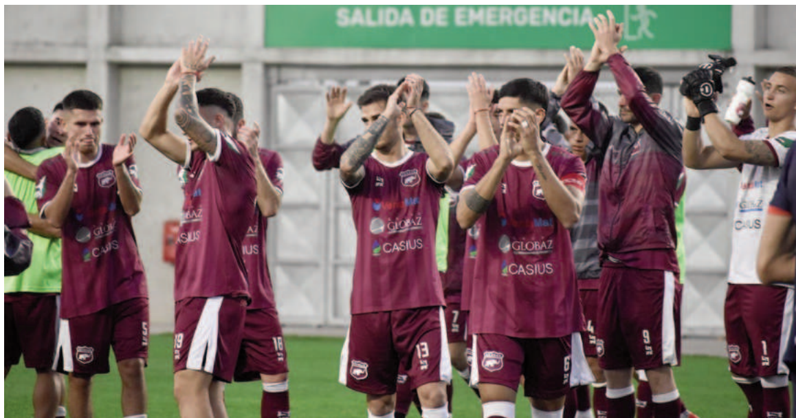
El granate fue mucho más y obtuvo un cómodo triunfo para seguir arriba en su grupo.