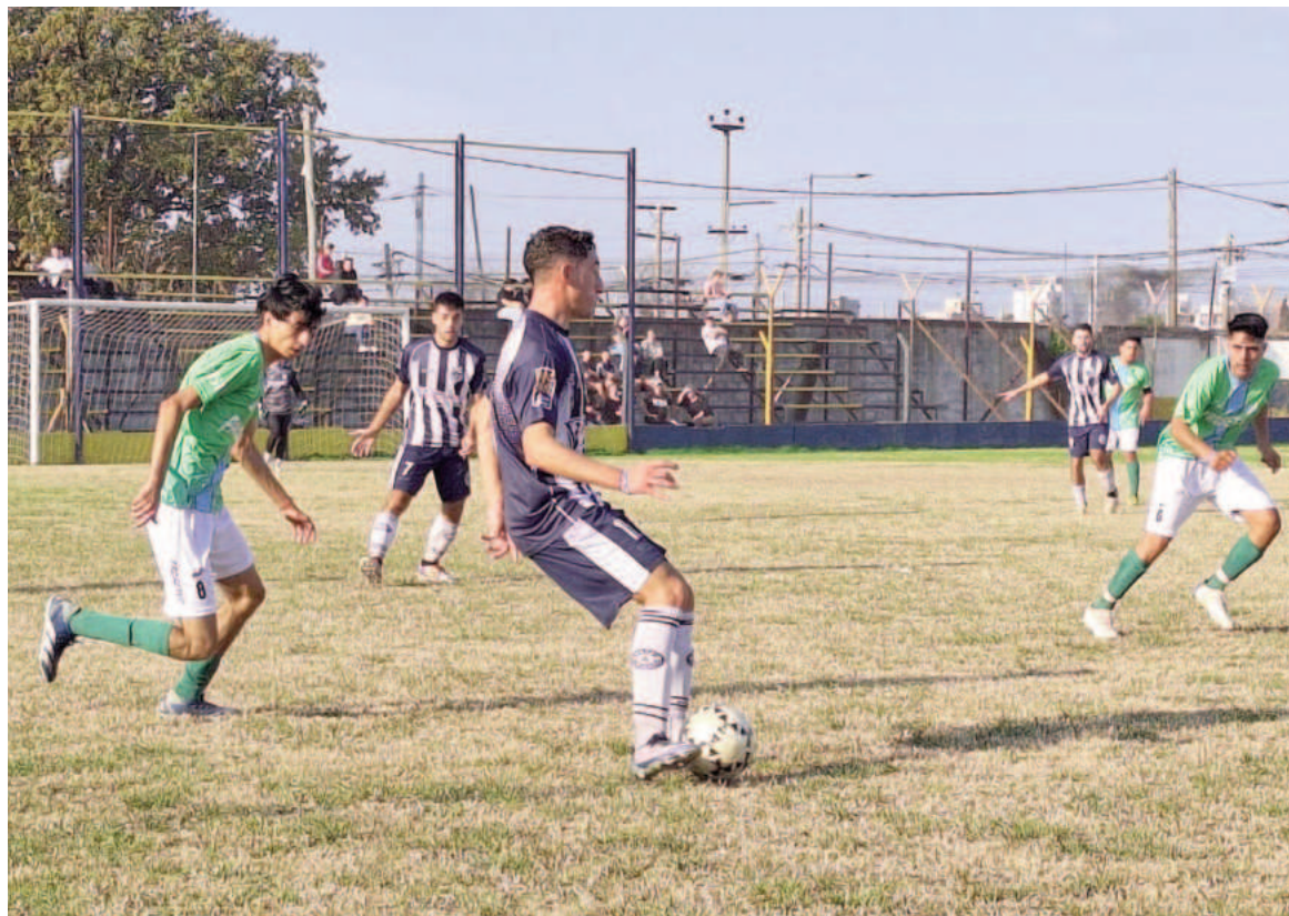
Somisa obtuvo un triunfo clave en cancha de Doce fortaleciendo sus chances.