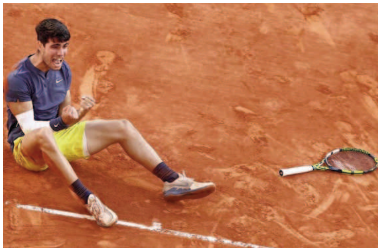
La emoción de Alcaraz en Roland Garros. El español está haciendo historia.

Alcaraz une así su nombre a los de mitos del tenis español como el propio Nadal (récord de 14 títulos), Arantxa Sánchez Vicario (3) o Manuel