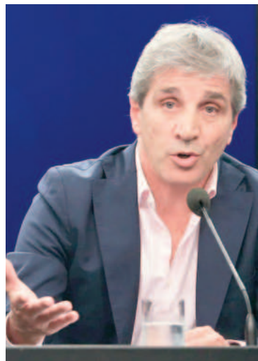
El ministro de Economía de Argentina, Luis Caputo.

"También dije que iba a ser de corto plazo. Y dijeron, no, 'se van a enamorar'. Una vez que en Argentina ponen un impuesto, no lo sacan más. Va a ser como el impuesto al cheque. Bueno, ya lo anunció el presidente el otro día. Se aprueba la ley y vamos a retrotraer esa suba de impuestos. La vamos a bajar del 17,5 al 7,5 por