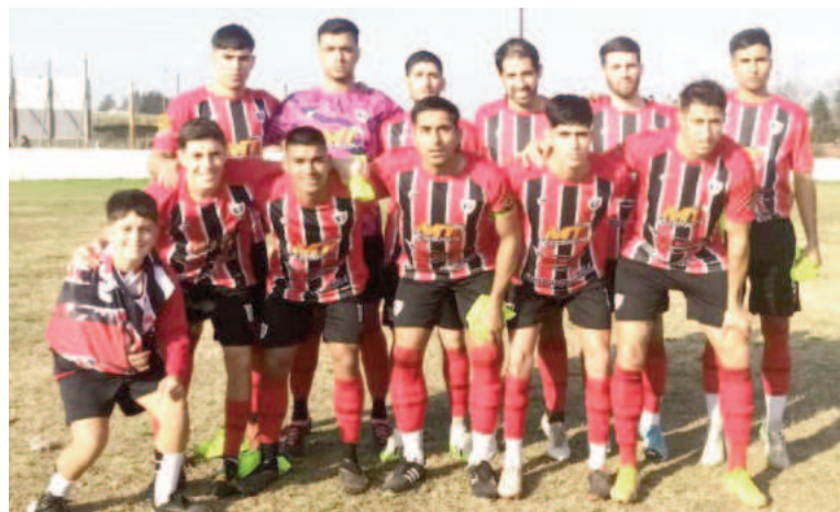
El Chacarero no dejó dudas y se transformó en el único puntero. GERMÁN MUNIZAGA

El campeón defensor llegó por primera vez a lo más alto en este Apertura "Manuel Santos 'Pirruco' Podestá". Aprovechando otros resultados, General Rojo hizo lo suyo