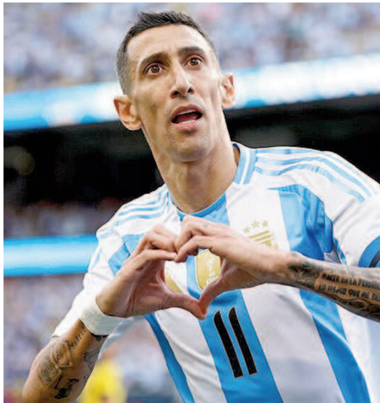
Di María, puro corazón y talento para el gol argentino

A partir de ahí, y a caballo de alguna pincelada de Kendry Páez, la presión y el temperamento del propio Caicedo -que ligó la primera amarilla por barrer de atrás a Lautaro-, Ecuador fue adelantándose unos metros y llegó a incomodar un poco a los argentinos, porque el tridente ofensivo Di María-Martínez-Álvarez no lograba conectarse, Acuña (que probó de lejos un par de veces sin suerte) y Montiel no terminaban de prosperar por sus laterales, Lo Celso estaba muy contenido y De Paul servía -como siempre- de rueda de auxilio