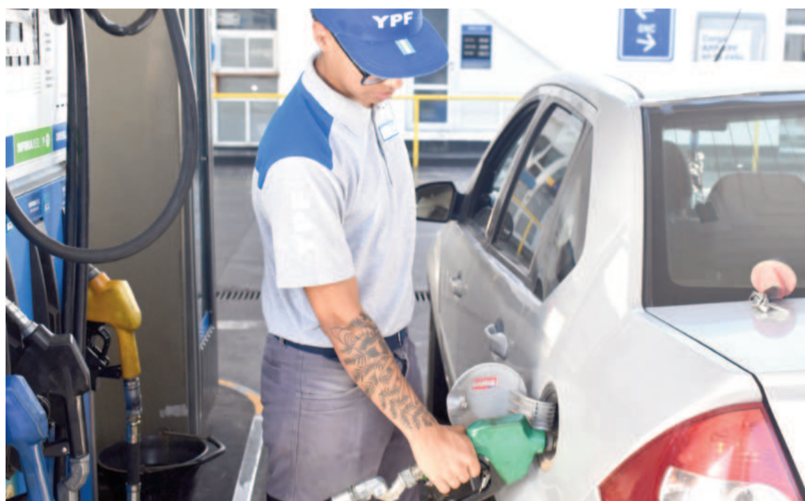
En la nafta Infinia, la diferencia está en el orden del 13%: el litro cuesta $1061 en San Nicolás y $1117 en CABA.

La brecha del 17,24% en la nafta súper es la más profunda en la com-