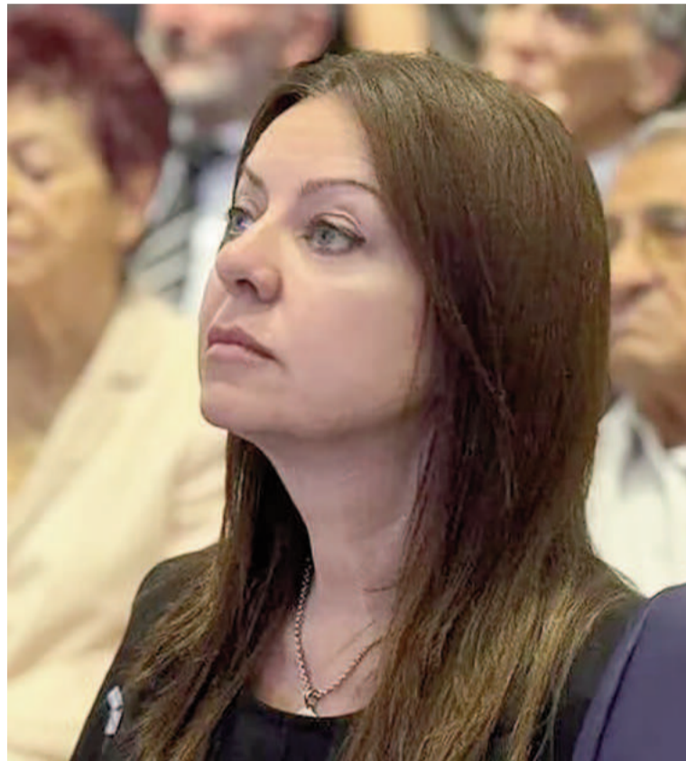
Sandra Pettovello, ministra de Capital Humano, citada por Diputados

en la que se dio media sanción a una nueva fórmula de actualización de las jubilaciones, el diputado del Frente de Izquierda pidió votar la interpelación de la ministra de Capital Humano pero la iniciativa fue rechazada. Además del bloque LLA y del PRO, parte del radicalismo y Hacemos Coalición Federal se abstuvo o votó en contra. La moción sólo obtuvo 120 votos afirmativos y más de