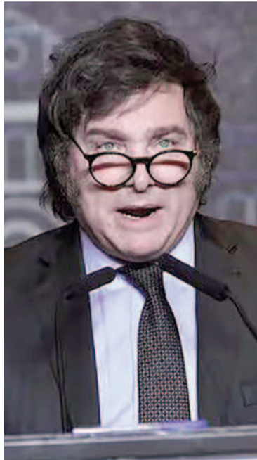
Renuncia a su jubilaci n de privilegio.

no ha sido r ciproca por parte de la mayor a de la dirigencia. Han dilatado el tratamiento de la Ley Bases, han agredido sistem ticamente al gobierno nacional, y todas las semanas proponen una nueva agenda legislativa dedicada a entorpecer el programa econ mico de este gobierno”, agre-