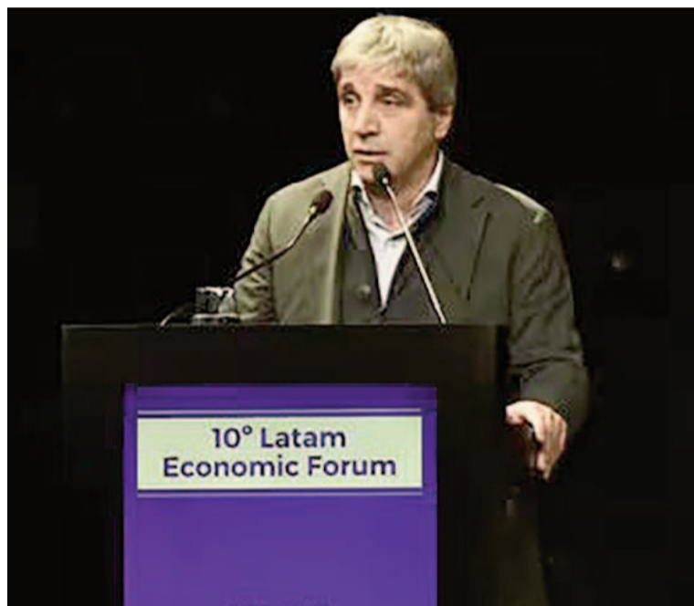
El ministro de Economía, Luis Caputo, abrió el 10° Latam Economic Forum.

Si bien la inflación de Argentina descendió del 25,5 % en diciembre al 8,8 % en abril, el contexto anual continúa en un nivel elevado, ya que hasta el cuarto mes del año se llevaba acumulado un 289,4 % interanual, mientras que la canasta