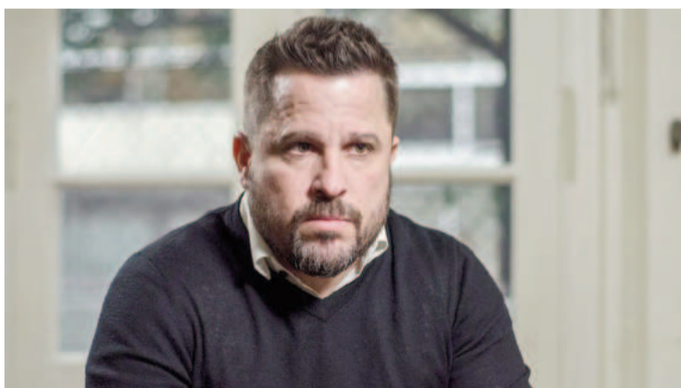
El diputado Tetaz polemiz  en redes respecto del SAC.

El comentario del legislador fue una respuesta al posteo de otro usuario de la red social, el historiador Ezequiel Adamovsky, quien hab an expresado una idea que apuntaba a valorar ese derecho adquirido de los trabajadores. “Este mes, cuando cobre el aguinaldo, record  que no lo ten s porque s . Fue fruto de luchas muy intensas de los trabajadores, as  que la pr xima que te moleste una huelga o una manifestaci n pens  que quiz s est  asegurando derechos para tus hijos. O para vos en el mismo futuro”, escribi  Adamovsky.