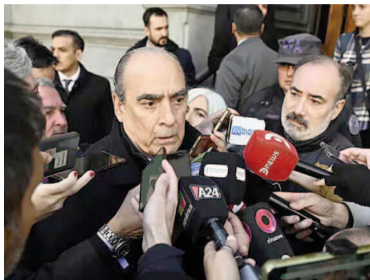
Francos ordenó que continúe la revisión en todas las áreas del Gobierno.

Puntualmente, cada área del Gobierno debe hacer una revisión del personal que tiene a su cargo y acercarle a Francos el listado de aquellos trabajadores a los cuales decidieron que no se les va a renovar el contrato. En este marco, si bien no hay un porcentaje estipulado de la reducción que habrá en cada sector, las autoridades nacionales remarcaron que