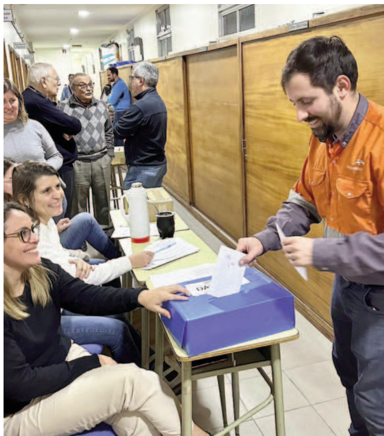
Vista de una de las 12 mesas distribuidas en la Facultad Regional San Nicolás.

“Es un deber, pero fundamentalmente un derecho que tenemos de poder manifestarnos y defender a la Universidad Pública”, comentaron.