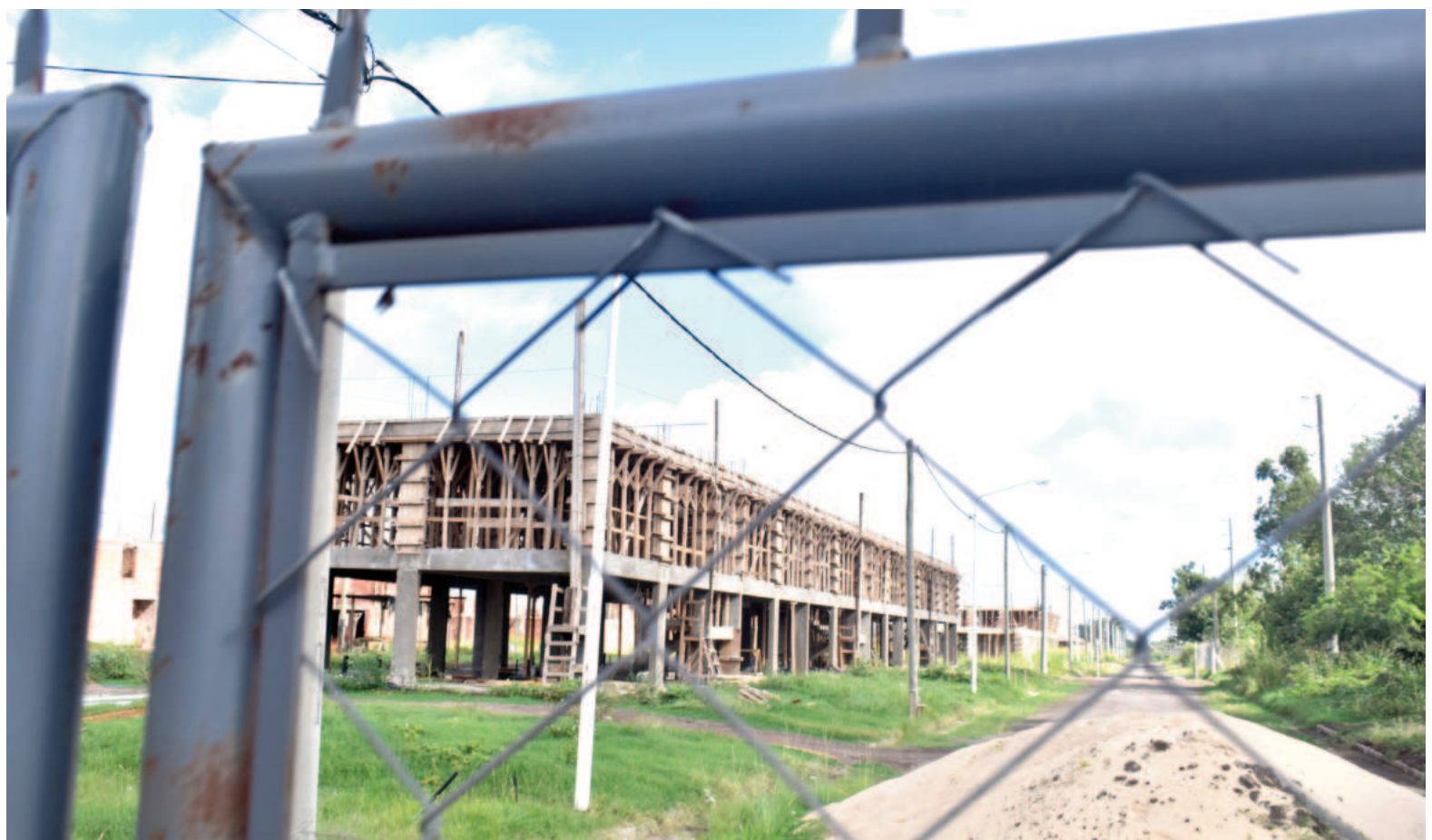
La Cámara Argentina de la Construcción advirtió que la deuda del Gobierno con las empresas asciende a $55.000 millones.

En cuanto al despido de operarios, UOCRA San Nicolás había advertido que en las obras a cargo de ambas empresas llegaron a ocuparse unos 120 obreros. Más aún, de acuerdo con lo anunciado oficialmente por el Gobierno anterior los puestos de