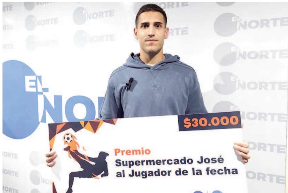
El defensor de Regatas pasó por la redacción y se llevó el premio de Supermercado José. EL NORTE

Respecto a la victoria ante Defe, el defensor señaló: “Fue un triunfo clave, porque sabíamos que teníamos que sumar de a tres ya que este fin de semana quedamos libre.