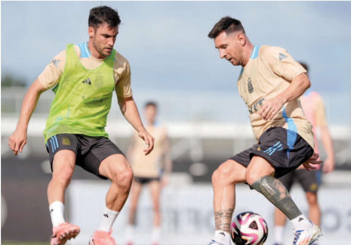
La Selección argentina continúa con su preparación para la cita continental. NA

Los dos ex River no estuvieron ayer en el entrenamiento a puertas cerradas que realizó el equipo que dirige Lionel Scaloni en el predio de Inter Miami, con vistas a la Copa América.