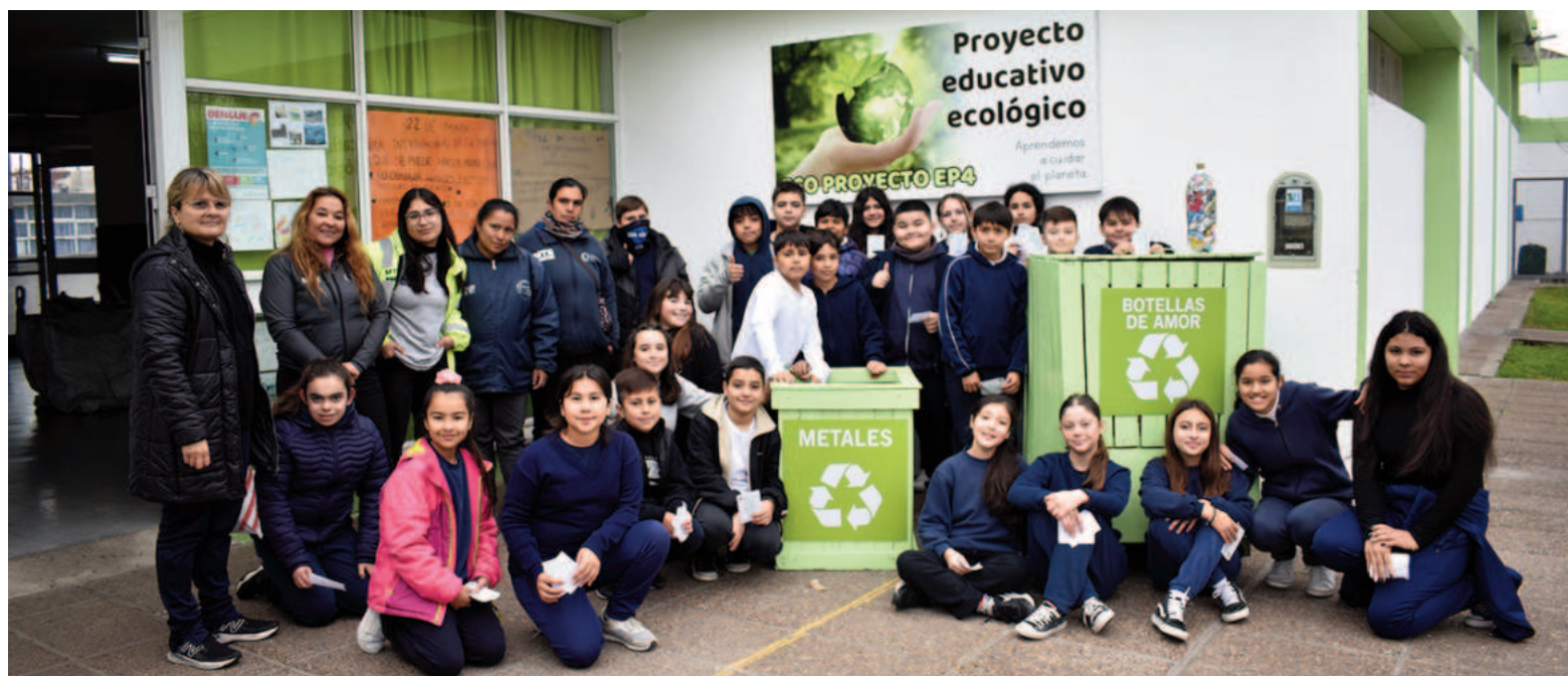
La Escuela Primaria N° 4 junto a Ternium realizaron una colecta de residuos reciclables denominada “Mejor en lata”.

“Hoy recibimos en la puerta de la escuela diferentes residuos, incorporando una nueva propuesta que se llama ‘mejor en lata’. Es importante saber la cantidad de veces que se pueden reutilizar hasta convertirse