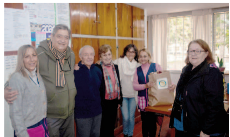
Parte de la comisión durante la entrega en la Escuela Mariano Moreno.

Fueron más de 200 pares de medias, además de diversos tejidos que fueron donados a dos escuelas de Villa Constitución. La campaña continuará durante todo junio.