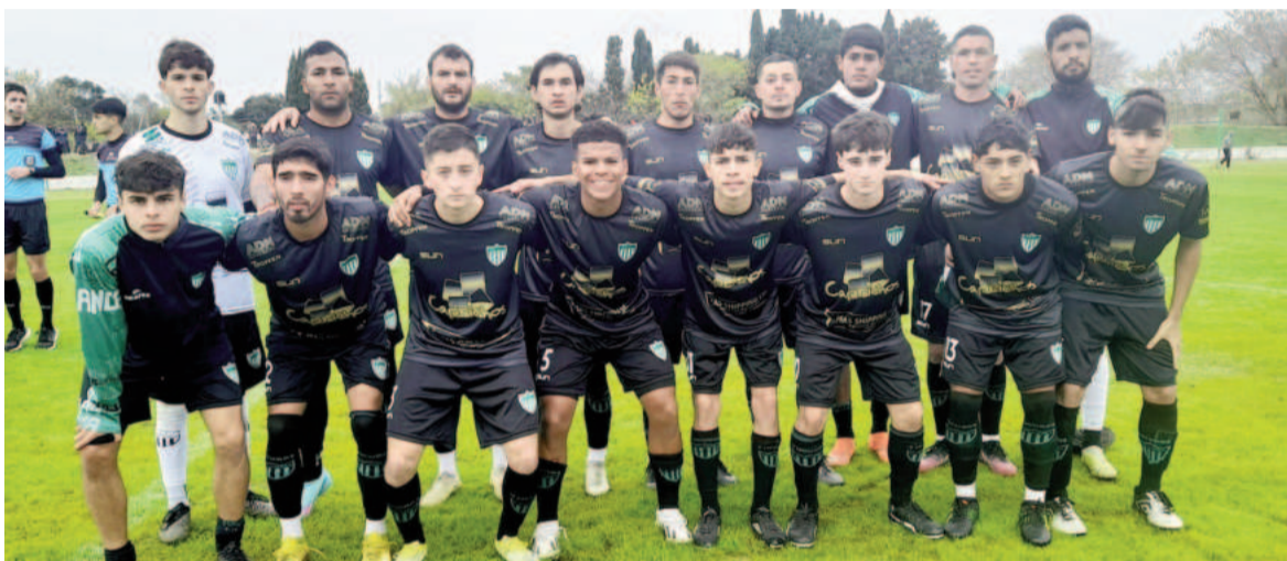
El Tucura fue superior y consiguió un triunfo que lo mantiene con chances.

creando situaciones de riesgo, ante un rival voluntarioso pero con limitaciones y poca capacidad ofensiva. Otra vez Amarillo, de lo mejor junto a Pittaluga, y Bocanera estuvieron cerca de gritar el tercero.