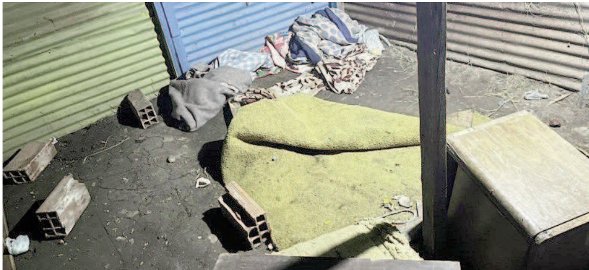
El adolescente estuvo cautivo en este lugar durante varias jornadas.

"Tiene una historia de vida durísima, es conocido por la Secretaría de Derechos de Niñez de años, no está escolarizado hace muchísimo tiempo, vivía prácticamente en la calle y subsistía como podía. Desde el viernes que la madre no sabía dónde estaba", señaló y advirtió: "La situación es comprometida no solo desde el punto de vista médico, sino personal, porque estuvo retenido aparentemente por gente relacionada