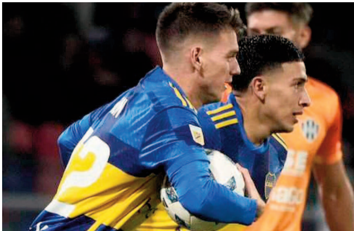
Boca irá por un triunfo ante el Calamar en rodeo ajeno.