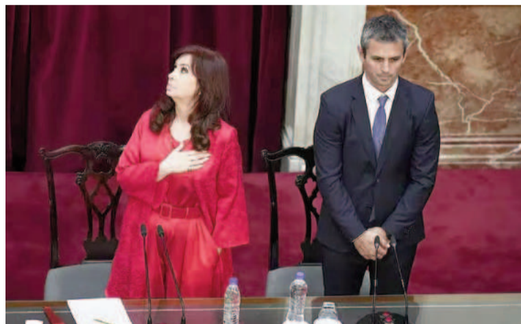
La vicepresidenta y el actual titular de la Cámara de Diputados.

“Si este gobierno hubiese continuado con el ritmo y el calendario