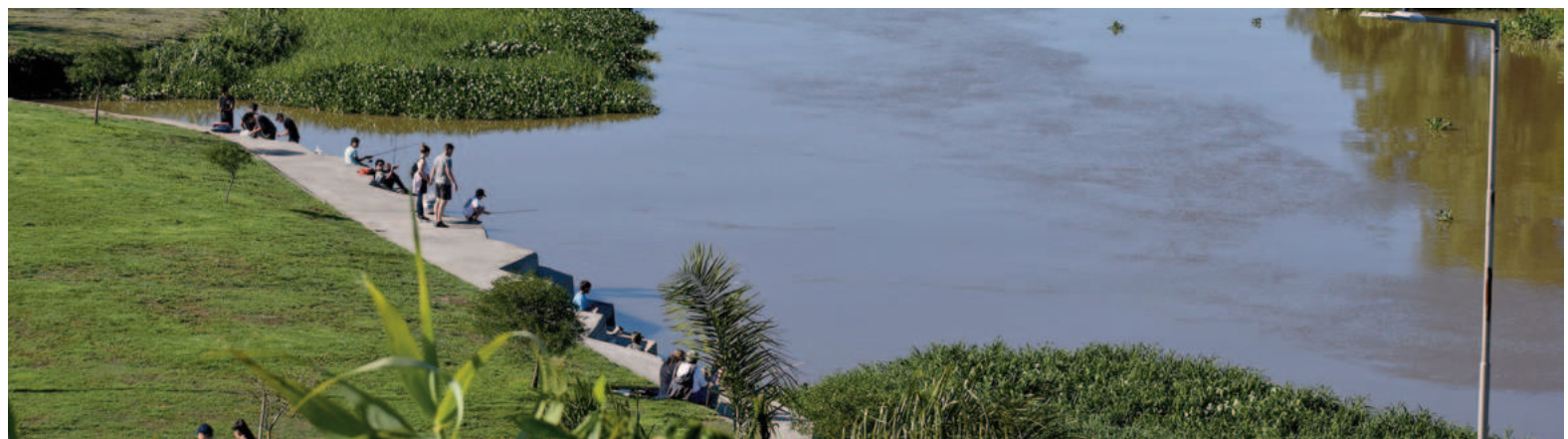
El último informe del INA reveló que los niveles del río Paraná se encuentran en el rango de aguas medias bajas en gradual descenso.

Conforme al pronóstico de precipitación elaborado por la Dirección de Meteorología e Hidrología (DMH-DINAC, PY), en la porción paraguaya de la cuenca del Paraná de aporte a Yacyretá se prevé probabilidad de ocu-