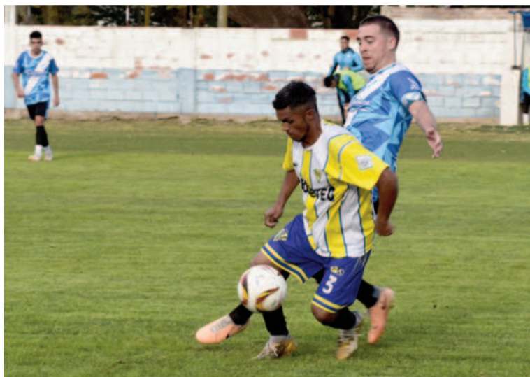
Doce intentará ratificar su buen momento para afirmarse en lo más alto.

Gral. Rojo (19) chocará ante Argentino Oeste (9) en el "Héctor Ramos". El Chacarero además de clasificar para la Liguilla pretende ser primero para tener ventaja deportiva en los cruces. Hoy se alistará así: Maldonado; Galván, Ricardo Sabedra, Len-