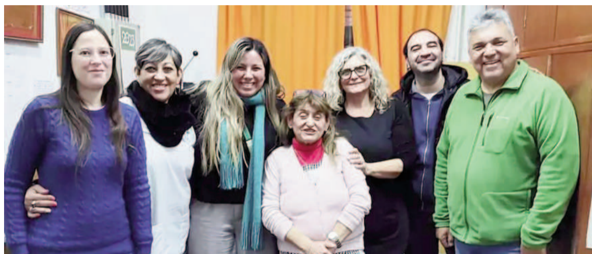
Organizadores de las ferias junto a la directora de Cultura.