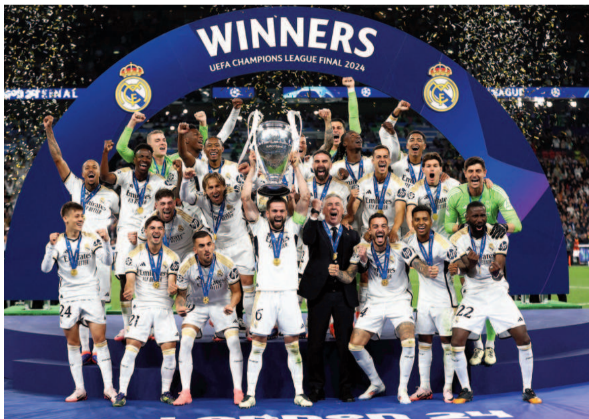
Una imagen repetida: Real Madrid, en lo más alto del fútbol europeo.

Pero con el correr de los minutos, Borussia Dortmund logró romper la paridad en cuanto al juego y acechó al Real Madrid, que tuvo que depender de la destaca labor de su arquero Thibaut Courtois, quien le ahogó el grito de gol a Karim Adeyemi y luego a Marcel Sahitzer. Igualmente, el ar-