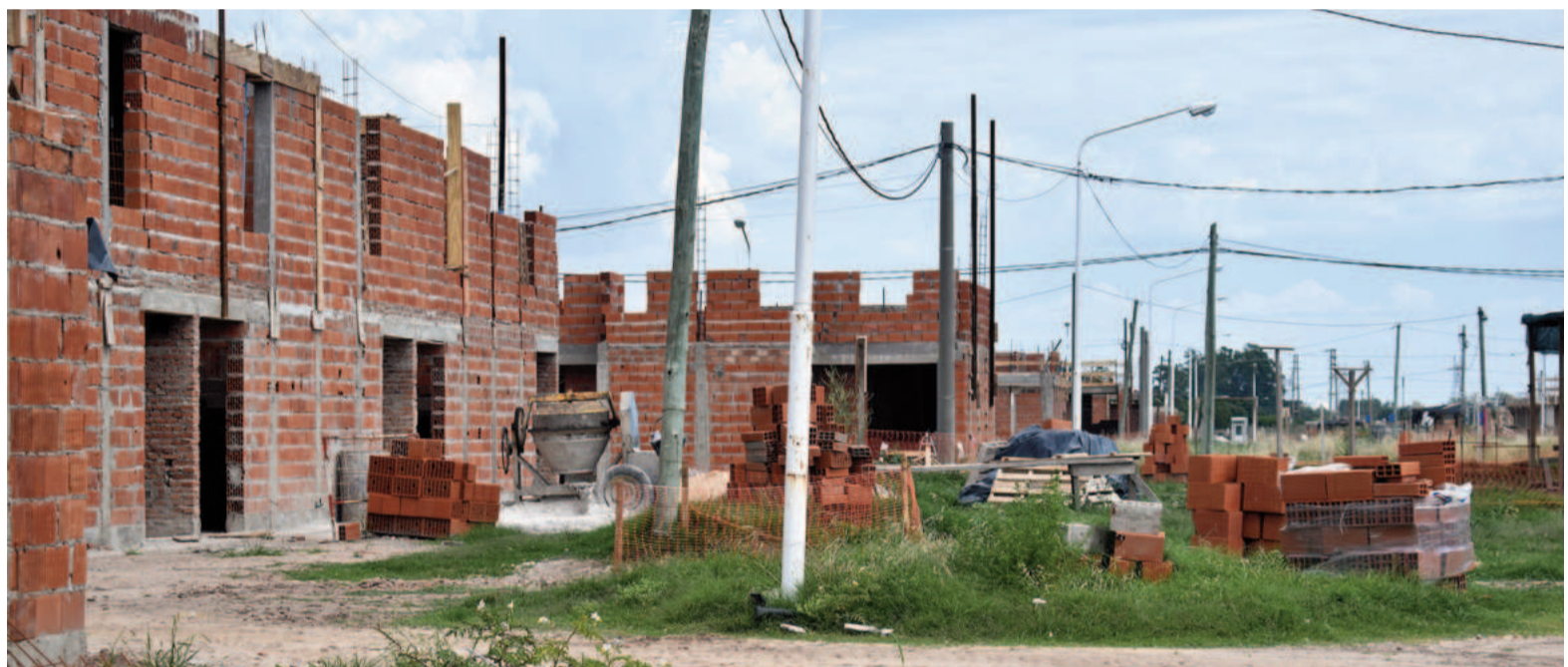
La decisión de las actuales autoridades nacionales de frenar la obra pública derivó en la paralización de los trabajos, a mediados de enero de 2024.