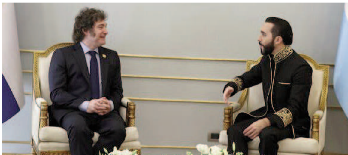
El presidente argentino Javier Milei tuvo una charla íntima con su par de El Salvador.

to?", fue la pregunta de Milei a Bukele.