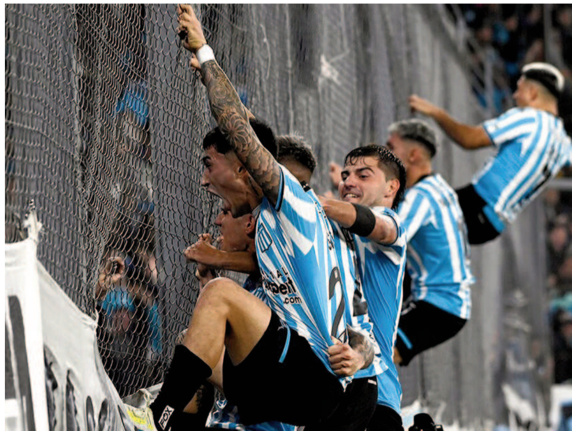
El equipo de Gustavo Costas consiguió una sufrida victoria como local. WEB

En el estadio Juan Domingo Perón de Avellaneda, la "Academia" le ganó al "Malevo" con gol de Santiago Solari en tiempo adicional 1 a 0 y por ahora es único líder con diez puntos.