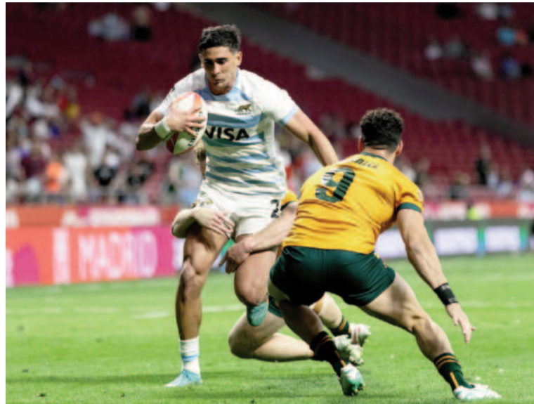
Los Pumas mantienen su gran nivel en España.

"Estoy muy contento. El objetivo era clasificar a las semis y lo logramos. El grupo fue muy difícil,