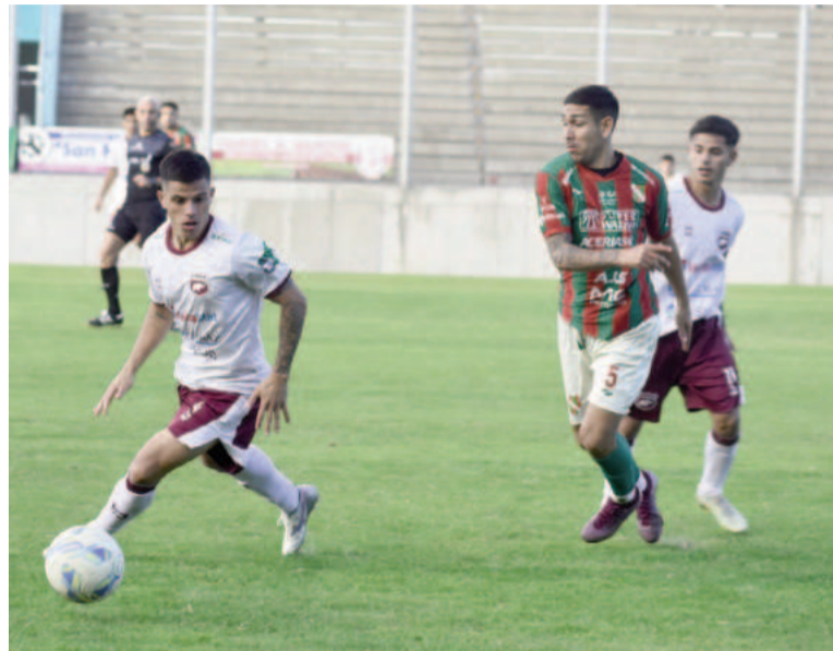
El Granate viene de empatar ante Las Parejas en San Nicolás.