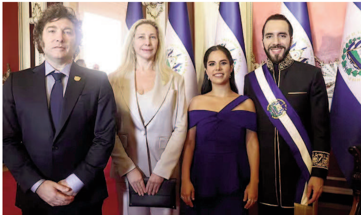
Javier y Karina Milei en El Salvador junto a Nayib Bukele y su esposa.

A lo largo de la jornada, el mandatario argentino se encontró con los diferentes líderes internacionales que asistieron a la juramentación. Entre ellos el rey de España, con quien tuvo un breve gesto de cordialidad en medio de la crisis diplomática con el país, que se desencadenó a partir de una pelea con su par Pedro Sánchez. A pesar de la tensión, el monarca hizo un contacto visual con Milei antes de sentarse y, al verse, ambos se sonrieron y sa-